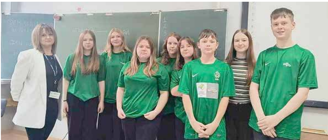
W trakcie zajęć uczestnicy dowiedzieli się w jaki sposób należy reagować, gdy są świadkami przemocy

W ramach obchodów Dnia Bez Przemocy przedstawicielka Komendy Powiatowej Policji w Goleniowie odwiedziła uczniów ze Szkoły Podstawowej w Osinie, by wspólnie porozmawiać o znaczeniu szacunku, empatii i przeciwdziałaniu przemocy w każdej formie. Spotkanie było nie tylko okazją do przekazania ważnych treści, ale także do budowania zaufania i wzajemnego zrozumienia między młodzieżą, a służbami mundurowymi.