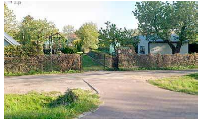
Wjazd na teren ogrodów działkowych przy ul. 3 Maja. To tu dokonano szeregu kradzieży z włamaniem

Okres świąteczno-noworoczny to czas wzmożonej aktywności zorganizowanych grup złodziei. Jak dowiaduje się w tych dniach redakcja DN, do takich niepokojących zdarzeń doszło jeszcze przed świętami Bożego Narodzenia na terenie ogrodów działkowych przy ul. 3 Maja.