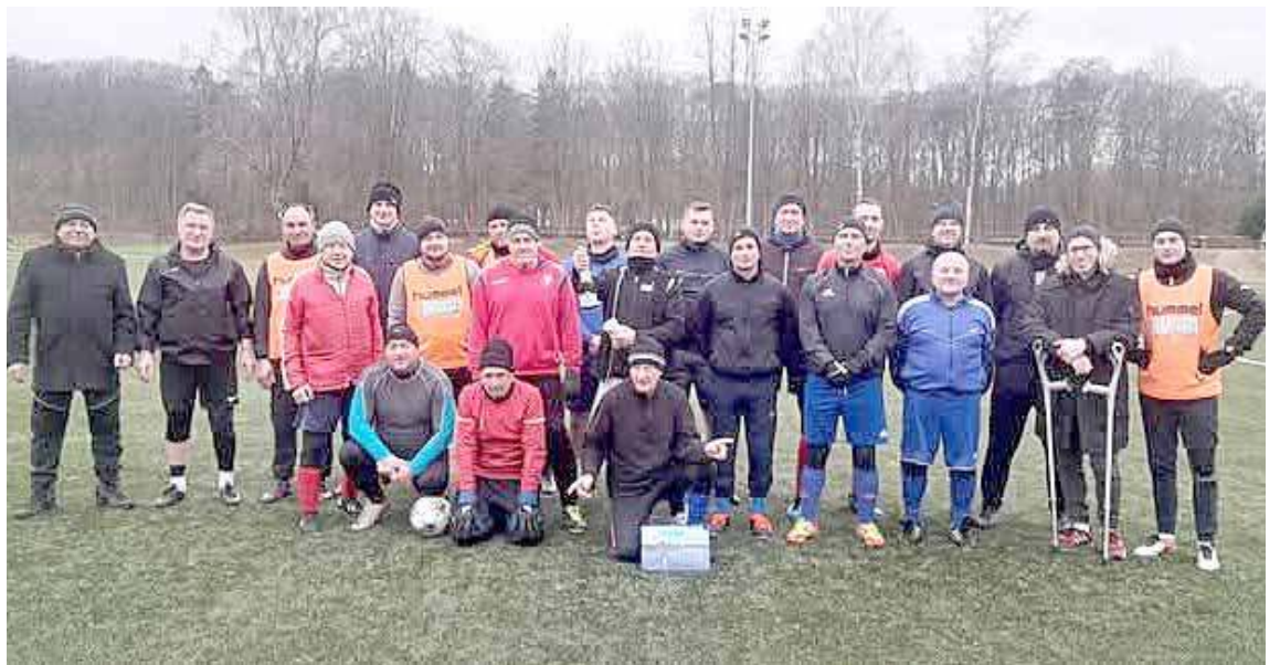
W przerwie meczu wykonano m.in. pamiątkowe zdjęcie