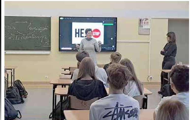
Zajęcia nt. rozpoznawania hejtu i zagrożeń związanych z cyberprzemocą odbyły się w SP nr 1

Podczas spotkania przedstawicielka KPP w Goleniowie poruszyła wiele istotnych tematów związanych z przeciwdziałaniem przemocy, zarówno fizycznej, jak i psychicznej. Uczniowie dowiedzieli się, jak rozpoznawać sytuacje, które mogą przerodzić się w konflikt oraz jak reagować, gdy są świadkami przemocy. W trakcie spotkania młodzież zachęcana była do wzajemnego szacunku i zrozumienia, pokazując przy tym, że relacje oparte