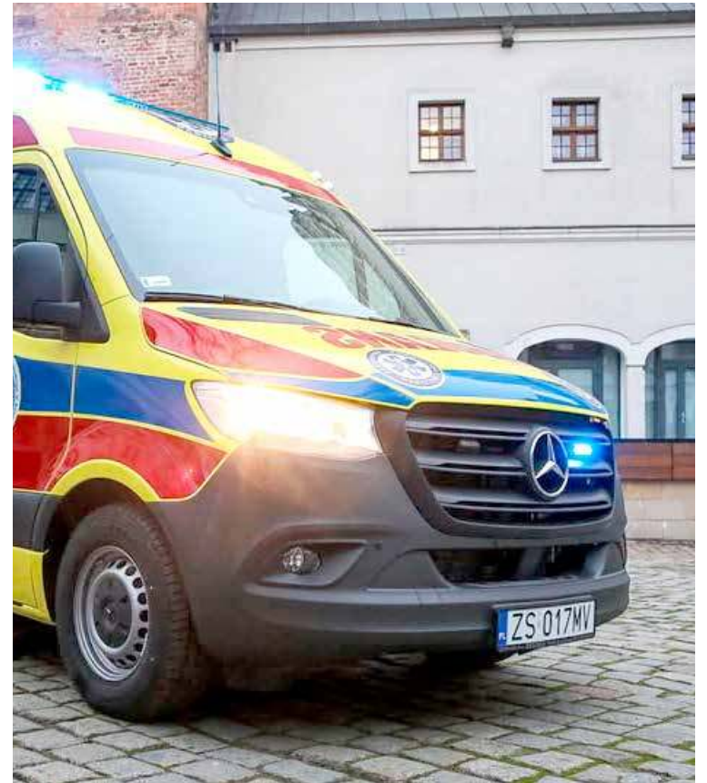
W samym tylko Nowogardzie ZRM musiały interweniować pięciokrotnie

Kilka zgłoszeń dotyczyło osób, które zraniły się podczas wybuchu fajerwerków. Takie wezwania zanotowano między innymi w Kołobrzegu, gdzie poszkodowany osiemnastolatek doznał urazu ręki, z kolei w Barninie mężczyzna lat 48, pod-