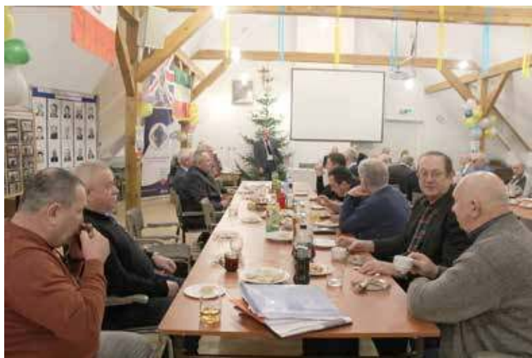
Otwarcie spotkania i wspólny posiłek