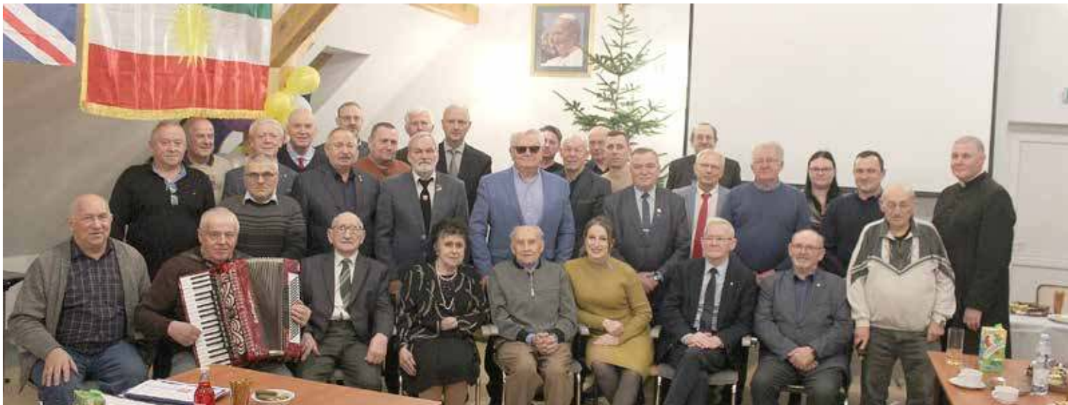
Wspólne zdjęcie uczestników wydarzenia