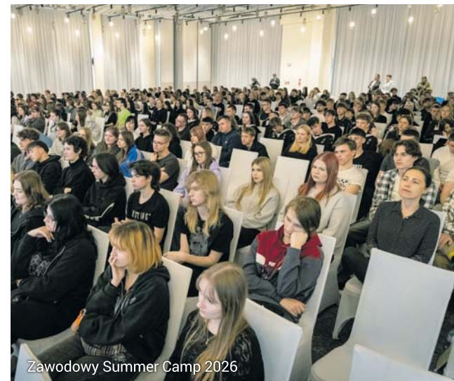
Zawodowy Summer Camp 2026

Z video relacjami i zdjęciami z wydarzeń można zapoznać się na stronie internetowej