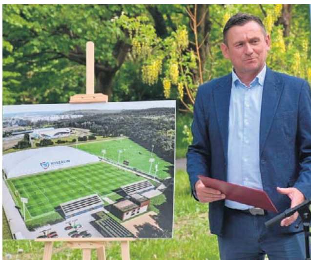
- W ciągu dwóch lat w pobliżu Parku Wodnego wybudowane zostanie zupełnie nowe boisko - mówi wczoraj Tomasz Sobieraj, prezydent Koszalina

- Pieniądze mamy już zabezpieczone w budżecie, więc wkrótce ogłaszamy przetarg - zapowiedział prezydent Koszalina Tomasz Sobieraj. Przypomniał, że o PCT mówi się w mieście już od kilku lat, była nawet wielka konferencja, na której zapowiedziano budowę, ale wymagało to jeszcze sporo czasu, zanim ostatecznie miasto pieniądze dostało. I to na razie na wspomniany pierwszy etap. W kolejnych, w zależności od tego o ile pieniędzy i z jakich projektów będzie można się ubiegać, mają jeszcze powstać boisko pod dachem, boiska typu orlik, całe zaplecze. - Na wszystko potrzeba dziś około 35 milionów złotych - poinformował prezydent.