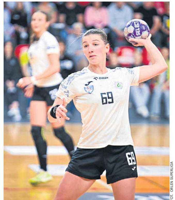
Szcypiornistki z Koszalina sezon 2025/26 zakończą w piątek w Piotrkowie. Pewnie będą na 6. miejscu

- W przyszłym tygodniu planowane jest spotkanie, podczas którego zapadną ostateczne decyzje dotyczące dalszych działań związanych z funkcjonowaniem piłki ręcznej kobiet w Koszalinie - poinformowała „Głos” Anna Makarewicz, rzecznik prasowy Koszalina. ©