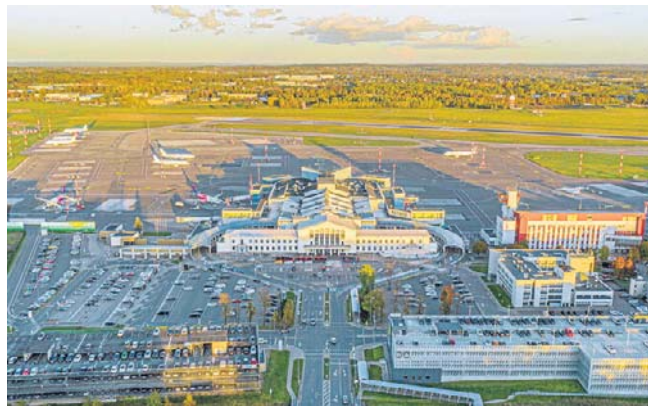
Największy port lotniczy Litwy został zamknięty po ogłoszeniu alarmu z powodu zagrożenia z powietrza

We wtorek, 19 maja, dron, prawdopodobnie ukraiński, został zestrzelony nad terytorium Estonii. Inny bezałogowiec wtargnął w przestrzeń powietrzną Łotwy. PAP