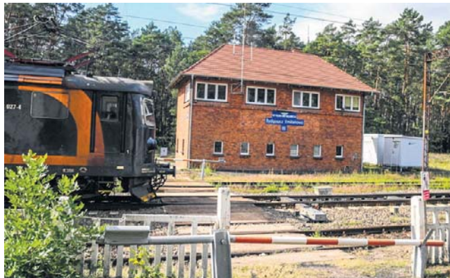
O Emilianowie od ponad pół roku mówi się w kontekście budowy nowej fabryki amunicji

- Wśród rozważanych lokalizacji znajduje się rejon Emilia-