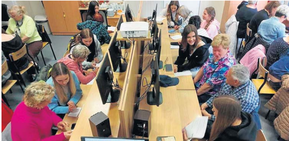
W czasie zajęć przy seniorach są licealiści, którzy pomagają odnaleźć się w cyfrowej rzeczywistości. Tematy są różne i wynikają z tego, jaki jest stan wiedzy seniorów.