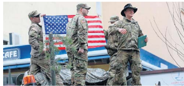
USA redukują obecność wojskową w Europie

„Departament zmniejszył łączną liczbę Brygadowych Zespołów Bojowych (BCT) przydzielonych do Europy z czterech do trzech. To przywróciło liczbę BCT w Europie do po-