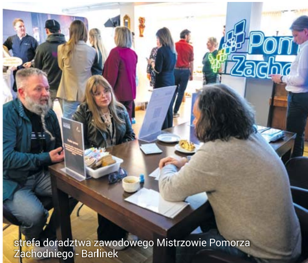
strefa doradztwa zawodowego Mistrzowie Pomorza Zachodniego - Barlinek

Takie połączenie energii młodych i doświadczenia hotelarzy oraz gastronomików zdało egzamin. Młodzież zaskakiwała znajomością internetowych trendów, a hotelarze i restauratorzy zrozumieli potrzeby i sposób patrzenia na świat pokolenia „Alfa”.