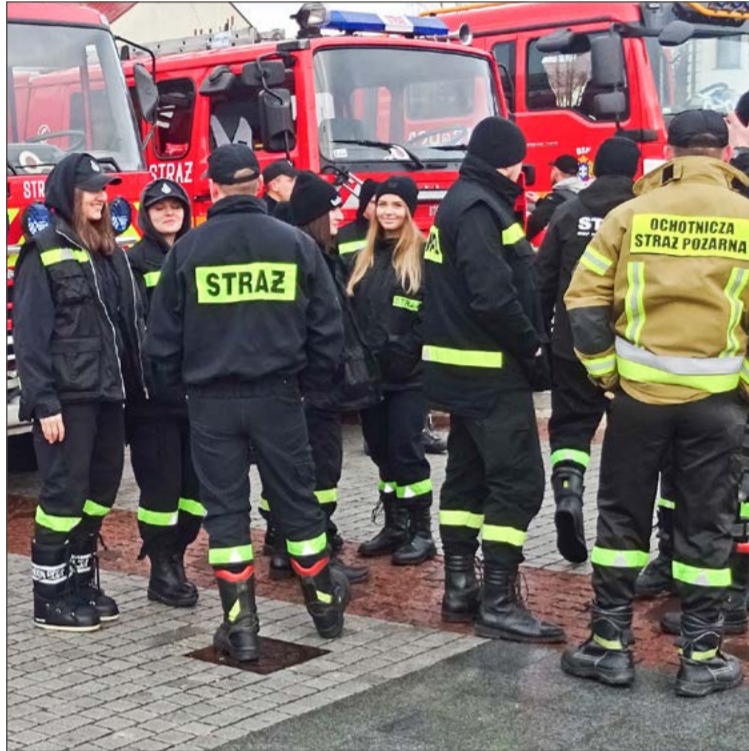
Strażaków OSP spotkać można na wielu gminnych imprezach.

- To jest może naiwne, ale ja mam taką wizję strażaka społecznika. Tutaj tak to padło, że no jak mu nie zapłacimy, to on tego nie zrobi. Sam będąc w stowarzyszeniach, czy w zarządach klubów sportowych grosza nie wzięłem. Nie było dla mnie problemem w niedzielę, czy w sobotę, bo to jest moja pasja. Ja to lubię. Mi za to nie płacili - przekonywał.