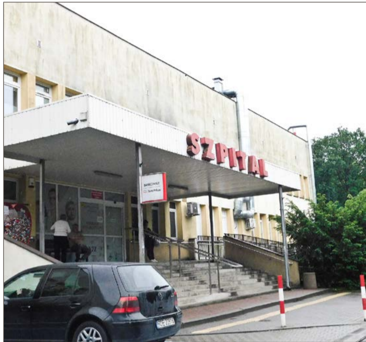
Czy szpital w Dębicy pozostanie powiatowym? Ważą się jego losy.

Są oburzeni faktem, że planów konsolidacji nikt z nimi nie kon-