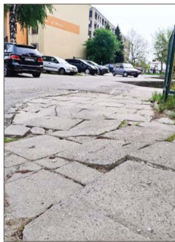
Tak wygląda chodnik obok bloku przy ul. Witosa 2.

Prezes zapewnia, że to własność miasta i to do niego należy remont. Szybko wyjaśnia jednak, że tak właśnie będzie. Twierdzi, że ma zapewnienia urzędników, jak i lokalnych radnych, że tak odcinek drogi od skrzyżowania z ul. Piłsudskiego do skrzyżowania z drogą prowa-