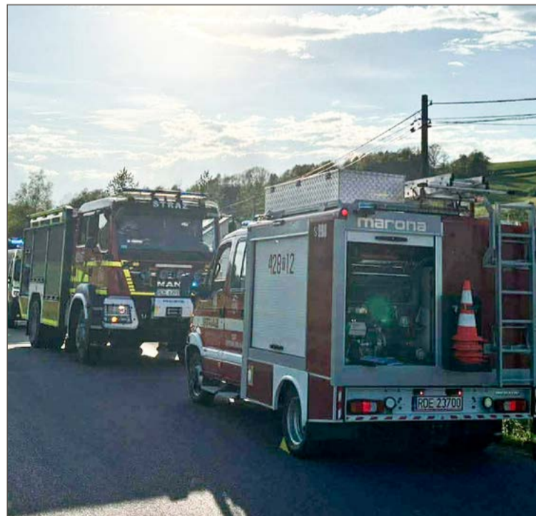
Jako pierwsi pomocy poszkodowanemu udzielili strażacy.

Na szczęście dla kierującego nim seniora pojazd go nie przygniótł. Wtedy zdarzenie mogłoby mieć dużo tragiczniejszy finał. Mimo wszystko załoga pogotowia ratunkowego podjęła decyzję o przewiezieniu go do szpitala w Jaśle, gdzie został przyjęty w stan chorych.