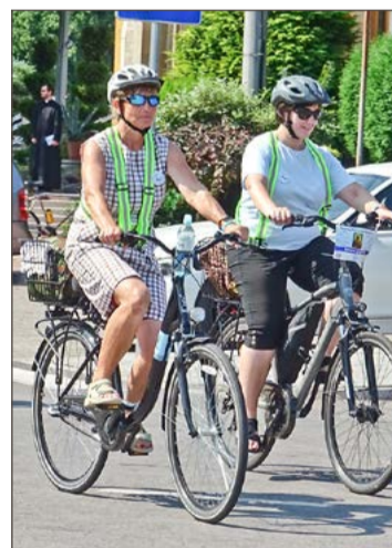
Uczestnicy do pokonania będą mieli ponad 250 kilometrów.

Organizatorzy proszą, by zapisywać się pojedynczo, nawet jeśli