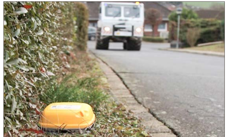
Na terenach, gdzie poszukiwane są złoża montowane są niewielkie żółte czujniki o wymiarach 10x10 cm.