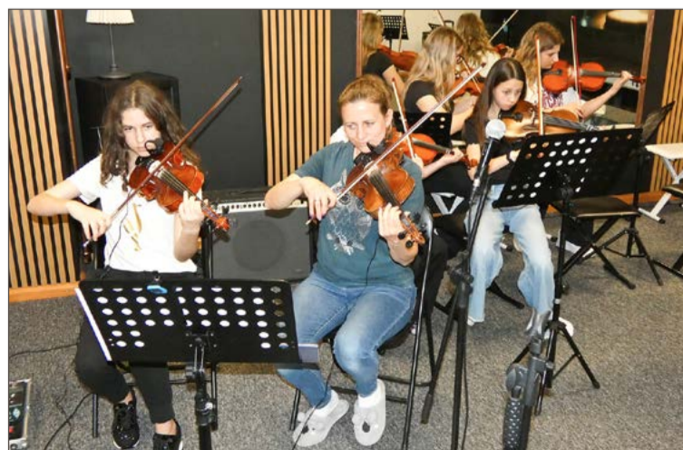
Próby przed koncertem odbywają się regularnie w KIK Muzie.