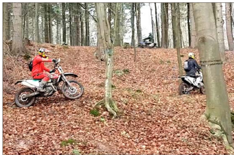
Taki widok w lesie to złamanie przepisów i szansa na mandat.

Jest finał tej sprawy. W Sądzie Rejonowym w Dębicy zapadł najpierw wyrok nakazowy, od którego oskarżony i jego obrońca się odwołali. Ostatecznie, już przed są-