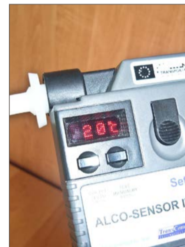
Rowerzyści muszą się liczyć z możliwością kontroli trzeźwości.

Ale to nie wszyscy rowerzyści zatrzymani pod wpływem alkoholu w ostatni weekend. W Bobrowej mieszkaniec gminy Żyraków wydmuchał 0,27 promila. Z uwagi na niewielkie stężenie alkoholu 63-latek dostał mandat w wysokości 1000 zł.