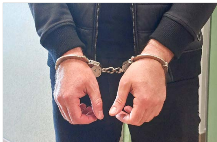
Mężczyzna noc spędził w policyjnej izbie zatrzymań.