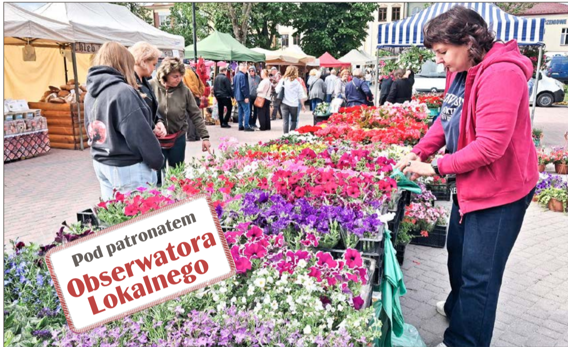
Na Rynku nie zabrakło kwiatów, prelekcji i warsztatów. Kolejne takie wydarzenie za rok.

Przez cały czas, kiedy jedni poszukiwali pięknych roślin, inni gromadzili się przed muszlą koncertową, by podziwiać występy