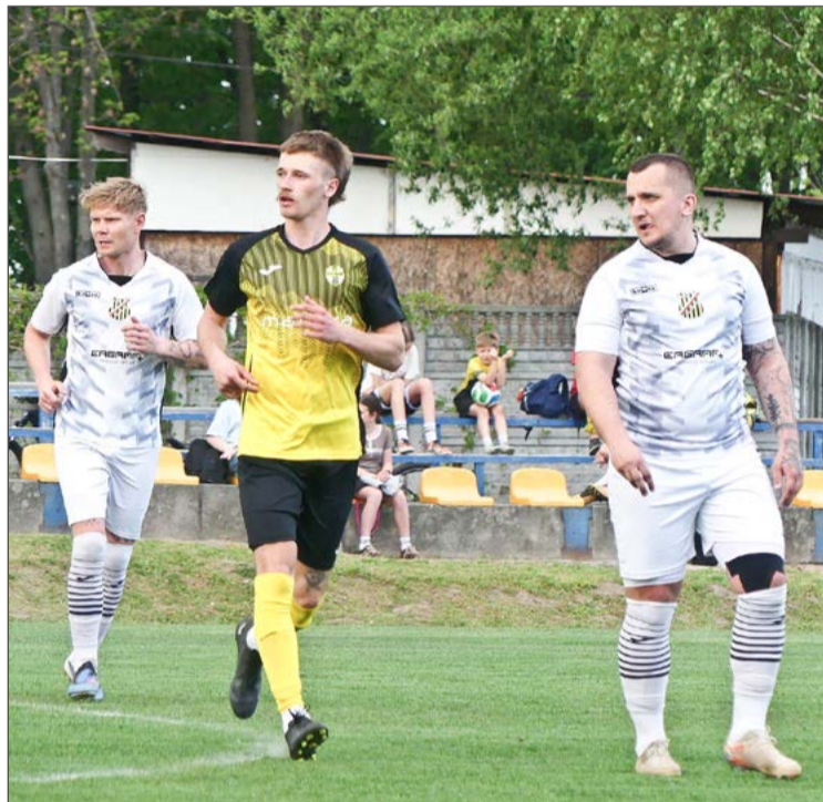
W środę Żyraków (jasne stroje) przegrał u siebie z Pustkowem.

Lechia Sędziszów Małopolski – Stal II Mielec (13 maja)