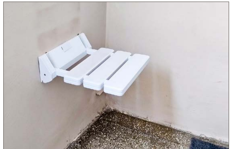
Krzeselka montowane są zazwyczaj między drugim i trzecim piętrzem.

To zresztą nie jedyne udogodnienia, które SM przy Kolejowej stara się w ostatnim czasie zapewnić mieszkańcom. Przy ul. Łysogórskiej kolejne dwa bloki (nr 14 i 19)