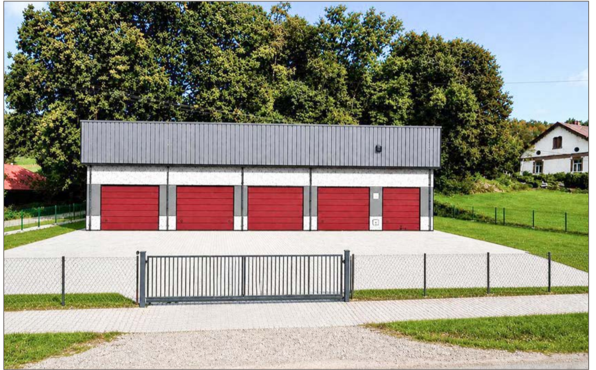
Tak ma wyglądać magazyn, który wybudowany zostanie w Siedliskach-Bogusz, tuż przy starej plebanii.

Jak mówi wójt Jan Janiga obiekt powstanie na działce tuż obok budynku weterynarii. Będzie to parterowa hala o konstrukcji stalowej, a powierzchnia zabudowy wynosząca będzie blisko 240 m 2 . Hala o wysokości ponad 4 metrów pozwoli na swobodne magazynowanie wielkogabarytowego sprzętu ratowniczego i zapasów na wypadek sytuacji kryzysowych. Obiekt zostanie wykonany z nowoczesnych płyt warstwowych z rdzeniem PIR (wysoka izolacyjność termiczna) oraz wyposażony w wzmocnioną posadzkę przemysłową o dużej nośności. Projekt kładzie szczególny nacisk na brak barier architektonicznych, zapewniając pełny dostęp osobom ze szczególnymi potrzebami. Magazyn będzie pełnił funkcję cen-