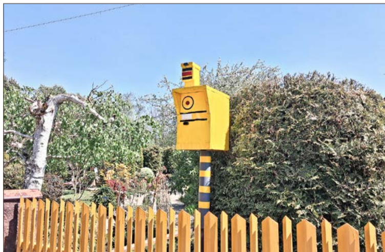
Na kierowców spoza Pilzna fotoradary działają.