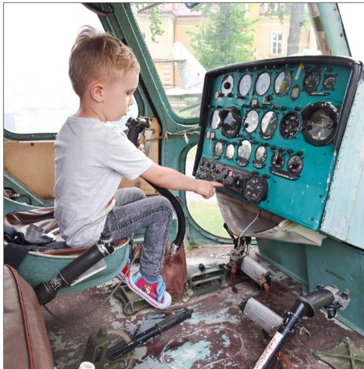
W piątek w dębickim muzeum do części pojazdów będzie można wejść.

Na godz. 19:30 organizatorzy zapraszają na występ Grupy Te-