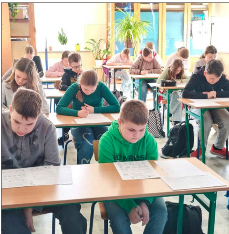
Uczniowie SP nr 6 w Dębicy mogą mieć powody do zadowolenia.

Wyniki pozostałych naszych LO: 607.(29) III LO Dębica - 41,887,