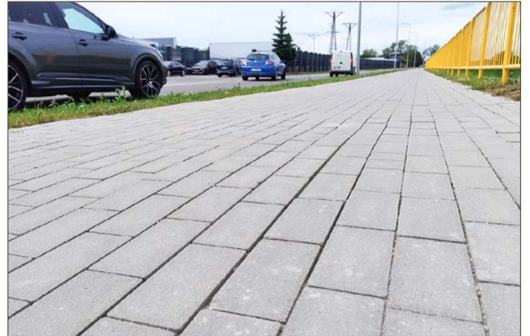
Według dyrektora kostka leży na podstawie cementowo-piaskowej.

Na szczęście, jak zaznacza, inwestycja jest jeszcze na gwarancji, więc