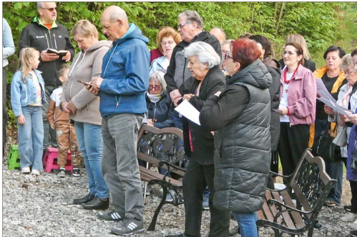
Przy kapliczce w Latoszynie-Zdroju czciciele Matki Bożej gromadzić się będą także w kolejne majowe piątki.

Co więcej, kiedy po odśpiewaniu Litanii Loretańskiej i kilku pieśni maryjnych, panie z KGW myślały już zakończyć spotkanie przy kapliczce, większość zaprotestowała i chciała śpiewać kolejne. No i okazało się, że całe nabożeństwo trwało blisko godzinę. A na koniec wszyscy zażądali następnego.