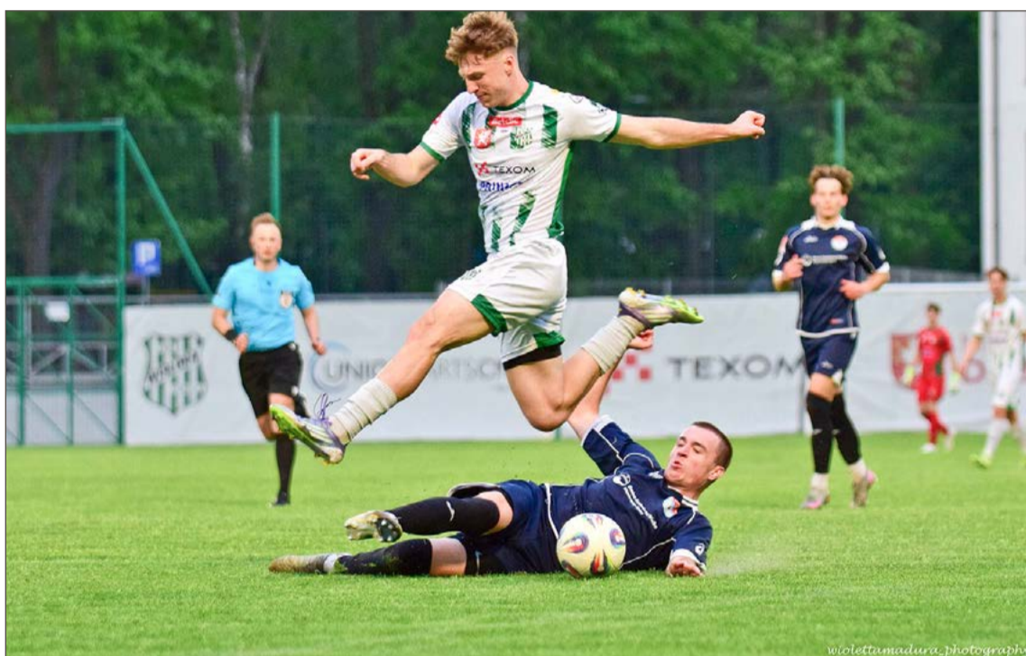
Wisłoka (biało-zielone stroje) pewnie pokonała na Parkowej ekipę z Kazimierzy Wielkiej.