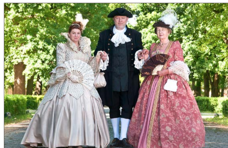
Podczas spotkania tańca uczyć będą Damy i Huzary.