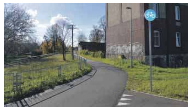
Droga rowerowa biegnąca przy torach wąskotorówki będzie miała ciąg dalszy