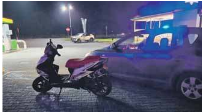
Gdy mężczyźni zaparkowali na stacji benzynowej, policjanci rozpoczęli kontrolę

Jednośladem kierował 25-latek z Nakła Śląskiego,