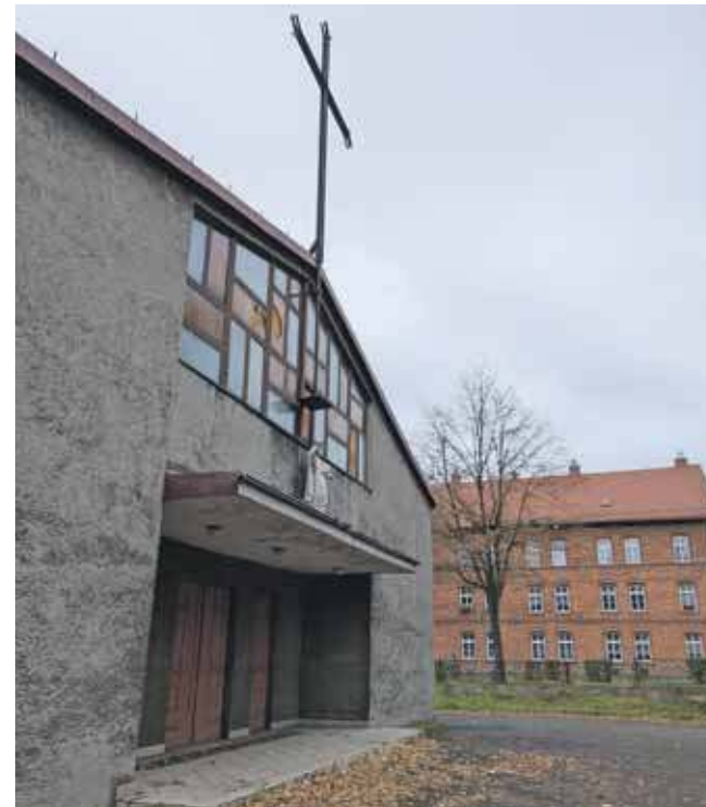
Radzionków przejmie działkę, na której stoi budynek dawnego kościoła

W 1934 roku w Rojcy wznesiono tymczasowy, drewniany kościół Wniebowzięcia Najświętszej Maryi Panny. Parafię erygowano 20 grudnia 1957 roku. Zezwolenie na budowę większego, muranego kościoła uzyska-