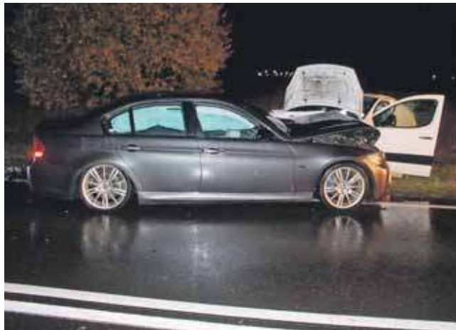
Sprawca wypadku był pijany

Sprawcę wypadku czeka sprawa w sądzie, grozi mu do 3 lat więzienia i przepadek bmw. (ESP)