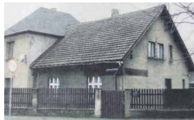
O sprawie domu w Lasowicach pisaliśmy już w 2016 r.