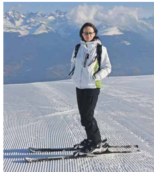
Narty to jedna ze sportowych pasji naszej rozmówczyni

Jednym z plusów pracy na etacie jest możliwość takiego zaplanowania obowiązków, że starcza czasu na realiza-