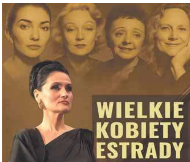
CK „Karolinka” zaprasza na koncert „wielkie kobiety estrady”