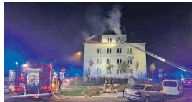
Pożar wybuchł w budynku u zbiegu ulic Odrodzenia i Strzeleckiej w Tarnowskich Górach