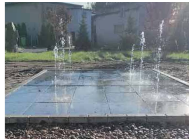
Plac Pamięci w Mikołesce zyskał kolejną atrakcję – fontannę