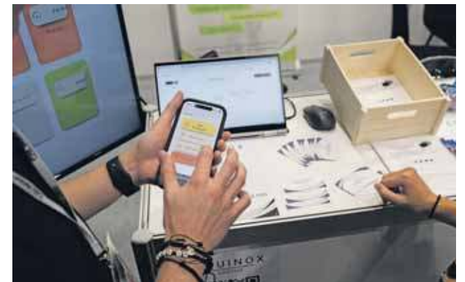
W Equinox System chodzi przede wszystkim o przekazywanie poleceń i informacji opiekunowi koni lub stajennemu

W stworzeniu systemu pomogły jeździeckie doświad-