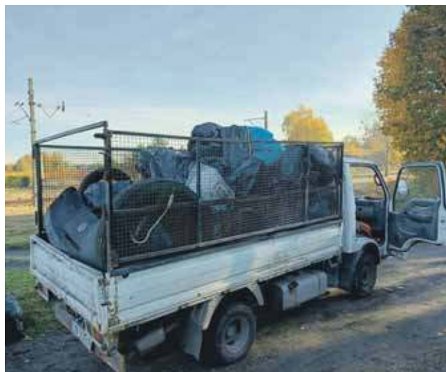
Tyle śmieci zebrano w rejonie ul. Kasztanowej, Klonowej i Łowieckiej w Tarnowskich Górach

Nasz rozmówca podkreśla, że z magistratem współpracuje od dawna i zawsze może liczyć na pomoc w dbaniu o czystość w mieście. Chodzi nie tylko o tego typu inicjatywy sprzątania. Pomagał już na przykład w akcji usuwania porzuconych wraków samochodów. – Wskazywałem straży miejskiej, gdzie są, jak długo