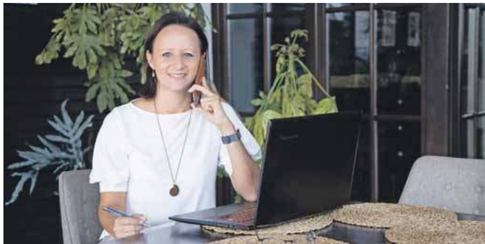
Tarnogórzanka pracuje w domu, choć to nie takie łatwe: wymaga samodyscypliny i nigdy nie wiadomo, kiedy praca się skończy

Okazało się jednak, że warto było przezwyciężyć obawy. Dziś cieszy się, że 10 lat temu podjęła decyzję o prowadzeniu własnego biznesu. Łatwo