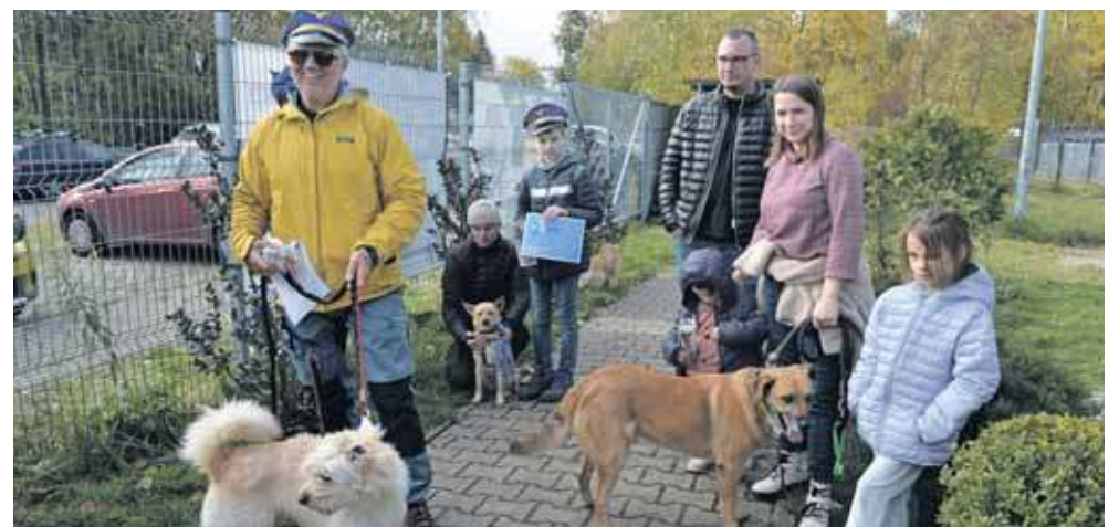
Całe podium zajęły psy rodem z „Cichego Kąta” – dwa są do adopcji, jeden ma już swoją rodzinę