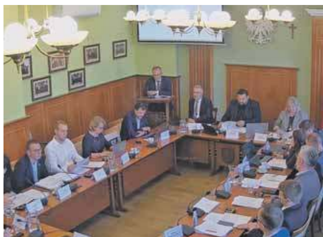
Radni nie zgodzili się na tak dużą podwyżkę

– Zapewne temat wróci w tym roku, ale dziś jest czas na refleksję dla Urzędu Miasta, co zrobić, aby mieszkańcy nie musieli dopłacać. To również moment dla radnych, by zastanowić się, jak