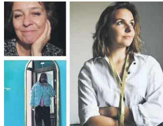
Muzeum zaprasza na spotkanie poświęcone dizajnowi i pozyskiwaniu materiałów