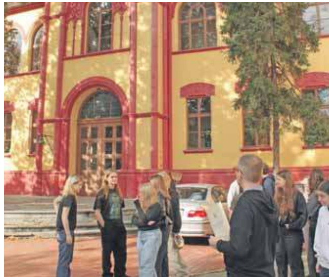
Karlovačka Gimnazija działa w pięknym, serbsko-bizantyjskim gmachu z końca XIX wieku