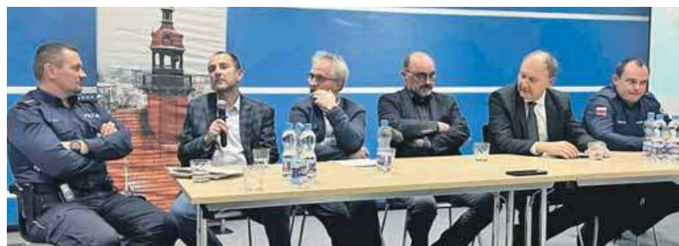
„Złote godziny” w Tarnowskich Górach to od 22 do 23, a kolejne nad ranem

O długofalowych konsekwencjach spożywania trunków najwięcej wiedzą