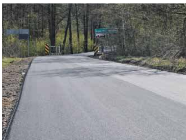
Remonty dróg i chodników – te zadania od lat zgłaszane są w ramach budżetu obywatelskiego

Projekt inwestycyjny pn. „Arcyważny chodnik w Ziemięcicach” – zgłoszony przez