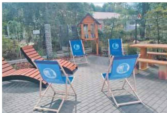
– Tuż przy budynku biblioteki powstało miejsce, które zachęca do kontaktu z literaturą na świeżym powietrzu – informują zbrosławiccy bibliotekarze

Wszystko powstało dzięki wsparciu programu „Wzmocnij swoje otoczenie” Polskich Sieci Elektroenergetycznych. Jego celem jest wspieranie lokalnych społeczności w zakresie rozwoju infrastruktury, bezpieczeństwa i aktywizacji mieszkańców. (ESP)