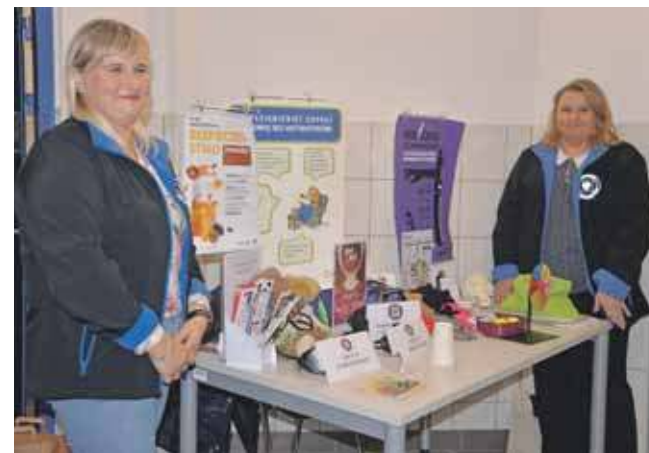
Swoje stoisko miała m.in. Powiatowa Stacja Sanitarno-Epidemiologiczna w Bytomiu

Były również informacje o wszawicy, świerzbie, szczepieniach na grype, szkodliwych zamiennikach tytoniu, można było spróbować, jak różnymi narzędziami skutecznie usuwać kleszcze. Nie zabrakło też stolika z ulotkami ZUS-u.