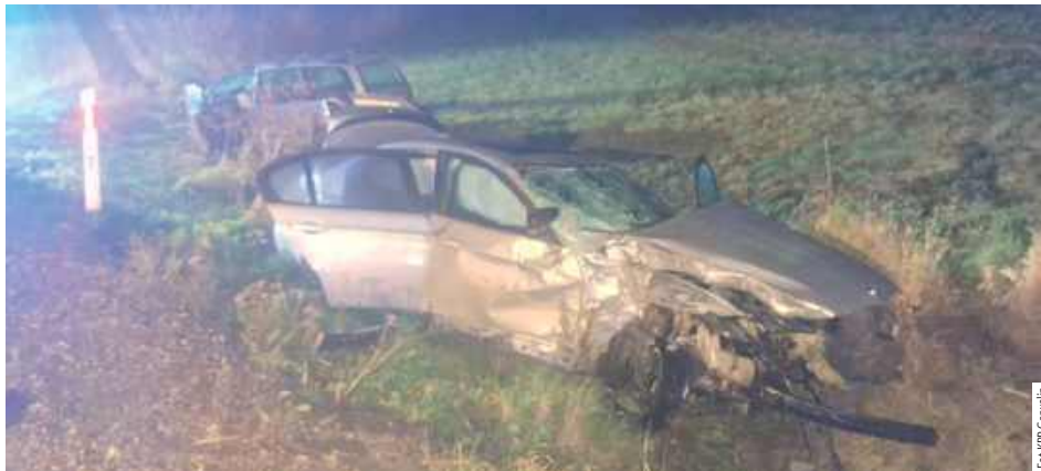
Ze wstępnych ustaleń wynika, że 31-letni kierowca BMW zjechał na przeciwny pas ruchu, gdzie czołowo zderzył się z jadącym z naprzeciwka Fordem

Garwolin: 31-latek został tymczasowo aresztowany na 3 miesiące. Mężczyzna jest podejrzany o to, że w stanie nietrzeźwości oraz w okresie obowiązywania zakazu prowadzenia pojazdów mechanicznych kierował BMW i spowodował wypadek ze skutkiem śmiertelnym.