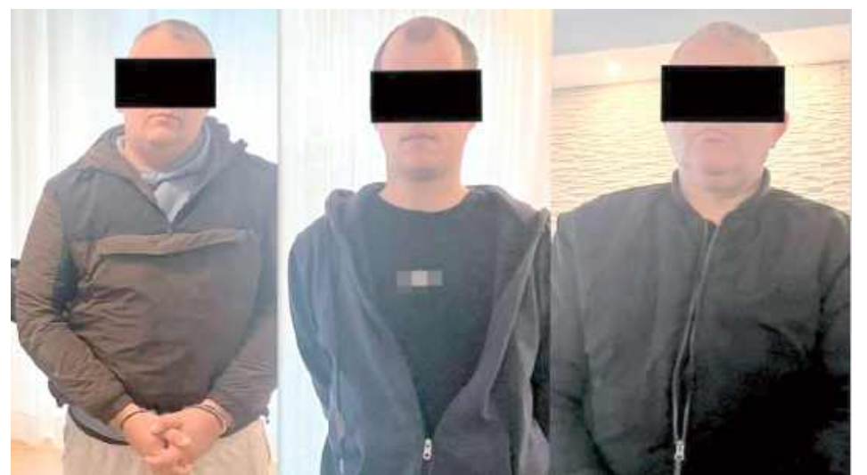
Za kradzież z włamaniem grozi do 10 lat pozbawienia wolności

Pracujący nad sprawą radzyńscy kryminalni ustalili podejrzanych o to przestępstwo. Okazali się nimi 3 mężczyźni w wieku 31, 32 i 55 lat zamieszkujący na terenie Lublina. Wszyscy zostali zatrzymani i trafili do policyjnego aresztu. Okazało się, że skradziony samochód został przez sprawców ukryty na jednym z parkingów w Lublinie oraz posiadał założone tablice rejestracyjne przypisane do innego auta - opisuje komisarz Piotr Mucha z KPP w Radzynie Podlaskim.