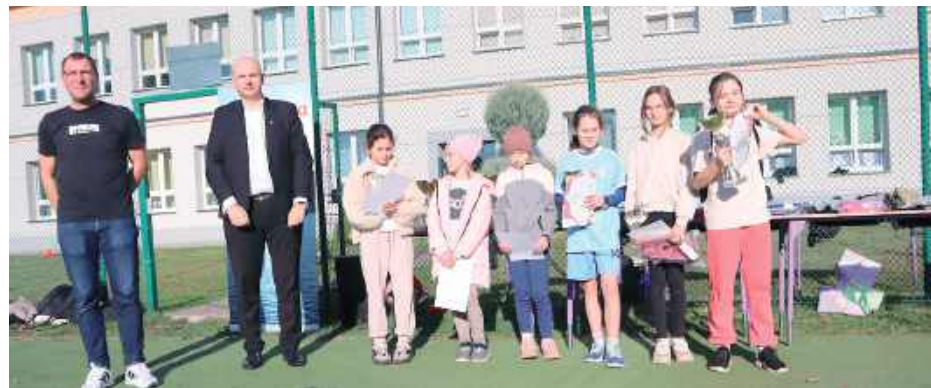
W patriotycznych biegach wzięła udział prawie setka uczniów. Za swoją postawę otrzymali pamiątkowe nagrody, puchary i gorące oklaski

Z okazji Święta Niepodległości w Tchórzewie Kolonii odbyły się Biegi Niepodległości, w których udział wzięli uczniowie z pięciu szkół z terenu gminy Borki. Łącznie na linii startu stanęło 96 zawodników – pełnych sportowego ducha i patriotycznego zaangażowania. Organizatorem wydarzenia była Szkoła Podstawowa w Tchórzewie Kolonii oraz Uczniowski Klub Sportowy „ISKRA”.