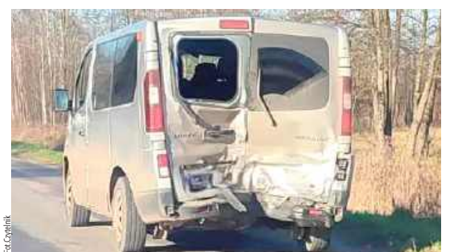
Na szczęście nikt nie odniósł obrażeń. Ucierpiał tylko pojazd