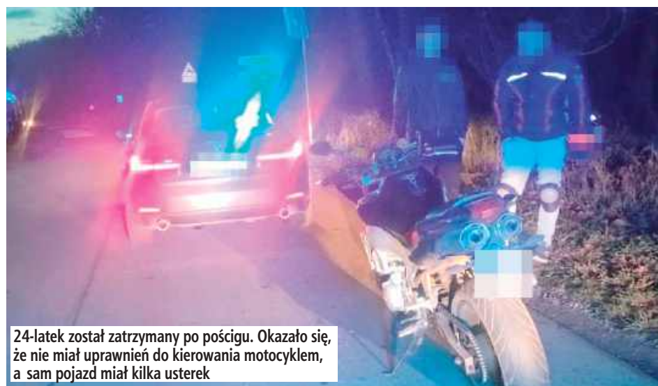
24-latek został zatrzymany po pościgu. Okazało się, że nie miał uprawnień do kierowania motocyklem, a sam pojazd miał kilka usterek

W Górze Puławskiej policjanci z Wydziału Ruchu Drogowego zauważyli motocykl Yamaha, który nie miał prawego lusterka, a kierujący nim mężczyzna przewoził pasażera bez kasku. Mundurowi zaczęli dawać mu znaki świetlne i dźwiękowe, aby zjechał na pobliską stację paliw i zatrzymał się. Ale ten wyjechał ze stacji i zaczął uciekać w kierunku Zwolenia. Mundurowi ruszyli w pościg. Do zatrzymania kierowcy Yamahy doszło w Tomaszowie. Tam okazało się, że uciekinier