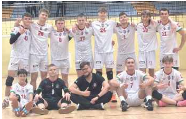
Na razie to juniorzy mają jedno zwycięstwo i jedną porażkę. Ale jak w niedzielę wygrają z Białą Podlaską to, wiadomo, będzie liczyć się podwójnie. Co najmniej