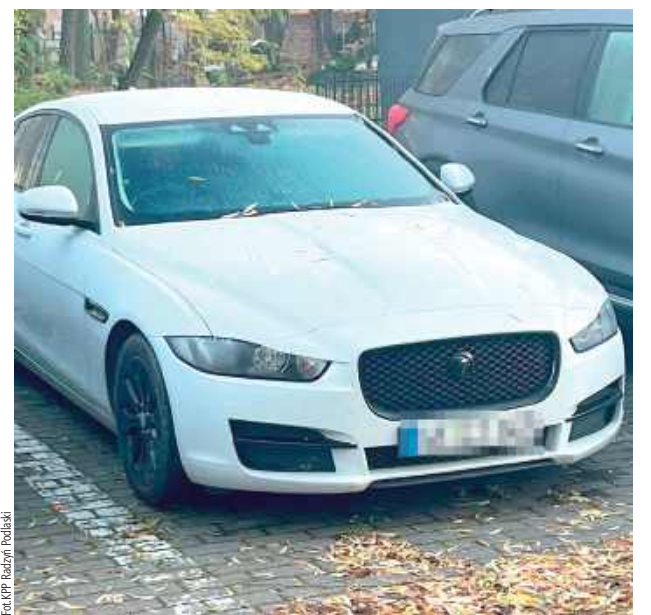
Za kradzież z włamaniem grozi do 10 lat pozbawienia wolności