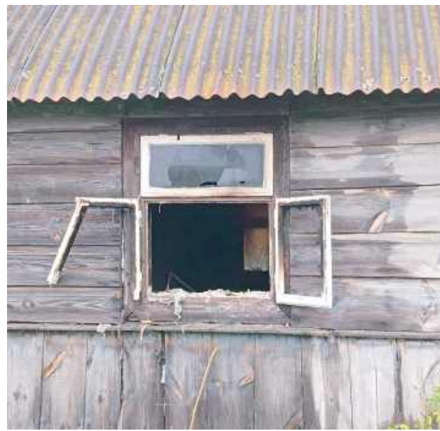
Policjanci wykonali czynności procesowe pod nadzorem prokuratora, decyzją którego ciało kobiety zostało zabezpieczone celem przeprowadzenia sekcji

Z relacji zgłaszającej wynikało, że wewnątrz objętego pożarem pokoju znajduje się seniorka. Sąsiedzi jeszcze przed przyjazdem służb usiłowali wydostać kobietę z budynku. Niestety, z uwagi na duże zadymie-