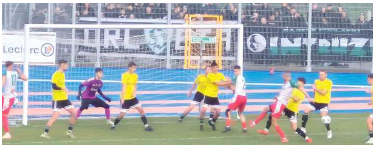
Na największe wyróżnienie zasłużyła zorganizowana grupa kibiców Orleży, która w liczbie około 100 osób dzielnie wspierała piłkarzy na wyjeździe. Brawo

Przez pierwsze trzy minuty piłka niemal bez przerwy znajdowała się na połowie Hetmana, ale kiedy pierwszy raz poleciała pod bramkę Orleży, od razu skończyło się to golem. Obrona gości nie utrudniła życia miejscowym, chwilę wcześniej, zanim futbolówka znalazła się w siatce, poprzed-