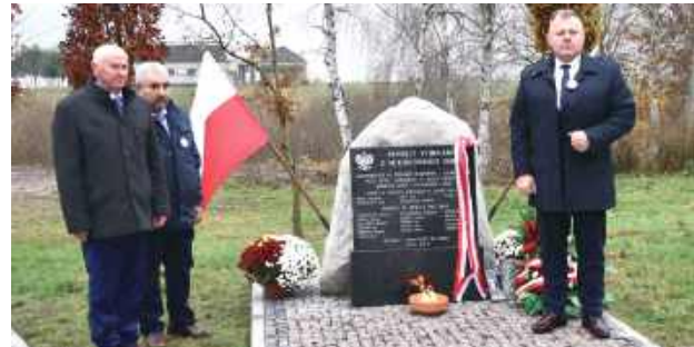
Odsłonięto tablicę pamiątkową poświęconą Zesłańcom Sybiru pochodzącym z tej miejscowości

Uroczystość rozpoczęła się Mszą Świętą w kościele pw. św. Małgorzaty w Ulanie, po której uczestnicy przeszli pod Centrum Społeczno-Kulturalne w Sobolach, gdzie znajduje się nowo odsłonięta tablica.