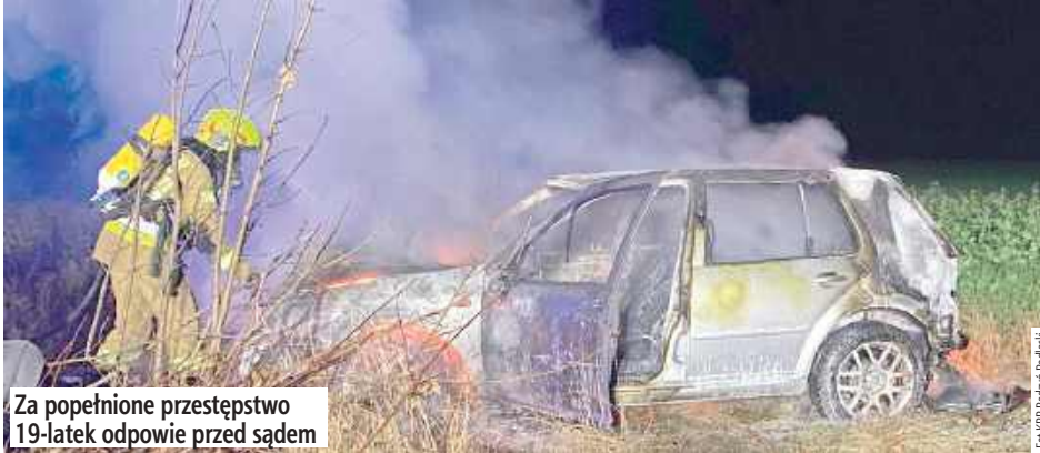
Za popełnione przestępstwo 19-latek odpowie przed sądem

Auto dachowało i zapaliło się. Na miejsce zostali skierowani policjanci radzyńskiej