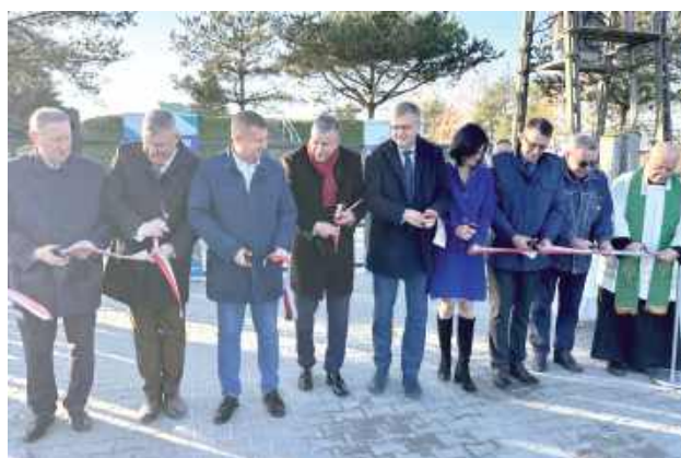
Wydarzenie zgromadziło licznych gości – mieszkańców gminy, przedstawicieli władz samorządowych, wykonawców oraz zaproszonych gości

Wydarzenie zgromadziło licznych gości – mieszkańców gminy, przedstawicieli władz samorządowych, wykonawców oraz zaproszonych gości.