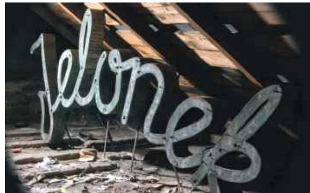
Pamiętaj Państwo ten napis?

Nowo powstały klub ma być miejscem spotkań osób, które kochają kino – zarówno klasykę, jak i współczesne produkcje. Uczestnicy będą mogli wspólnie oglądać filmy, dyskutować