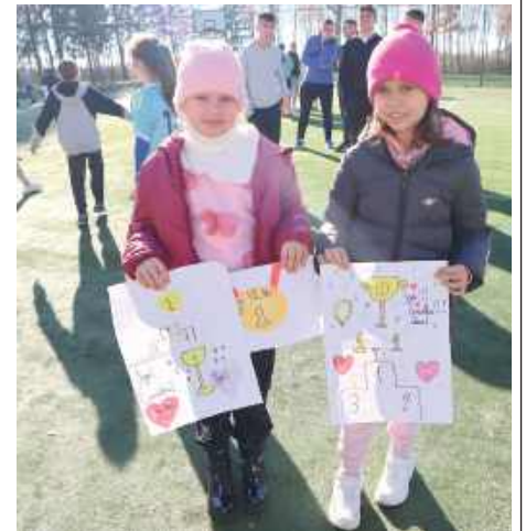
Organizatorzy już teraz zapraszają uczniów do udziału w patriotycznym biegu za rok. Można biegać, malować, dobrze się bawić i spędzić czas na świeżym powietrzu

Po zakończonych biegach na wszystkich czekało ognisko i ciepła herbata, które pozwoliły zregenerować siły i wspólnie