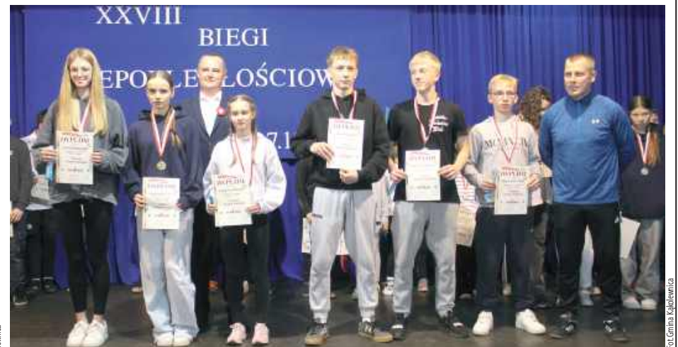
Czołowa trójka w kategorii klas ósmych dziewcząt i chłopców

Organizatorzy dziękują nauczycielom, opiekunom i wszystkim, którzy przyczyni-