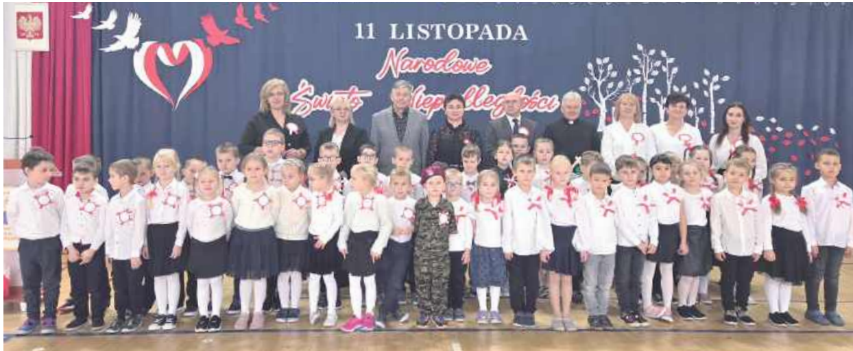
W Szkole Podstawowej w Kąkolewnicy także pamiętano o 107. rocznicy odzyskania niepodległości