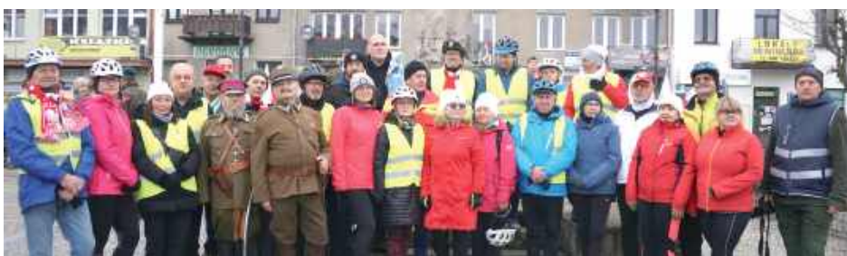
Kawaleria wsparła pododdział na rowerach. Na początku pamiątkowa fotka z dwoma weteranami, którzy chyba wszystkie wojny XX wieku mieli za sobą i w drogę...

Wspólna wyprawa 11 listopada do jednego z miejsc związanych z wydarzeniami z 1918 roku i Józefem Piłsudskim stała się już tradycją radzyńskiego środowiska turystyki rowerowej. Tym razem spod pomnika wyruszyło trzydzieści osób.