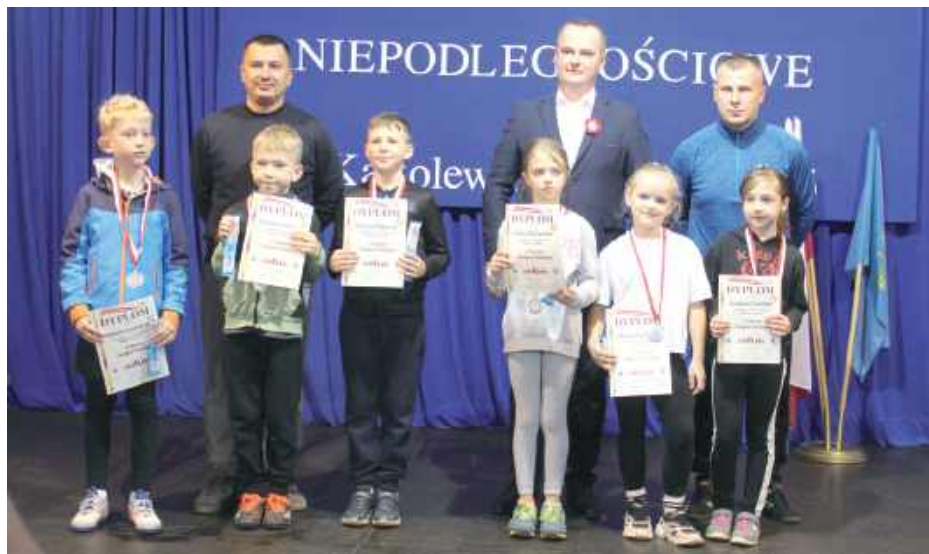
Najlepsi w kategorii klas trzecich

Stadion gminny w Kąkolewnicy po raz kolejny gościł uczniów ze szkół z Gminy Kąkolewnica. To właśnie tam, 7 listopada, odbyła się 28. edycja Biegów Niepodległościowych, zorganizowana z okazji 107. rocznicy odzyskania przez Polskę niepodległości. W zawodach wzięło udział blisko 200 uczniów ze szkół podstawowych z terenu gminy Kąkolewnica.