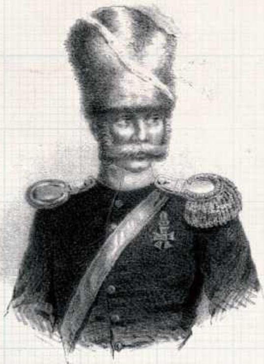
Późny, namalowany 100 lat po śmierci, portret Berka w mundurze kawalerskim

Pewnie była to szybka decyzja podjęta w przededniu konieczności obrony zrewoltowanej Warszawy przed kacapskimi hordami Suworowa. Może i podjęta niedługo potem, kiedy - jak najbardziej słusznie - jego pierwszego patrona