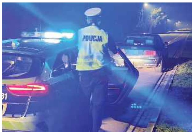
Mężczyzna, który prowadził Audi A8, wzbudził uwagę funkcjonariuszy drogówki, gdyż poruszał się po zmierzchu mając włączone jedynie światła

23-letni mieszkaniec gminy Radzyń Podlaski został zatrzymany przez policję po tym, jak okazało się, że prowadził samochód pod wpływem narkotyków. Do zdarzenia doszło w miniony wtorek, 7 listopada w miejscowości Star Wieś w gminie Borki. Mężczyzna, który prowadził Audi A8, wzbudził uwagę funkcjonariuszy drogówki, gdyż poruszał się po zmierzchu, mając włączone jedynie światła