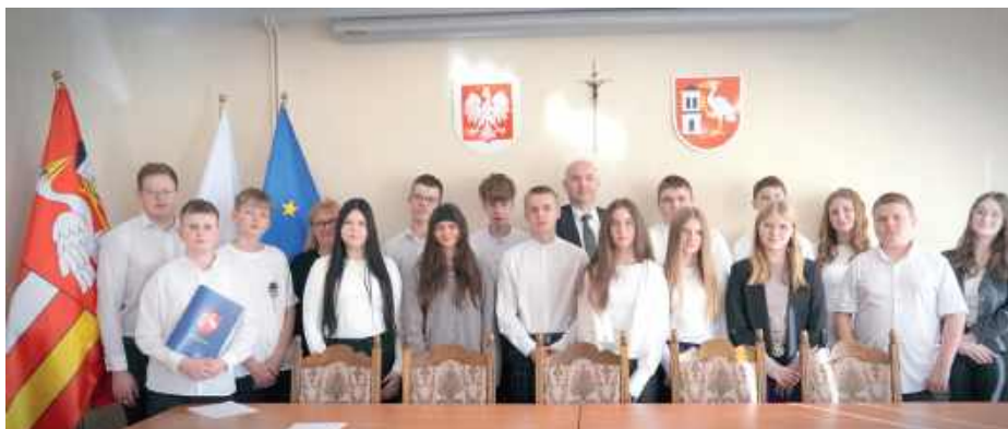
Podczas pierwszej, uroczystej sesji 15 radnych obdarzonych przez swoich kolegów i koleżanki mandatem zaufania złożyło ślubowanie

Młodzi radni zapoznali się ze statutem, swoimi prawami i obowiązkami oraz przyjęli plan pracy Młodzieżowej Rady Gminy Borki.