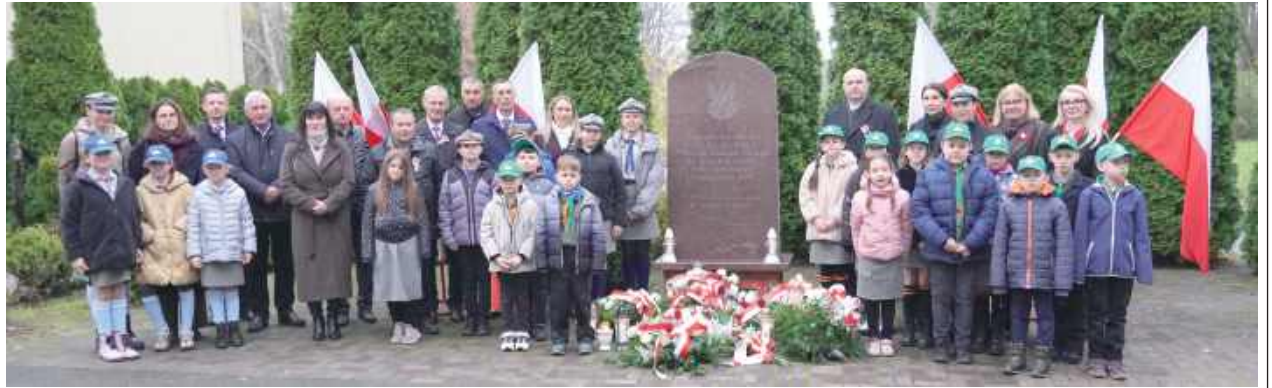
W ceremonii złożenia wieńców i zapalenia zniczy pod pomnikiem ku czci Żołnierzy 4 Pułku Piechoty Legionów Polskich Walczących w Rejonie Woli Osowińskiej 10 i 11 Sierpnia 1915 roku uczestniczyły delegacje przedstawicieli władz, szkół, organizacji społecznych

W Gminie Borki uroczyste obchody tego święta rozpoczęła uroczysta msza święta w kościele parafialnym pw. Wniebowzięcia Najświętszej Maryi Panny w Woli Osowińskiej. Następnie delegacje władz, organizacji społecznych, szkół, złożyły wiązanki kwiatów w barwach narodowych i zapaliły znicze pod pomnikiem bohaterów wojennych, którzy złożyli najwyższą ofiarę w imię wolności Rzeczypospolitej, broniąc jej niepodległości i prawa do miejsca na mapie Europy i świata.