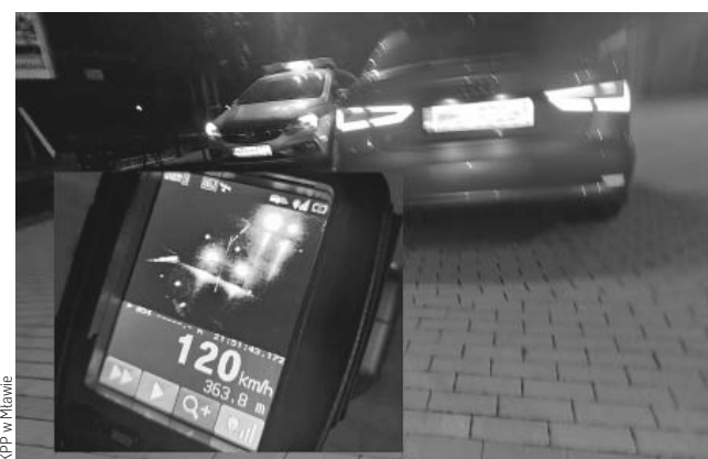
KPP w Mławie