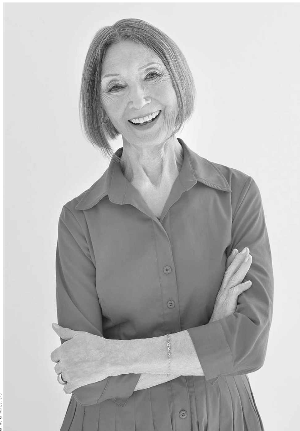
Fot. Weronika Kosińska

— Trudno. Moją pierwszą specjalizacją jest terapia uzależnień, więc wiem, że tak jak alkoholikowi trudno jest rzucić alkohol, narkomanowi – trudno jest żyć bez narkotyków, tak trudno zrezygnować z narzekania, uzalania się nad sobą czy rozpamiętywania złych rzeczy. Patrząc jednak na