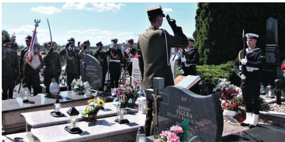
Apel poległych i ceremonia złożenia wieńców na mogiłach żołnierzy. Rzekuń, 17 VIII 2025 r.

browaną przez proboszcza parafii rzekuńskiej wraz z kapłanem z 3. Flotylli Okrętów w Gdyni, zgodnie z ceremoniałem wojskowym. Po mszy odbyło się uroczyste podniesienie flagi państwowej oraz odegrany został Hymn RP, a następnie przemarsz na cmentarz, gdzie znajdują