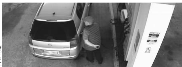
KPP w Mławie

paliwo. Do zdarzenia doszło 5 sierpnia. Jak wynika z ustaleń, sprawcy zamontowali skradzione tablice do Opla Signum combi koloru srebrnego. Następnie, na jednej ze stacji paliw w pobliżu Mławy, ukradli paliwo. Jednego ze