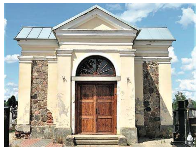
Kaplica rodu Glinków z 1856 r. (W przyszłym roku będzie już 170. lat od czasu budowy). Rzekuń, 2021 r.