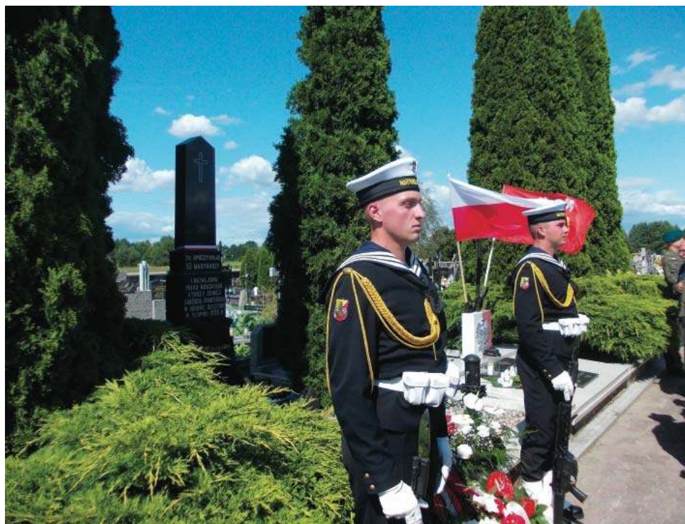
Warta honorowa przy pomniku poległych 53. marynarzy z 1. Batalionu Pułku Morskiego w VIII 1920 r. To ważne wydarzenie wpisuje się w obchody rocznicy Bitwy Warszawskiej i przypomina o lokalnych bohaterach, którzy oddali życie za wolność Polski. Rzekuń, 17 VIII 2025 r.

— Która to już w tym roku sentymentalna podróż?