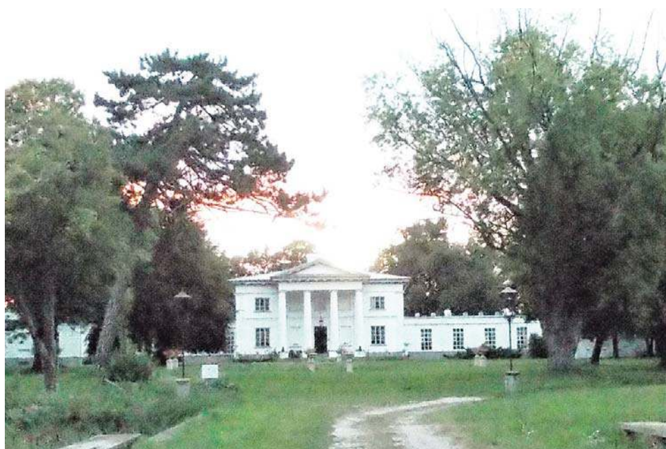
Pałac Glinków w Szczawinie, 18 VIII 2025 r.