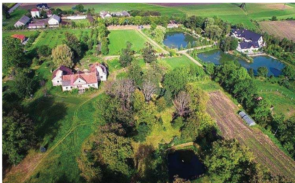
Dwór rodu Glinków z lotu ptaka w „Zielonym Zakątku”. Widać m.in. park dworski, stawy. Susk Stary, czasy współczesne. (Domena publiczna)