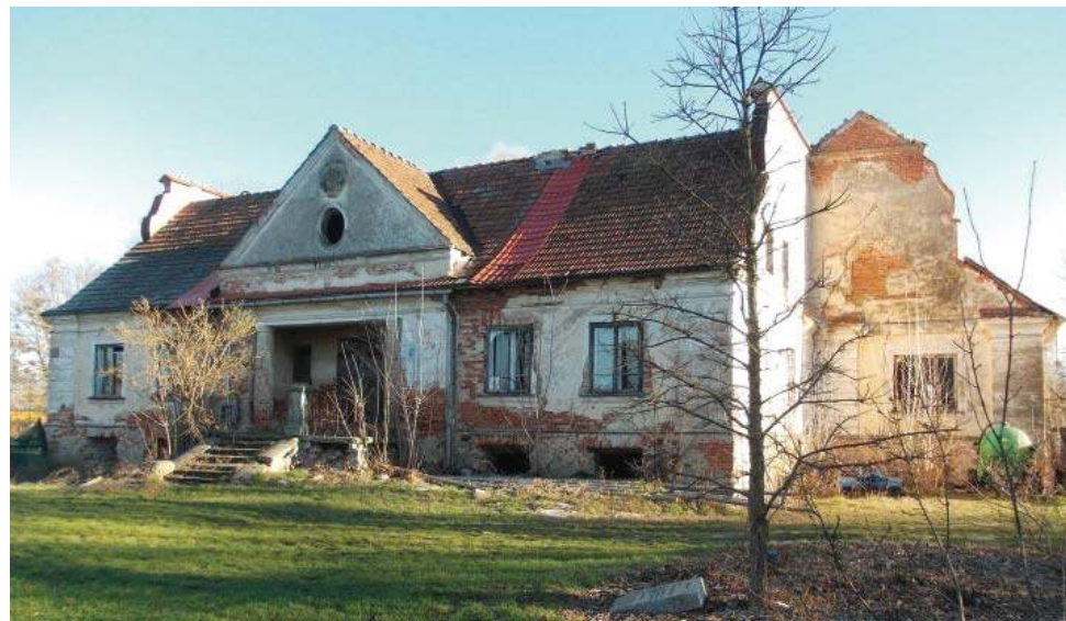
Dwór w Susku Starym, 3 IV 2025 r.

rynarzy, żołnierzy, straży pożarnej zarówno zawodowej jak i OSP. Oprawę muzyczną zapewniła Orkiestra dęta OSP Ostrołęka. Corocznie uroczystości uświetniają również ułani ze Stowarzyszenia Sympatyków 5. Pułku Ułanów Zasławskich w Ostrołęce, w umundurowaniu z okresu II RP”.