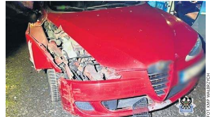
Rozbite auto, zniszczone barierki, jeszcze kary za jazdę po pijanemu. 25-latkowi nie opłaciła się nocna jazda...

Wezwane na interwencję policjantki z wałbrzyskiej drogowki szybko ustaliły, gdzie jest