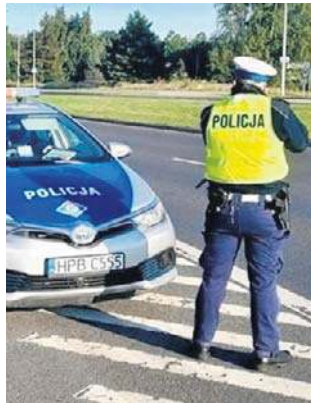
Policjanci codziennie zatrzymują drogowych piratów.

- Funkcjonariusze ustawiają się z ręcznymi miernikami prędkości w rejonach przejść dla pieszych i w miejscach, w których użytkownicy dróg znacznie przekraczają prędkość. O tym, że warto jeździć