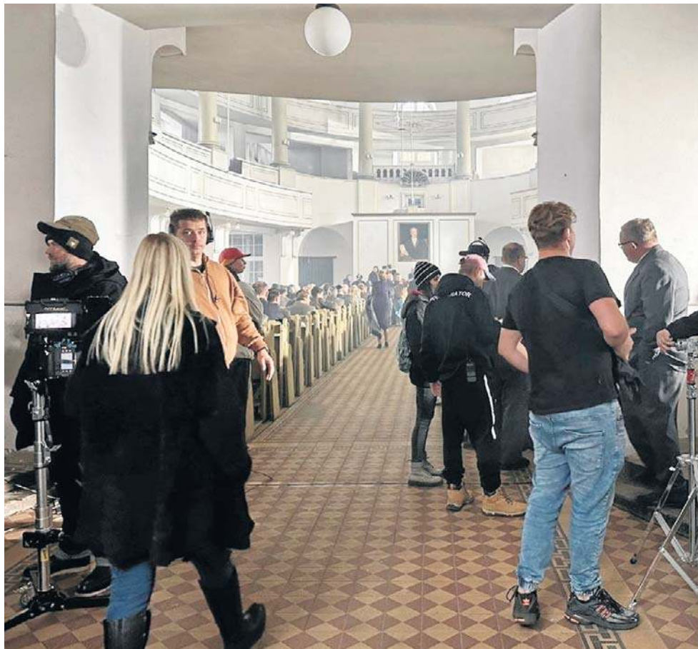
W Wałbrzychu zdjęcia kręcono w Kościele Zbawiciela. Pojawiło się tu 350 statystów.

Na Dolnym Śląsku zdjęcia robiono m.in. we Wrocławiu, Bielawie i Legnicy. Później fil-