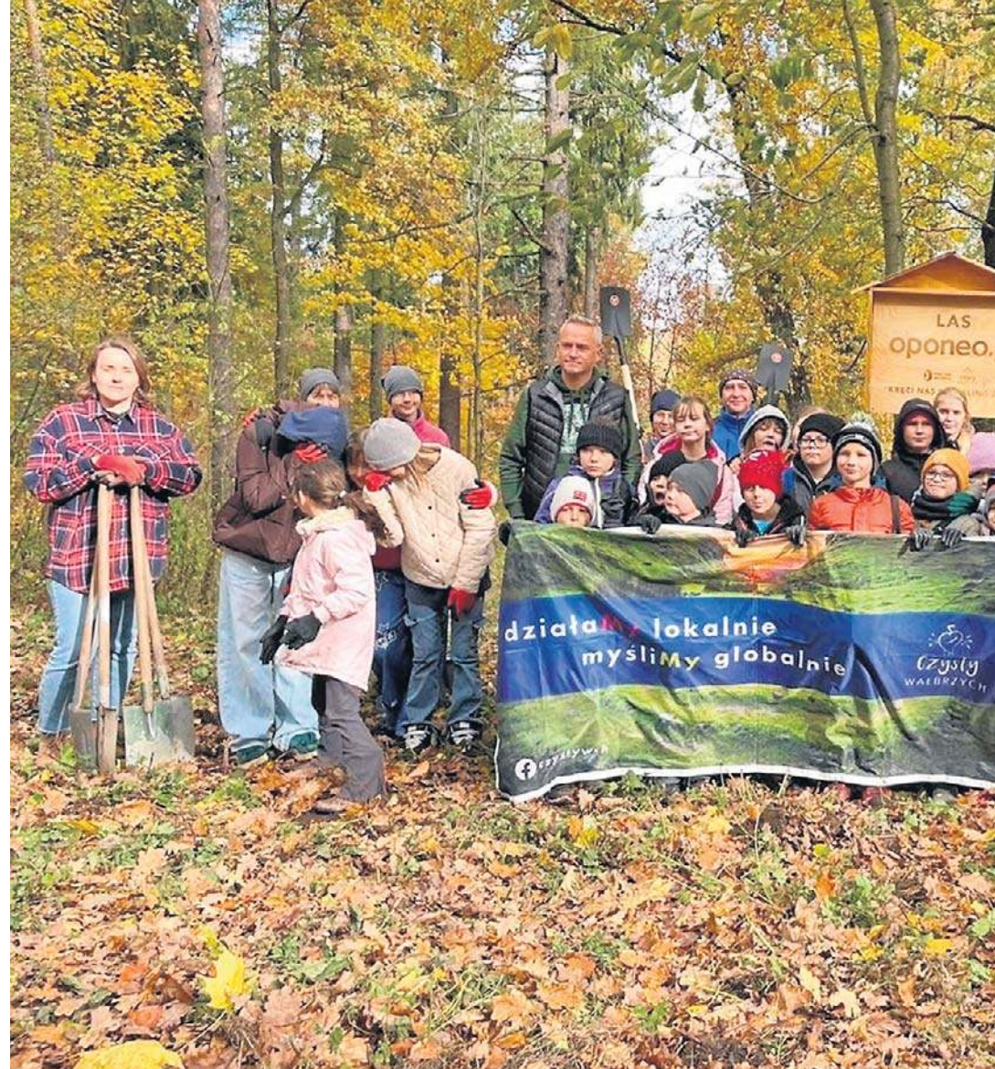
W Wałbrzychu w sobotę, 25 października, posadzono 1,4 tysiąca drzew. To efekt udziału w akcji