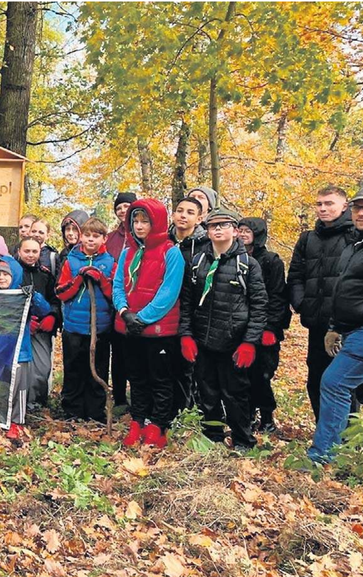
SadziMy Lasy z Oponeo.pl. Ruszyły do niej tłumy wolontariuszy.