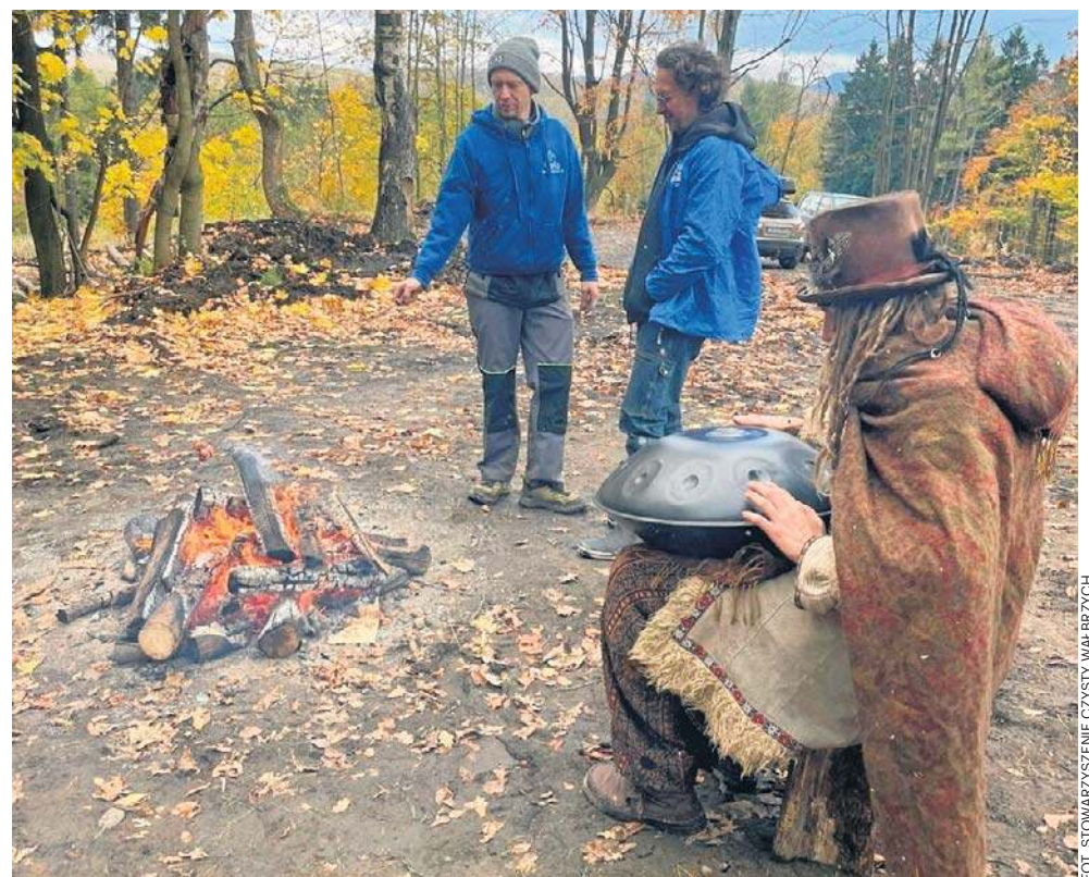
Pozostałych do 6 tys. 4,6 tys. drzew posadzą w kolejnych dniach wyspecjalizowane firmy.