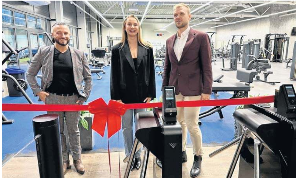
Właściciele Fit Style oferują kompleksowe podejście do ludzi, którzy chcą żyć aktywnie.

Kadra jest przeszkolona także pod kątem problemów zdrowotnych, np. z kręgosłupem czy kolanami. Instruktorzy doradzą, jakie ćwiczenia warto wykonać, a czego absolutnie nie robić. Będą pracować