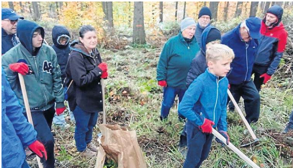
Członkowie Stowarzyszenia sadzili drzewa z wolontariuszami, uczniami i harcerzami.