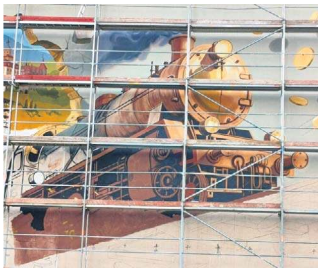
W Wałbrzychu powstaje mural, upamiętniający legendę poszukiwaczy, lokalnego Świętego Graala eksploratorów.