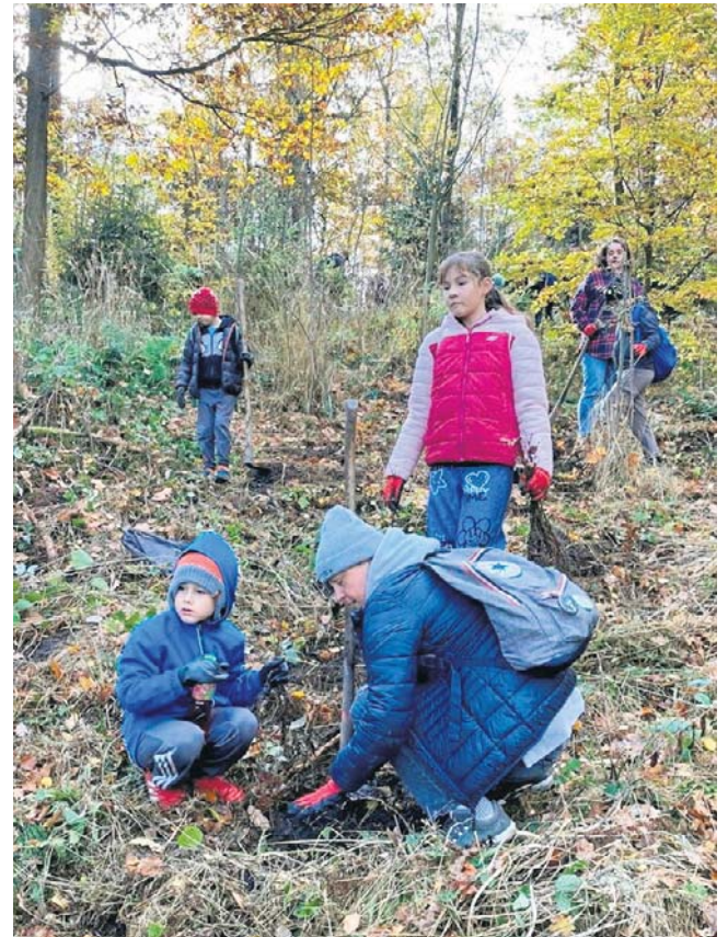
W miejskim lesie, w rodzinnej atmosferze, wolontariusze oraz podopieczni MOPS posadzili 500 drzew.