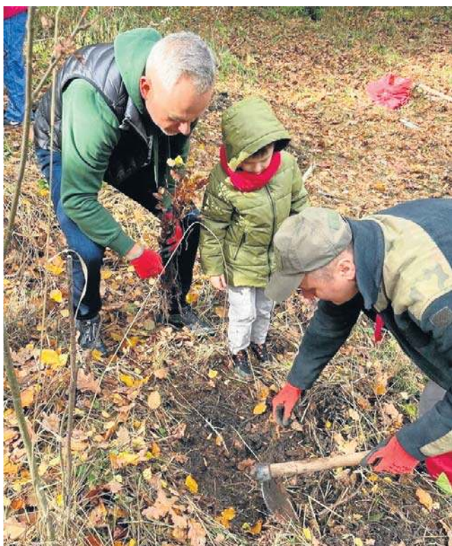
Do akcji tłumnie przystąpili mieszkańcy Wałbrzycha. Ramie w ramie pracowały całe wielopokoleniowe rodziny.