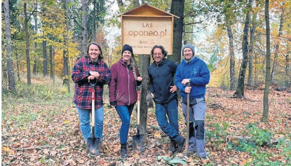
W przedsięwzięcie skutecznie zaangażowało się Stowarzyszenie Czysty Wałbrzych.