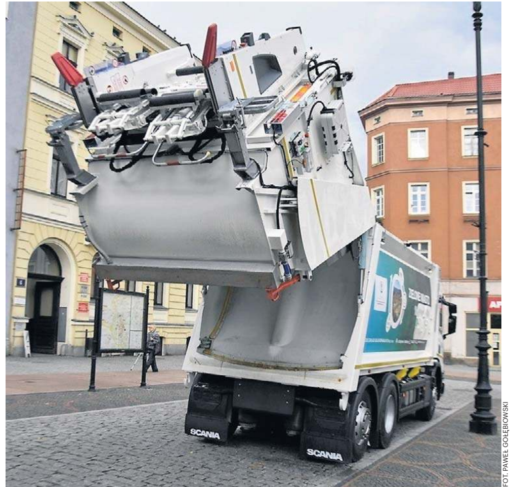
Nowe śmieciarki marki scania są bardzo nowoczesne, a przy tym praktycznie niezawodne.

W Boguszowie-Gorcach kierujący osobówką 74-letni mieszkaniec powiatu kłodzkiego nie udzielił pierwszeństwa pieszej, będącej na pasach i potrafił ją. 67-letnia kobieta z obrażeniami ciała trafiła do szpitala. Prowadzący czynności policjanci ruchu drogowego ustalili, że mężczyzna był trzeźwy, za to kobieta znajdowała się w stanie nietrzeźwości. Policjanci odebrali kierowcy prawo jazdy i będą prowadzili dalsze postępowanie w sprawie wypadku. Nagrała go kamera ulicznego monitoringu. Na zapisie widać, jak kobieta upada. Nie ma żadnych szans w zderzeniu z samochodem. To daje do myślenia więcej niż słowa... ADA