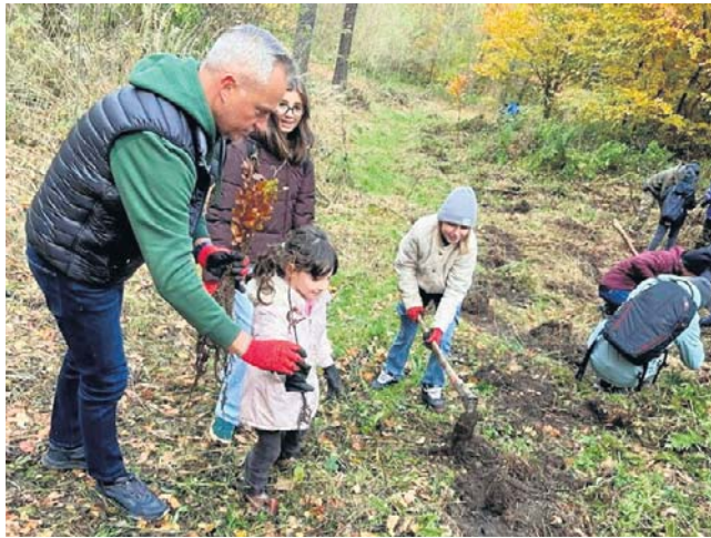
- Wszystkie 6 tysięcy drzew trafi na swoje miejsca! - zapewniali dzieci starsi uczestnicy akcji.