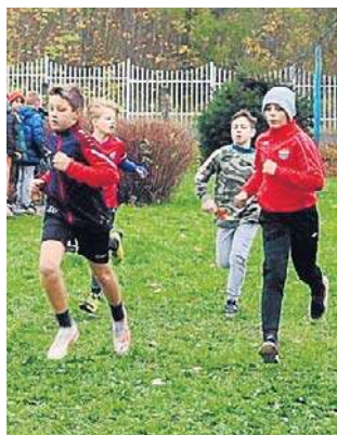
Uczniowie podstawówek rywalizowali z wielką pasją.

Klasyfikację drużynową wygrał Zespół Szkolno-Przedszkolny im. J. Korczaka w Sokołowsku, wyprzedzając Publiczną Szkołę Podstawową w Kowalowej i Publiczną Szkołę Podstawową w Mieroszowie. ©