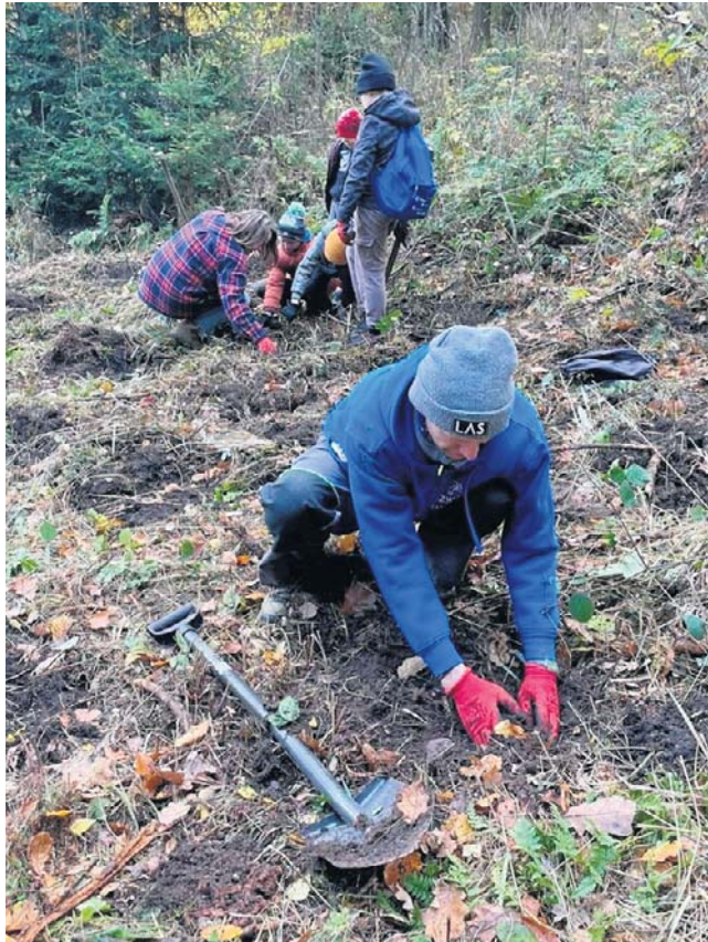
W Nadleśnictwie Wałbrzych, pod fachowym przewodnictwem leśników, posadzono 900 drzew.