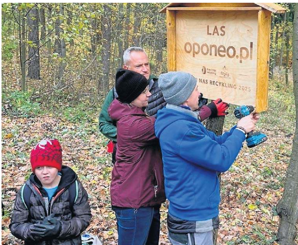
Gdy była taka potrzeba, wolontariusze z wiertarkami w rękach mocowali tablice.