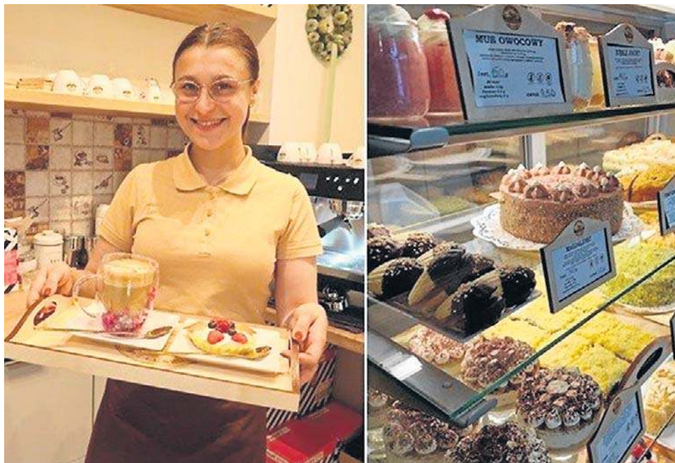
Lokal w centrum handlowym przy ul. 1 Maja 68 w Wałbrzychu zaczął działać 19 września.