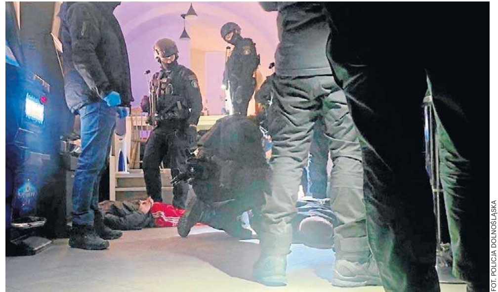
Policjanci uderzyli w środowisko pseudokibiców. Zatrzymali 11 osób, w tym dwie kobiety.

- Do współpracy włączyli się także funkcjonariusze KAS z Legnicy, którzy zlikwidowali lokal z nielegalnymi automatami do gier hazardowych. Łącznie zabezpieczono trzy automaty. W tym przypadku będzie prowadzone odrębne postępowanie z kodeksu karnoskarbowego - przekazują policjanci.