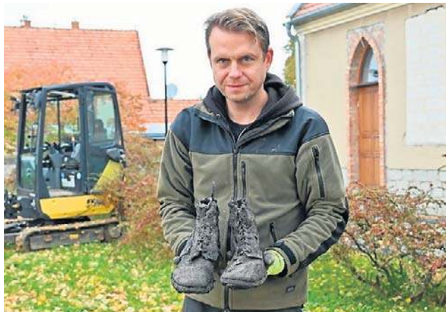
Wojskowe obuwie, nawet jeśli było dość mocno zniszczone czy zakrwawione, miało tuż po wojnie sporą wartość.

zwykle modny przed 80 laty sygnet, zegarek czy lusterko ze skrytką. Ostatni przedmiot okazał się dość niecodzienny. W schowku trzymano... prezerwatywy. Badacze tłumaczą, że oprócz pełnienia standardowej funkcji, odgrywały one również rolę osłonową. Wojskowi chowali w nich cenne przedmioty, które łatwo mogły się zgubić, zniszczyć lub zostać skradzione podczas wojennej zawieruchy. Jeden z żołnierzy zawinął w nią swoją obrączkę.