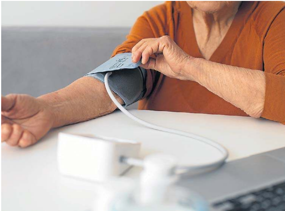
Na nadciśnienie tętnicze - wg szacunków na świecie - choruje już jedna na trzy osoby.

Ważna jest także pozycja, w jakiej mierzysz ciśnienie. Do prawidłowego zmierzenia ciśnienia krwi zaleca się podparcie ramienia na blacie i założenie