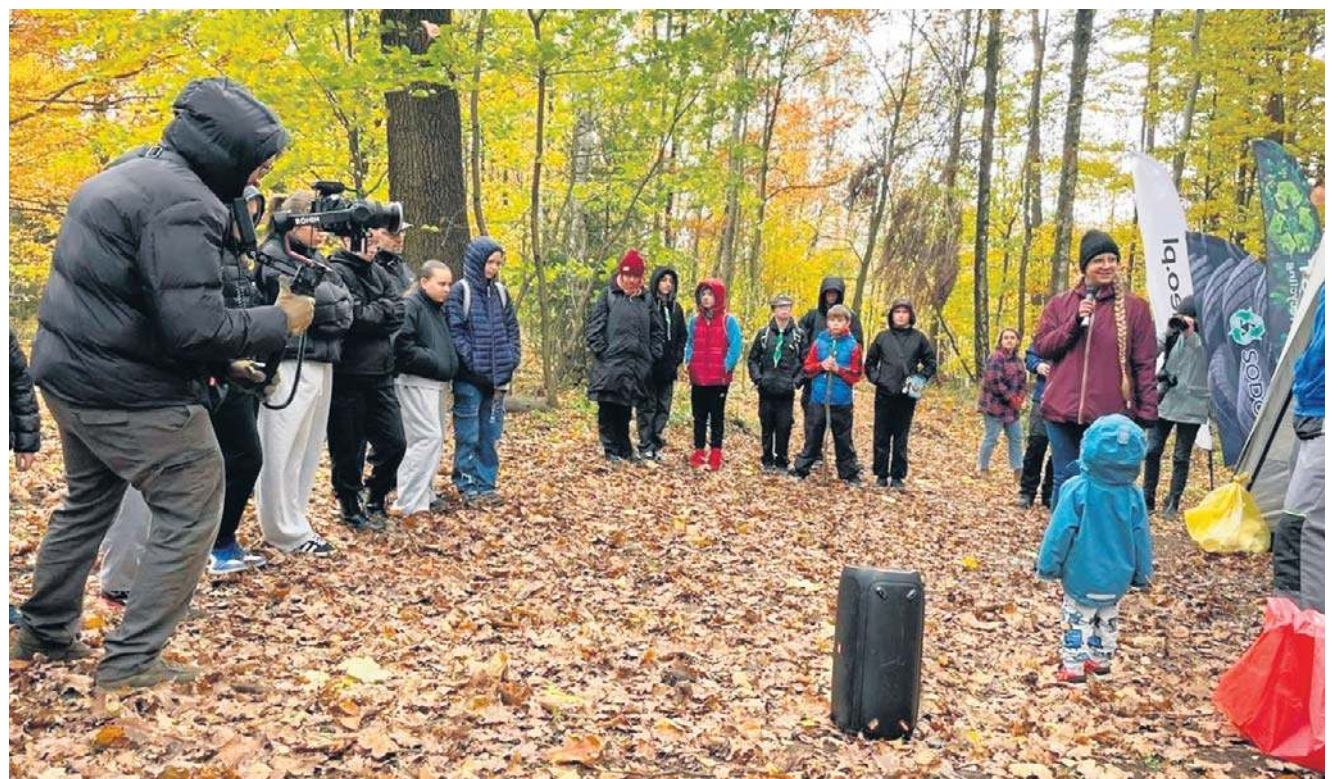
Wiosną zebrano w Wałbrzychu najwięcej w Polsce zużytych opon. W nagrodę w mieście przybędzie 6 tysięcy drzew.