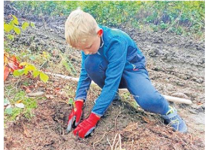
Praca w lesie okazała się dla dzieci wielką frajdą. Nareszcie można było sobie do woli pogrzebać w ziemi!