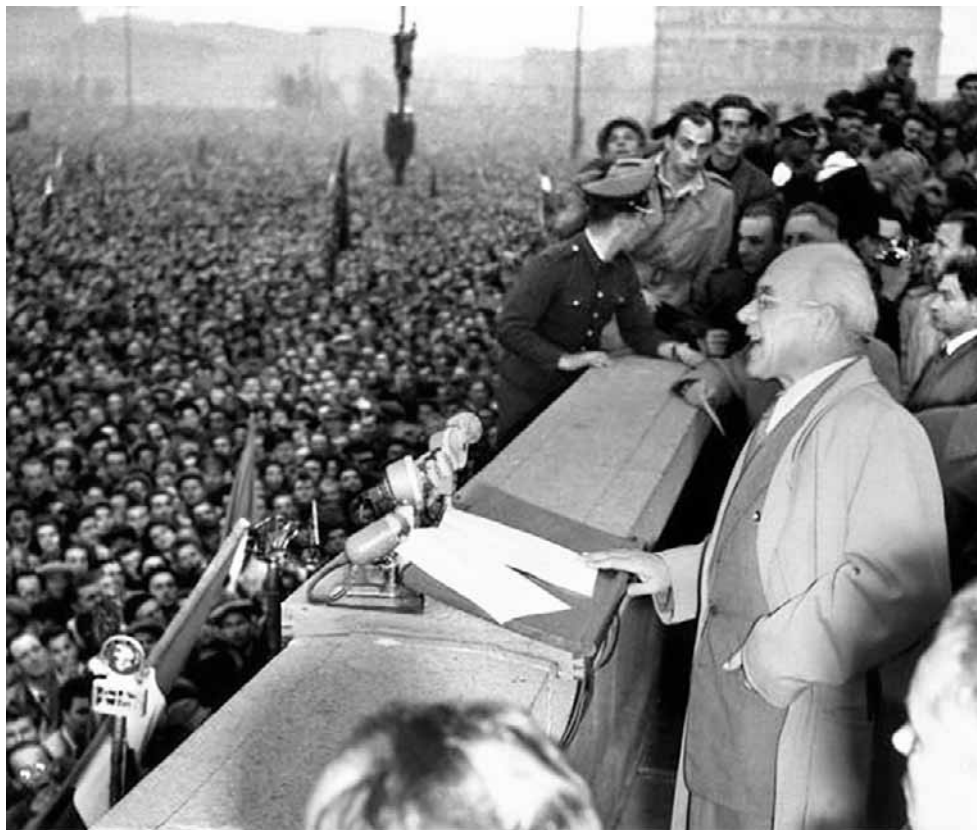
Warszawiacy, śpiewający Gomułce na placu Defilad „Sto lat!” raczej nie zdawali sobie sprawy, że zaledwie kilka dni wcześniej Polska stała na progu radzieckiej interwencji.

i miały gwałtowny przebieg. Obie strony przedstawiały wzajemne pretensje, lecz Gomułka nie przestraszył się Chruszczowa i twardo bronił swoich racji. Oskarżył Rosjan m.in. o to, że uległość Polski wobec ZSRR skutkuje biedą polskich robotników. Dyskusja - a właściwie awantura, w której w ten sposób przerzucano się winami - trwała wiele godzin i była kilkakrotnie przerywana.