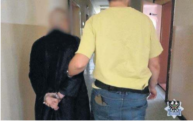
24-letniemu wałbrzyszaninowi nic nie dała skrytka w ścianie. Został znaleziony i teraz odsiedzi swój wyrok.