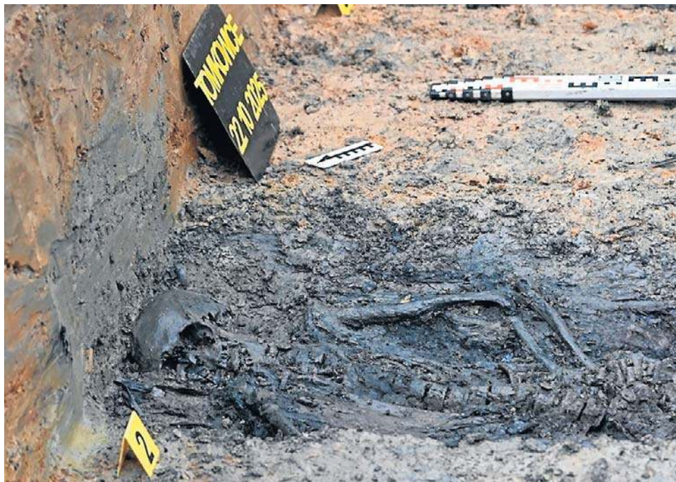
Koło kościółka w Tomkowicach archeolodzy odnaleźli szczątki ponad 70 żołnierzy.

Podczas pierwszego etapu wykopalisk archeolodzy znaleźli przy żołnierzach kilka przedmiotów. Oprócz standardowego ekwipunku wojskowego, na który składają się m.in.: środki medyczne, latarka, kompas, menażka czy szczyrzyk, z ziemi wyciągnięto również osobiste pamiątki. Wśród nich znalazły się: nie-