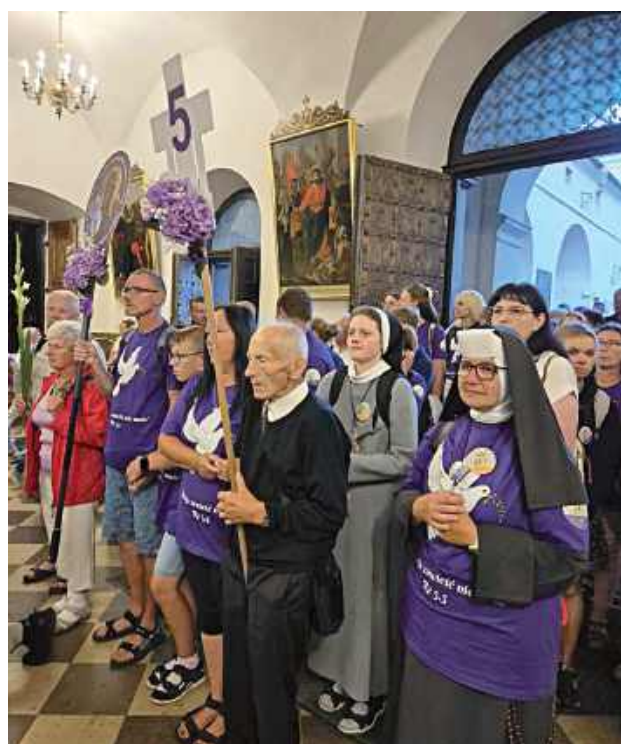
Grupa 5. na jasnogórskim szlaku miała do pokonania dokładnie 364,4 km. Do Częstochowy doszło 186 osób