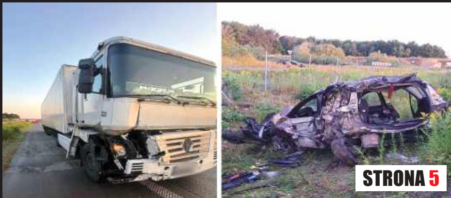
Według wstępnych ustaleń policji kierujący ciężarówką marki Renault, 64-letni obywatel Polski, najechał na samochód osobowy, w którym podróżowało pięciu obywateli Ukrainy

W piątek, 15 sierpnia na trasie ekspresowej S17 w rejonie miejscowości Goctaw samochód ciężarowy uderzył w tył stojącego na poboczu auta osobowego.