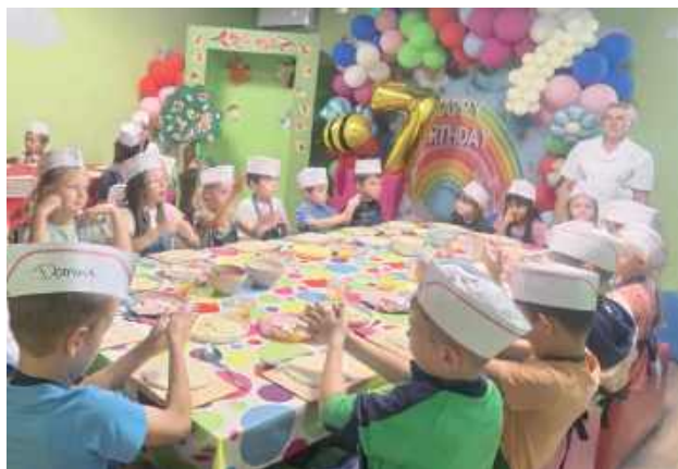
Warsztaty były świetną okazją do spróbowania swoich sił w kuchni. Dzieci własnoręcznie przygotowały pizzę

Urząd Miasta Łaskarzew składa bilans projektu Wakacje w Mieście 2025, którego trzydniowe wydarzenia odbyły się 4, 6 i 8 sierpnia. W ich trakcie udział wzięło pięćdziesięcioro dzieci z Łaskarzewa. Akcję objął patronatem burmistrz miasta.