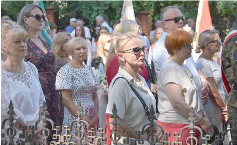
Na uroczystość przybyli mieszkańcy Garwolina i powiatu garwolińskiego