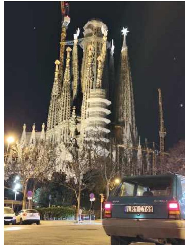
Sagrada Familia w Barcelonie, a na pierwszym planie 27-letni Seat Marbella

- Prowadziłem dokładne notatki z każdego tankowania. Średnie spalanie wyszło około 4,8 - 4,9 litra na 100 km. Łącznie wlałem około 445 litrów benzyny. Biorąc pod uwagę trasę i wiek auta - rewelacja.