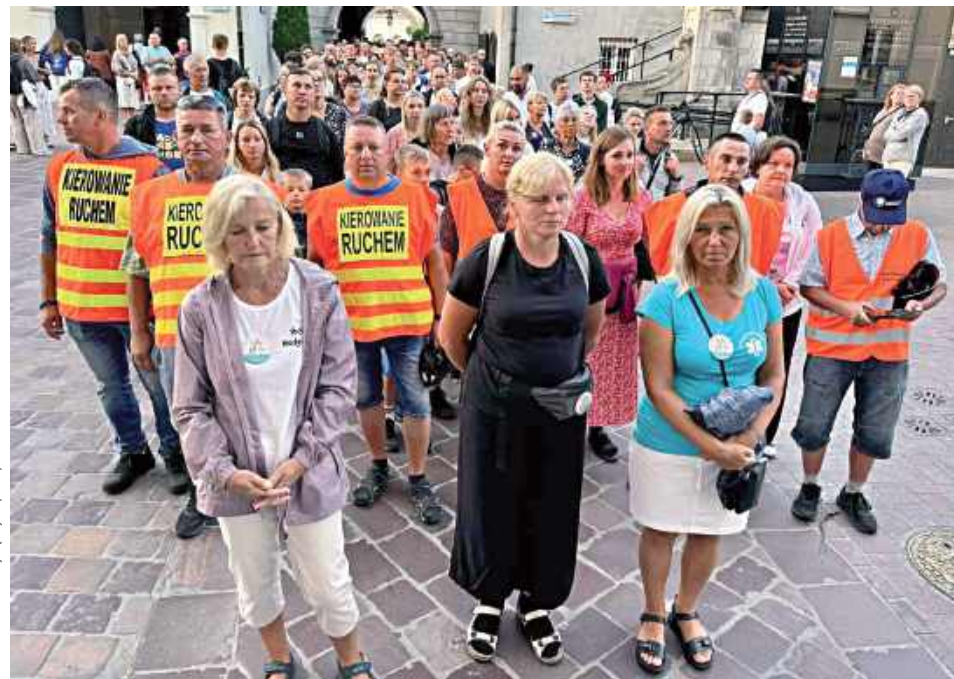
14 dnia sierpnia w godzinach porannych pielgrzymi z grupy 7. bezpiecznie dotarli do tronu Jasnogórskiej Pani

W godzinach porannych 14 sierpnia pątnicy z grupy numer 7 45. Pieszej Pielgrzymki Podlaskiej na Jasną Górę, obejmującej parafię Zwiastowania Najświętszej Maryi Panny w Żelechowie oraz parafie dekanatu żelechowskiego, dotarli do progów częstochowskiego klasztoru.