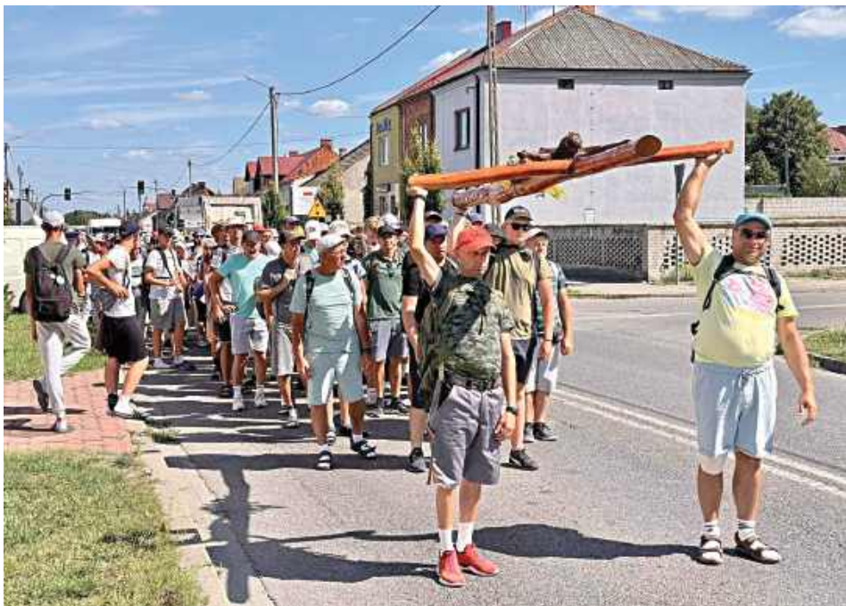
Pielgrzymi z Żelechowa przy śpiewie adoracyjnym nieśli krzyż na wyprostowanych ramionach