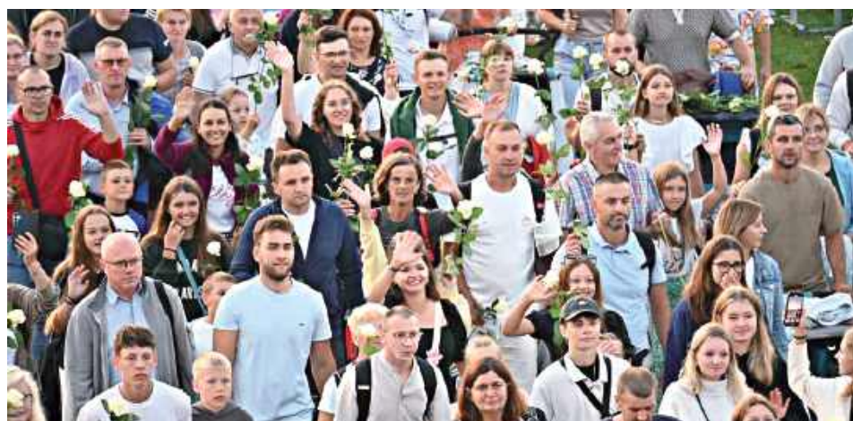
Wspólnota grupy charakteryzowała się rodzinnością, albowiem na szlak pielgrzymi wyruszyły całe rodziny