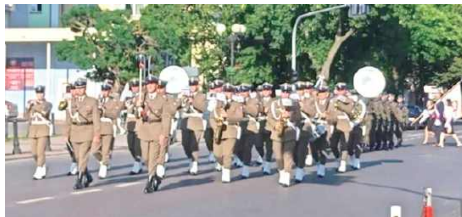
Uroczystości ku czci bohaterów: Obchody 15 sierpnia na Skwerze Niepodległości