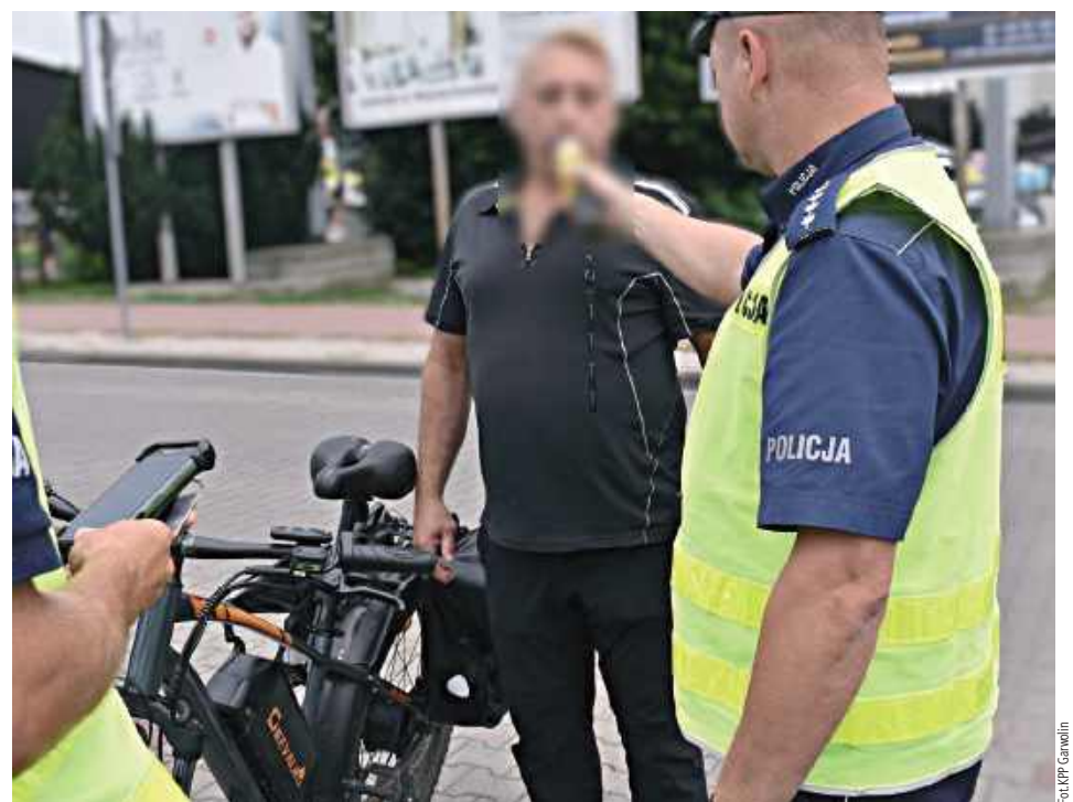
W ramach akcji sprawdzono łącznie 70 użytkowników dróg, zwracając szczególną uwagę na bezpieczne zachowanie oraz przestrzeganie obowiązujących reguł

Podczas piątkowych działań funkcjonariusze patrolowali ulice, ścieżki rowerowe oraz okolice przejść dla pieszych. Kontrolowali osoby poruszające się hulajnogami elektrycznymi, rowerami tradycyjnymi