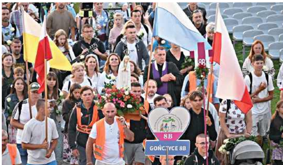
Grupa 8B obejmowała parafię Gończyce. Jej patronem była Matka Boża Szkaplerzna. Kolor wyróżniający grupę stanowił amarant

14 sierpnia do Częstochowy dotarli pątnicy z parafii pw. Trójcy Świętej w Gończycach z grupy 8B kolumny siedleckiej 45. Pieszej Pielgrzymki Podlaskiej na Jasną Górę.