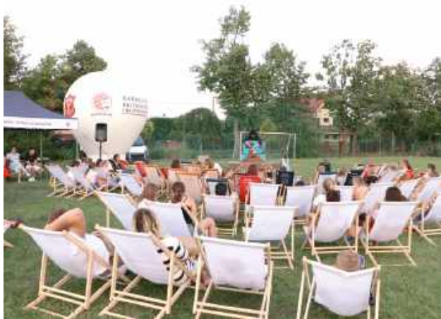
Na wielkim ekranie, siedząc na leżakach lub kocach całe rodziny obejrzały drugą część historii „Był sobie pies 2”

Jak potwierdzają organizatorzy, na boisku przy ulicy Różanej publiczność miała okazję obejrzeć spektakl teatralny, wziąć udział w grach, animacjach, warsztatach plastycznych oraz sportowych. Wieczór zakończono plenero-