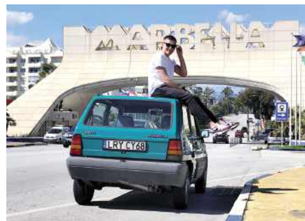
Miejsce docelowe młodego dęblinianina

Auto było w rodzinie. Kupił je mój ojciec 7-8 lat temu za jakieś grosze. Sprowadzone z Francji, kosztowało mniej niż 1000 zł. Dwa lata temu miało iść na sprzedaż. Pomyślałem wtedy: nie, to auto musi zostać w rodzinie