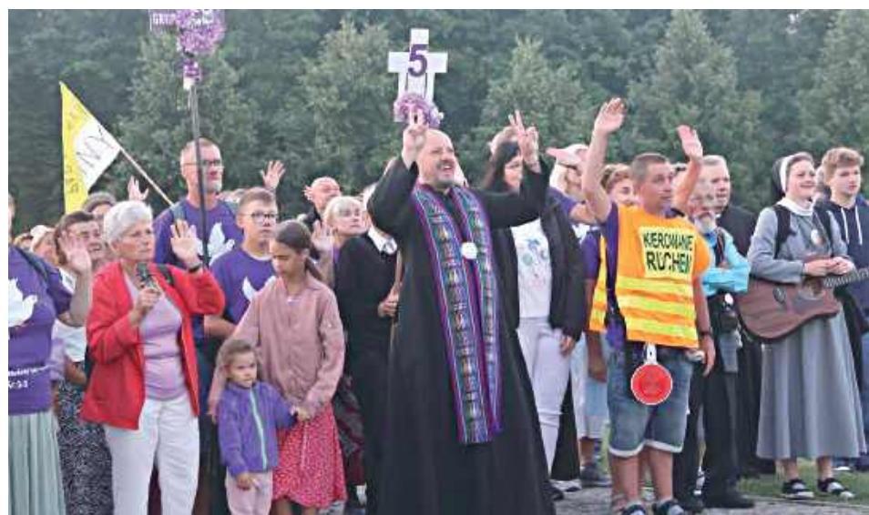
14 dnia sierpnia w godzinach porannych pielgrzymi z grupy 5. bezpiecznie dotarli do tronu Jasnogórskiej Pani