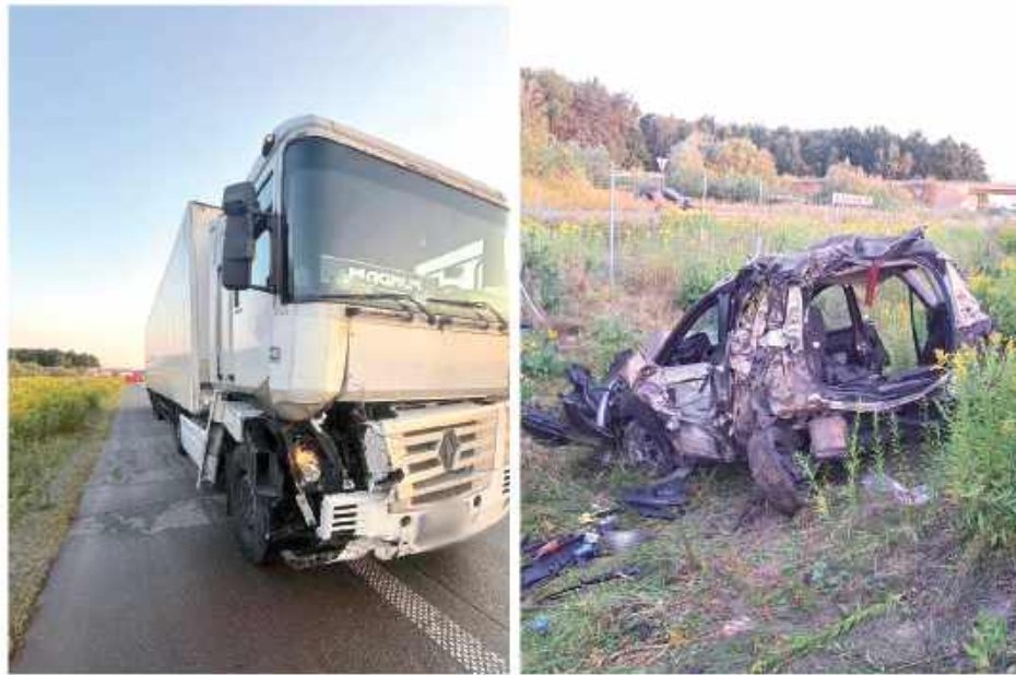
Według wstępnych ustaleń policji, kierujący ciężarówką marki Renault, 64-letni obywatel Polski, najechał na samochód osobowy, w którym podróżowało pięciu obywateli Ukrainy

- Droga w kierunku Lublina była całkowicie zablokowana. Trwały szczegółowe czynności mające ustalić przyczyny i przebieg tego tragicznego zdarzenia - przekazała podkomisarz Małgorzata Pychner z Komendy