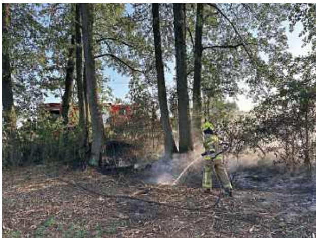
Zdarzenie zostało odnotowane jako numer 16 w rocznym zestawieniu wyjazdów jednostki

W czwartek, 14 sierpnia, o godzinie 18:35, jednostka Ochotniczej Straży Pożarnej Sokół została zadysponowana do gaszenia pożaru nieużytków rolnych w miejscowości Przyłek.