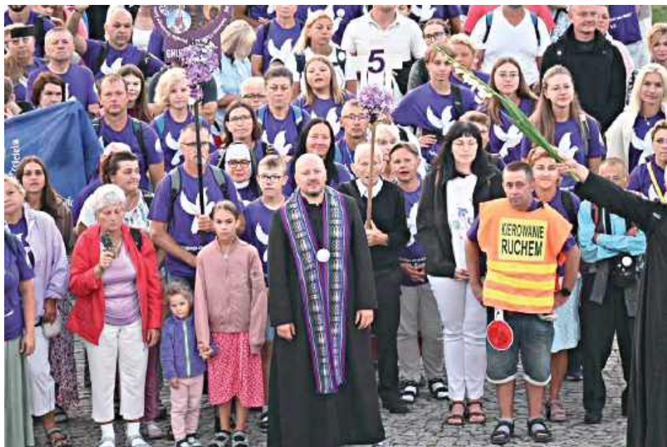
Grupa numer 5 obejmowała parafie Matki Boskiej Częstochowskiej w Garwolinie i Świętego Jana Pawła II w Sulbinach oraz parafie dekanatu osieckiego