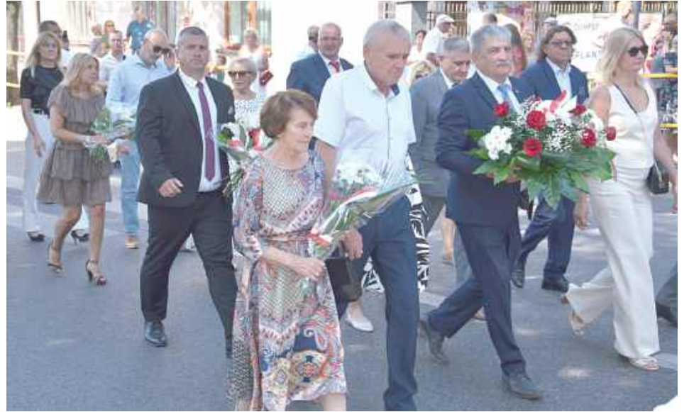
Kilka minut po godzinie 11 nastąpił przemarsz delegacji z udziałem pocztów sztandarowych i orkiestry dętej OSP Garwolin pod pomnik Marszałka Józefa Piłsudskiego

W niedzielę, 15 sierpnia, w Święto Wojska Polskiego w Garwolinie odbyły się uroczystości upamiętniające 105. rocznicę Bitwy Warszawskiej. Uczczono także pamięć polskich chłopów, którzy odpowiedzieli na apel władz i masowo wstępowali do Wojska Polskiego.