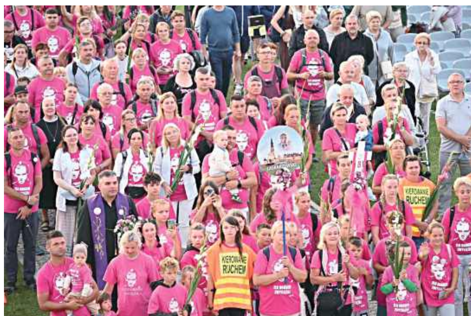
Pielgrzymi z grupy 8. na jasnogórskim szlaku mieli do pokonania 347,4 km. Cechą charakterystyczną grupy była znaczna liczba dzieci i młodzieży

Do Częstochowy z grupy 8. dotarło 180 pątników, do których przyłączyło się 30 uczestników pielgrzymki rowerowej,