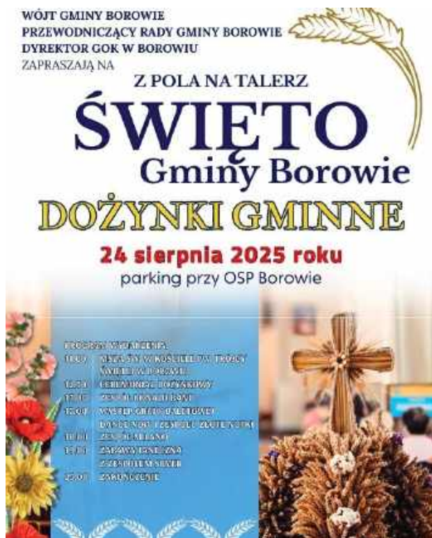
Święto Gminy Borowie 2025 - plakat

Na stoiskach przygotowanych przez Koła Gospodyń