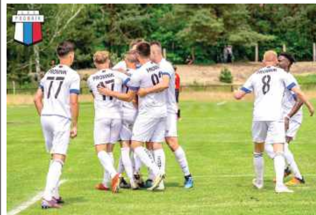
Tym razem Promnik musiał skapitulować. Lepsza okazała się Wisła Dziecinów triumfująca 4:2

Podopieczni Huberta Świdra w pierwszej kolejce musieli skapitulować. Pokonała ich dobrze poukładana Wisła Dziecinów.