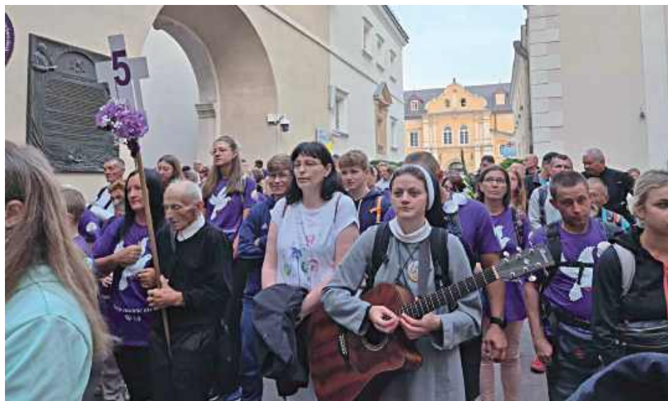
Patronem grupy 5. byli błogosławieni Męczennicy Podlascy, a kolorem wyróżniającym fiolet