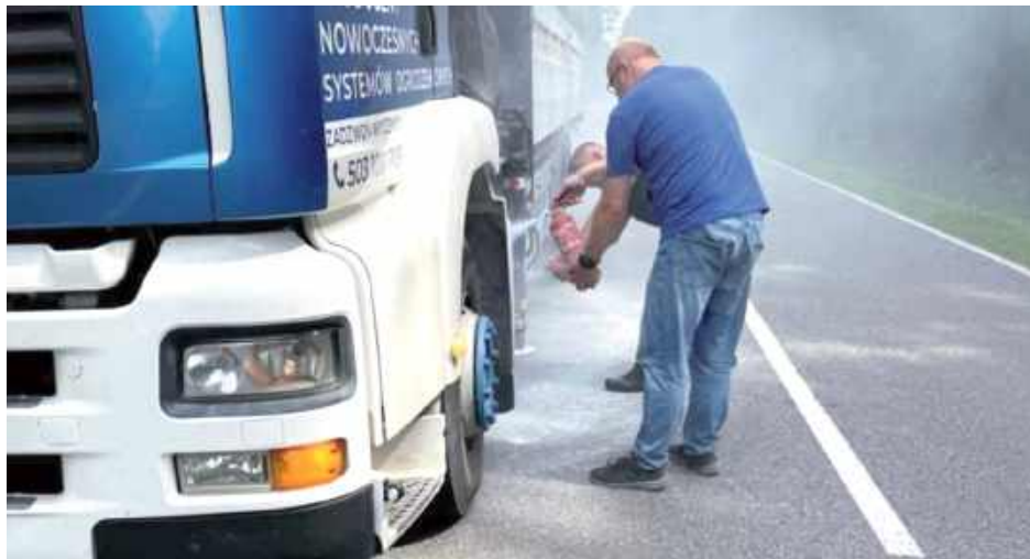
Tego typu postawa doskonale ilustruje, że funkcjonariuszem jest się zawsze – nie tylko w służbie, ale również poza murami zakładu karnego, w każdej sytuacji, gdzie zachodzi potrzeba pomocy drugiemu człowiekowi

Funkcjonariusz Zakładu Karnego w Siedlcach, pełniący służbę w Zespole Terenowym Systemu Dozoru Elektronicznego, wykazał się niezwykłą odwagą i profesjonalizmem w kryzysowej sytuacji, która miała miejsce 7 sierpnia. Tego