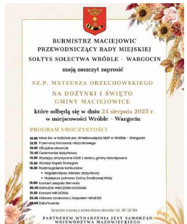
Dożynki Gminy Maciejowice - plakat

się koncertem zespołu Nemesis o 19:00. Gwiazdą wieczoru będzie zespół Kordian, który wystąpi o 20:30. Zaraz po nim, o 21:30, na scenie pojawi się Mr Góral. Zabawa taneczna z zespołem Nemesis potrwa od 22:30 do godziny 2:00.