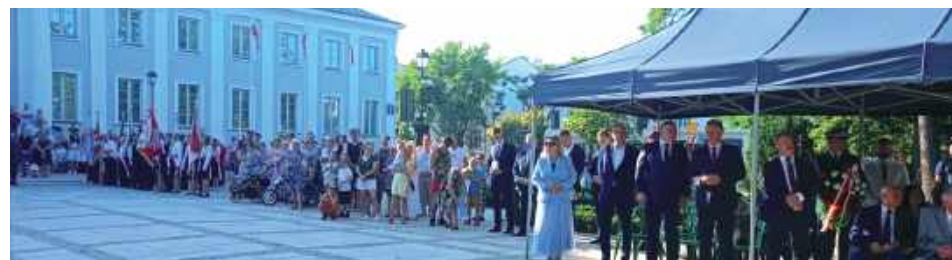
Uroczystości ku czci bohaterów: Obchody 15 sierpnia na Skwerze Niepodległości