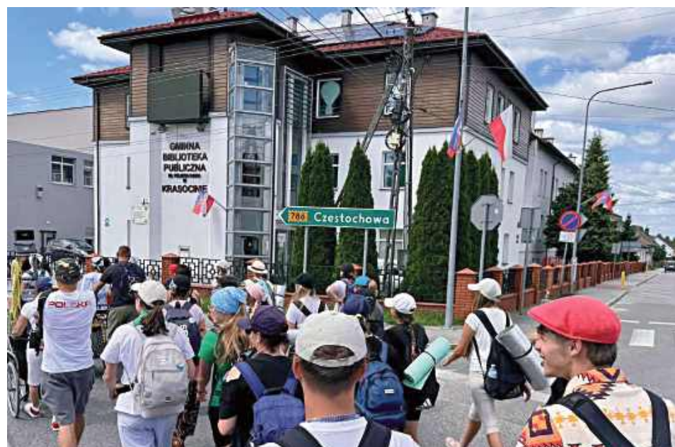
Pielgrzymi coraz częściej na swej trasie spotykali znaki z napisem „Częstochowa” – był to znak, że idą w dobrym kierunku