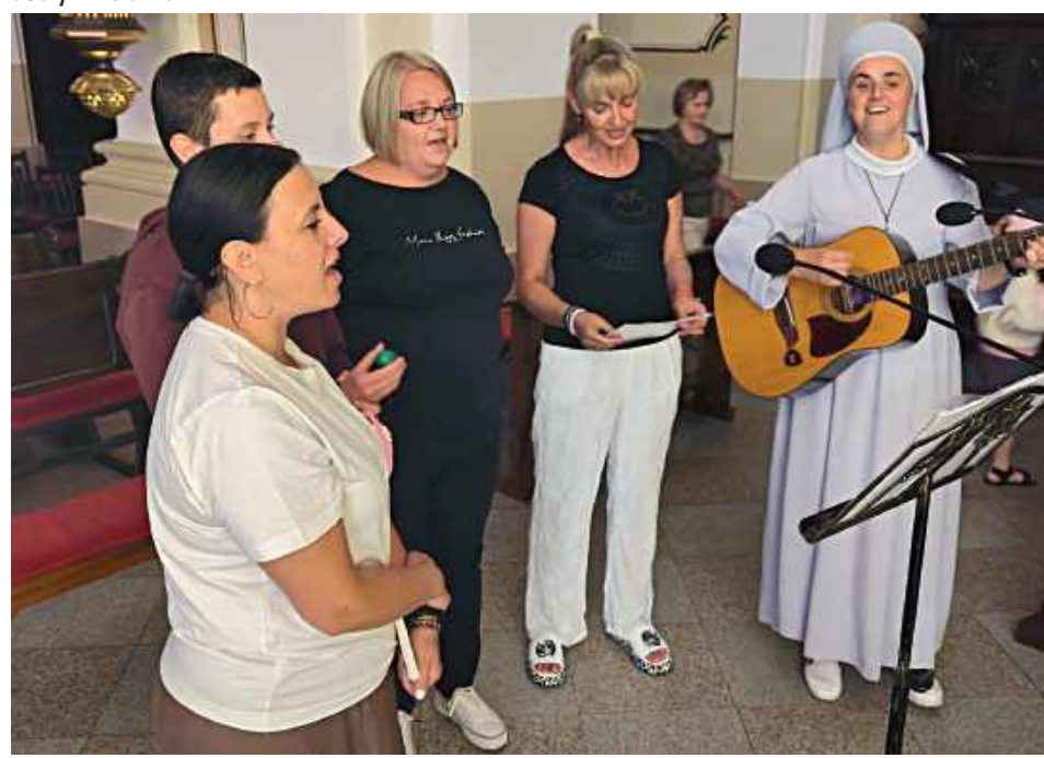
W kościele parafialnym pw. Zwiastowania Najświętszej Maryi Panny w Żelechowie wierni spotykali się na duchowym pielgrzymowaniu