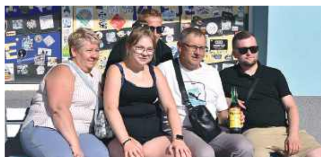
Wielu fanów skorzystało z okazji, by zrobić sobie zdjęcie na słynnej ławeczce pod sklepem. W kulminacyjnym momencie kolejka chętnych sięgała ponad 100 metrów