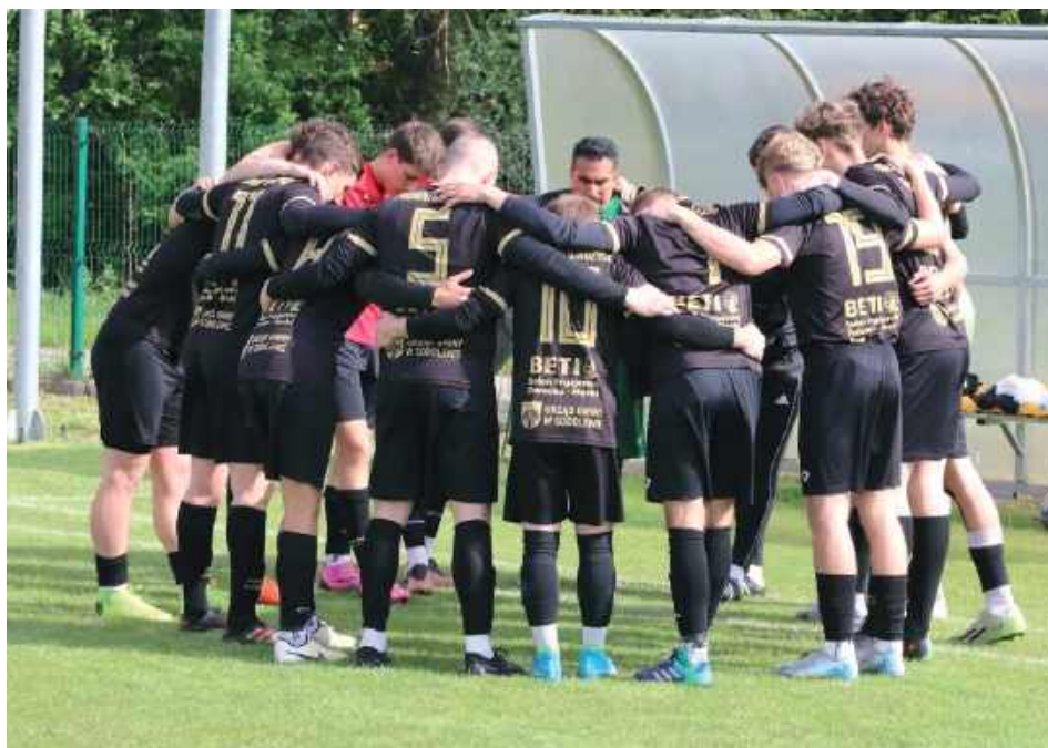
Nie mogli zacząć lepiej! Promnik Gończyce przed własną publicznością odprawił z kwitkiem spadkowicza z siedleckiej klasy okręgowej, zachowując przy tym czyste konto

To świetny początek dla zespołu z Gończy, który już w okresie przygotowawczym wyglądał naprawdę obiecująco. Drugą kolejkę rozegrają na wyjeździe, a rywalem będzie Tęcza Stanisławów. Początek meczu 23 sierpnia o godz. 10.