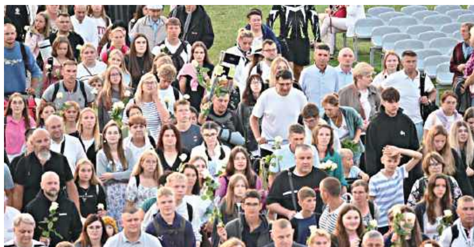
Pielgrzymi z grupy 8B na jasnogórskim szlaku mieli do pokonania 343,9 km