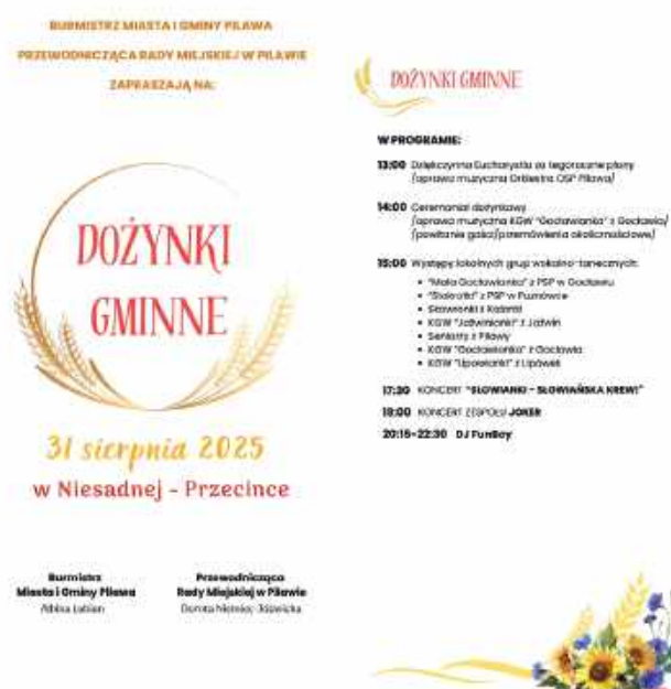
Dożynki Gminy Pilawa - plakat