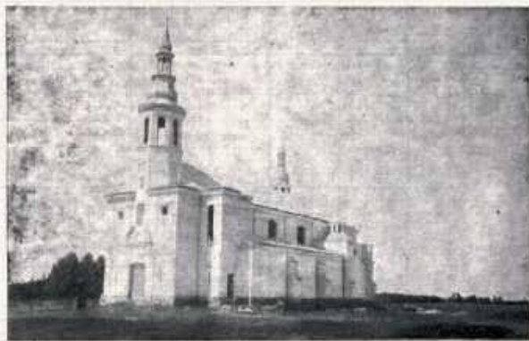
Kościół parafialny w Trąbkach.