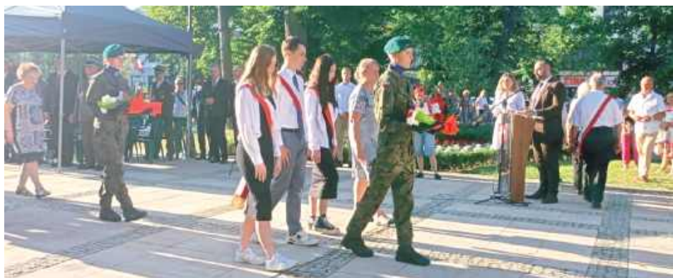
Uroczystości ku czci bohaterów: Obchody 15 sierpnia na Skwerze Niepodległości

O godzinie 16 rozpoczęła się msza święta w Kościele Garnizonowym pw. Najświętszego Serca Jezusa. Po jej zakończeniu uczestnicy przemaszerowali na Skwer Niepodległości, gdzie o 17.15 rozpoczęły się główne obchody