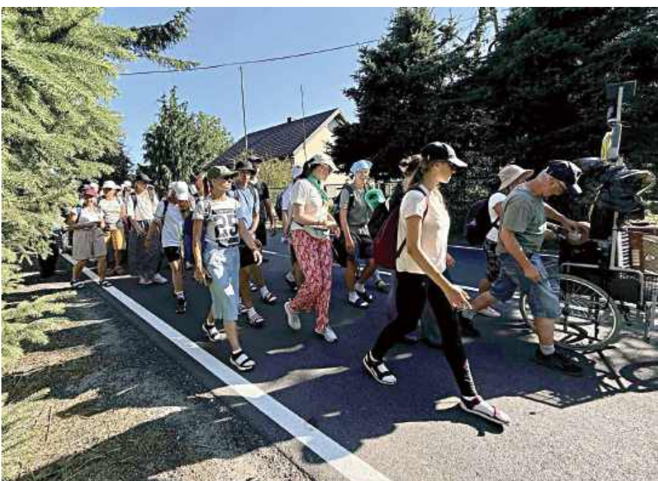
11 sierpnia był dniem pielgrzymowania na trasie pomiędzy Łopuszkiem a Żeliszawiczkami. Grupa w tym dniu liczyła już 214 osób!