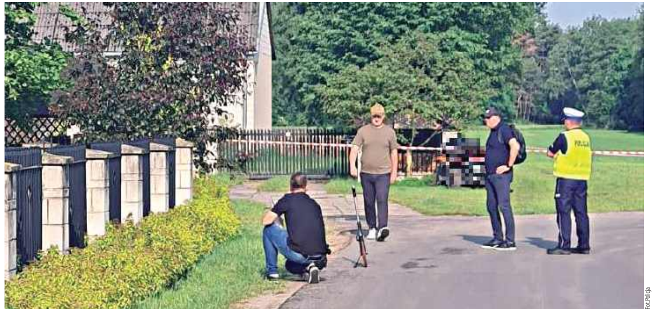
Na miejscu prowadzone były oględziny

Garwolińska prokuratura umorzyła śledztwo ws. śmiertelnego wypadku z udziałem quada. Jedynym winowajcą był tragicznie zmarły mężczyzna.