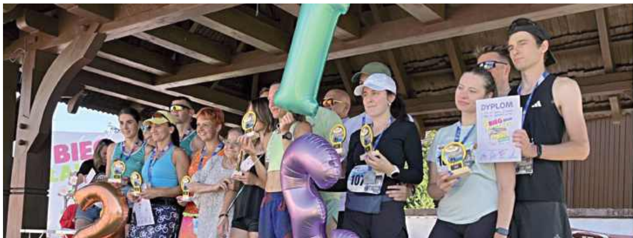
15 sierpnia wystawał III Bieg spod Ławeczki - śladami serialu Ranczo, w którym uczestniczyło ponad 200 osób!