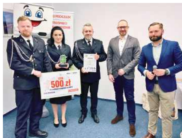
Teraz czekają na wsparcie jednostkę w realizacji celów

W akcji wzięły udział: - Ochotnicza Straż Pożarna w Garwolinie Leszczynach - Koło Gospodyń Wiejskich Podstoliczanie Podstolice