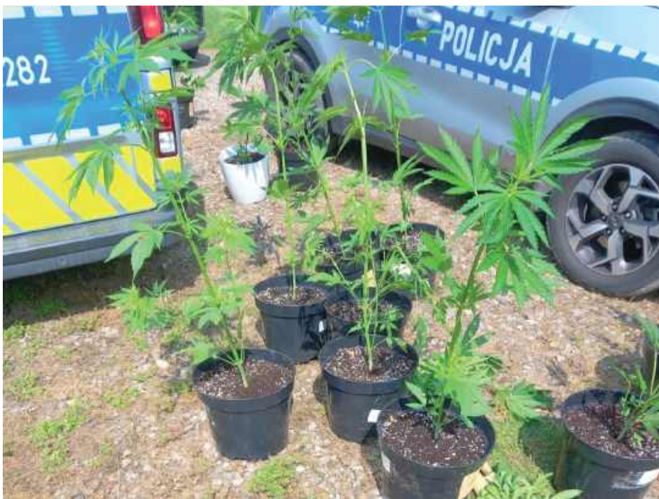
Akcja została przeprowadzona w czerwcu w gminie Maciejowice

29-latek usłyszał zarzut wytworzenia znacznej ilości środ-