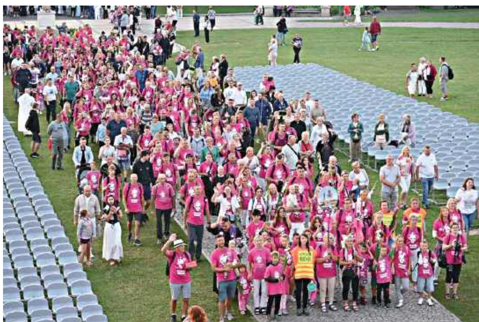
Grupa 8. obejmowała dekanat łaskarzewski. Do Częstochowy dotarło 180 pątników, do których przyłączyło się 30 uczestników pielgrzymki rowerowej, którzy przebyli trasę 265 km

14 sierpnia do Częstochowy dotarli pątnicy z parafii pw. Podwyższenia Krzyża Świętego w Łaskarzewie z grupy 8. kolumny siedleckiej 45. Pieszej Pielgrzymki Podlaskiej na Jasną Górę.