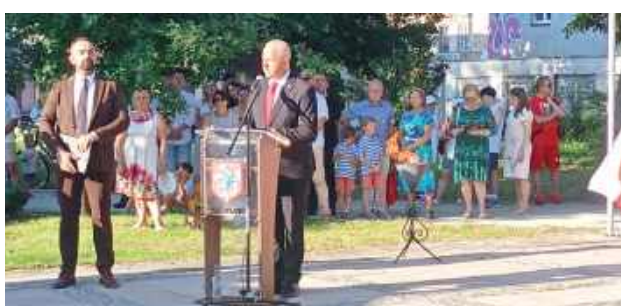
Uroczystości ku czci bohaterów: Obchody 15 sierpnia na Skwerze Niepodległości

O godzinie 16 rozpoczęła się msza święta w Kościele Garnizonowym pw. Najświętszego Serca Jezusa. Po jej zakończeniu uczestnicy przemaszerowali na Skwer Niepodległości, gdzie o 17.15 rozpoczęły się główne obchody