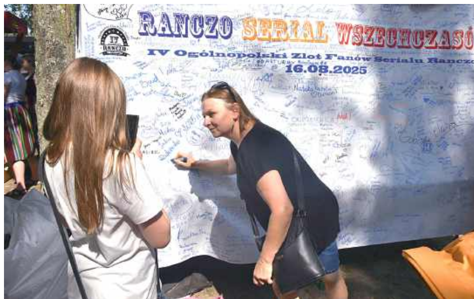
Wielu fanów chętnie korzystało z okazji, aby zostawić swój ślad w historii wydarzenia – wpisując się na pamiątkową matę oraz w specjalnie przygotowanej księdze. Dzięki temu każdy uczestnik mógł poczuć się częścią wyjątkowego święta serialu