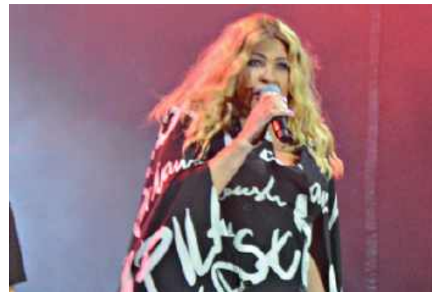
Artystka zapowiedziała także powrót na scenę. Szczegóły poznamy wkrótce

LUBLIN: Beata Kozidrak, wokalistka i liderka zespołu Bajm z Lublina, podzieliła się w rozmowie „Dzień Dobry TVN” tym, co działo się ostatnio w jej życiu. Artystka potwierdziła medialne spekulacje, że zachorowała na nowotwór.