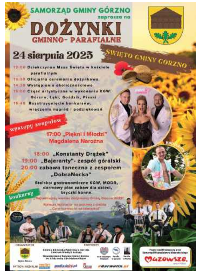
plakat dożynki Górzno

Na miejscu dostępne będą stoiska gastronomiczne prowadzone przez Koła Gospodyń Wiejskich i MODR, bezpłatny plac zabaw dla dzieci