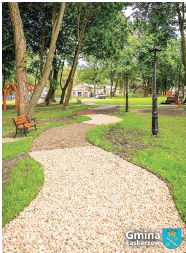
Jeszcze w tym roku zamierzają przeprowadzić dalszy etap zagospodarowania poprzez wykonanie nasadzeń oraz remont piwnicy-ziemiarki

Na początku sierpnia zakończono i formalnie odebrano prace związane z rewitalizacją zabytkowego parku w Izdebnie-Kolonii, realizowane przez Gminę Łaskarzew.