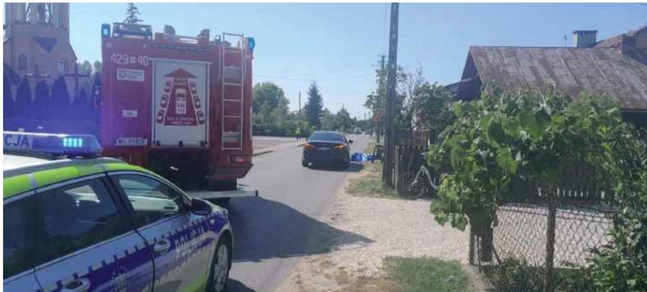
Według wstępnych ustaleń policji, rodzeństwo, będące pod opieką osoby dorosłej, wybiegło z prywatnej posesji wprost na jezdnię

Do dramatycznego wypadku doszło w sobotnie popołudnie w Uninie. Na prostym odcinku drogi powiatowej, tuż po godzinie 13:30, pod koła samochodu osobowego wpadło dwoje dzieci w wieku 5 i 7 lat.