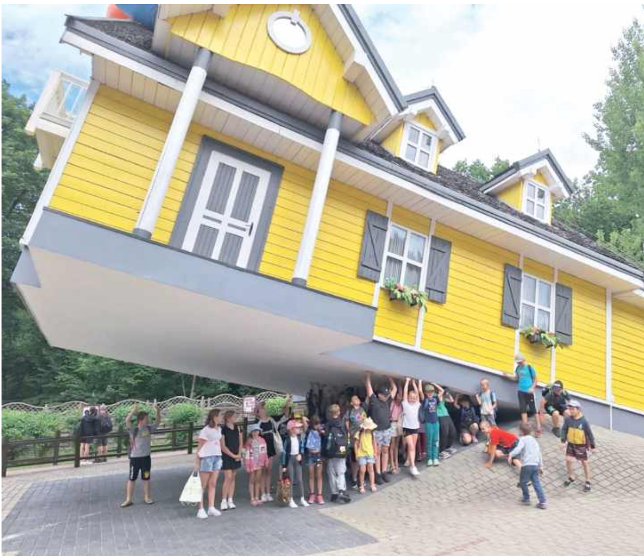
Finansowanie projektu pochodziło ze środków Miejskiej Komisji Rozwiązywania Problemów Alkoholowych i Uzależnień w Łaskarzewie

9 sierpnia dzieci odwiedziły Farmę Iluzji w Mościskach, gdzie skorzystały z licznych atrakcji tego miejsca. Na uzupełnienie programu każde dziecko otrzymało dyplom oraz słodki upominek, co spotkało się z entuzjazmem uczestników.