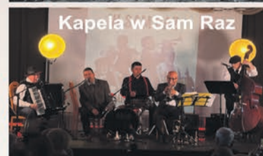
Kapela w Sam Raz