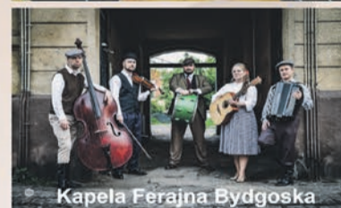
Kapela Ferajna Bydgoska