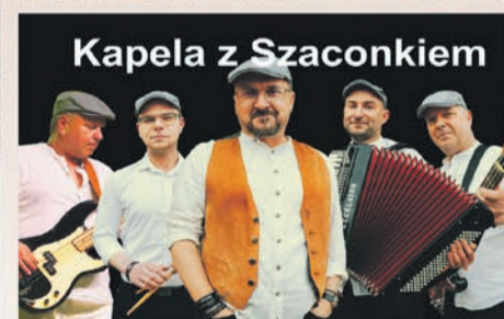
Kapela z Szaconkiem