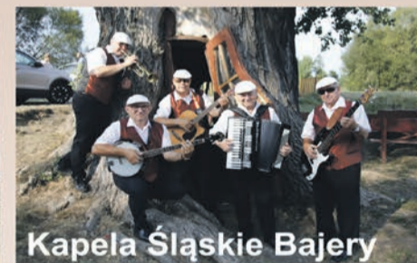
Kapela Śląskie Bajery