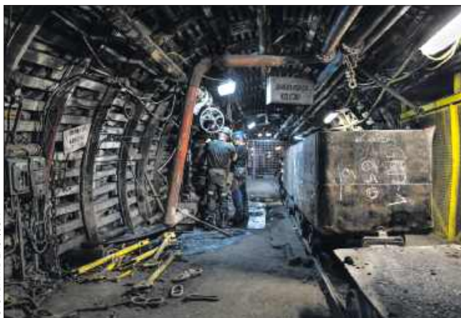
■ Prace konserwacyjne w rejonie podszycia, zdjęcie ilustracyjne

ponad 7 mld zł i obejmowały wynagrodzenia, składki ZUS, premie i dodatkowe świadczenia. Jednym z nich jest PPE, czyli Pracowniczy Program Emerytalny – dodatkowa forma oszczędzania na emeryturę finansowaną przez pracodawcę.