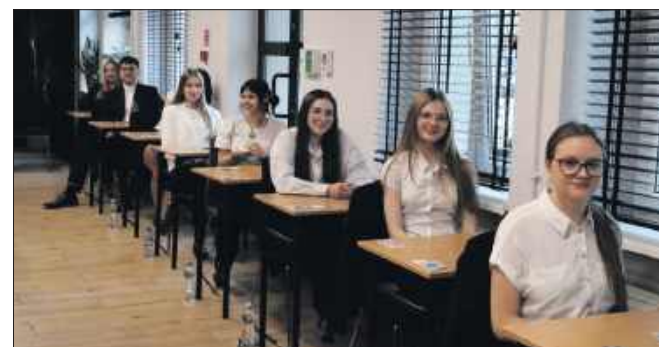
■ Uczniowie i uczennice podeszli do egzaminu z uśmiechem