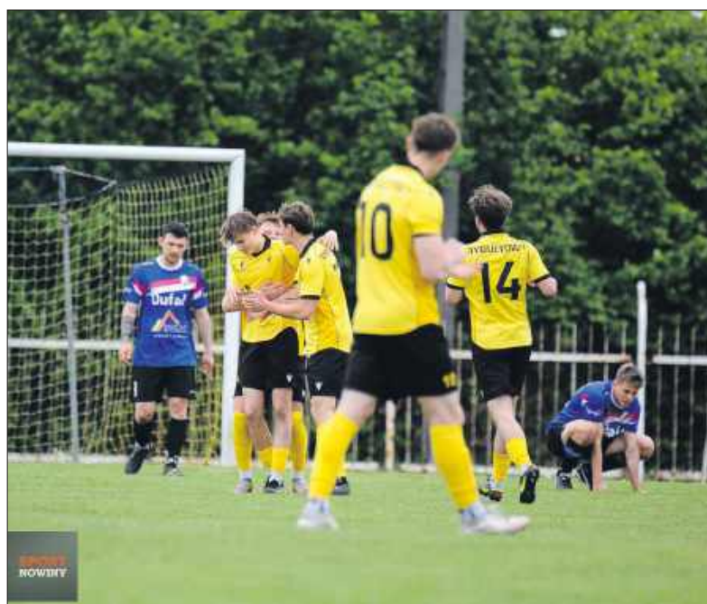
■ Koncertowa pierwsza połowa w wykonaniu Naprzodu Rydułtowy

Po zmianie stron Naprzód kontynuował swoją solidną grę. Gospodarze z dużą konsekwencją realizowali założenia taktyczne, nie pozwalając Jedności na rozwinięcie skrzydeł aż do 75. minuty. Dopiero w ostatnim kwadransie w szeregi rydułtówian wkradło się nieco chaosu. Wykorzystała to ekipa z Jejkowice, która miała wówczas swoje przysłowiowe „pięć minut”, stwarzając spore zagrożenie pod bramką Naprzodu. Na od-