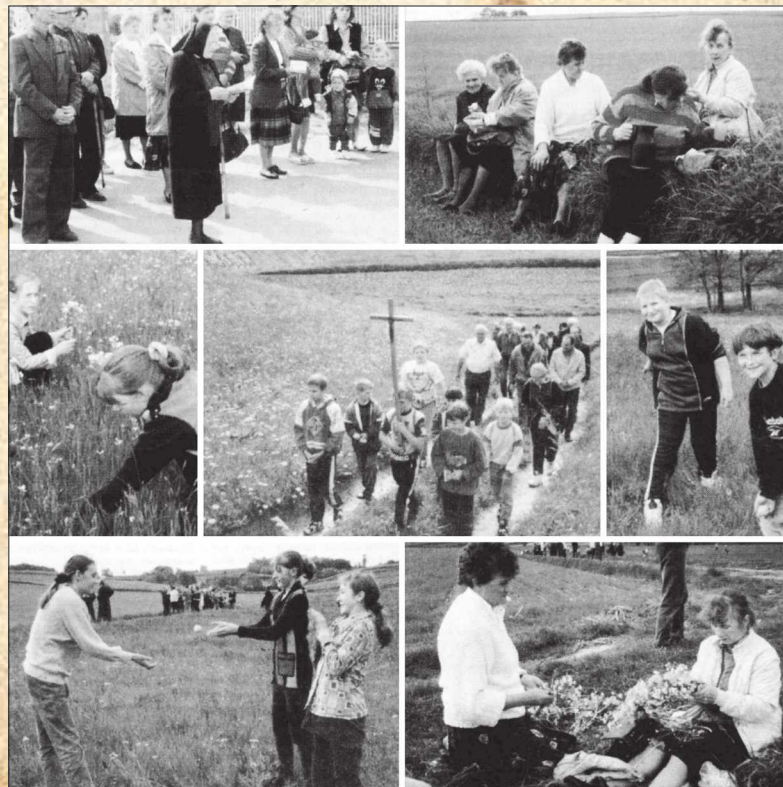
■ Obchody Święta Gradowego w Pogrzebieniu

Następny krzyż, przy którym się zatrzymywała się procesja, znajdował się przy ul. Wiejskiej. Po drodze do procesji dołączyły kolejne osoby. Wszyscy kierowali się w stronę pól, w kierunku lasu Krześnioki. Przez cały czas śpiewali pieśni maryjne. Po dojściu do łąk zwanych Rudawca jej uczestnicy zatrzymali się żeby odpocząć. Siadali na trawie, mieli czas na pogawędkę i posiłek, ale na tę chwilę czekały przede wszystkim dzieci, które zaczęły zabawę