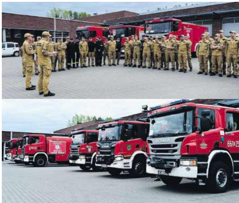
Do akcji zadysponowano kompanię SOŁA składającą się z sił i środków komend miejskich i powiatowych województwa śląskiego.

KRAJ Pożar lasu w Puszczy Solskiej trwał od kilku dni. W czwartek rano do działań skierowano strażaków z województwa śląskiego, w tym z Jastrzębia-Zdroju, Wodzisławia Śląskiego, Rybnika, Raciborza, Rybnika i Żor. Do akcji wyjechała Kompania Gaśnicza SOŁA.