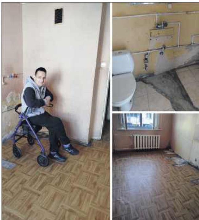
■ Mieszkanie przy Kokoszyckiej wymaga gruntownego remontu