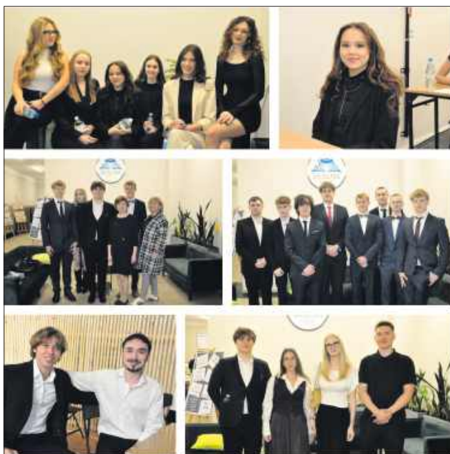
■ Uczniowie ZSLiT przed maturą z języka polskiego