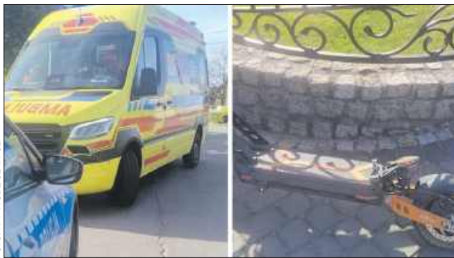
13-latek jadący hulajnogą zderzył się z samochodem i został zabrany do szpitala.

Chłopak nie zachował bezpiecznej odległości i