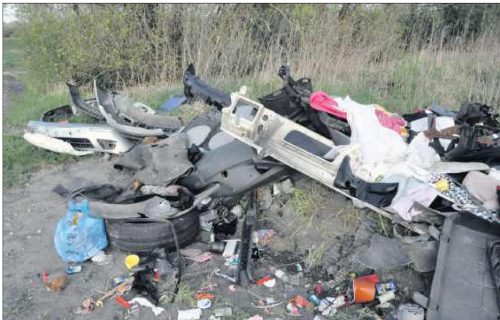
■ Śmieci pomiędzy Bukowem a Syrynią

– Wójt Gminy Lubomia informuje, że w dniu 2 stycznia 2026 r. powziął informację w sprawie porzucenia odpadów (części samochodowych) przy trasie Syrynia – Buków, w pobliżu torów kolejowych, na terenie nieruchomości stanowiącej teren zamknięty (własność: PKP S.A.). Zgodnie z przepisa-