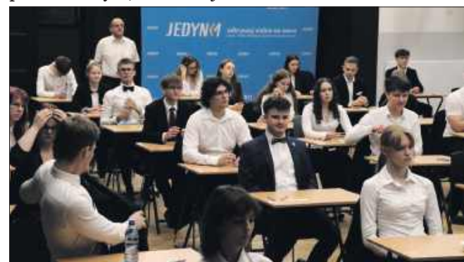
■ W „Jedynce” do matury przystąpiło 280 tegorocznych absolwentów