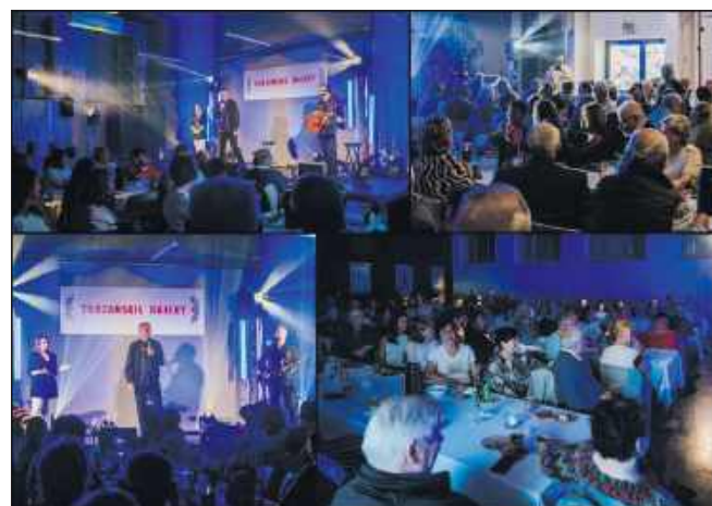
■ Koncert w Turzy Śląskiej odbył się 8 maja