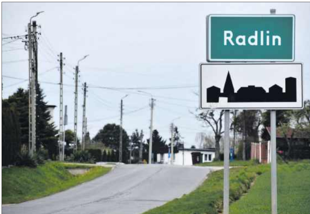
■ Jedna z ważniejszych ulic w Radlinie przejdzie gruntowną przebudowę. Kierowców czekają zmiany w organizacji ruchu.

Z informacji przekazanych przez Starostwo Powiatowe w Wodzisławiu Śląskim wynika, że inwestycja obejmie fragment drogi powiatowej nr 5001S – od skrzyżowania z ul. Rymera do granicy z Wodzisławiem Śląskim. Tymczasowa organizacja ruchu ma zostać wprowadzona 11 maja 2026 r., a roboty będą prowadzone etapami.