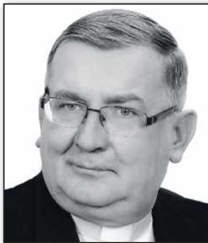
■ W latach 2012–2015 był związany z parafią Matki Bożej Fatimskiej w Turzy Śląskiej, gdzie mieszkał jako rezydent.

W trakcie swojej posługi był wikariuszem również w parafiach w Mysłowicach, Rudzie Śląskiej, Katowicach i Tychach. Pełnił także funkcje kapelana w placówkach opiekuńczych i medycznych. Od 2009 roku związany był z działalnością Caritas Archidiecezji Kato-