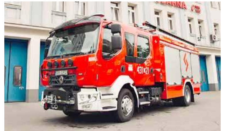
Dzięki decyzji KG PSP Ochotnicza Straż Pożarna Ostrzyca ma dużo większe szanse na zakup nowego wozu

Samochody ratowniczo-gaśnicze są podstawowym narzędziem pracy strażaków - zarówno przy gaszeniu pożarów, jak i podczas interwencji drogowych, lokalnych podtopień czy innych zagrożeń. Nowoczesny sprzęt pozwoli znacząco zwiększyć go-