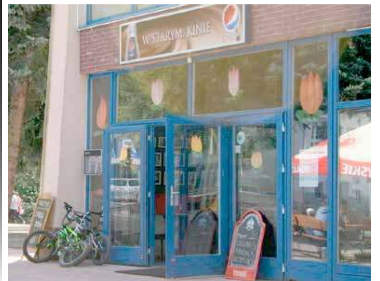
Restauracja W Starym Kinie zostanie zamknięta 15 czerwca br.