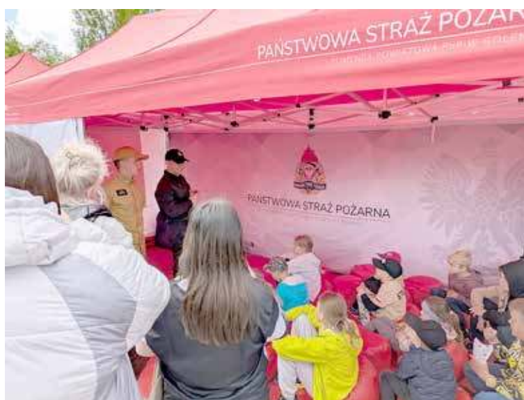
Namiot wystawiony przez naszą PSP cieszył się sporym zainteresowaniem

Uroczystość była również okazją do uhonorowania strażaków i druhów odznaczeniami, awansami funkcjonariuszy na wyższe