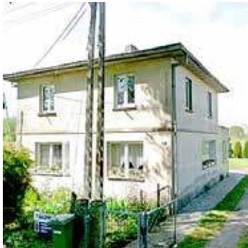
Siedziba filii biblioteki w Strzelewie