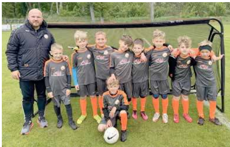
Drużyna zagrała w Resku