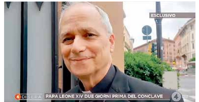
Kadr z nagrania wywiadu a pod nim podpis w języku włoskim - Papież Leon XIV na dwa dni przed Conclave