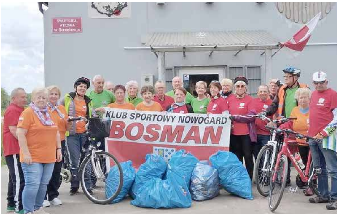
Bosman w Strzelewie