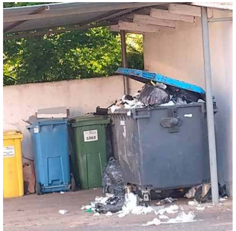
Podwyżki za odbiór śmieci dla mieszkańców, przynajmniej na razie, nie wejdą w życie