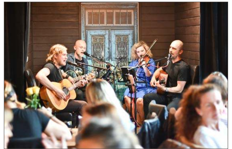
Uczestnicy koncertu pokazali, że serca mają ogromne.