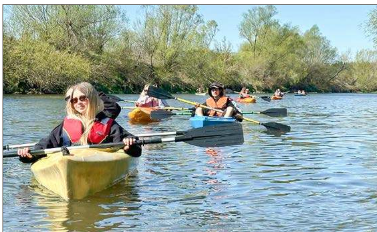
Uczniowie Ekonomika wzięli udział w splywie kajakowym.