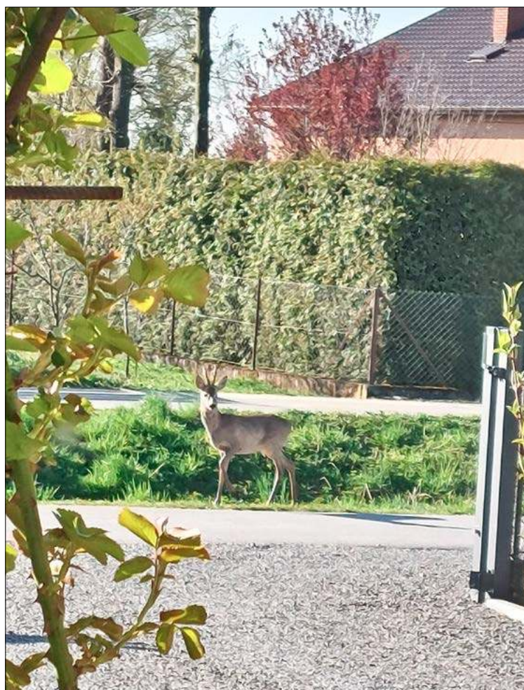
Las bliżej nas.