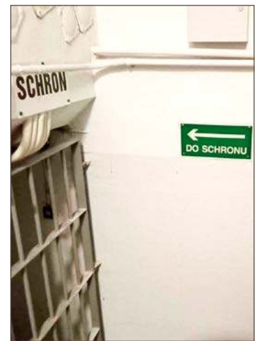
Miasto przygotowuje projekt remontu schronu przy ul. Metalowców.

Na dużo większą kwotę, bo aż 840 tys. zł z tego samego programu, mogła liczyć gmina Dębica. To dofinansowanie pozwoli na powstanie w Nagawczynie nowoczesnego centrum logistycznego obrony cywilnej. Na ten cel przebudowany i rozbudowany zostanie budynek, w którym mieści się remiza OSP. Jego powierzchnia zwiększy się ze 135, do 222,5 m 2 , a kubatura do