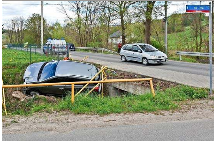
Suzuki wypadło z drogi i wylądowało w rowie.

Następnego dnia doszło do zderzenia w Zawierzbiu. Kierujący Audi 20-letni mieszkaniec gm. Czarna nie zachował ostrożności i najechał na tył Suzuki, którym kierowała 40-letnia mieszkanka Dębicy. Kobieta podróżowała z 9-letnią