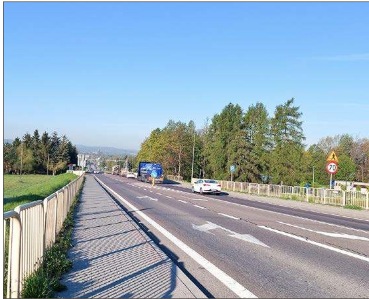
Pomiar ruchu przed rokiem był prowadzony także w Parkoszu.

- Machowa - 10 024 (2025), spadek o 193 (2%)