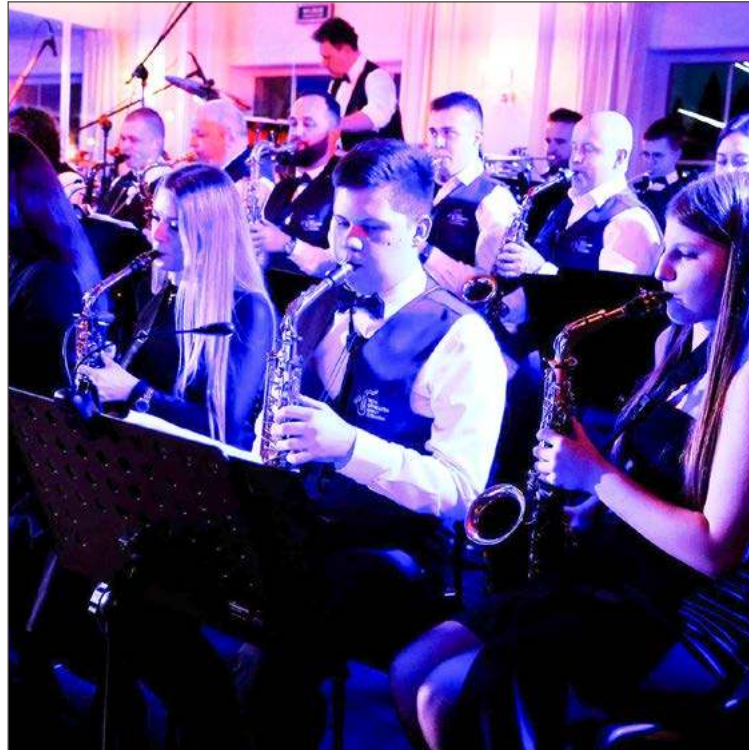
Orkiestra Dęta Gminy Żyraków dostała najwięcej.

Pozostałe podmioty wnioskowały o dotacje w wysokości 3,4 tys. zł. Taką kwotę dostaną: Stowarzyszenie Razem Zdziałamy Więcej na zadanie: Malując tradycję - plener młodych artystów Podkarpacia, Stowarzyszenie Góra Możliwości