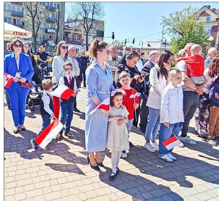
Na Rynek przyszedli mieszkańcy miasta i powiatu.