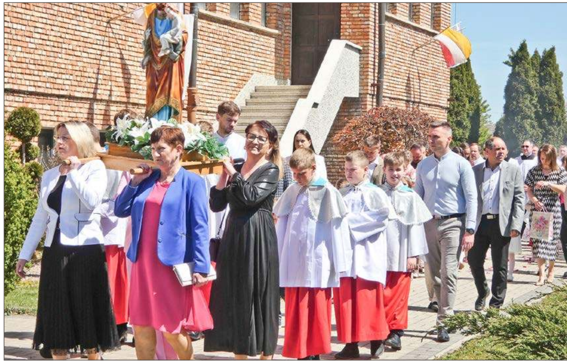
Uroczystości jubileuszowo-odpustowe w Słotowej zakończyły się procesją wokół kościoła.