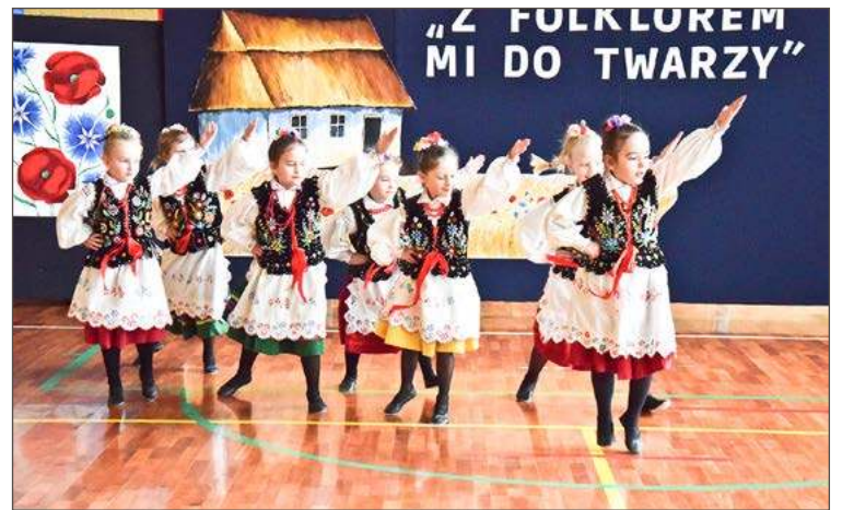
Dzieci udowodniły, że z folklorem im do twarzy. Więcej zdjęć z wydarzenia publikujemy na naszym portalu debica24.pl.

W kategorii I zwyciężył Oddział Przedszkolny z Brzeźnicy, drugie miejsce wywalczyła Folkowa gromada z Publicznego Przedszkola nr 10 w Dębicy, a na trzecim upla-