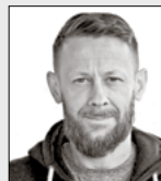
krol@ol.com.pl tel. 14 670 27 87