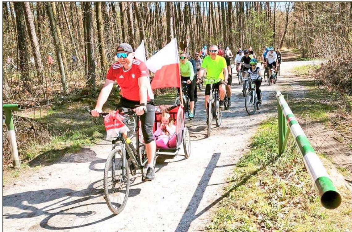
Pogoda tym razem uczestnikom rowerowego rajdu w gminie Czarna bardzo sprzyjała.

- Trochę na wariackich papierach było to wszystko i na ostatnią chwilę, ale najważniejsze, że impreza się