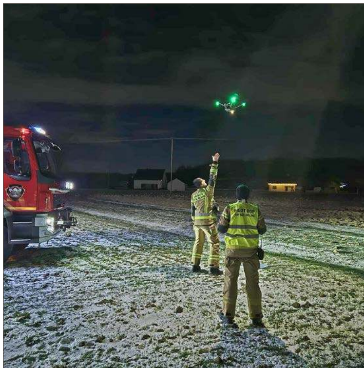
Operatorzy drona z Łęki Dolnych podczas akcji w Strzegocicach.

Dlatego w tym roku przyłączyli się do ogólnopolskiej akcji fundacji Siepomaga.pl Razem dla strażaków i prowadzą własną skarbonkę. Zebrane pieniądze przeznaczyć chcą m.in. na zakup modułowej przyczepy pożarnej, na którą muszą wydać 80 tys. zł, ale 50 tys. zł pochodzić ma z dotacji Fundacji Orlen. Pieniądze potrzebne są im też na wyszkolenie kolejnych pięciu operatorów drona (koszt około 10 tys. zł), a także zakup zestawu