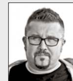
ratuszniak@ol.com.pl tel. 14 670 27 80