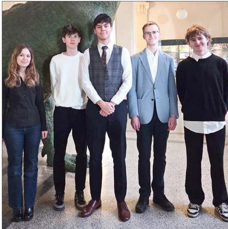
Uczestnicy olimpiady z geografii.