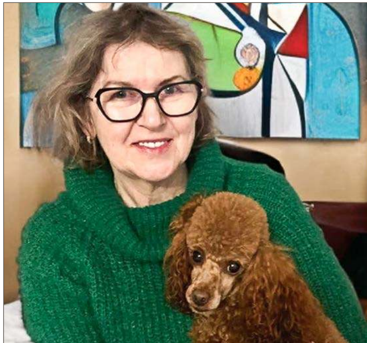
Rambo został uratowany dzięki szybkiej reakcji swojej opiekunki.