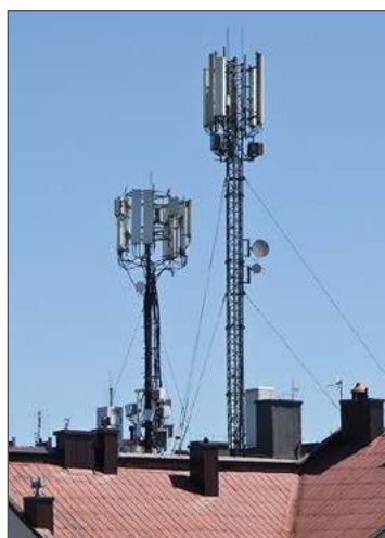
Na budynku w Ryнку w Dębicy nadajnik 5G ma sieć Play.

T-Mobile: Bukowa (Góry), Dębica (ul. Fabryczna, ul. Krakowska, ul. Piłsudskiego, ul. Przemysłowa), Dobrków 63, Głębikowa (Kamieniec), Jodłowa (Pańskie Pola), Kamienica Górna (przy granicy z Wolą Brzosteką), Paszczyzna (w pobliżu cmentarza), Pilzno (ul. Węgierska, ul. Legionów), Pustków (przy drodze na Krownice), Pustków-Osiedle (GOSiR), Róża (naprzeciw remizy