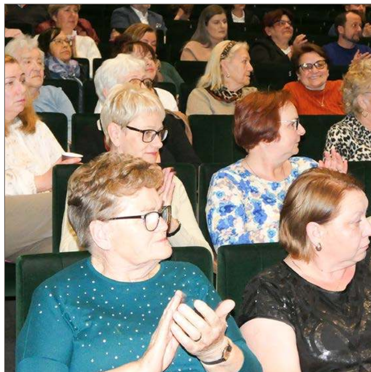
W sali widowiskowej w DK Śnieżka zgromadziło się blisko sto osób.

I jak już ktoś trafi z nią na SOR z powikłaniami, to okazuje się, że rozwijała się przez lata. Bo w niej nasza trzustka produkuje insulinę, ale ta nie działa tak, jak powinna. Trzeba ją wspomagać. Najlepiej