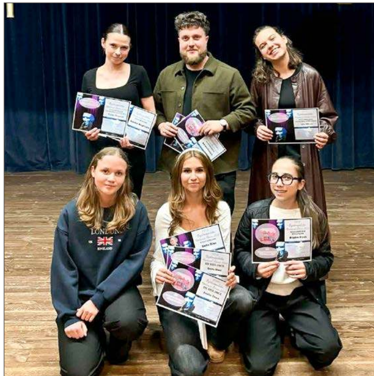
Reprezentacja Miejskiego Ośrodka Kultury w Lubaczowie.