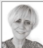
majba@ol.com.pl tel. 14 670 27 87

Nasi dziennikarze czekają na Twoje zgłoszenie