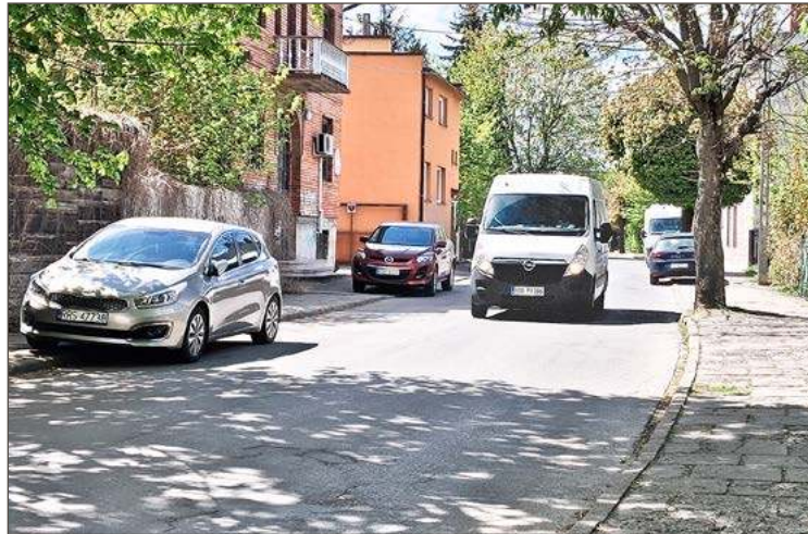
Po wakacjach ruch będzie odbywał się od Krakowskiej do Koehlich.

zostaną skośne miejsca parkingowe. Ten zabieg – jak podkreśla burmistrz – jest celowy.