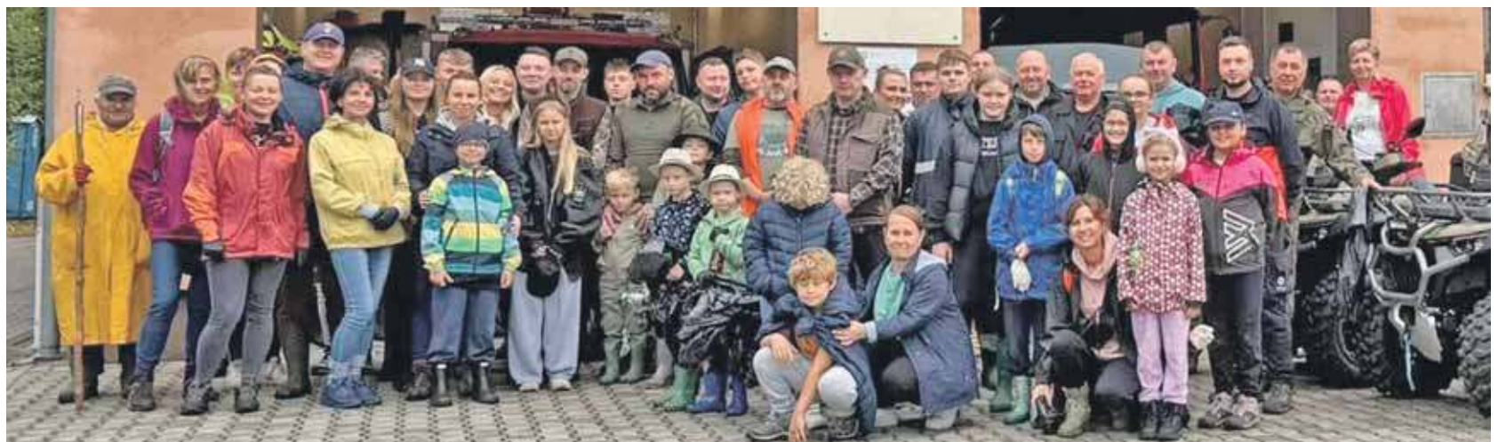
Rada dzielnicy Pniowiec zorganizowała akcję „Razem dla czystego lasu”

Mimo chłodu i deszczowej pogody las sprzątało ok. 120 osób, z czego jedna trzecia to były dzieci. – Z ogromnym zaangażowaniem i uśmiechem dołożyły swoją cegiełkę do dbania o naszą przyrodę – zaznacza pniowiecka rada dzielnicy.