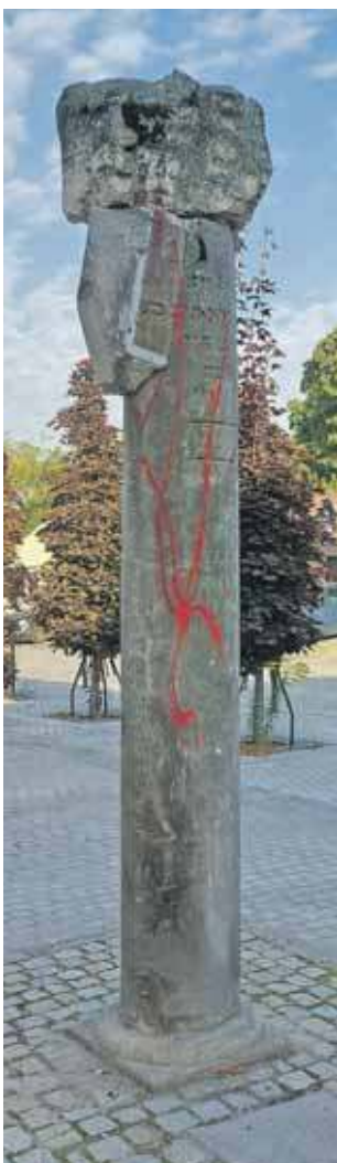
Sprawa została zgłoszona policji