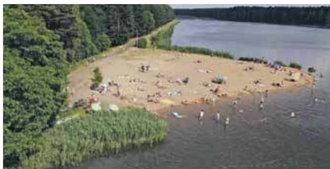
Większy pomost będzie miał długość 80 metrów, ma prowadzić w głąb stawu od czubka półwyspu, na którym znajduje się plaża