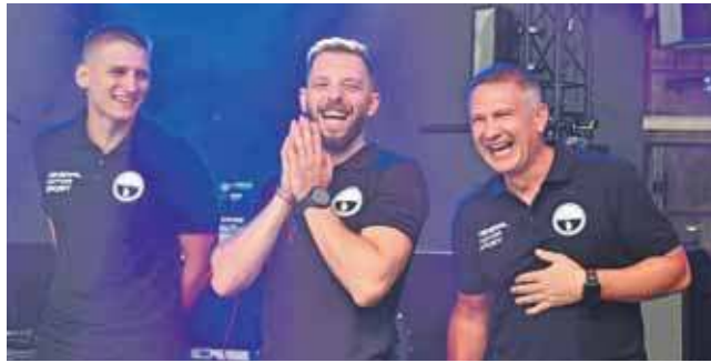
13 września ekipa KKS Tarnowskie Góry zaprezentowała się na scenie Gwarków

Pierwszy mecz z MKS II Dąbrowa Górnicza KKS rozegra u siebie, w hali sportowej w Tarnowskich Górach – w niedzielę, 21 września,