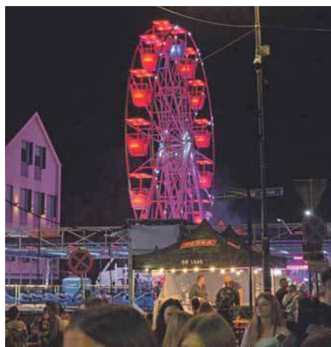
Koło Panoramica – wstęp 20 zł

W Tarnowskich Górach w piątkowy wieczór wystąpił na scenie głównej jako ostatni. Koncert na Gwarkach przyciągnął tłumy.