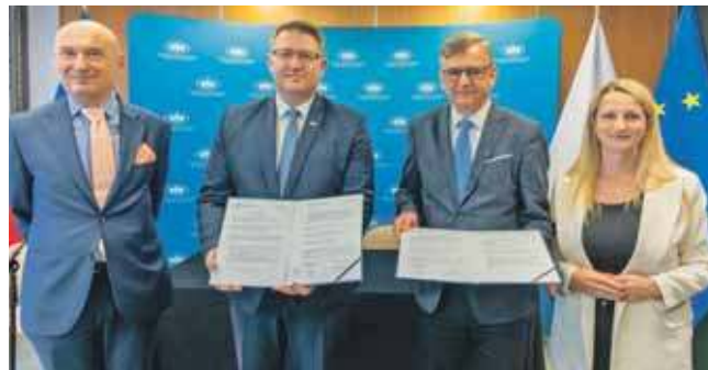
Bezpłatne porady prawne są realizowane w ramach podpisanego 8 sierpnia porozumienia WFOŚiGW w Katowicach z Izbą Adwokacką w Katowicach

W inicjatywę mocno zaangażowali się przedstawiciele katowickiej palestry. – Ludzie mogą nie rozumieć dokładnie sytuacji, w której się znaleźli.