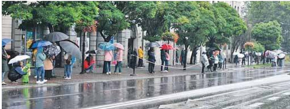
Publiczność oczekująca na pochód na ul. Piłsudskiego