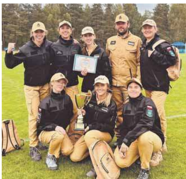
Wśród kobiet wygrała OSP Potępa

– Dla naszej jednostki jest to historyczne zwycięstwo, ponieważ pierwszy raz w dziejach męskiej drużyny pożarniczej udało się wywalczyć tytuł mistrzowski na szczeblu powiatowym – zaznaczają przedstawiciele OSP Potępa. Jeżeli chodzi o drużyny, miejsca na podium to dla nich nie pierwszorzędne. Mają już na koncie tytuł wicemistrzyni Polski. (ESP)