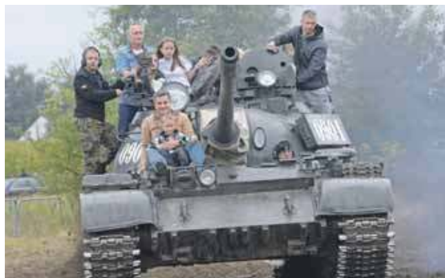
Dużym zainteresowaniem cieszyły się jak zwykle przejażdżki wozami bojowymi

PT-91 Twardy to czołg podstawowy, opracowany w latach 90. XX wieku jako modernizacja produkowanego na licencji T-72M1. Uzbrojony jest w 125 mm armatę gładkolufową i czołgowy karabin maszynowy 7,62 mm. Ponad 230 maszyn trafiło do Sił Zbrojnych RP, 49 do Malezji. (MIR)