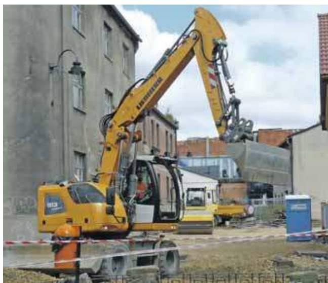
Prace potrwać w tym i przyszłym roku