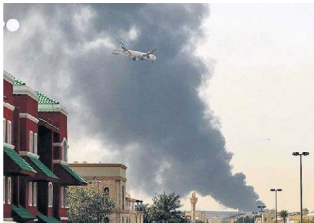
Amerykane nigdzie nie mogą czuć się bezpiecznie. Pokazał to irański atak na ambasadę USA w Bagdadzie

To kolejny atak na ambasadę USA w Iraku. W sobotę placówka została trafiona przez irański pocisk rakietowy. W poniedziałek wieczorem w pobliżu budynku ambasady doszło do ataków i wybuchów. Z powodu uderzenia drona wybuchł pożar na dachu hotelu w pobliżu placówki, ale nie spowodował on strat i szkód. PAP