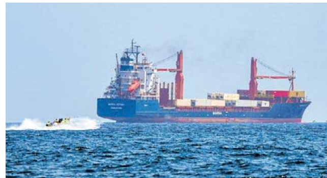
Większość sojuszników USA jest niechętna interwencji w Cieśninie Ormuz

Potwierdził to także kanclerz Friedrich Merz. - Brakuje mandatu ONZ, Unii Europejskiej lub NATO, wymaganego zgodnie