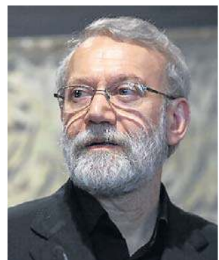
Ali Laridżani był jednym z najważniejszych irańskich polityków

- Laridżani i przywódca Basidż zostali wyeliminowani w nocy (z poniedziałku na wtorek - PAP) i dołączyli do przywódcy programu zagłady (poprzedniego najwyższego przywódcy duchowo-politycznego Iranu, ajatollaha Alego) Chameneiego, i wszystkich innych wyeliminowanych członków osi zła, w piekle - powiedział Israel Kac, minister obrony narodowej Izraela.