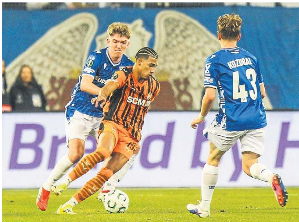
W pierwszym meczu 1/8 finału Ligi Konferencji w Poznaniu Lech okazał się gorszy od Szachtara i przegrał 1:3. W „Kolejorzu” wciąż jednak wierzą w awans do ćwierćfinału

Gdy pytaliśmy z kolei o tę współpracę w ukraińskim klubie usłyszeliśmy, że w Szachtarze też są bardzo zadowoleni. Ukraińcy podkreślają bardzo mocno, że Wisła dedykowała dla nich bardzo