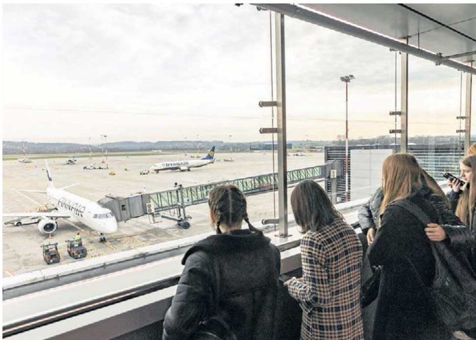
Lotnisko w Balicach będzie mogło obsługiwać 20 milionów pasażerów rocznie

„Zmiana przepisów ICAO dotyczących wymaganego oświetlenia nawigacyjnego dla CAT II otworzyła drogę do cer-