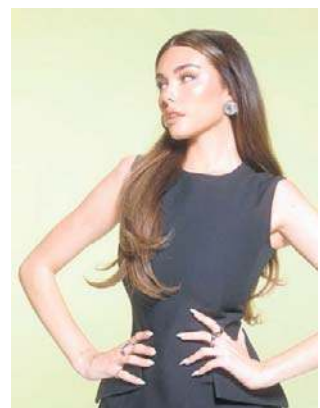
Madison Beer ma polsko-żydowskie korzenie

Jej historia to współczesna bajka o Kopciuszku ery cyfrowej. W 2012 roku Madison Beer, mając zaledwie 13 lat, wrzuciła na YouTube cover utworu „At Last” Etty James. Nagranie trafiło do Justina Biebera, który