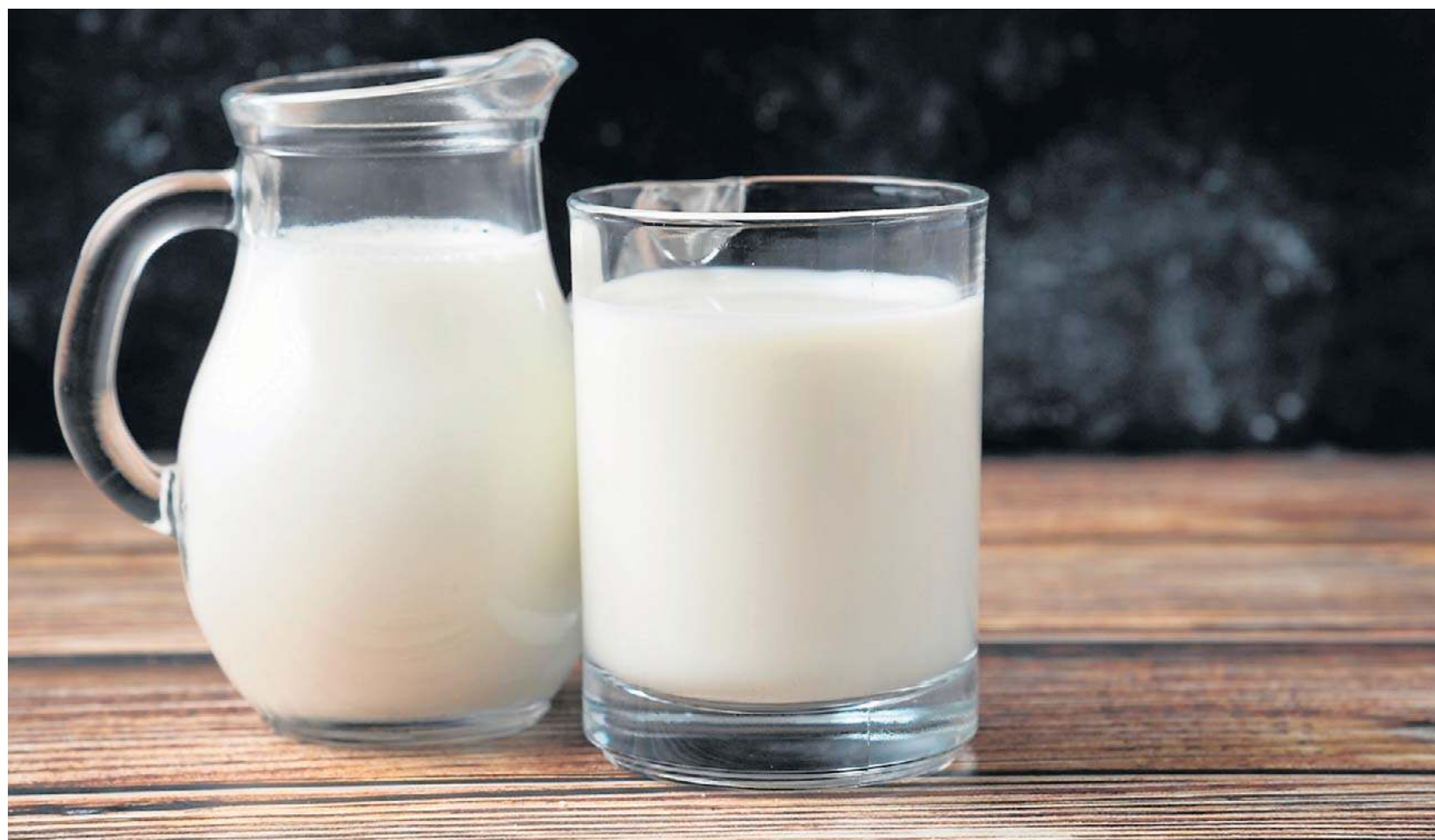
W utrzymaniu nawodnienia mleko okazało się bardziej skuteczne niż woda

Jeszcze bardziej kompleksowe było badanie z 2016 roku, opublikowane w American Journal of Clinical Nutrition, w którym porównano 13 różnych napojów