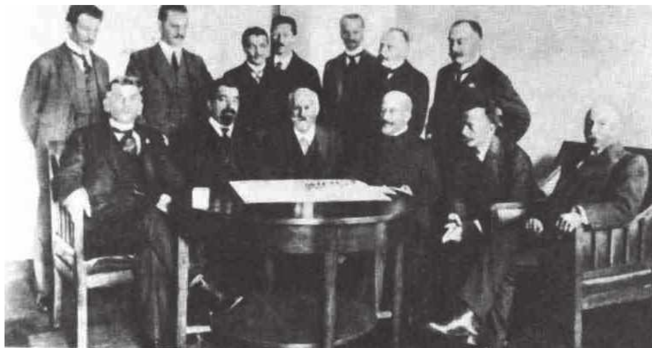
Członkowie NKN, 1914

W roku 1901 został członkiem Rady Powiatowej PSL w Tarnowie, a dwa lata później wybrano Witos do Rady Naczelnej stronnictwa. Od 1909 roku był także, nieprzerwanie do roku 1931, wójtem Wierzchosławic. Od początku swojej politycznej działalności Witos pragnął