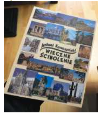
Książka opublikowana przez Wydawnictwo TiO. Do nabycia w księgarni „U Leszka” - Legionowo, Stefana Batorego 10

Widz kinowy życzy powodzenia całej trójce i czuje się zawiedziony widząc w ostatniej scenie obu dżentelmenów