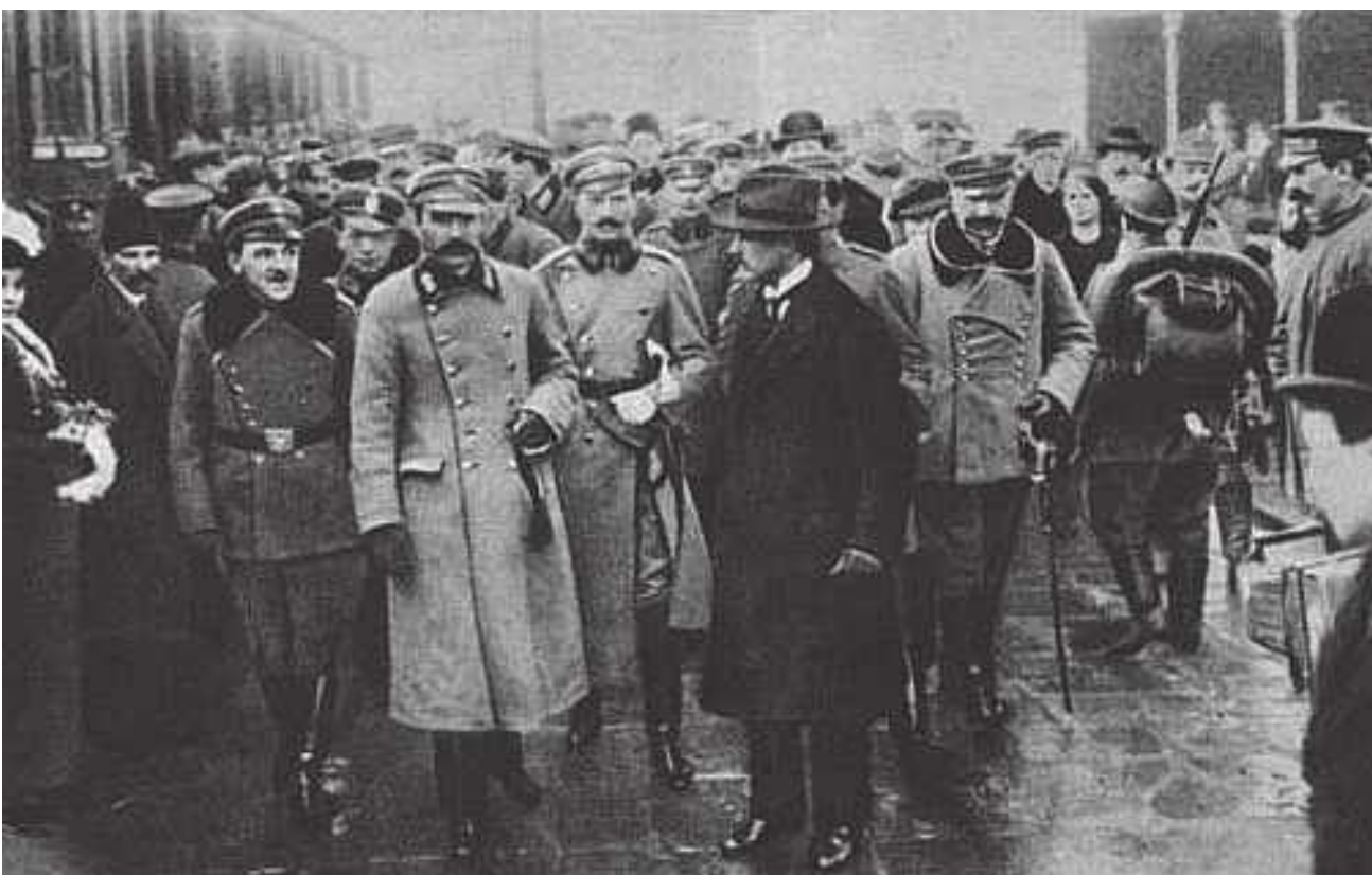
Powitanie Józefa Piłsudskiego w Warszawie 12 grudnia 1916 roku