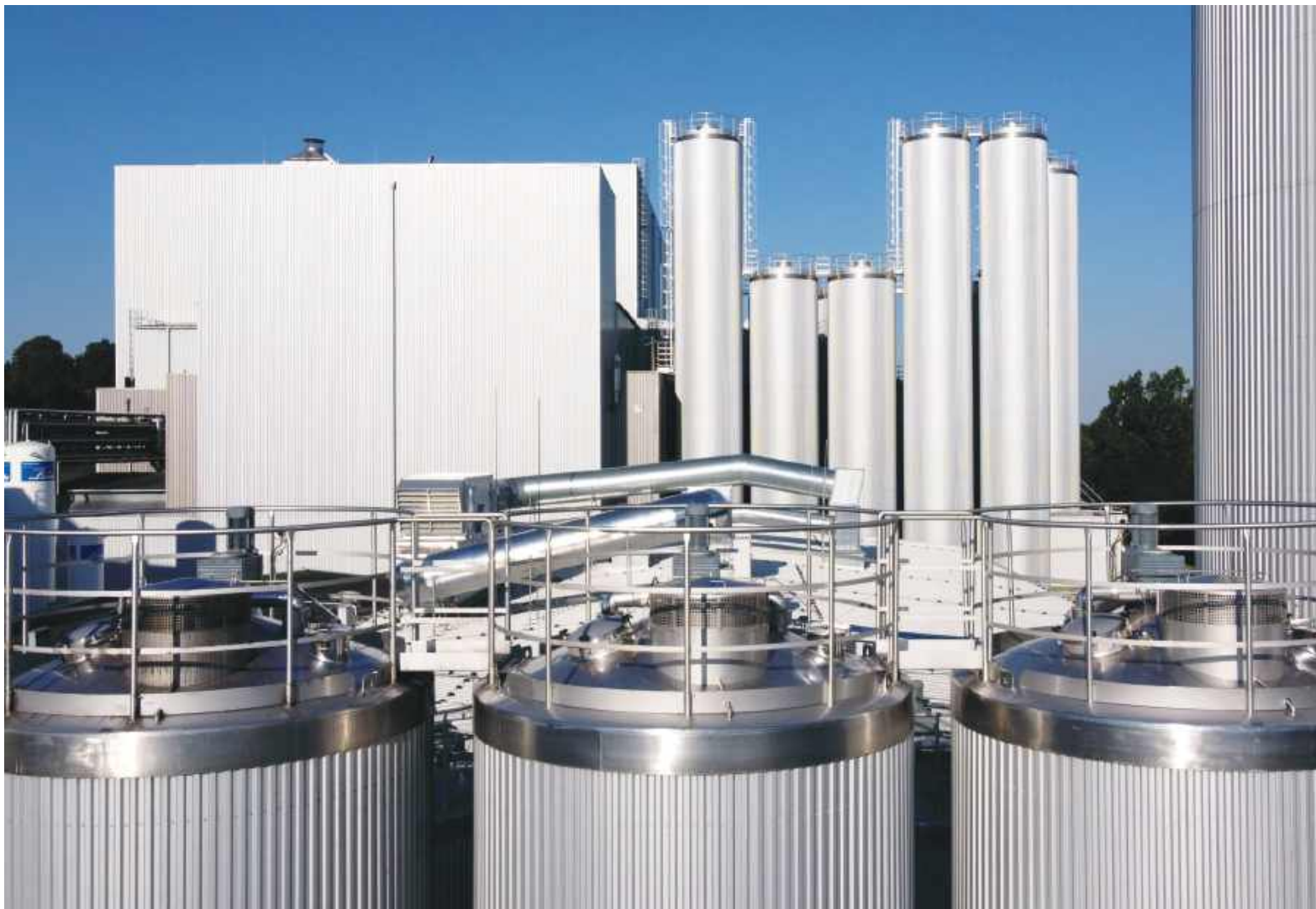
Grupa Polmlek - zakład w Lidzbarku Warmińskim