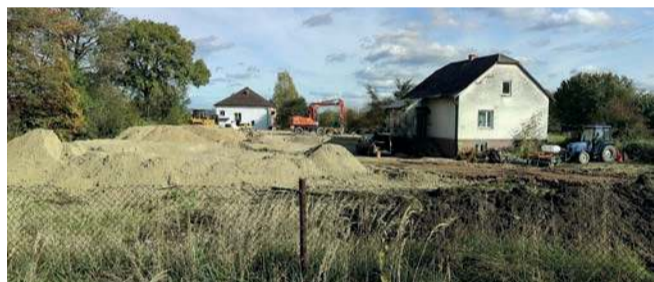
Plac budowy przy Chrzanowskiej w Balinie

Przy ul. Chrzanowskiej w Balinie powstaje budynek handlowo-usługowy. Chodzi o działkę w sąsiedztwie kościoła Chrystusa Króla.