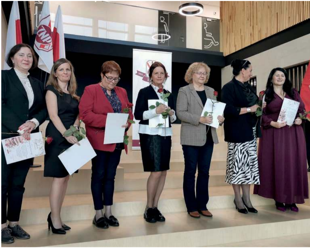
Wyróżnieni członkowie trzebińskiego oddziału ZNP. Więcej zdjęć i wideo na przelom.pl

Kiedyś walczył o prawo do nauczania w języku polskim. Dziś skupia się na obronie praw środowiska oświatowego. Związek Nauczycielstwa Polskiego obchodzi 120 lat istnienia. W Trzebini mają powody do świętowania jeszcze jednego jubileuszu.