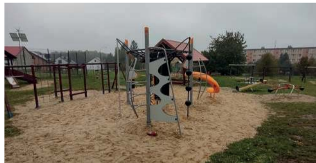
Nowe zabawki na osiedlu Chemików w Alwerni

Udało się wykonać inwestycję z Budżetu Obywatelskiego Miasta Alwernia na 2025 r. To częściowa wymiana urządzeń na placu zabaw na osiedlu Chemików.