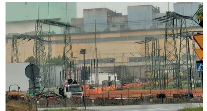
Inwestycję realizuje firma Electrim

Budownictwo energetyczne w pełnym rozkwicie. Na terenie elektrowni Siersza, na granicy z Czyżówką, trwa rozbudowa.