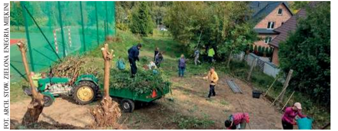
Wolontariusze posprzątała zbozce przy szkole w Miękinii