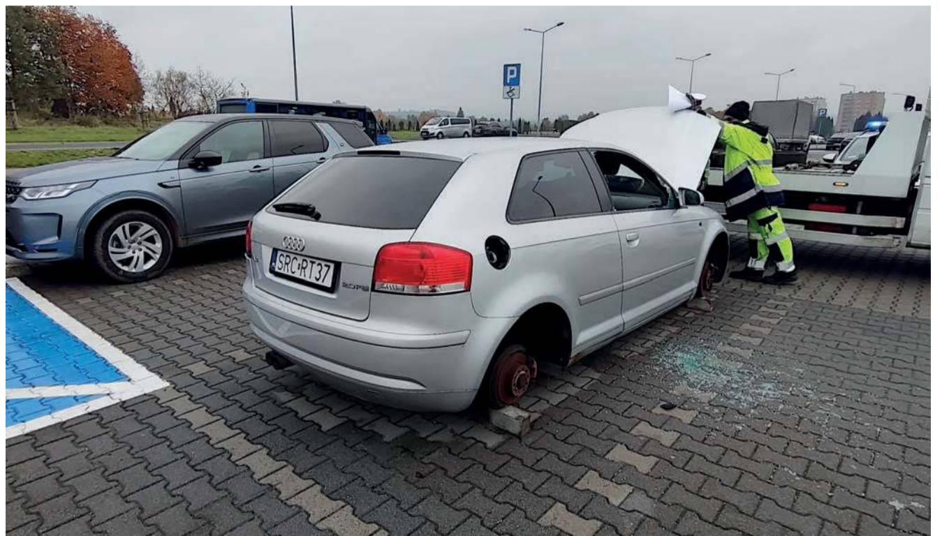
Odholowywanie porzuconego audi z parkingu przy ul. ks. Kamińskiego w Chrzanowie

CHRZANÓW. Audi A3, bez kół i z wybitymi szybami, stało przez kilka tygodni na parkingu między cmentarzami przy ul. ks. Kamińskiego. Gmina zleciła usunięcie pojazdu.