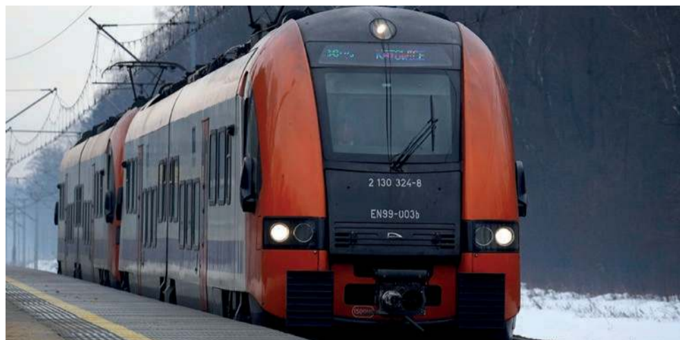
Pociąg relacji Kraków - Katowice

- W porozumieniu z panem marszałkiem województwa małopolskiego Łukaszem Smółką zamierzamy wystąpić z wnioskiem do przedstawicie-