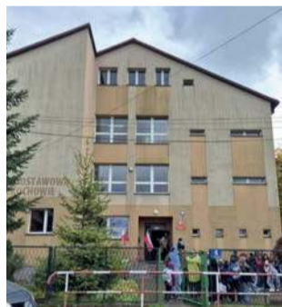
W szkole podstawowej w Rozkochochowie uczy się obecnie 180 dzieci

Poza zajęciami programowymi mają cztery godziny angielskiego, zajęcia kulinarne, jazdę konną, zumbę czy nawet naukę języka migowego – wylicza dyrektorka.