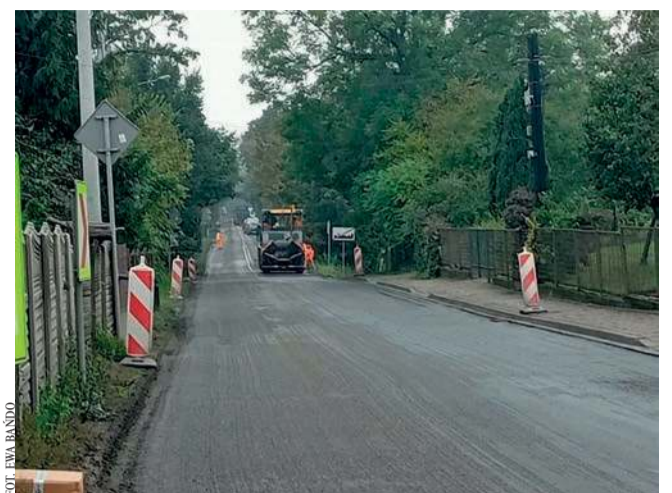
Podczas prac prowadzonych na drodze wojewódzkiej w Jankowicach

Na ostrym zakręcie drogi wojewódzkiej 781 w Jankowicach, gdzie od lat dochodzi do dramatycznych wypadków, rozpoczęły się prace mające poprawić bezpieczeństwo.