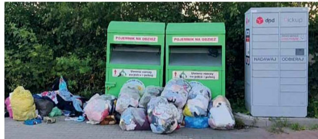
To częsty widok przy pojemnikach z odzieżą.

Nie ma tygodnia, abym nie interweniowała – często na Waszą prośbę – w sprawie rozrzuconej odzieży wokół pojemników na ubrania znajdujących się przy „nowej” Biedronce lub przy Netto. Przyznacie, że taki widok nie należy do najprzyjemniejszych - pisze na swoim profilu na FB radna Agnieszka Siuda.