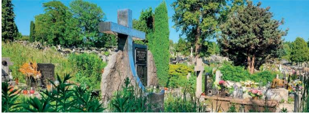
Pomnik ofiar bombardowania rafinerii

Zbliża się święto zmarłych, a wraz z nim częstsze wizyty na cmentarzach, porządkowanie grobów. Będąc tam pamiętajcie nie tylko o grobach swoich bliskich, ale ogarnijcie też te sąsiednie, zarosnięte trawą, opuszczone. Zapalcie na nich świeczkę. Niech trwa pamięć o wszystkich; znanych i nieznanym, mniej lub bardziej świętych ludziach.