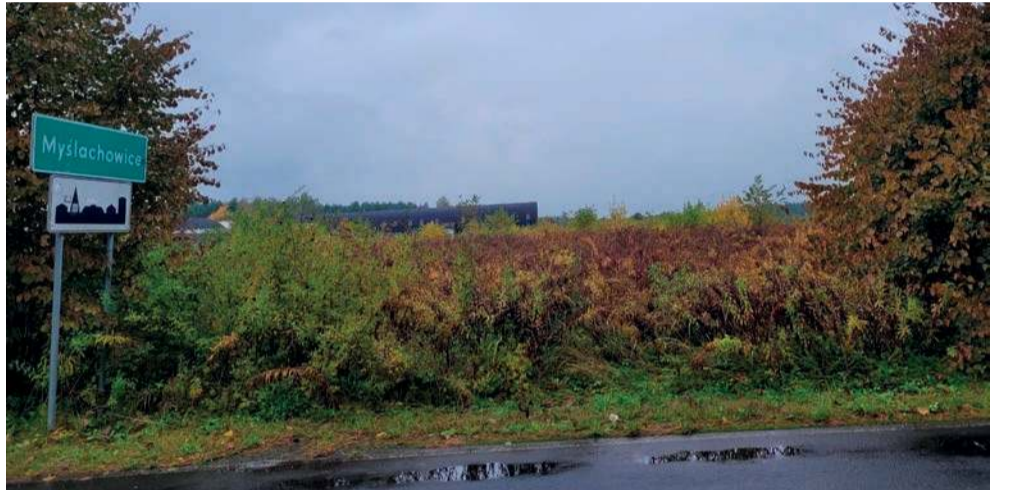
Po tej stronie ul. Płockiej w Myślachowicach, na obszarze ok. 4 ha, powstają magazyny energii wybudowane w technologii należącej do amerykańskiej firmy Fluence na zlecenie firmy DRI. Podobny produkt nie miał jeszcze zastosowania w innym miejscu. Fluence zapewnia, że bazuje na najnowocześniejszych, bezpiecznych rozwiązaniach