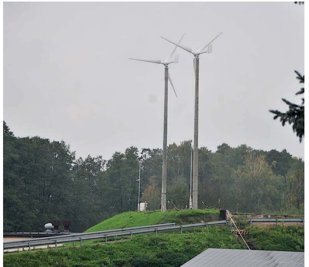
Turbiny wiatrowe na terenie oczyszczalni ścieków w Libiążu

- Jedna megawatogodzina, wytworzona i skonsumowana na miejscu, to zaoszczędzone około tysiąc złotych, więc w przypadku 40 megawatogodzin z turbin wiatrowych wy-