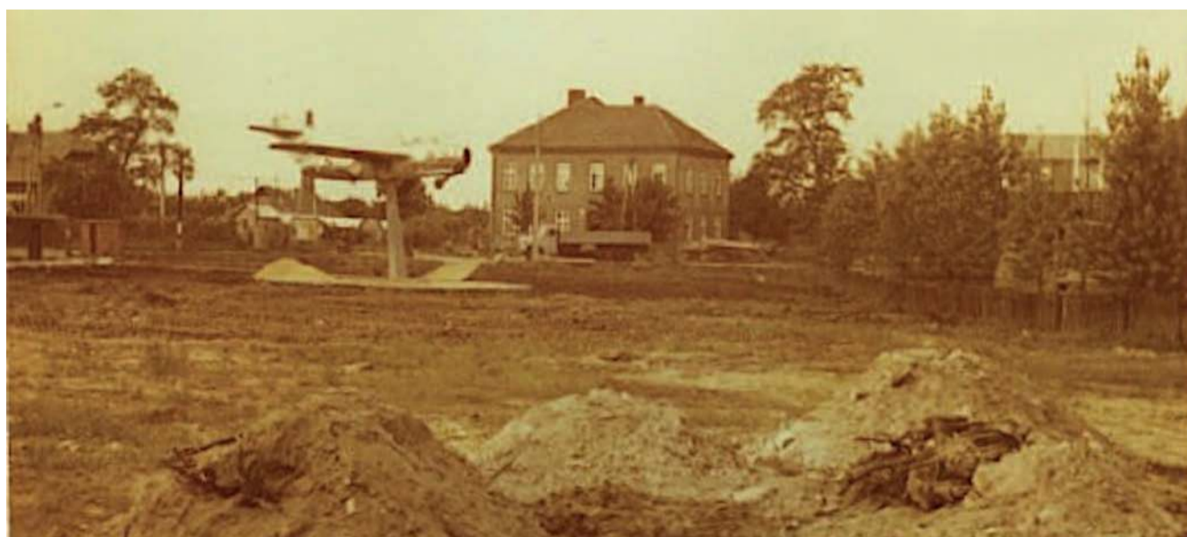
Nieistniejący pomnik w Libiążu - samolot bojowy Lim-1

Archiwalne zdjęcie pokazuje samolot Lim-1, który stał na skwerze naprzeciwko urzędu miejskiego i domu handlowego Agat w Libiążu.