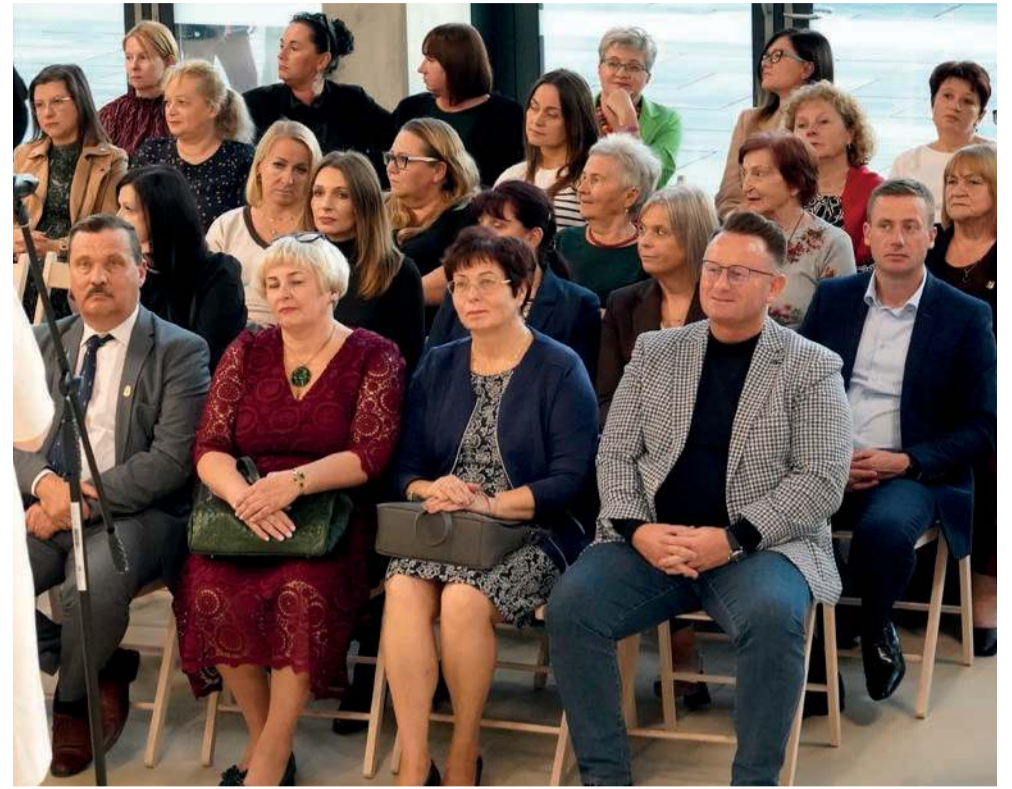
Podczas trzebińskich obchodów jubileuszu ZNP

W przeszłości związek tworzyły liczne ogniska w placówkach szkolnych i przedszkolnych. Dziś skupia blisko stu