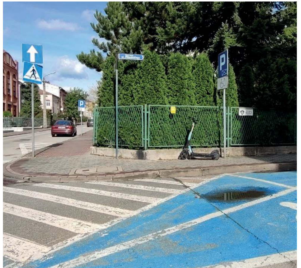
Niepełnosprawni kierowcy nie muszą płacić za postój na niebieskich kopertach