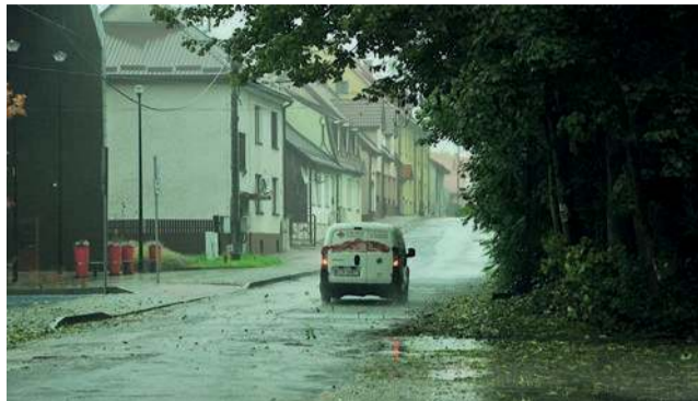
Wkrótce rozpocznie się remont ul. Korycińskiego w Alwerni

W najbliższych dniach ma się rozpocząć modernizacja ul. Korycińskiego w Alwerni. To szosa powiatowa, przecinająca Rynek. Będą utrudnienia w ruchu.