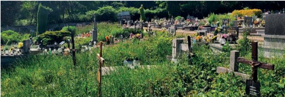
Groby z dawnych lat na cmentarzu w Trzebini latem tego roku