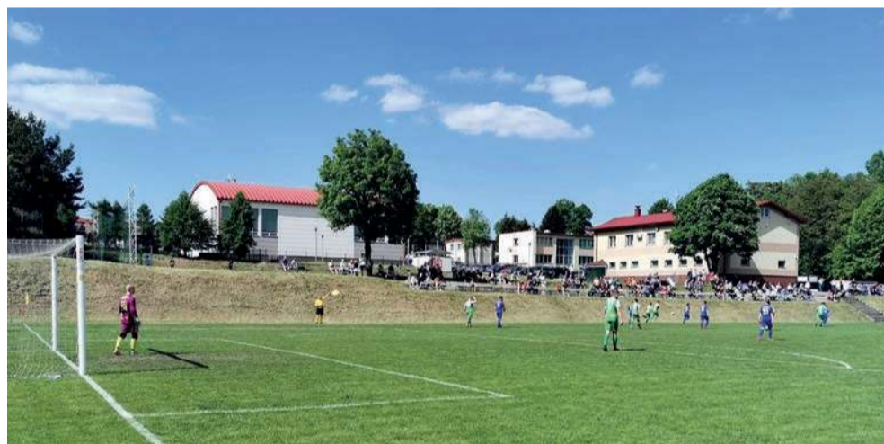
Na boisku w Myślachowicach przez dłuższy czas nie obejrzymy meczu piłkarskiego