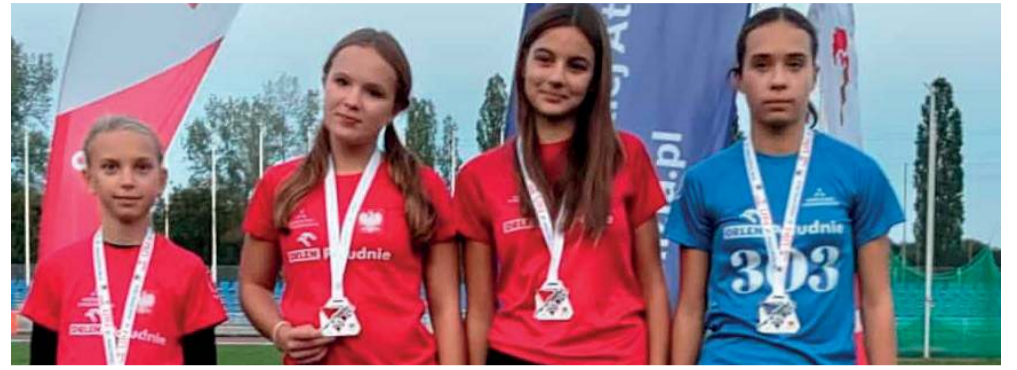
Brązowa sztafeta.

Znakomicie zaprezentowali się młodzi sportowcy KS Victoria Trzebinia podczas Mistrzostw Małopolski U10–U12–U14 w Krakowie.