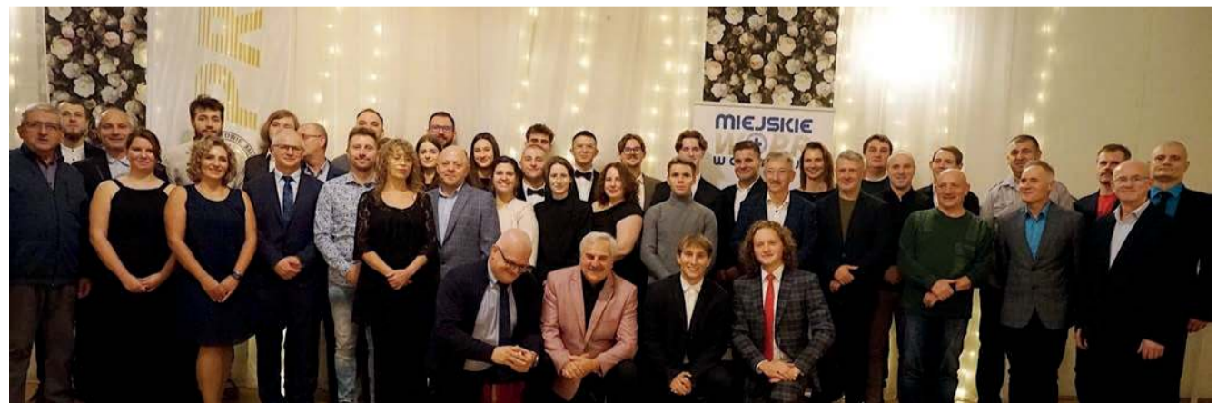
Członkowie Miejskiego WOPR w Chrzanowie podczas jubileuszu

- Nasza organizacja powstała z buntu młodych ludzi przeciwko zastanej rzeczywistości. Chcieliśmy propagować ideały, które były nam bardzo bliskie. Chcieliśmy, żeby ludzie czuli się nad wodą naprawdę bezpiecznie, jak również żeby bezpieczeństwo