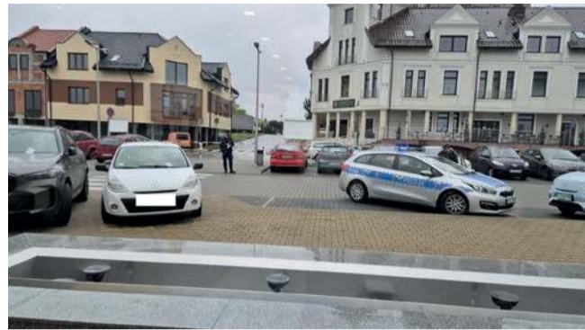
Interwencja policji pod basenem w Libiążu

na miejscu, ujawnili sześć pojazdów zaparkowanych w nieprawidłowy sposób. Z uwagi na okazaną skrucę zastosowano wobec każdej osoby środek oddziaływania wychowawczego w postaci pouczenia - informuje sierż. sztab. Kinga Korbel, oficer prasowy KPP w Chrzanowie.