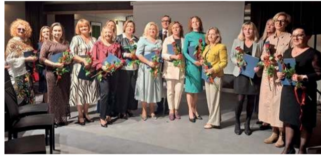
Nagrodzeni nauczyciele w Libiążu

Jeden dyrektor szkoły i trzynastu nauczycieli z gminy Libiąż otrzymało w tym roku nagrody burmistrza z okazji Dnia Edukacji Narodowej.