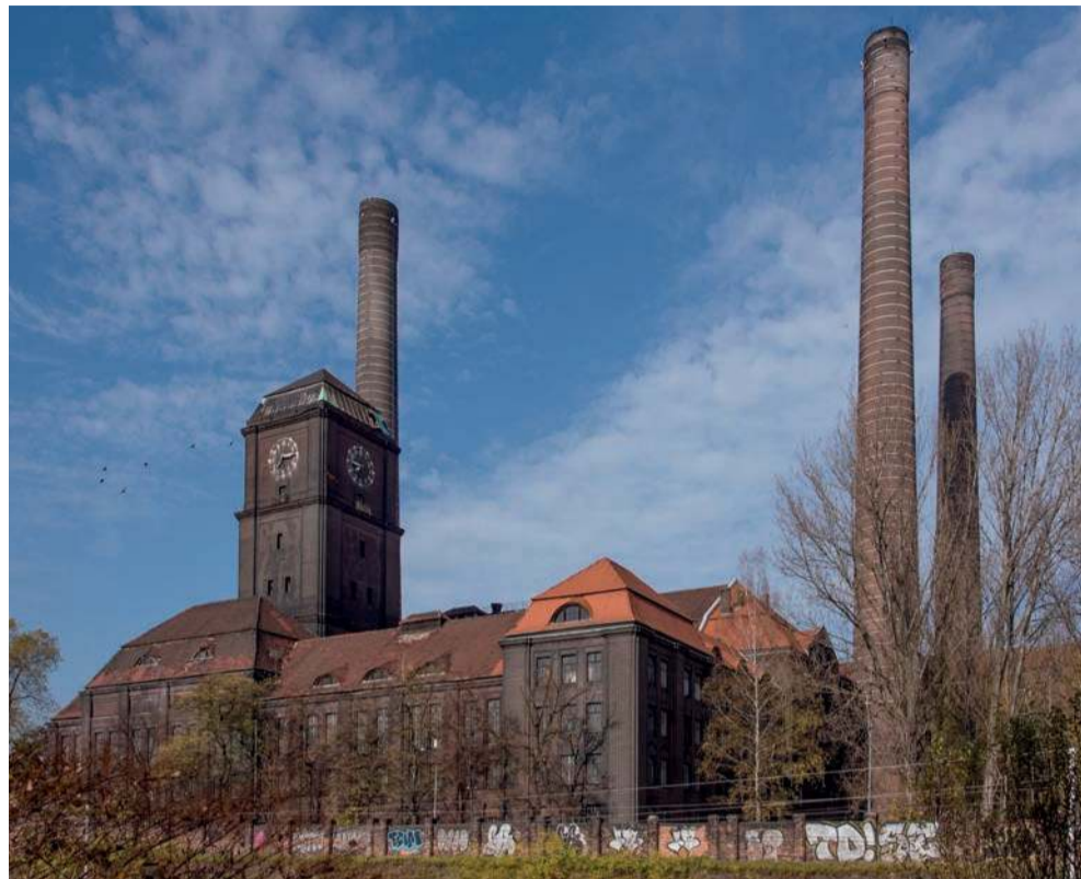
Bytomská Elektrociepłownia Szombierki

51-latek z Chrzanowa ukradł zegar, świecę i księgi liturgiczne ze szpitalnej kaplicy. Wpadł szybko, więc niewiele zdążył poczytać w blasku świec – ale przynajmniej zna dokładną godzinę aresztowania. Na szczęście za kratami też można wypożyczyć Biblię i poczytać, choć już przy żarówce.