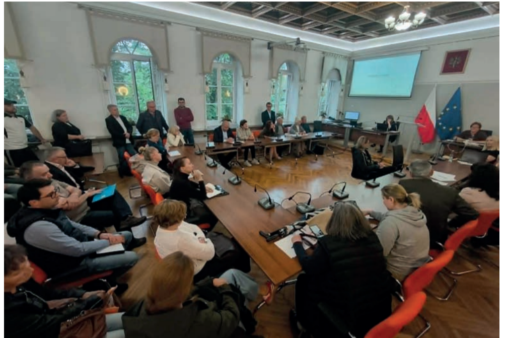
Spotkanie z mieszkańcami odbyło się w chrzanowskim magistracie w ramach ponownych konsultacji społecznych projektu planu ogólnego

Jak wyjaśniała, autorzy projektu pozostawili rezerwę z myślą o ewentualnych zmianach po konsultacjach społecznych.