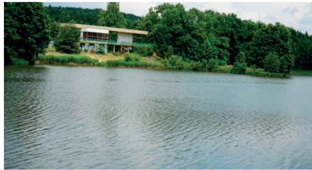
Zalew Skowronek w Alwerni.

Zarząd Województwa Małopolskiego wybrał osiem projektów, które otrzymają dofinansowanie z programu Fundusze Europejskie dla Małopolski 2021-2027. Wśród nich znalazła się modernizacja zbiornika Skowronek w Alwerni.