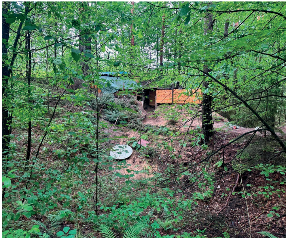
Leśny szałas w Trzebini.