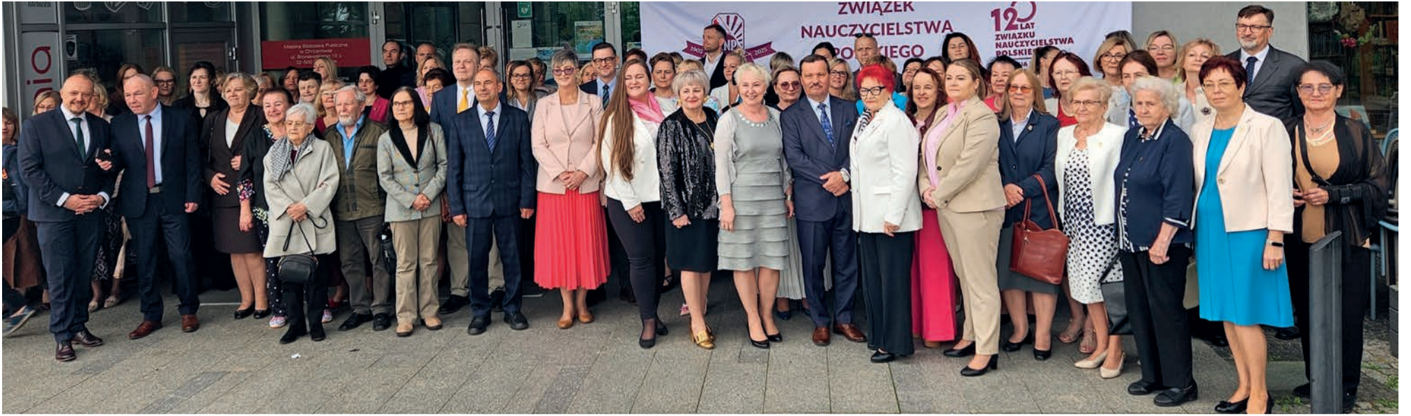
Uczestnicy jubileuszu 120-lecia ZNP w Chrzanowie