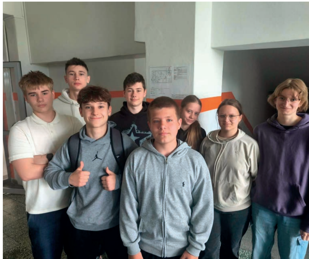
Uczniowie z klasy 8c Szkoły Podstawowej nr 4 w Libiążu

Emocje wywołuje także tocząca się w całej Polsce dyskusja wokół nagradzania