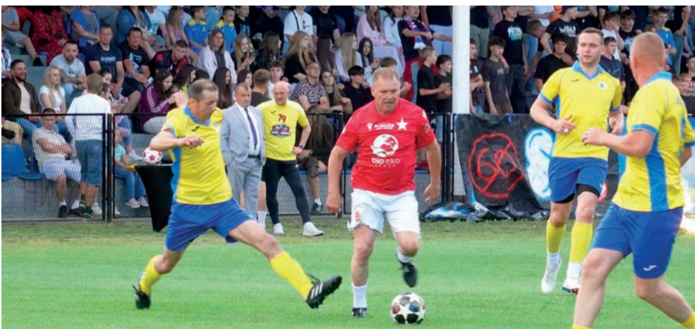
Przy piłce zawodnik Wisły