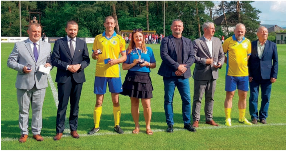
Odnaczeni przez MZPN. Więcej zdjęć i wideo z imprezy można zobaczyć na przelom.pl