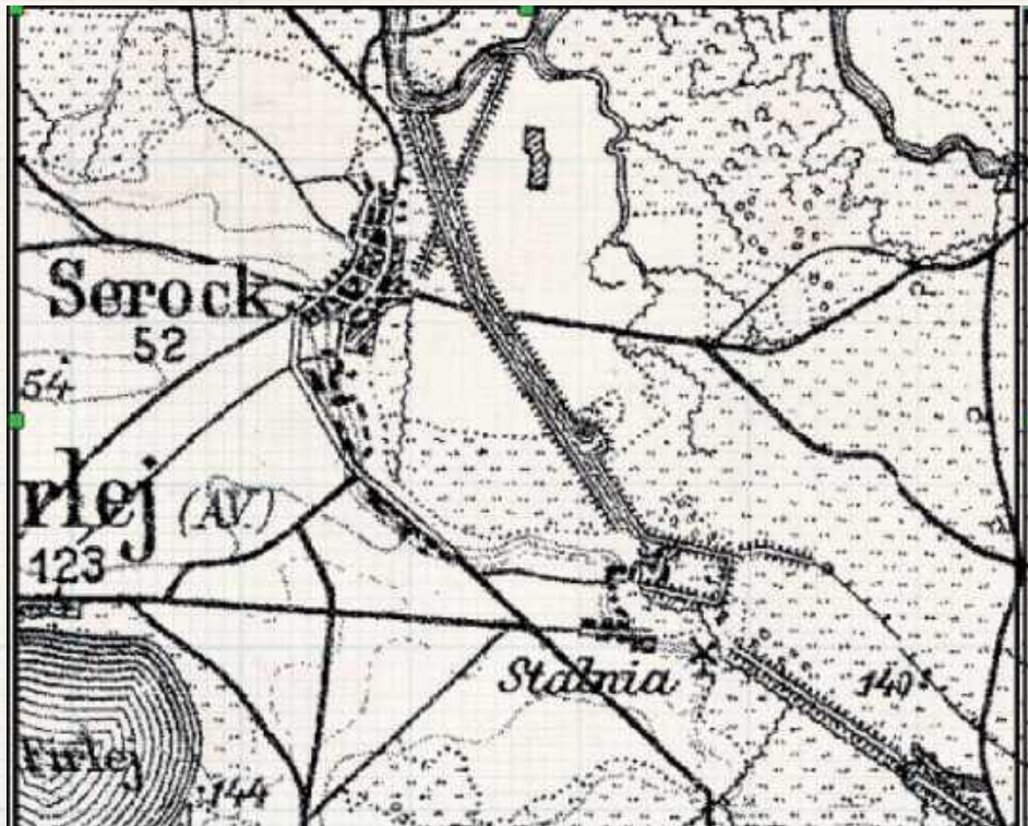
Okolice Serocka z zaznaczonym obszarem Stalowni na niemieckiej mapie przedstawiającej „zachodnią Rosję” w 1915 roku

W 1880 r. Serock wydzielono z dóbr lubartowskich i przekształcono w samodzielny majątek. Następnie Bank Polski sprzedaje go