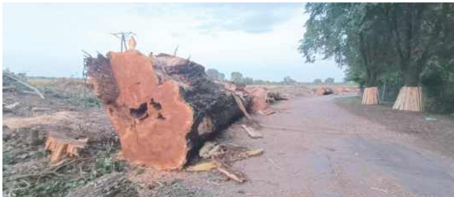
Aby przyjrzeć się sprawie wybraliśmy się na miejsce. Rzeczywiście wiele z wyciętych drzew miało dziury w środku, co wskazuje na ich zły stan

- I bedzie kolejna patelnia, no wprost nie moge uwierzyc,