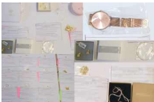
Policji udało się odzyskać część skradzionych przedmiotów. Sklep oszacował straty na blisko 120 tys. zł

48-latka z Puław za każdym razem wykorzystywała moment, gdy ekspedientka obsługiwała innych klientów. Usłyszała zarzut kradzieży. Grozi jej do 5 lat więzienia.