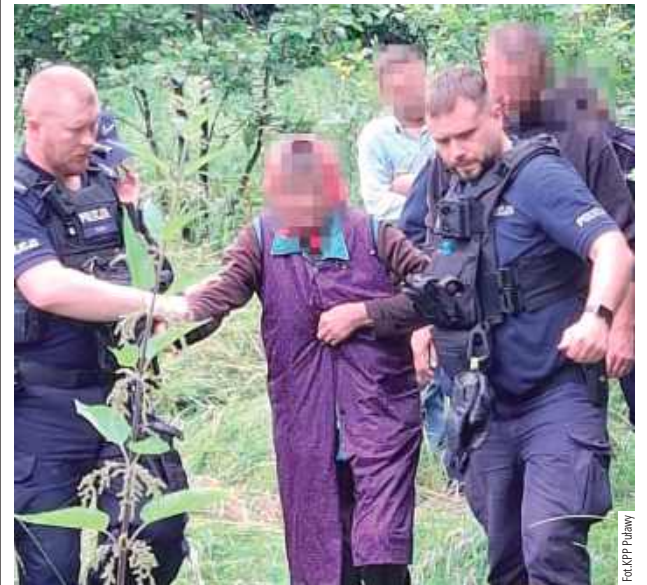
Seniora z pomocą policjantów została przekazana załodze karetki pogotowia