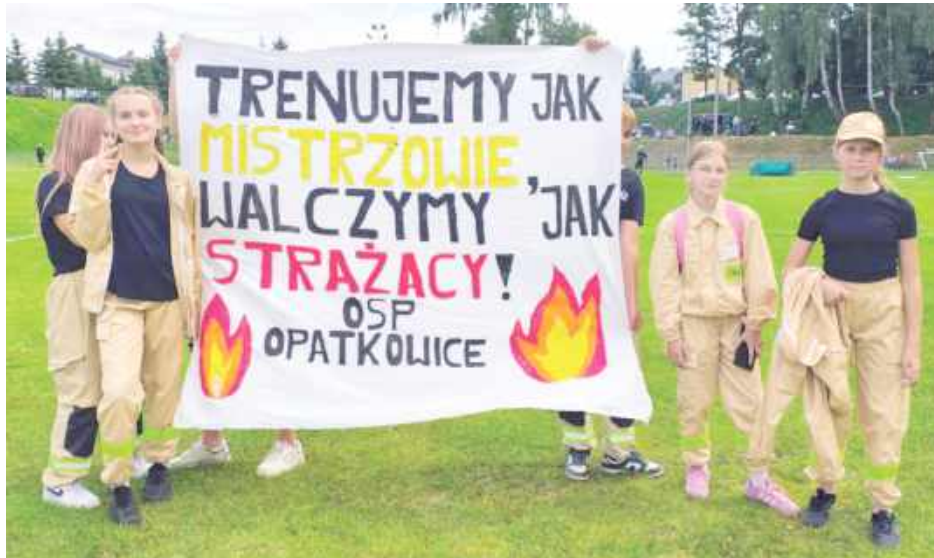
Drużny do boju rozgrzewali kibice. Były nawet transparenty przygotowane specjalnie na zawody

Drużny rywalizowały tradycyjnie w dwóch konkuren-