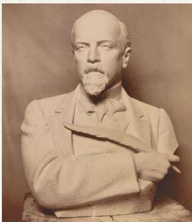
Popiersie Sienkiewicza dłuta Piusa Welońskiego, które ufundowali ok. 1897 roku uczestnicy kolacji u Benniego z okazji 25-lecia pracy twórczej pisarza

Prusowi Benni wytłumaczył, że na jego agorafobię najlepsze będzie picie wód żelazistych w Nałęczowie. Wydaje się, że większy wpływ na poprawę zdrowia autora „Faraona” miały wyjazdy z Warszawy do kameralnej i cichej miejscowości niedaleko, bliskiego skądinąd jego sercu