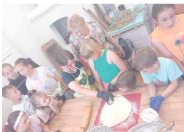
Dzieci uczyły się sztuki kulinarnej pod okiem doświadczonych gospodyń. Takie umiejętności z pewnością przydadzą się już na całe życie

Nie wszystkie dzieci wyjeżdżają na zorganizowany, letni wypoczynek poza miejscem zamieszkania. A co to za wakacje przed telewizorem, czy komputerem? Nuda. O to, by najmłodszy mieszkańcy Gminy Baranów nie narzekali na brak atrakcji zadbali pracownicy miejscowego Gminnego Centrum Kultury. Zorganizowali im ciekawe zajęcia, a w każdym tygodniu inne atrakcje. Małuchy biorą udział w zajęciach plastycznych,