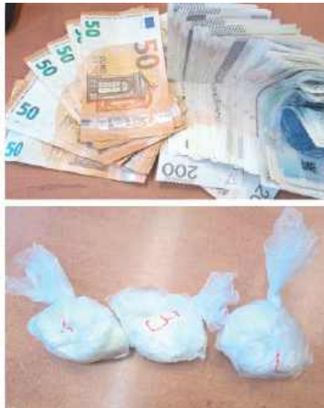
Wstępne badania wykazały, że zabezpieczony proszek to amfetamina. Według szacunków z zabezpieczonej ilości można byłoby przygotować około 2500 porcji dilerkich

Jak informuje Komenda Powiatowa Policji w Rykach, do zatrzymania doszło w miniony czwartek. Policjanci z komisariatu w Dęblinie, działając na podstawie ustaleń operacyjnych, przeszukali mieszkanie 59-latka. Znaleźli trzy woreczki foliowe z białą, zbryloną substancją oraz gotówkę w różnych walutach, o łącznej równowartości około 20 tysięcy złotych.