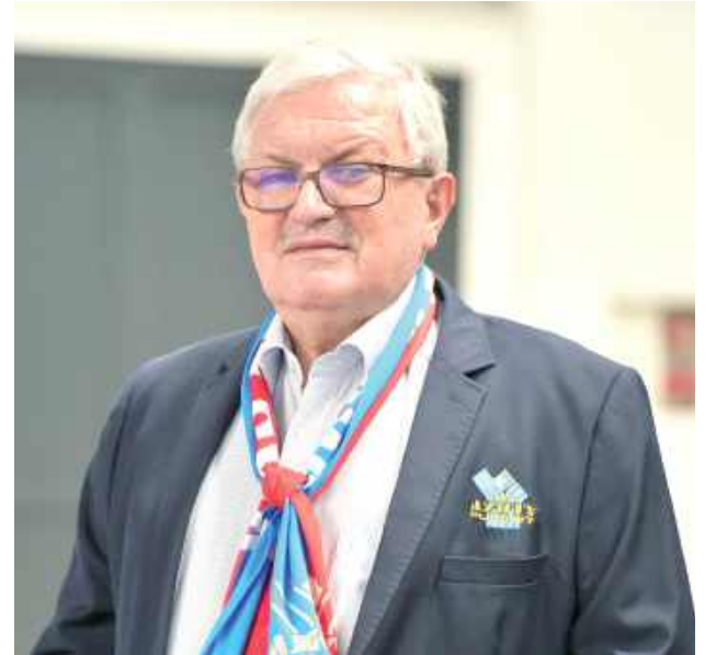
Jak podkreśla prezes, klub był już zdecydowany wycofać drużynę z rozgrywek, gdy nagle pojawiło się „zielone światełko”