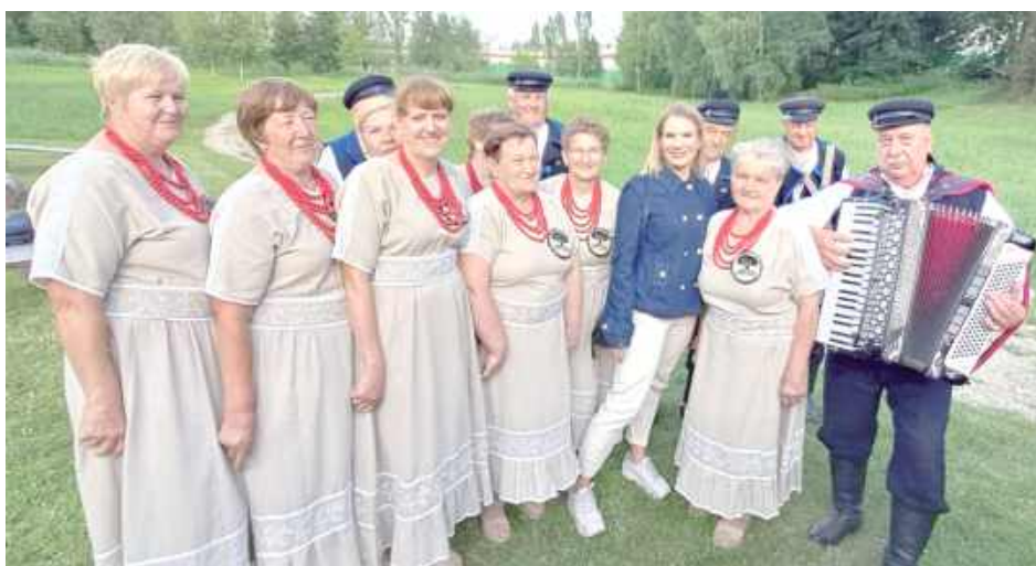
To było już drugie spotkanie KGW Zagrody Razem z Martą Nawrocką. Tym razem wystąpiła już w roli pierwszej damy-elekt