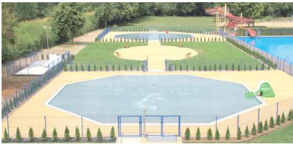
Na razie w Ośrodku Wypoczynkowym w Wólce Profeckiej frajdę z zabawy będą mieć głównie najmłodszy. Udostępnione zostaną jedynie brodziki

- Póki co, dzięki wspólnym wysiłkom pracowników Spółki, został przygotowany, by służyć