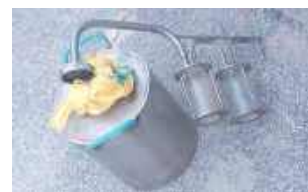
Nielegalne jest też posiadanie aparatury do produkcji alkoholu bez zezwolenia. Za to z kolei grozi kara pozbawienia wolności do lat 3

A za złamanie przepisów ustawy o rybach śródlądowych grozi kara do dwóch lat pozbawienia wolności, ale także utrata narzędzi służących do połowu. Nielegalne