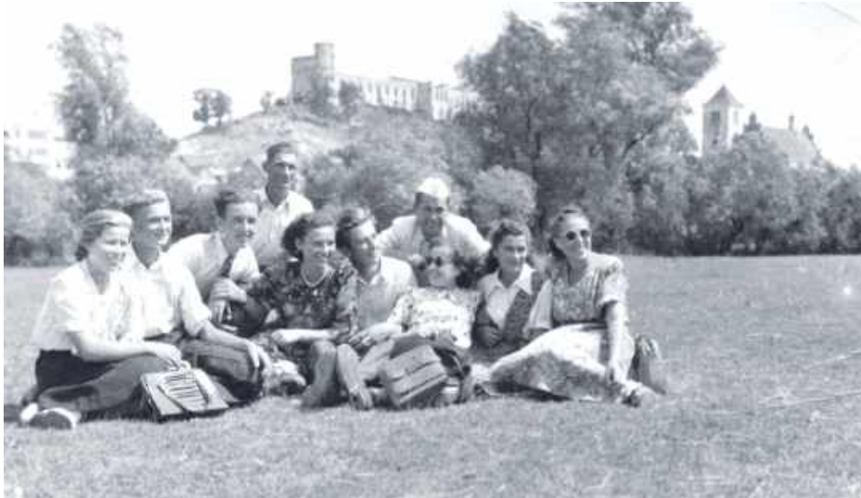
Wystawa „Pół wieku, tysiące historii” dostępna będzie od 31 lipca w Muzeum Zamek w Janowcu

W przestrzeni dziedzińca oraz murów zamkowych zaprezentowane zostaną dotąd szerzej