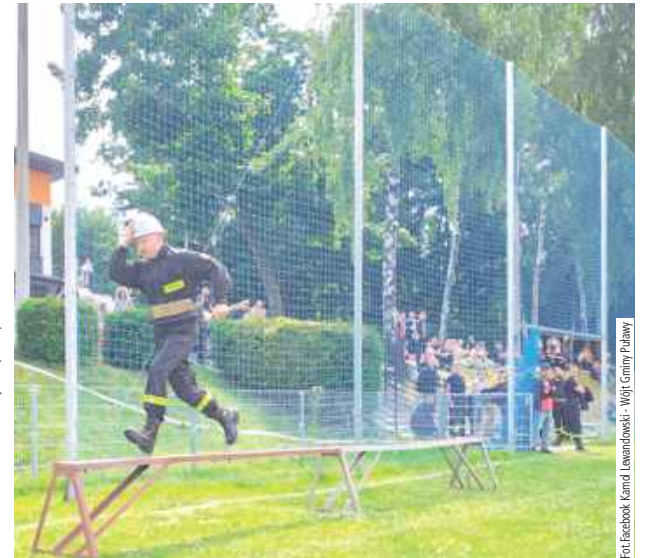
Tu liczył się czas, im krótszy, tym lepiej