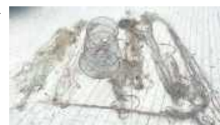
Za złamanie przepisów ustawy o rybach śródlądowych grozi kara do dwóch lat pozbawienia wolności, ale także utrata narzędzi służących do połowu

jest też posiadanie aparatury do produkcji alkoholu bez zezwolenia. Za to z kolei grozi kara pozbawienia wolności do lat 3.