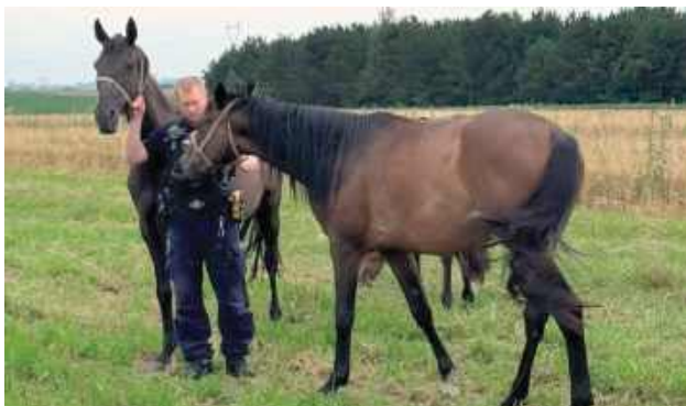
Policjanci schwytali konie i zaprowadzili na pobliską łąkę, a w międzyczasie ustalili właściciela zwierząt

Dokładnie takie zgłoszenie odebrali w minioną środę 16 lipca z samego rana puławscy policjanci. Na drodze między Końskowolą a Sielcami biegają trzy młode konie. Funkcjonariusze zabezpieczyli zwierzęta, a nieodpowiedzialnego właściciela ukarali mandatem.