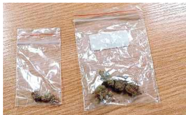
Podczas kontroli osobistej policjanci znaleźli przy 17-latku woreczek z marihuaną

W piątek, 11 lipca wieczorem w Poniatowej opolscy kryminalni zatrzymali 17-letniego mieszkańca miasta.