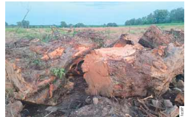
Gołym okiem było widać, że drzewa, które jeszcze nie zostały uprzągnięte przez wykonawcę inwestycji były spróchniałe