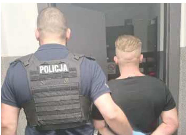
Mężczyźnie grozi do pięciu lat więzienia

Do zdarzenia doszło w niedzielny poranek. Dyżurny Komendy Powiatowej Policji w Opolu Lubelskim otrzymał zgłoszenie o pościgu za mężczyzną kierującym ciągnikiem rolniczym marki Ursus. 32-latek, który przemieszczał się w stronę powiatu opolskiego, zdołał chwi-