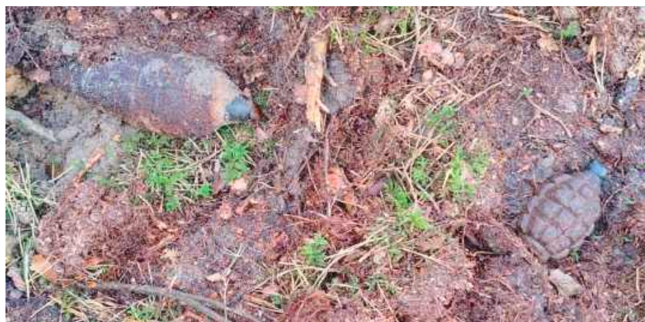
Wszystkie odnalezione w Janowcu niewybuchy zostały zabezpieczone i zneutralizowane przez saperów

To już kolejna taka sytuacja w powiecie w tym roku. W ubiegłym tygodniu na po-