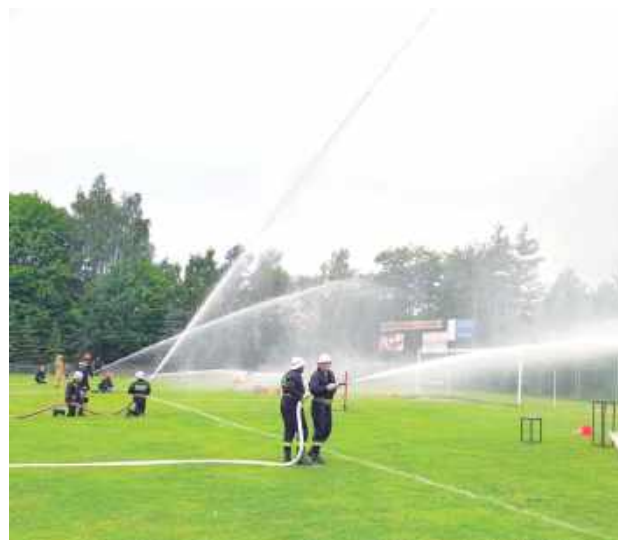
Tego dnia pogoda dopisała. Woda lała się na szczęście tylko ze strażackich węży

cjach - sztafecie pożarniczej i ćwiczeniu bojowym. W przypadku pierwszej z konkurencji kluczowe znaczenie ma czas. Zawodnicy na dystansie 50 metrów mają do pokonania przeszkody takie jak płotek,