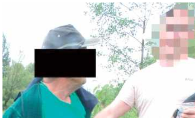
67-latek usłyszał już zarzuty

POWIAT OPOLSKI: Policjanci z Opolu Lubelskiego razem z funkcjonariuszami Państwowej Straży Rybackiej z Lublina oraz Strażą Ochrony Wód Polskiego Związku Wędkarskiego z Lublina na gorącym uczynku złapali kłusownika. To mieszkaniec gminy Chotcza (powiat lipski). Akurat spokojnie sprawdzał sobie sieci, które wcześniej zarzucił... A teraz ma poważne kłopoty.