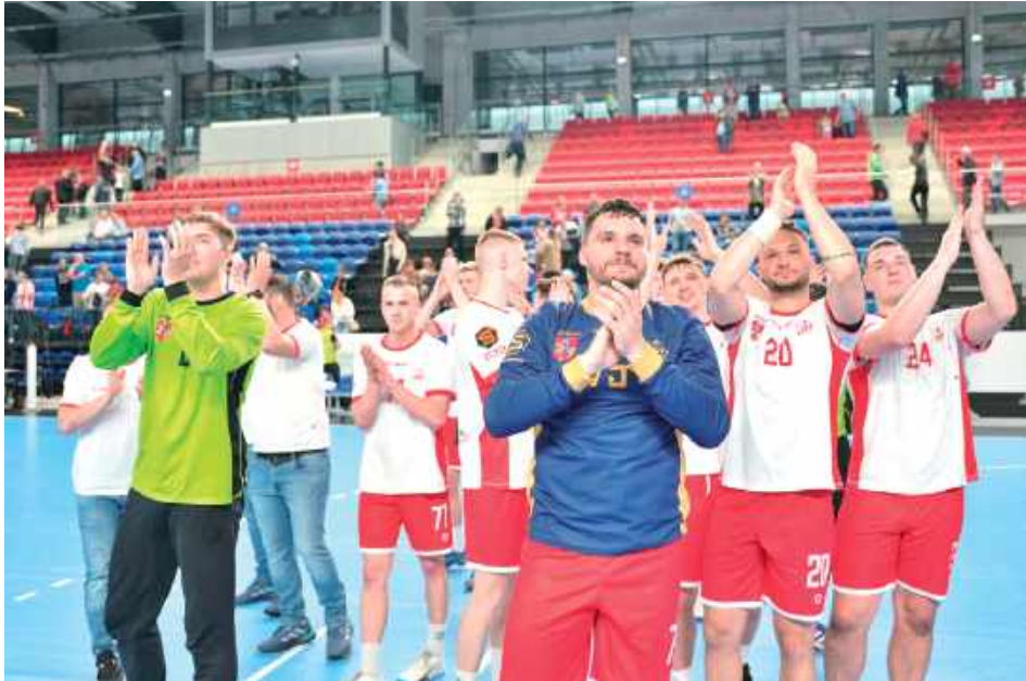
Azoty mają nowego sponsora. Piłka ręczna w Puławach została uratowana!

Jak podkreśla prezes, klub był już zdecydowany wycofać drużynę z rozgrywek, gdy nagle pojawiło się „zielone światełko”. - Firma, której nazwy jeszcze nie mogę ujawnić, zgłosiła chęć współpracy na najbliższy sezon sportowy. Na tej podstawie podjęliśmy decyzję, że nie wycofujemy drużyny z rozgrywek - informuje.