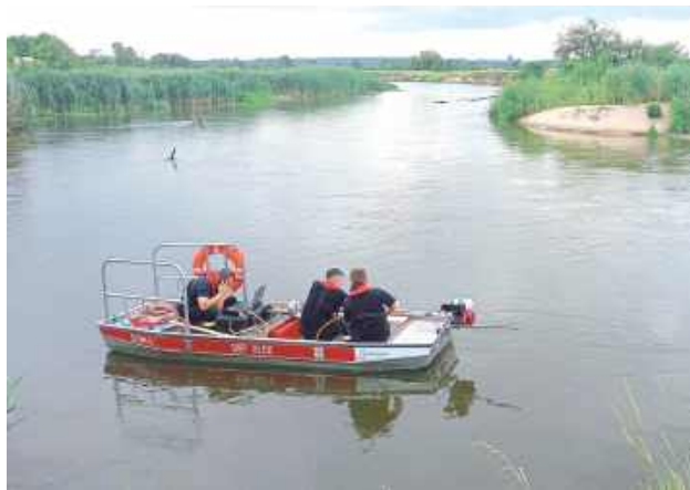
Brzeg rzeki był również sprawdzany przy pomocy quada. Działania z łodzi prowadzone były również za pomocą sonaru. Wytypowane zostały miejsca, które wymagały sprawdzenia przez nurka

POWIAT RYCKI: Przez dwa dni strażacy, policjanci i specjalistyczna grupa ratownictwa wodno-nurkowego z Lublina brała udział w poszukiwaniach zaginionego mieszkańca gminy Nowodwór. W środę, 16 lipca odnaleziono ciało.