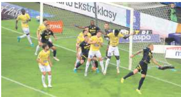
Motor (żółte koszulki) rozgrywa drugi z rzędu sezon w krajowej elicie

Latem do Motoru sprowadzono dziewięciu nowych piłkarzy. W kadrze meczowej na inaugu-