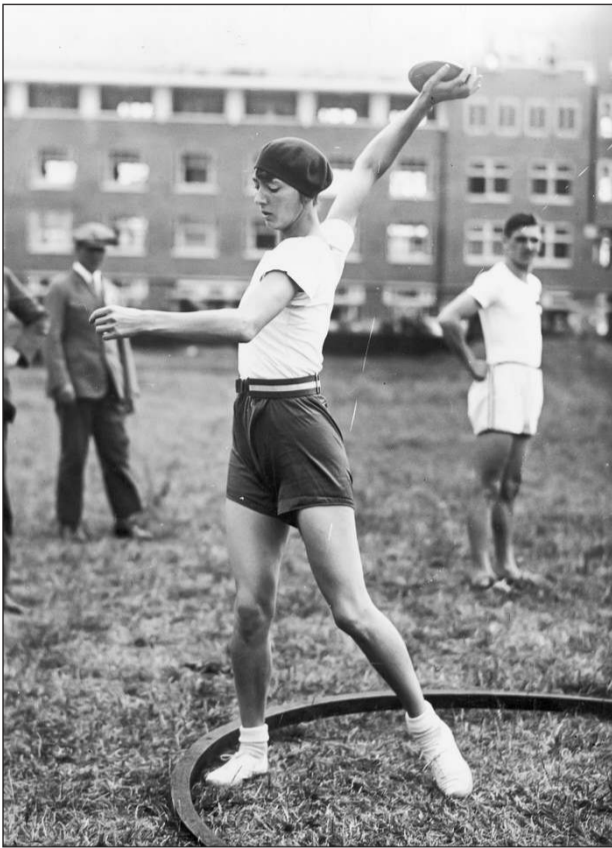
Trening na Igrzyskach Olimpijskich w Amsterdamie, 1928 r.

Szanowni Państwo, co wspólnego może mieć Kiepura i Konopacka z cyklem artykułów o poezji, poetach i ich utworach? Przecież Jan Kiepura to polski śpiewak i aktor a Halina Konopacka to polska lekkoatletka