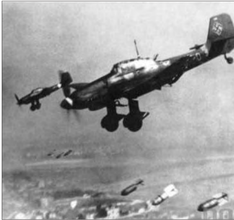
✚ Bombowce niemieckie Junkers Ju-87 w szyku nurkującym