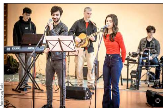
Projekt ruszył jesienią 2024 roku. Z pomocą wolontariuszy zorganizowano cztery koncerty w szkołach podstawowych nr 2 i 5 w Garwolinie, Michałowce i Pilawie

Przeprowadzili ankietę o wiedzy na temat autyzmu wśród blisko 200 młodych ludzi - wyniki zostaną wkrótce opublikowane. Założyli też profil na Facebooku promujący wiedzę o autyzmie.