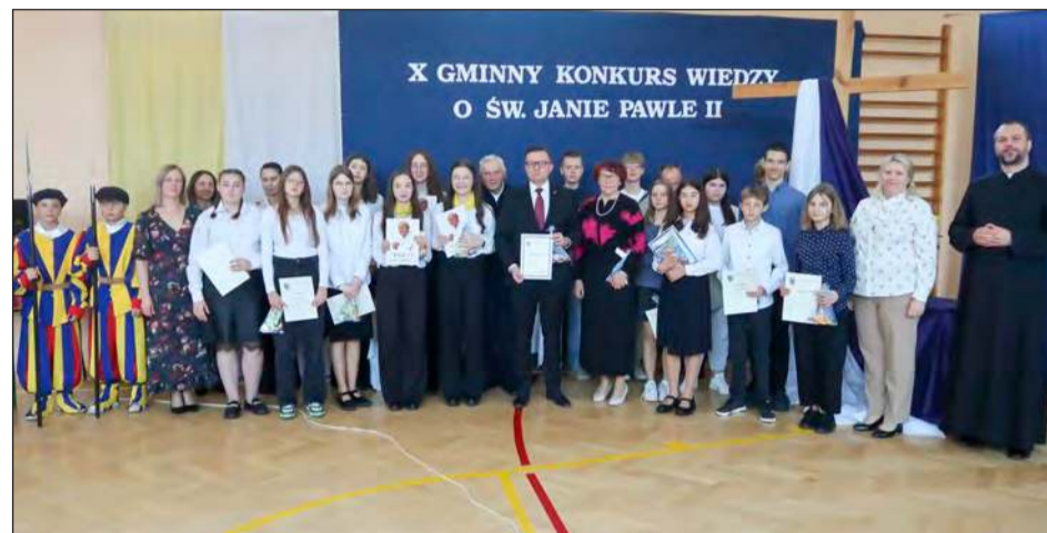
➤ Szkoła Podstawowa w Korytnicy uczciła 20. rocznicę śmierci papieża Polaka Gminnym Konkursem Wiedzy o św. Janie Pawle II

Szkoła Podstawowa w Korytnicy uczciła 20. rocznicę śmierci papieża Polaka. Z tej okazji odbył się X Gminny Konkurs Wiedzy o św. Janie Pawle II, zachęcający uczniów do zgłębiania jego życia i nauk