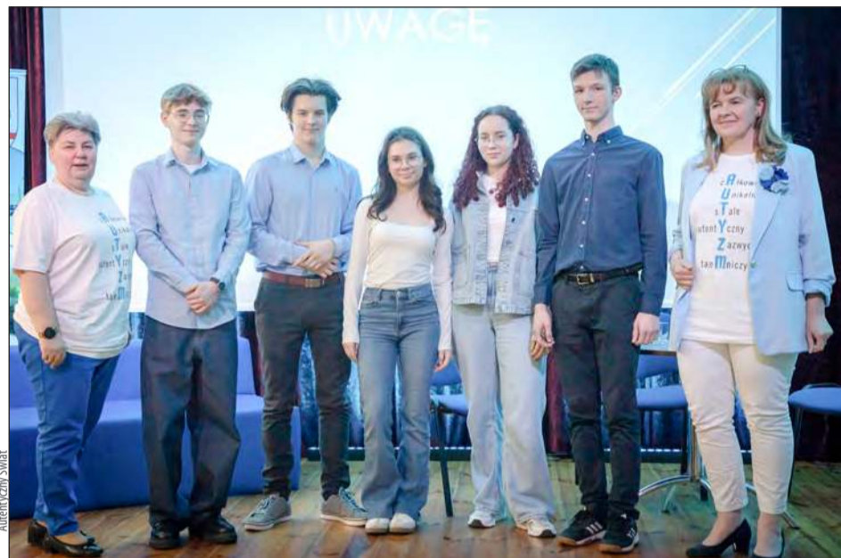
Uczniowie, po zeszłorocznym temacie depresji, tym razem wybrali spektrum autyzmu

Projekt ruszył jesienią 2024 roku. Z pomocą wolontariuszy zorganizowano cztery