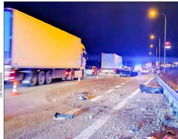
Ciężarówka z naczepą uderzyła w tył dimlera chryslera, a potem w dimlera wjechało volvo

- Ze wstępnych ustaleń policji wynika, że 29-letni kierowca ciężarówki z naczepą najechał na tył dimlera chryslera, prowadzonego przez 65-latkę. Chwilę później w dimlera uderzyło volvo, którym jechał 23-latek - mówi podkom. Małgorzata