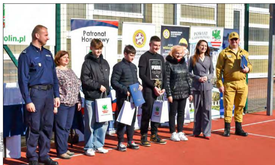
Zwycięskie drużyny pojedą na eliminacje rejonowe 25 kwietnia w Zbuczynie