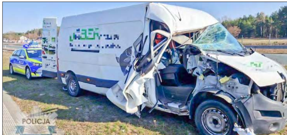
18-latek zasnął na trasie S17, uderzył w ciężarówkę i pożegnał się z prawem jazdy. W rok zebrał ponad 20 punktów karnych