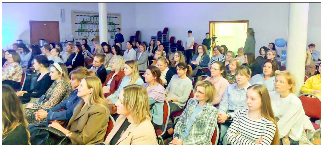
➤ Po kilku latach przerwy powróciła konferencja dla nauczycieli poświęcona wspieraniu dzieci i młodzieży ze spektrum autyzmu. Wydarzenie zorganizowano w Auli Katolickiego Liceum Ogólnokształcącego w Garwolinie

➤ Po latach przerwy w Garwolinie odbyła się konferencja dla nauczycieli o wsparciu dzieci z autyzmem. Wydarzenie podkreśliło też znaczenie pomocy ich rodzicom