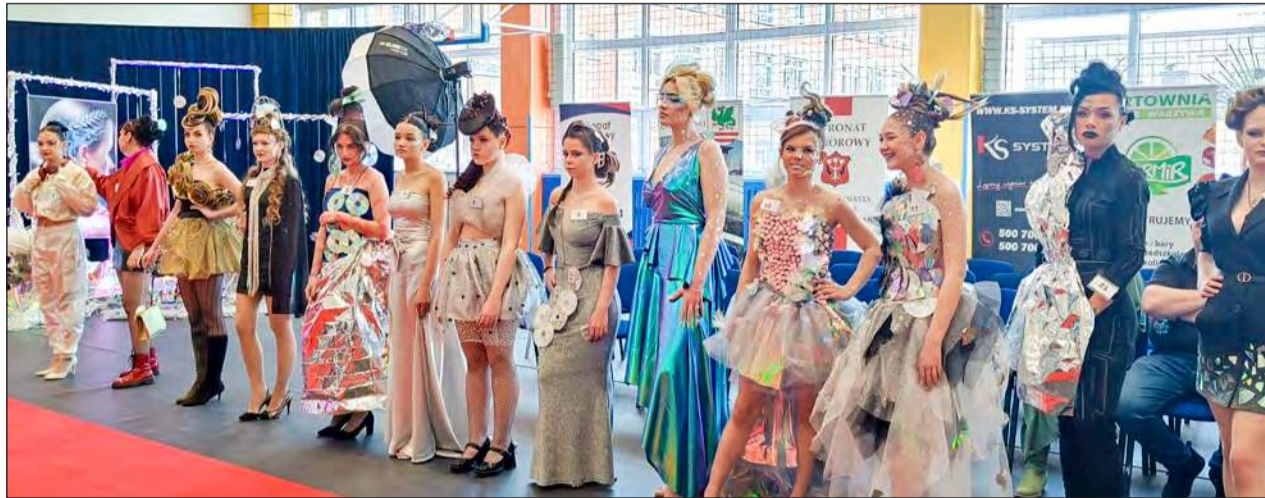
W tegorocznej edycji Ogólnopolskiego Konkursu Mody Fryzjerskiej w szranki stanęło 16 uczestników z 9 szkół z różnych zakątków kraju