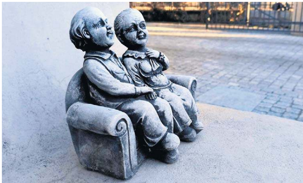
Uroczy starszuchowie siedzą na kanapie. Figurka stoi przy wejściu do nowego Domu Seniora.

Przyjemne dla oka zdobienia wokół okna na poddaszu, duże przeszklenia, secesyjne detale drzwi wyjściowych oraz ogród z altanami na tyłach to nie są jedyne walory estetyczne gruntownie przebudowanej willi przy ul. II Armii 4 w Wałbrzychu. Od niedawna gmachu dawnego przedszkola, przystosowanego na Dom Seniora strzeże - poza monitoringiem wizyjnym - sympatyczna para starszuchów.