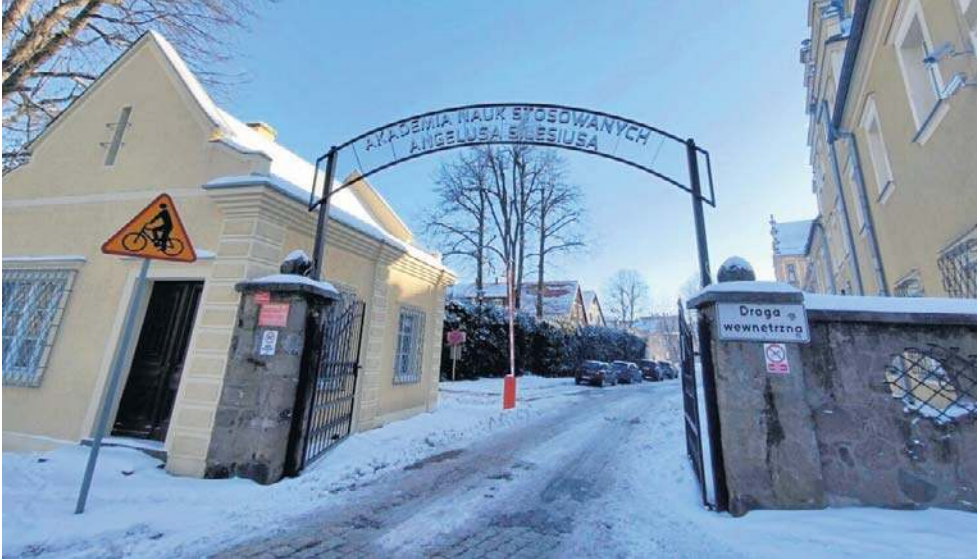
26 lutego 2004 r. kompleks został przekazany PWSZ (dziś ANS) im. Angelusa Silesiusa.