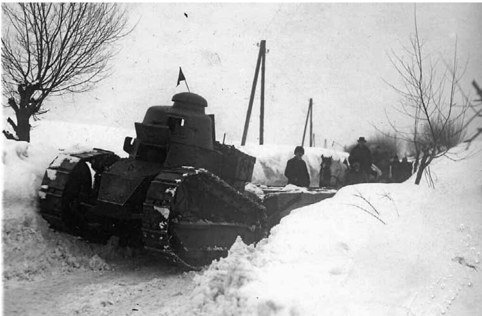
1929 rok, gdzieś pod Przemyślem. Francuskie lekkie czołgi Renault FT17 podczas odśnieżania drogi.