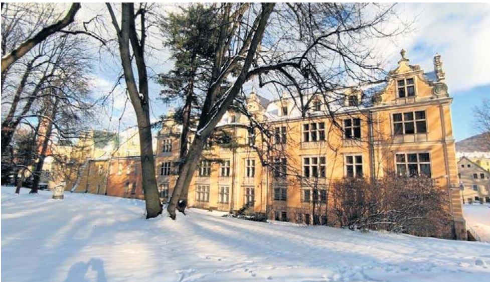
Pałac Czetrzitzów powstał w latach 1606-1628 po pożarze w 1581 r. zamku Nowy Dwór.