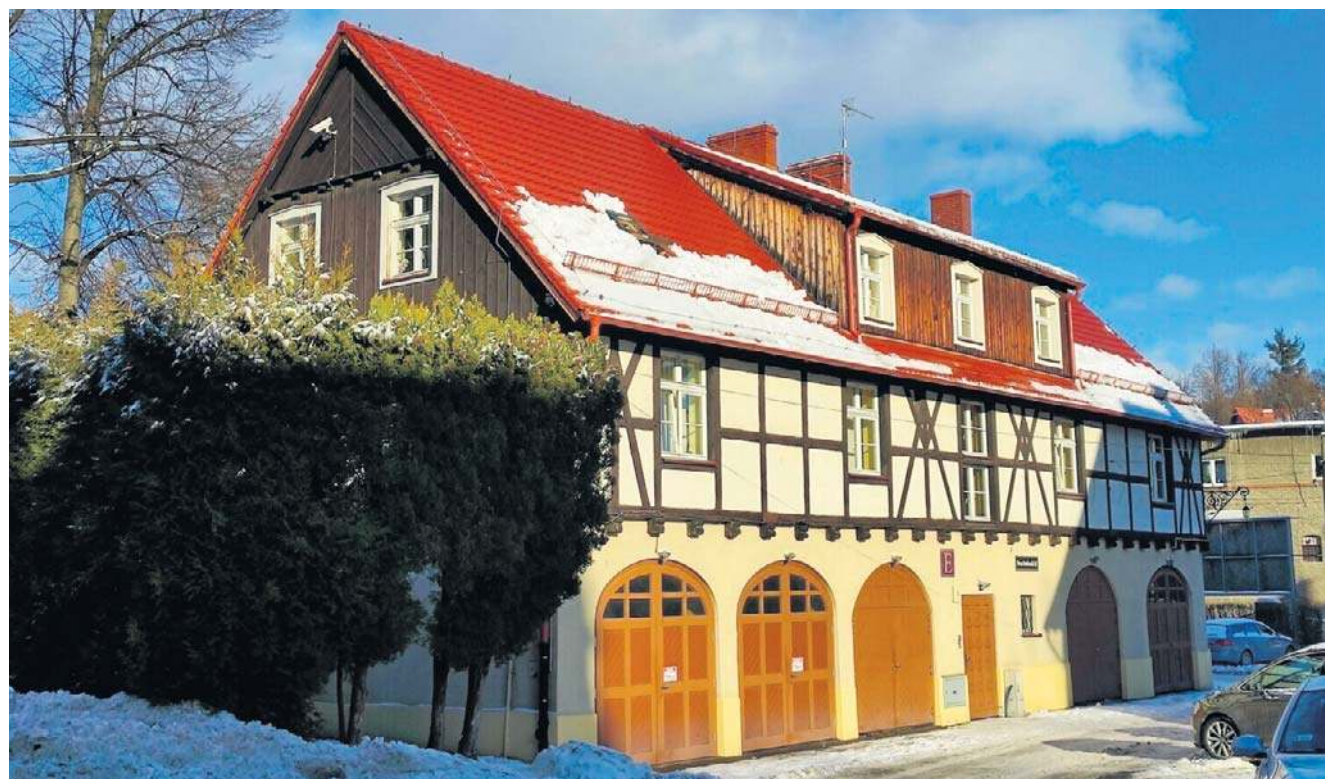
Stan dwóch powstałych w XX wieku willi, położonych w parku przy pałacu, pozostawia wiele do życzenia...