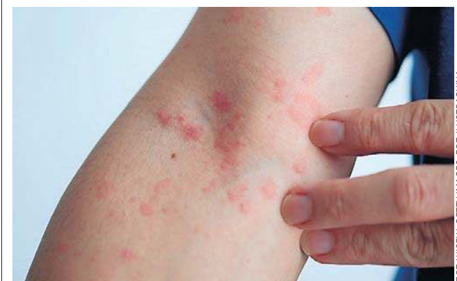
Pokrzywka z zimna to rzadka choroba, która zmienia zimę w prawdziwy koszmar. Lekarze podejrzewają, że przyczyną jest uwalnianie histaminy.