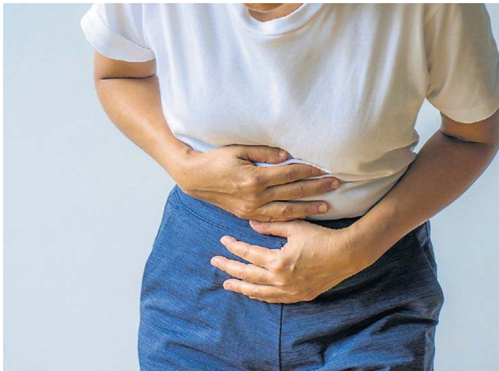
Czasami pierwszym objawem nowotworu jest ostra niedrożność przewodu pokarmowego.

Problem w tym, że choroba przez wiele lat może przebiegać