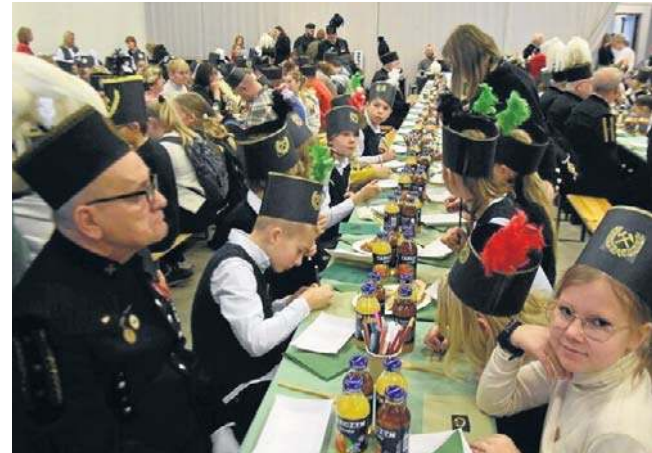
FOT. PAWEŁ GOŁĘBIOWSKI

Teraz wniosek czeka na ocenę, a ostateczna decyzja zapadnie podczas 21. sesji Międzynarodowego Komitetu UNESCO na przełomie listopada i grudnia br. ©