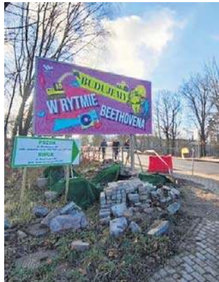
„Budujemy w rytmie Beethovena” - głosi napis.

Ulica Beethovena na obrzeżach Śródmieścia i jej najbliższa okolica w ostatnich miesiącach bardzo się zmieniła. Dotąd przyjeżdżali tutaj tylko mieszkańcy tego zakątka oraz odwiedzający wałbrzyski PSZOK. Teraz jest tu także Schronisko dla zwierząt, a wkrótce powstanie baza MZUK i zajezdnia autobusowa. Przez to ulica staje się bardziej ruchliwa, a jej skrzyżowanie z DK nr 35 bardziej nerwalgiczne.