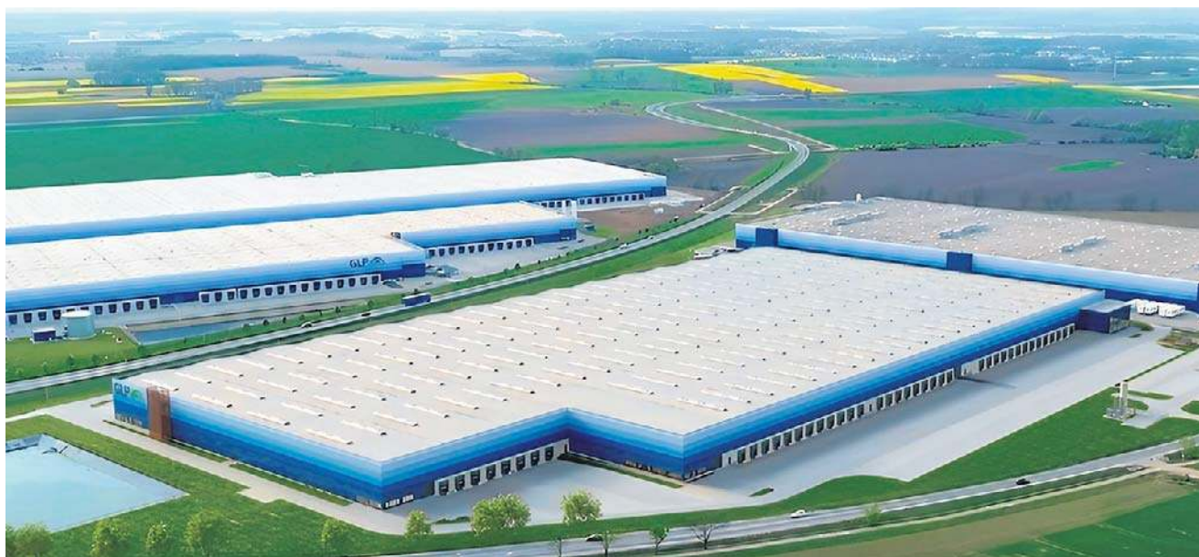
Tak będzie wkrótce wyglądała fabryka Sungrow w Wałbrzychu. Zaoferuje mieszkańcom kilkaset nowych miejsc pracy.

Fabryka została zaprojektowana z myślą o produkcji falowników fotowoltaicznych oraz