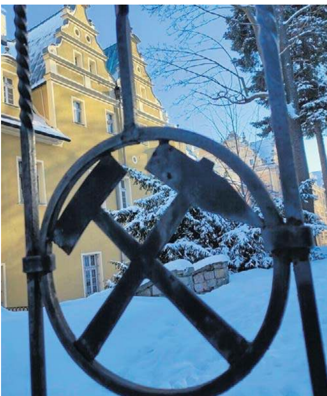
Po wojnie kompleks służył za siedzibę różnym instytucjom, związanym z wydobyciem węgla kamiennego.