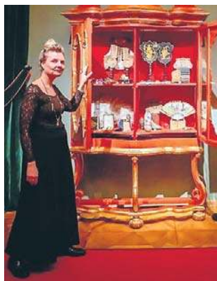
Ruszyła nowa odsłona Gabinetu Osobliwości.

Nową odsłonę Gabinetu Osobliwości można podziwiać do 30 kwietnia br. ©