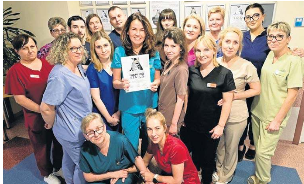
Wałbrzyscy neurologicy zostali kolejny docenieni w programie ESO Angels Awards.

O tym, że skutecznie pracują tam nad jak najwyższą jakością leczenia pacjentów może świadczyć włączenie Wałbrzycha do wspomnianego ESO Angels Awards, czyli międzynarodowej organizacji leczenia udarów mózgu.