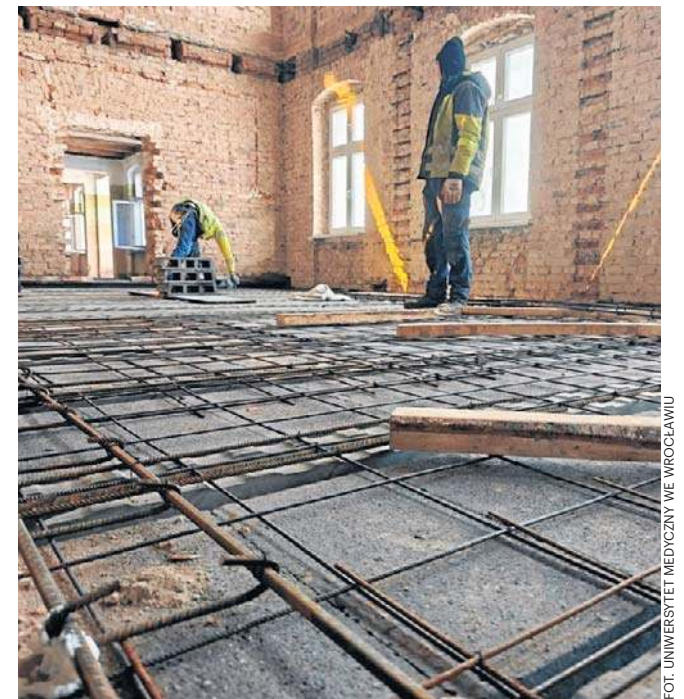
Trwa remont zabytkowego budynku przy Alei Wyzwolenia 36-38 w Wałbrzychu. Będzie tu Filia UM we Wrocławiu.

W gmachu są wymieniane stropy, wymieniona będzie też stolarka otworowa oraz tynki. Planowana jest przebudowa dachu, a także budowa odnawialnych źródeł energii - dla-