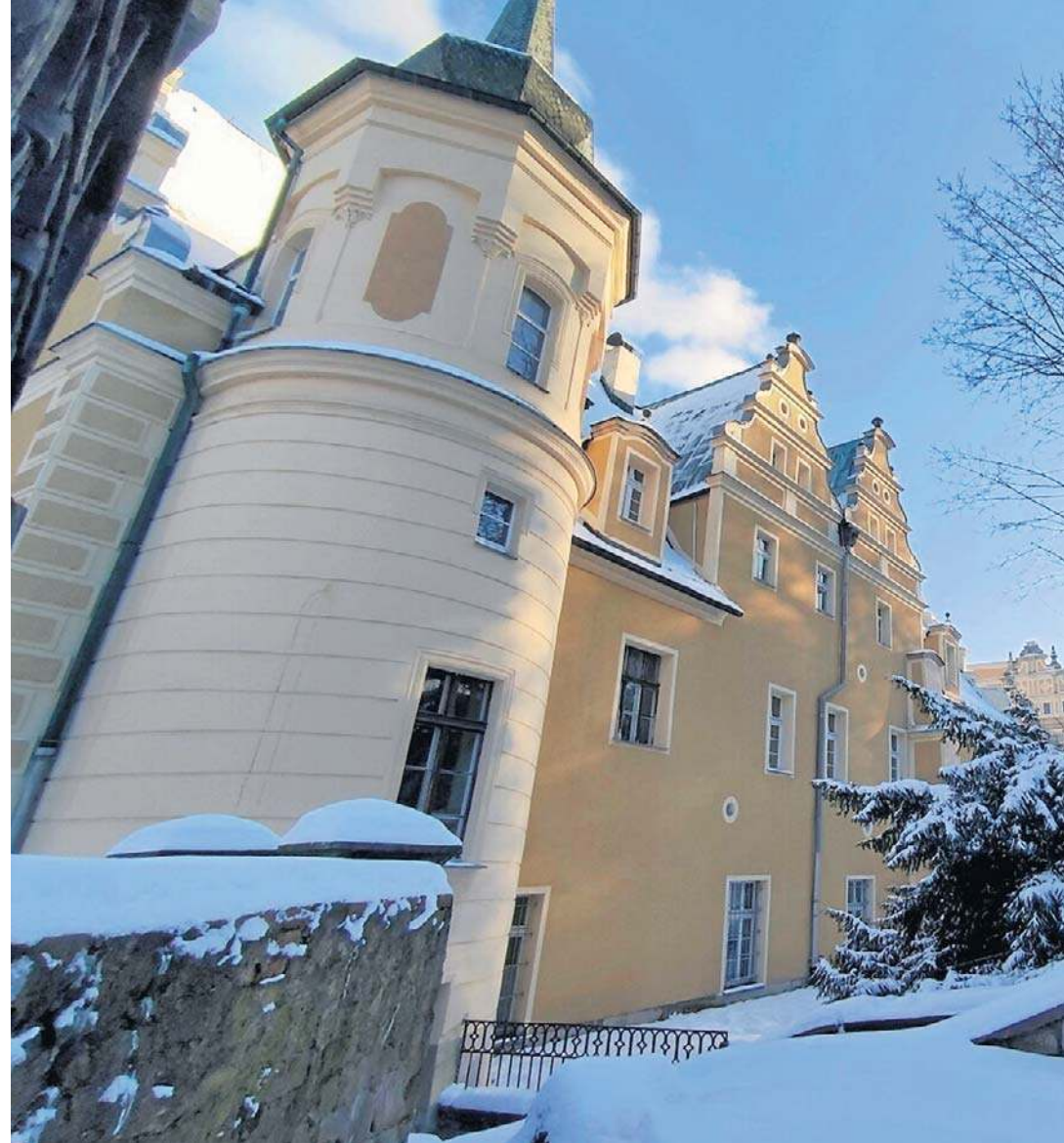
Renesansowy pałac Czetrzitzów w Wałbrzychu razem ze swoim parkiem i dawnymi zabudowaniami.