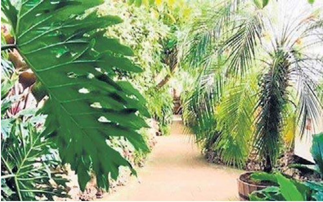
Wizyta w palmiarni zimą może wspaniale wpłynąć na samopoczucie. Na dworze śnieg i mroz, a tam tropiki!