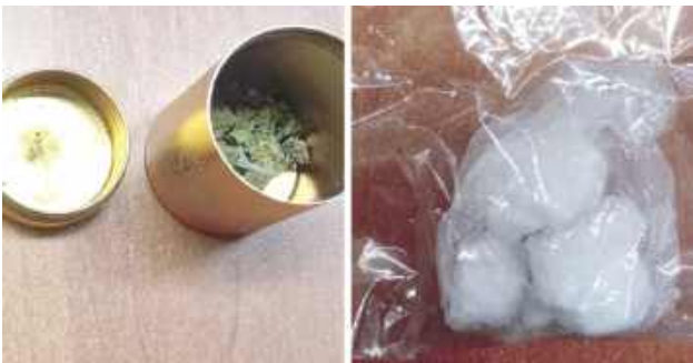
Badanie alkomatem wykazało ponad 2 promile alkoholu w organizmie. Podczas dalszych czynności policjanci ujawnili przy mężczyźnie foliowe zawiniątko z białą substancją

Do zdarzenia doszło na początku tygodnia, podczas nocnego patrolu policjantów z Komisariatu Policji w Dęblinie. Funkcjonariusze zwrócili uwagę na osobowe audi, które poruszało się z uszkodzonym przednim kołem. Pojazd ewidentnie jechał