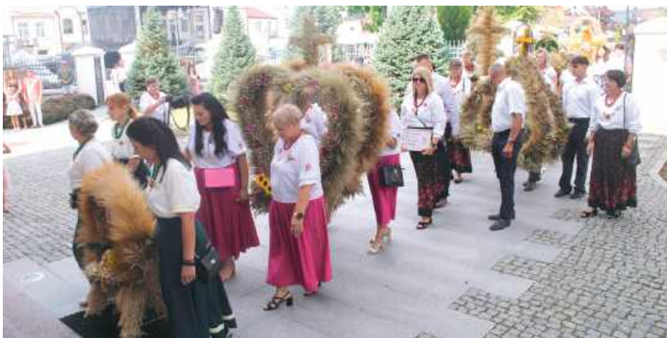
Delegacje z wiencami dożynkowymi