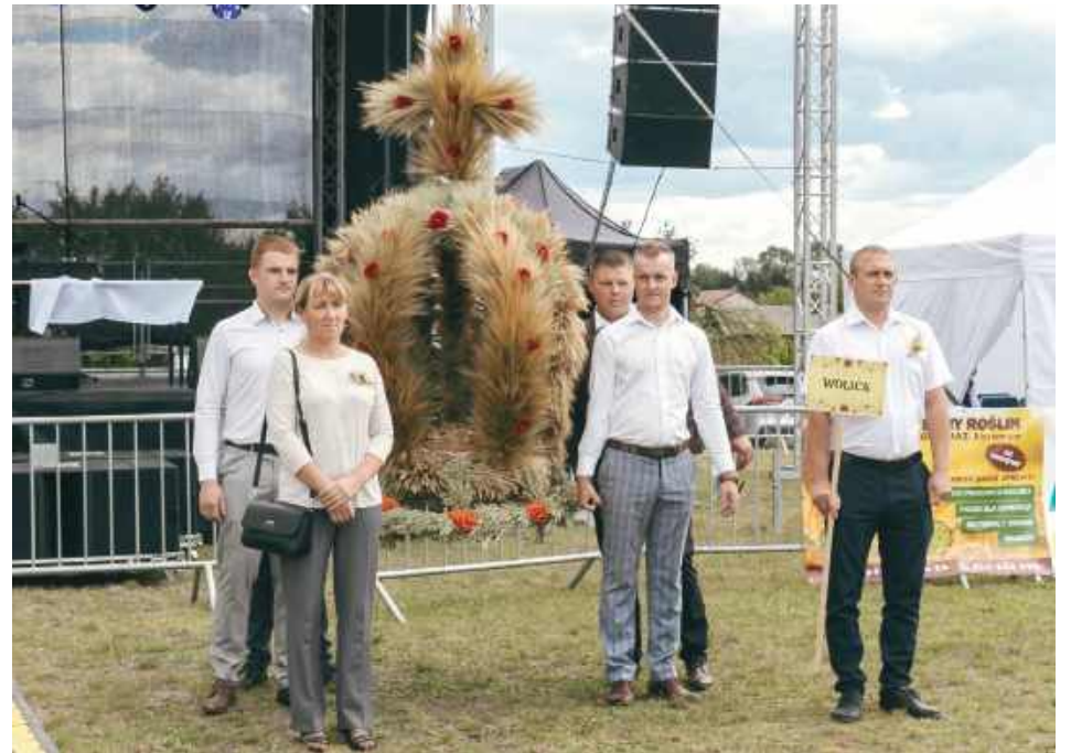
Wieniec z Wolicy zajęł II miejsce