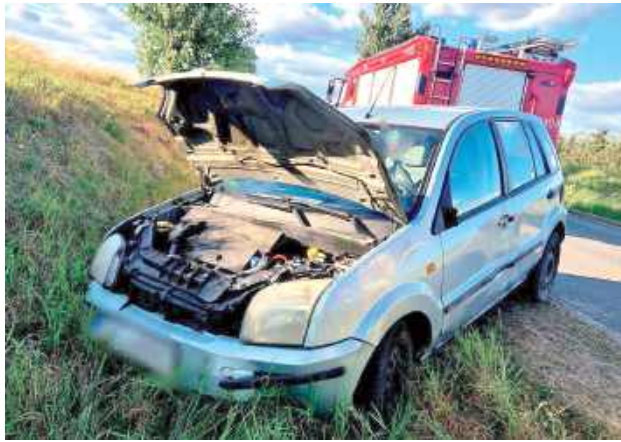
Dzieci, które wyszły z całego zdarzenia bez szwanku, trafiły pod opiekę rodziny. Tymczasem ich matka stanie przed sądem

Świadek zdarzenia natychmiast powiadomił służby. Na miejscu policjanci stwierdzili, że 34-latka jest nietrzeźwa. Badanie wykazało ponad pro-