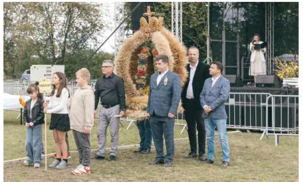
Izabelmont zajęł II miejsce w konkursie wianców dożynkowych