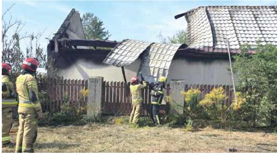
Płomienie przeszły na pobliski budynek gospodarczy, którego niestety nie udało się uratować