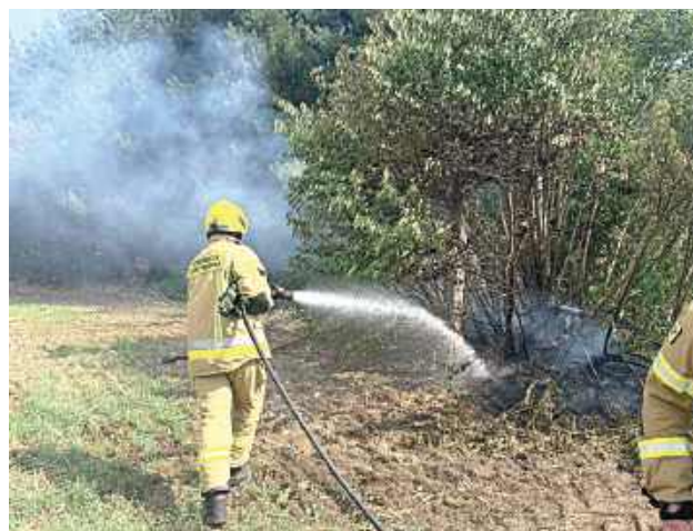
Paliła się trawa i suche drzewa w młodniku

- Ogień udało się opanować dzięki szybkiej reakcji świadków a nasze działania ograniczyły się do dogaszenia ognia - informuje OSP Ostrówek. Na tym jednak działania strażaków się nie zakończyły. Podczas akcji zauważyli dym nie-