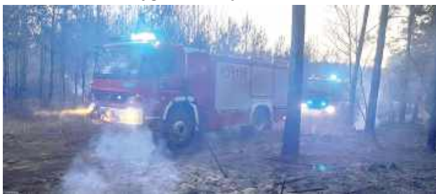
Na pograniczu powiatów lubartowskiego i parczewskiego płonęło 7,5 ha lasu

Pożar lasu w Sułoszynie w gminie Firlej był największym, ale nie jedynym, który 29 sierpnia musieli gasić strażacy z powiatu lubartowskiego.