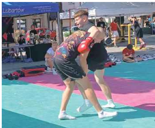
Nie zabrakło pokazów walk