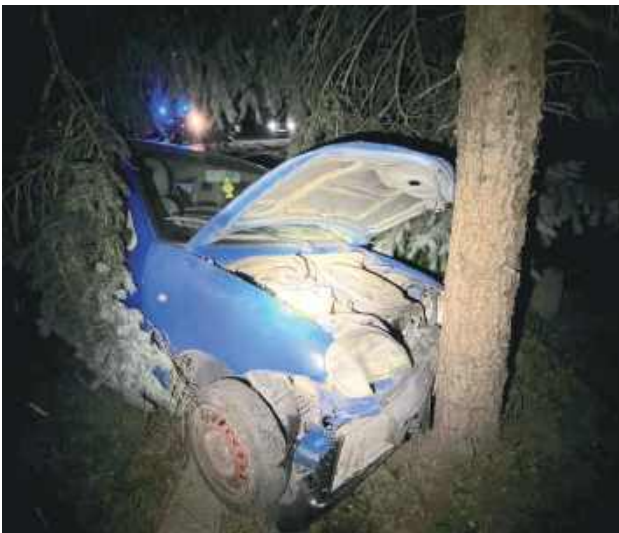
Kierowca Fiata został przewieziony do szpitala