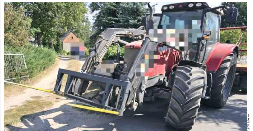
W Peugeota uderzył ciągnik Massey Ferguson

Do zdarzenia doszło 28 sierpnia około godz. 13. Jak informuje podkomisarz Jagoda Maj z KPP Lubartów, kierujący ciągnikiem Massey Ferguson mieszkaniec gminy Michów, włączając się do ruchu z drogi podporządkowanej, uderzył widłami ładowacza w bok kampera Peugeot, którym kierował mieszkaniec gminy Ryki. Bok Peugeota został uszkodzony, jednak nikt nie odniósł obrażeń. Policjanci zatrzymali dowód rejestracyjny Peugeota, a sprawca kolizji został ukarany mandatem.