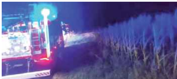
Pożar w Woli Sernickiej gasili strażacy z OSP KSRG Nowa Wola