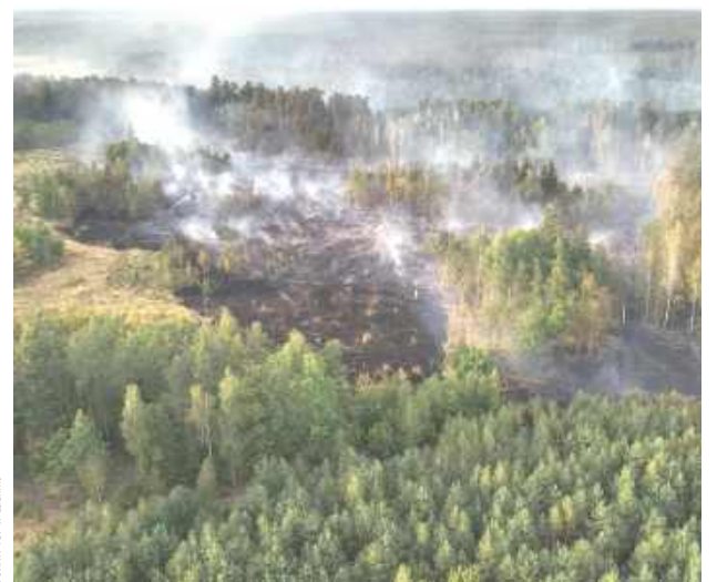
Pożar lasów parczewskich

- Od godziny 15.20 strażacy z powiatu parczewskiego i lu-