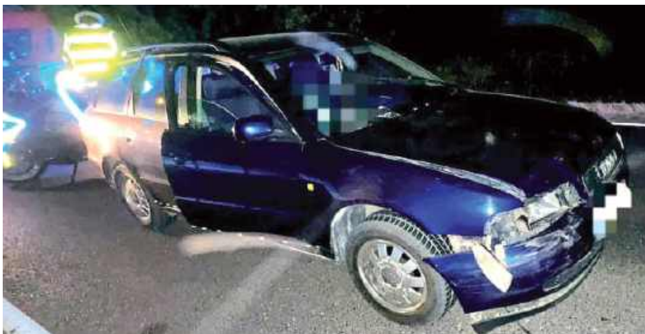
Kierująca Audi miała 2 promile alkoholu w organizmie

Do zderzenia doszło 27 sierpnia przed godz. 20. Jak informuje podkomisarz Jagoda Maj z KPP w Lubartowie, kierująca Audi nie zachowała bezpiecznej odległości i uderzyła w tył Fiata kierowanego przez mieszkańca gminy Lubartów, który wjechał do rowu. 22-letni kierowca został zabrany do szpitala. Okazało się, że 53-letnia mieszkanka powiatu lubartowskiego kierująca Audi miała w organizmie dwa promile alkoholu. Policja zatrzymała jej prawo jazdy, kobieta odpowie przed sądem za kierowanie pod wpływem alkoholu i spowodowanie kolizji. Grozi jej do trzech lat pozbawienia wolności.