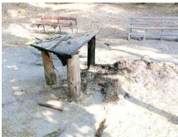
Ochotnicza Straż Pożarna w Kamionce poinformowała o zniszczeniu mienia

- Drodzy mieszkańcy gminy Kamionka chcieliśmy poinformować Was, iż nasze wspólne mienie zostało zdewastowane przez grupę nastolatków, którą przyłapaliśmy na gorącym uczynku. Nie jest to pierwsza taka sytuacja i akt wandalizmu w tamtym miejscu. Wcześniej zostały skradzione deski z altanki, a także widnieją w altance różne napisy, których zdjęć wstawiać wręcz nie wypada. Teraz niestety zniszczenia są większe. Został spalony drewniany stolik oraz są nadpalone ławki