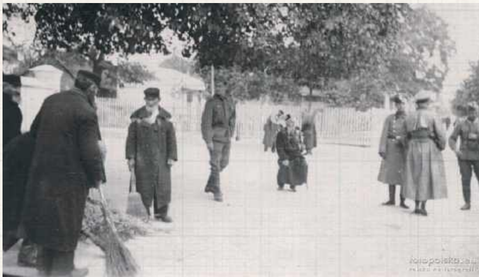
Plac przed klasztorem i kościołem kapucynów w Lubartowie w 1940 roku. Na miejscu lata okupacji i Zagłady udało się przetrwać tylko około 20 spośród 3400 lubartowskich Żydów

Na stronie projektu znajdujemy zestaw zagadnień, którymi zajmowali się uczeni. Kto uciekł? Kiedy i dokąd? Z kim? Kto przeżył? Nie chodzi tylko o policzenie, ile osób wyjechało, ile zostało deportowanych, a ile zostało. Chodzi raczej o powiązanie ich kierunków z otoczeniem rodzinnym, ekonomicznym i sąsiedzkiem,