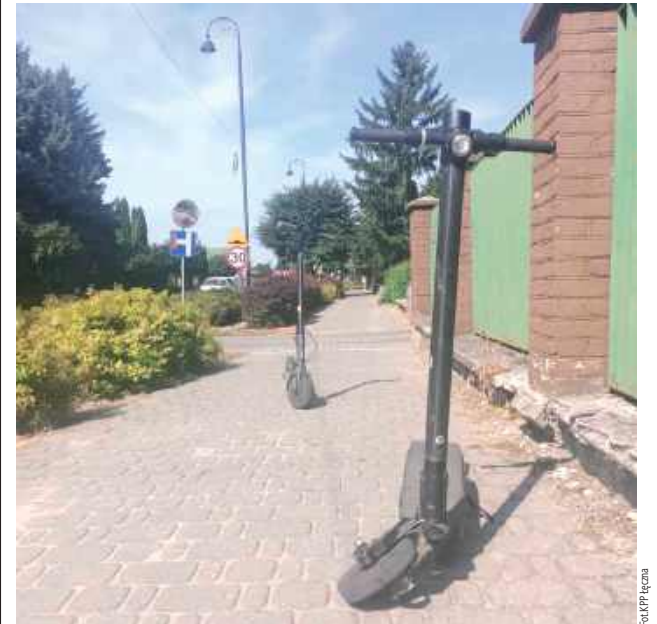
Drugi z chłopców nie doznał obrażeń

ŁĘCZNA: Kierująca Toyotą nie ustąpiła pierwszeństwa przejazdu nastoletniemu chłopcom na hulajnogach elektrycznych po chodniku. Jeden z nich trafił do szpitala.