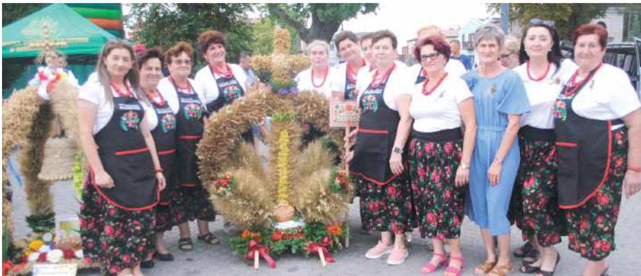
KGW Białowianki z Białobrzeg