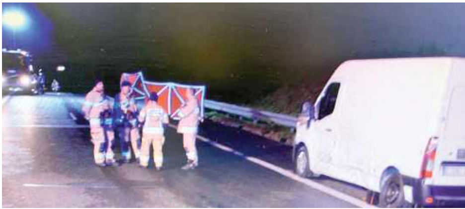
Ciężarówka potrafiła dwóch mężczyzn w wieku 49 i 28 lat, którzy na pasie awaryjnym wymieniali koło w busie

- Z ustaleń policjantów wynika, że dwaj mężczyźni w wieku 49 i 28 lat podczas wymiany koła w pojeździe zostali potrąceni przez samochód ciężarowy, którym kierował 28-letni obywatel Ukrainy. Mężczyźni mieli na sobie