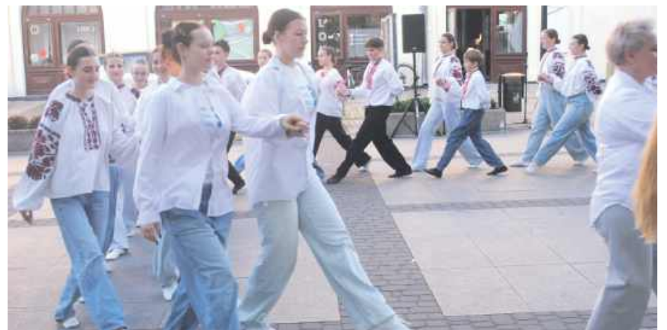
Jednym z punktów warsztatów była nauka poloneza

Wspólna nauka tańca była jednym z punktów wizyty w Lubartowie gości ze Sławuty - partnerskiego miasta na Ukrainie.