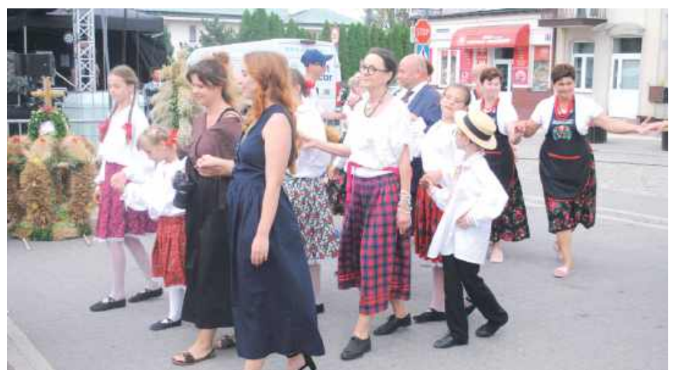
Tańce przy muzyce Kapeli z Borówka