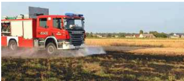
Strażacy z OSP Abramów gasili pożar łąki w Wolicy