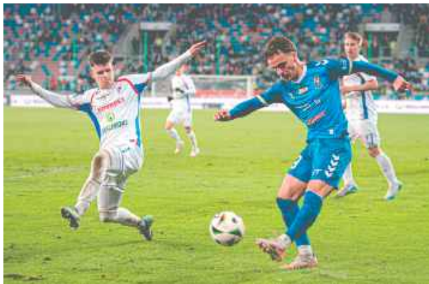
Pierwsze wyjazdowe zwycięstwo lubelskiego zespołu w tym sezonie

Do przerwy w Zabrzu nie padły żadne gole, a spotkanie nie