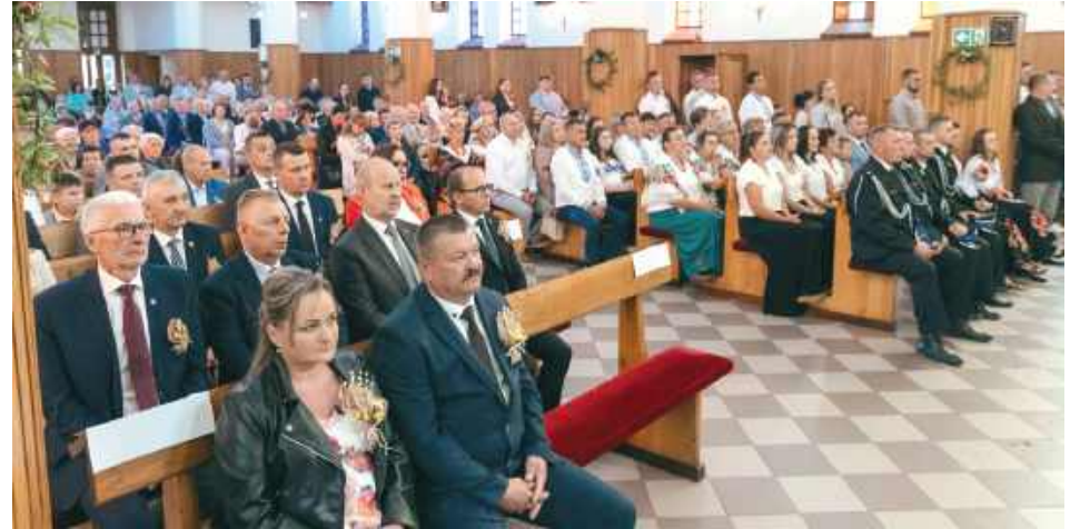
W dożynkowej mszy świętej uczestniczyły władze gminy i zaproszeni goście