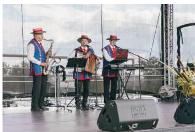
Na scenie występowały zespoły muzyczne