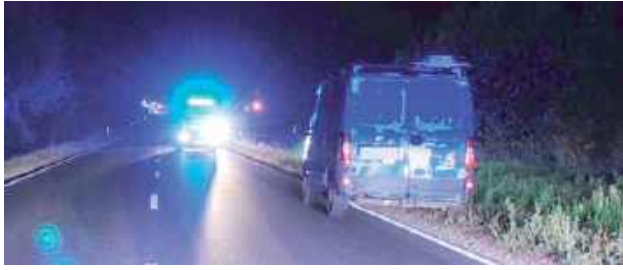
31-letni mieszkaniec Świdnika, idąc poboczem w kierunku Poizdowa, został potrącony przez kierującego pojazdem marki Fiat Ducato

- Jak wstępnie ustalili policjanci 31-letni mieszkaniec Świdnika, idąc poboczem