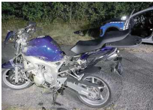
W piątek (29 sierpnia) motocyklista „wypadł” z zakrętu

W piątek (29 sierpnia) motocyklista „wypadł” z zakrętu. Na miejscu policjanci ustalili, że prawdopodobną przyczyną kolizji była nad-