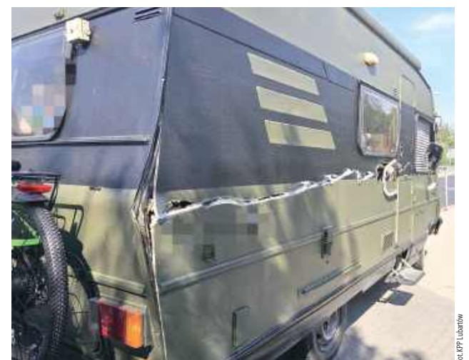
Bok Peugeota został uszkodzony