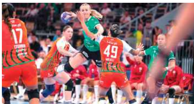
Superpucharowe starcie rozgrywane w Atlas Arenie w Łodzi

nianki miały spore problemy ze skutecznością. Najlepiej świadczy o tym fakt, że w ciągu 21 minut rzuciły tylko pięć bramek. Ostatecznie na przerwę zeszyły, przegrywając 9:13.