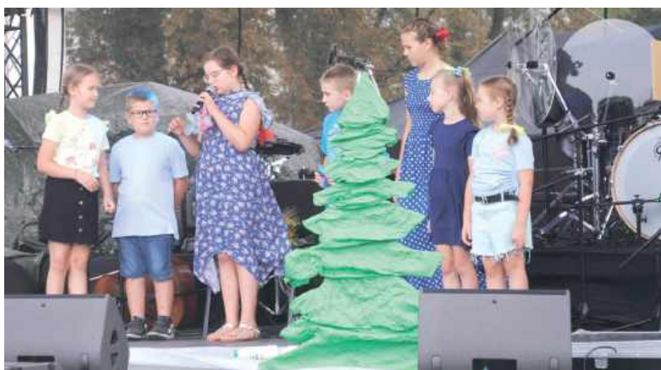
Dzieci wystąpiły w ekologicznym przedstawieniu