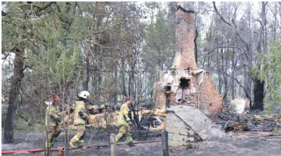
Pożar na terenie gm. Firlej rozpoczął się od zapalenia się pustostanu

- Po raz pierwszy w swojej 13-letniej służbie zetknął się z pożarem, który dosłownie