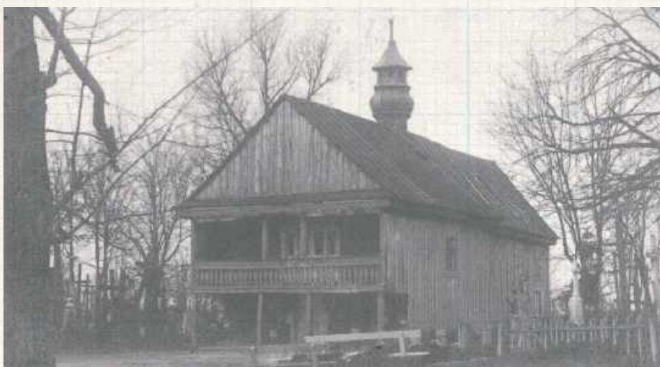
Zdjęcie wykonane po 1943 roku, już po przebudowie sygnaturki z bani na słupową latarnię

W XVII i XVIII wieku wybudowano dwa piękne, murywane kościoły klasztorne bernardynów i pijarów. Nie były one jednak siedzibami parafii. W początkach XIX wieku sytuacja była dość zaskakująca: w mieście były dwa okazałe kościoły klasztorne, natomiast wierni w niedzielę i święta tłoczyli się w niewielkim, drewnianym, zdaje się, że niespełniającej urody. W efekcie, na mocy podpisanego porozumienia między biskupem