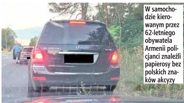
W aucie zapakowane było blisko 2000 paczek papierosów różnych marek

- W trakcie kontroli przy puszczeniu funkcjonariuszy potwierdziły się. W samochodzie kierowanym przez 62-letniego obywatela Armenii policjanci znaleźli papierosy bez polskich znaków akcyzy. W aucie zapakowane było blisko 2000 paczek papierosów różnych marek - informuje