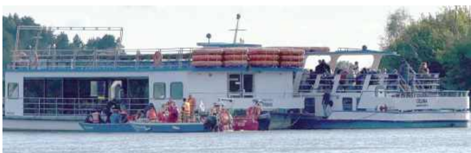
Ratownicy ewakuowali kilkanaście osób, w tym kobietę w ciąży oraz osoby z niepełnosprawnościami, do portów jachtowych w Kazimierzu Dolnym i Janowcu

W niedzielę, 24 sierpnia, około godziny 16.28 do służb ratunkowych wpłynęło zgłoszenie o zdarzeniu na rzece Wiśle w rejonie przeprawy promowej