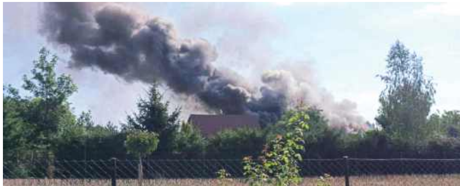
Ogień rozprzestrzenił się błyskawicznie. Akcję dodatkowo utrudniał silny wiatr