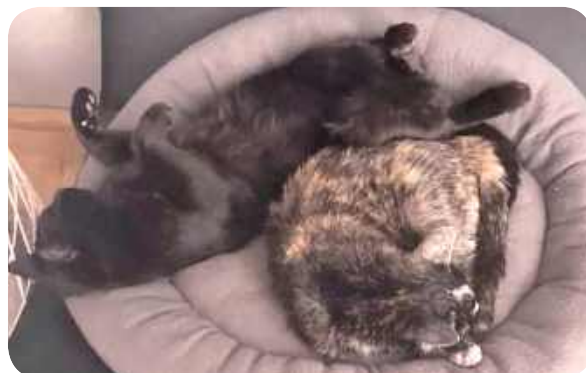
Ziuta i Cicipusio, Karolina, Głodno