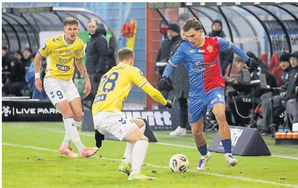
Ważne punkty w kontekście utrzymania Motor Lublin wywalczył w delegacji w Gliwicach