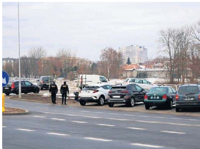
Wybierając się samochodem na giełdę przy Dworaka, klienci muszą liczyć się z brakiem parkingu lub mandatem