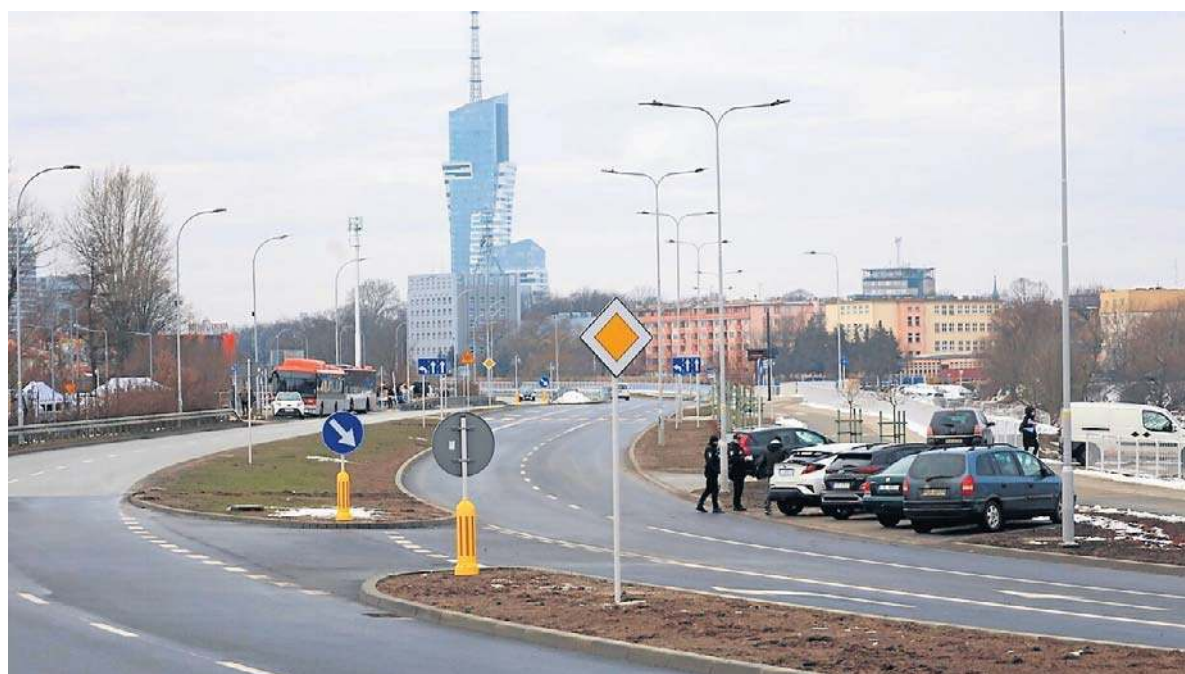
Strażnicy miejscy wczoraj karali kierowców za parkowanie w niedozwolonym miejscu przy Wisłokostradzie

Nie zgadzamy się na budowę bloków przed naszymi domami. Protest mieszkańców str. 8