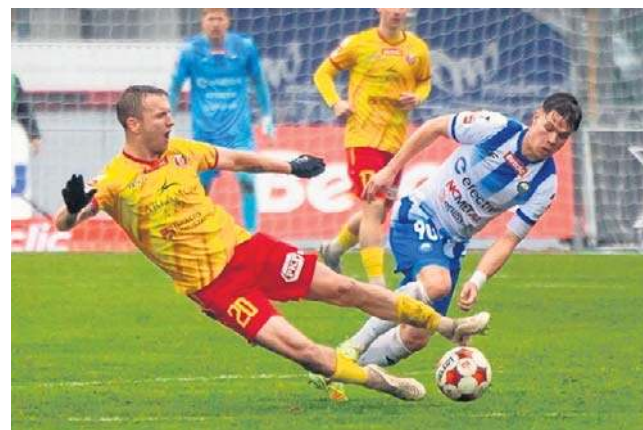
Piłkarze Stali Mielec mają jeden cel przed najbliższym starciem z ŁKS-em Łódź - zdobyć wreszcie trzy punkty

W poniedziałek również nie będzie łatwo o wygraną. Na Podkarpacie przyjeżdża naspikowany gwiazdami ŁKS Łódź, który oczywiście zawodzi w tym sezonie, ale