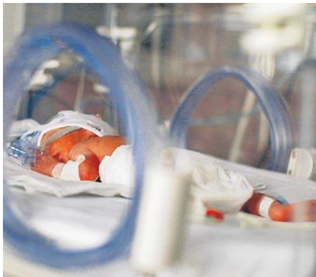
Wiceminister: decyzja w sprawie utworzenia izby porodowej należy do zarządzających szpitalami

Jak ustalono, ogień wybuchł w jednopokojowym mieszkaniu. 54-letni mieszkaniec Przemyśla leżał metr od płonącego mebla. Mężczyzna był nieprzytomny w chwili odnalezienia, dzięki tlenoterapii i opiece ratowników odzyskał przytomność jeszcze przed transportem do szpitala. Trafił pod opiekę lekarzy w stanie utrudnionego kontaktu. ©©