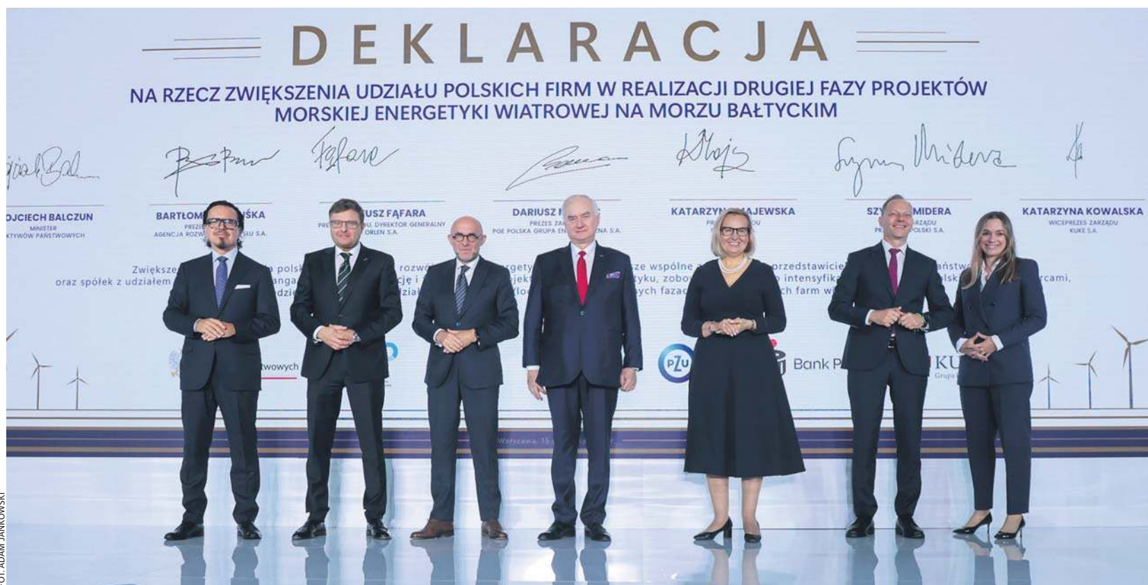
II edycja Forum „Energia z Polski”. Podpisanie deklaracji o udziale polskich firm w budowie morskich farm wiatrowych.

Wydarzenie odbywa się pod hasłem „Wind Factory of Europe” i jest adresowane szczególnie do sektora małych i średnich przedsiębiorstw (MŚP). Dzięki swojej elastyczności i innowacyjności to właśnie one mogą stać się strategicznymi