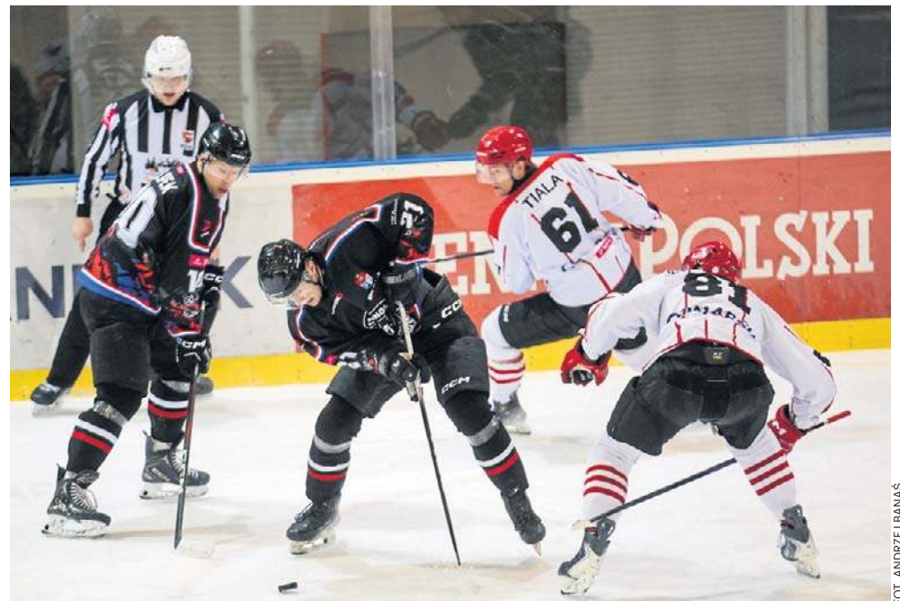
Zawodnicy STS Sanok rozegrali w tym sezonie 34 mecze. Wszystkie pojedynki przegrali