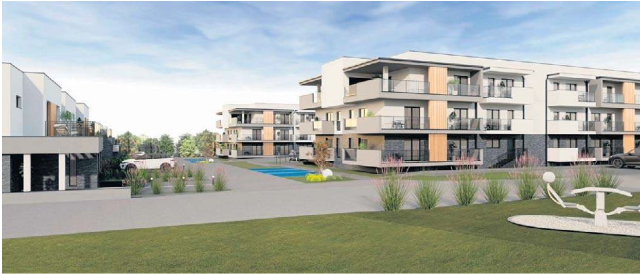
Koncepcja architektoniczna przedstawiona przez inwestora we wniosku o ustalenie lokalizacji mieszkaniowej w dzielnicy Turaszówka w Krośnie

Jak poinformował przedsiębiorca - planowana inwestycja zakłada budowę kolejnych pięciu bloków. Trzy z nich miałyby wysokość ponad 10 metrów i trzy kondygnacje, dwa - wyso-