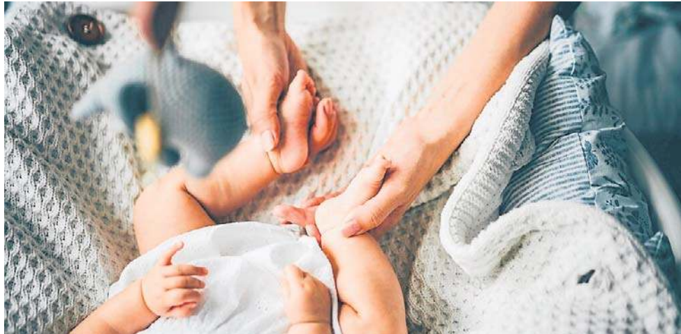
Rzeszowski Bon Żłobkowy do likwidacji?(zdjęcie poglądowe). - W projekcie uchwały jest zapisane, że bon żłobkowy przestanie obowiązywać 31 sierpnia 2026 roku

Jednak w 2026 roku, urzędnicy nie widzą już potrzeby w dopłacaniu do miejsc w prywatnych żłobkach. Chcą więc zlikwidować bon, ale na to musi się zgodzić rada miasta. Sprzeciwiają się temu rodzice,