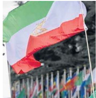
Demonstracje odbyły się na terenie kilku uczelni

BBC zweryfikowało także nagranie z Uniwersytetu Technologicznego im. Amira Kabira, na którym widać tłum skandujący antyrządowe hasła. W położonym na północnym wschodzie Meszhedzie, drugim co do wielkości mieście Iranu, miejscowi studenci skandowali: „Wolność!”