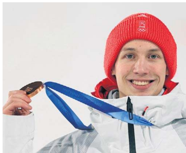
Za świetny występ olimpijski Kacper Tomasiak może liczyć na 1 980 000 złotych z tytułu nagród finansowych

Igrzyska olimpijskie Łyżwiarka Kamila Sellier zniesiona na noszach