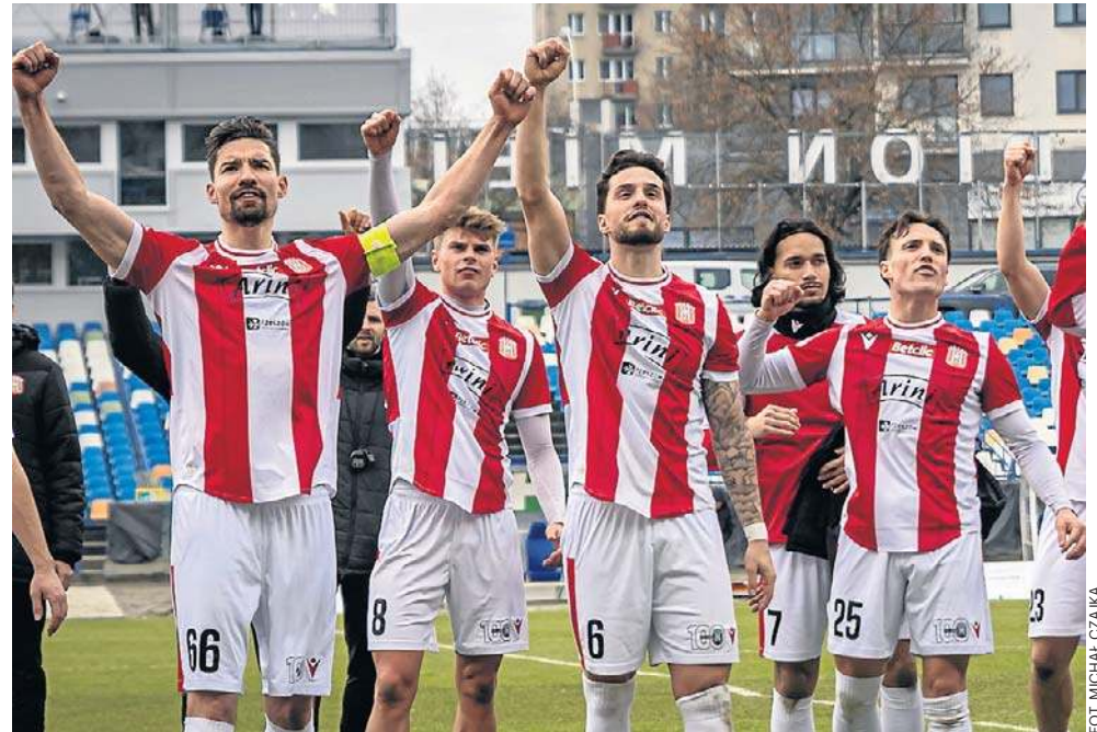
Piłkarze i kibice Resovii mieli powody do radości po zakończeniu niedzielnego meczu

Początek raczej należał do piłkarzy z Rzeszowa, którzy częściej byli przy piłce i próbowali organizować swoją grę w ofensywie. Z czasem gra trochę bardziej się wyrównała. Nie było jednak ciekawych sytuacji ani z jednej, ani z drugiej strony. W 29. minucie ucieszyli się kibice Resovii, bo do siatki trafił Bałdyga, ale radość gospodarzy trwała krótko, bo sędzia liniowy po chwili podniósł chorągiewkę w górę sygnalizując spalonego. Już w kolejnej akcji znowu było bardzo blisko, bo