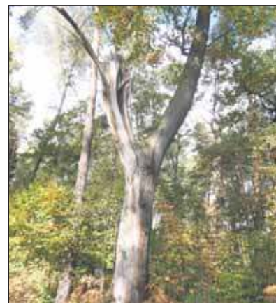
Póżywy dąb szypułkowy

Ten las skusił mnie przede wszystkim swoją nazwą, wypowym charakterem oraz posiadaniem na swoim obszarze Mostu Cygańskiego. Ma on również swoje hasło w Wikipedii. Tamże informacja jest bardzo