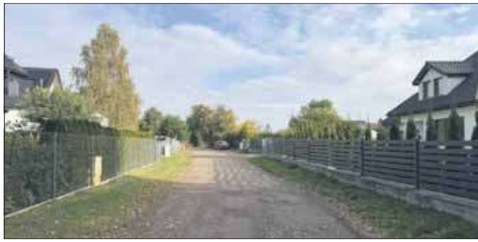
Obecnie ul. Szprotawy. W Przyszłości ulica Dzika

Jak tłumaczą, propozycja nawiązuje do kameralnego charakteru ulicy oraz zamiłowania mieszkańców do dzikiej przyrody. Jej właśnie w tej części miasta nie bra-