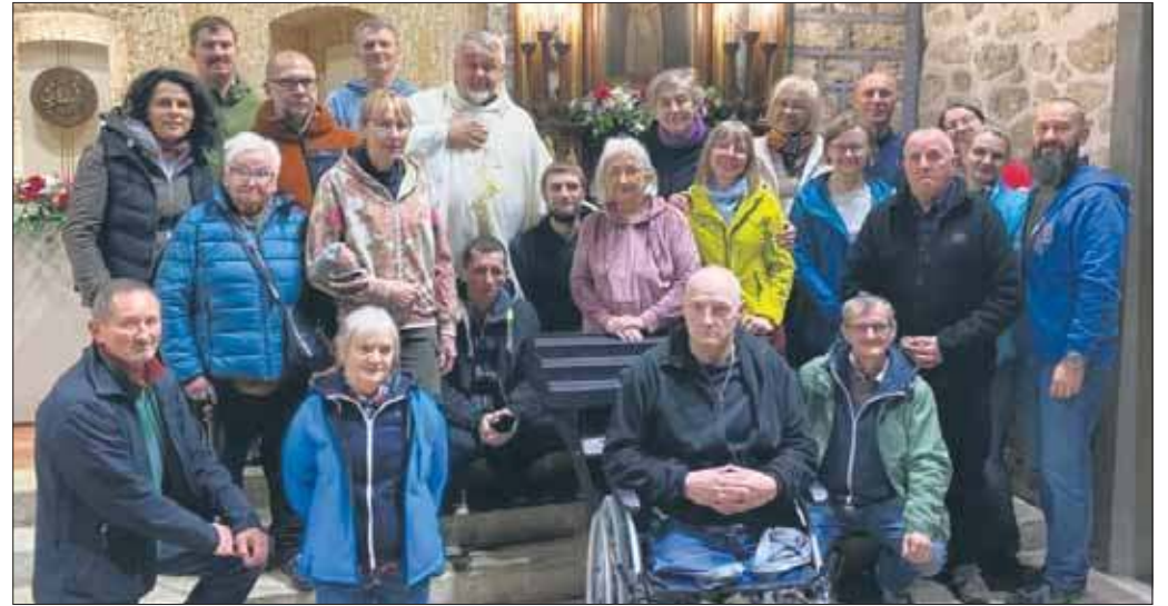
Rekolekcje Wspólnoty Betlejem w Greccio

W spólnota Betlejem przeżyła swoje rekolekcje we Włoszech. Przez siedem dni dwudziestu trzech uczestników, w tym mieszkańcy domu, wolontariusze oraz sympatycy wspólnoty spędzili czas na modlitwie oraz wędrówce. Relacje z rekolekcji w Greccio przedstawił ks. Mirosław Tosza.