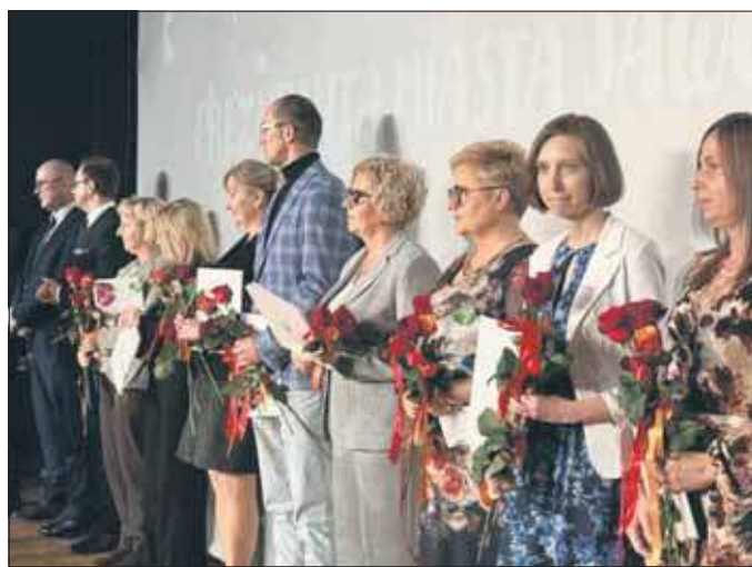
Dzień Nauczyciela 2025 w Jaworznie

Uroczyste obchody Dnia Edukacji Narodowej w Jaworznie. Ponad 100 nauczycieli, dyrektorów oraz pracowników jaworznickich placówek odebrało z rąk prezydenta wyróżnienia za swoją pracę.