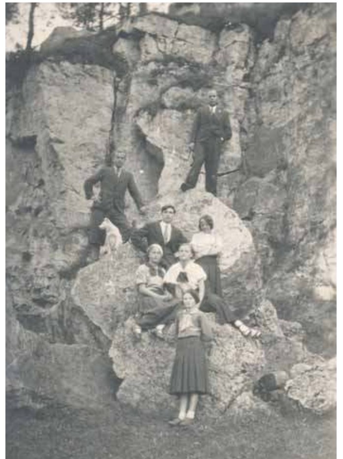
Skalka w latach 30. XX wieku

Okolica ta należy do osobliwych i po trochu dziwnych. Przez niemal cały XIX wiek stanowiła rejon przygraniczny; na Białej Przemyszy przebiegała bowiem granica państwowa. Obszar Jaworzna współczesnego, usytuowany na południe od linii rzeki, najpierw należał do Rzeczypospolitej Krakowskiej, potem natomiast, od roku 1846, stanowił część zaboru austriackiego, a dokładniej Galicji wraz z Wielkim Księstwem Krakowskim. I to właśnie tam, nad Białą Przemszą, w okolicach powszechnie zwanych Skalką, leży tytułowe Zatwardzie. Nazwa nawiązuje do ukształtowania tamtejszego terenu oraz do struktury geologicznej wspomnianej okolicy. Otóż generalnie gleby w tamtych stronach są piaszczyste. Jednak rejon Skalki, jak sama nazwa wskazuje, stanowiącej część tzw. garbu długoszyńskiego, jest zdecydowanie skalisty, twardy. Wszystko to więc co leży za skalistym, twardym terenem zwane jest Zatwardziem właśnie. Dotyczy to nade wszystko obszaru od strony Długoszyzna, w kierunku Moniska oraz starej sztolni. Ta okolica jest już zdecydowanie piaszczysta, a więc miękka. Sama nazwa Zatwardzie nie jest zbyt mocno rozpowszechniona wśród okolicznej ludności, jednak na współczesnych mapach i planach miasta pojawia się obecnie dość regularnie. Zresztą okolica ta jest dość bogata w osobliwe nazwy oraz miejsca o bogatej historii. U podnóża Skalki, od strony rzeki znajduje się np. tzw. Kulówka, w rejonie której znajdowała się niegdyś przystań rzeczna w ramach Ligi Morskiej i Kolonialnej, na miejscu której funkcjo-