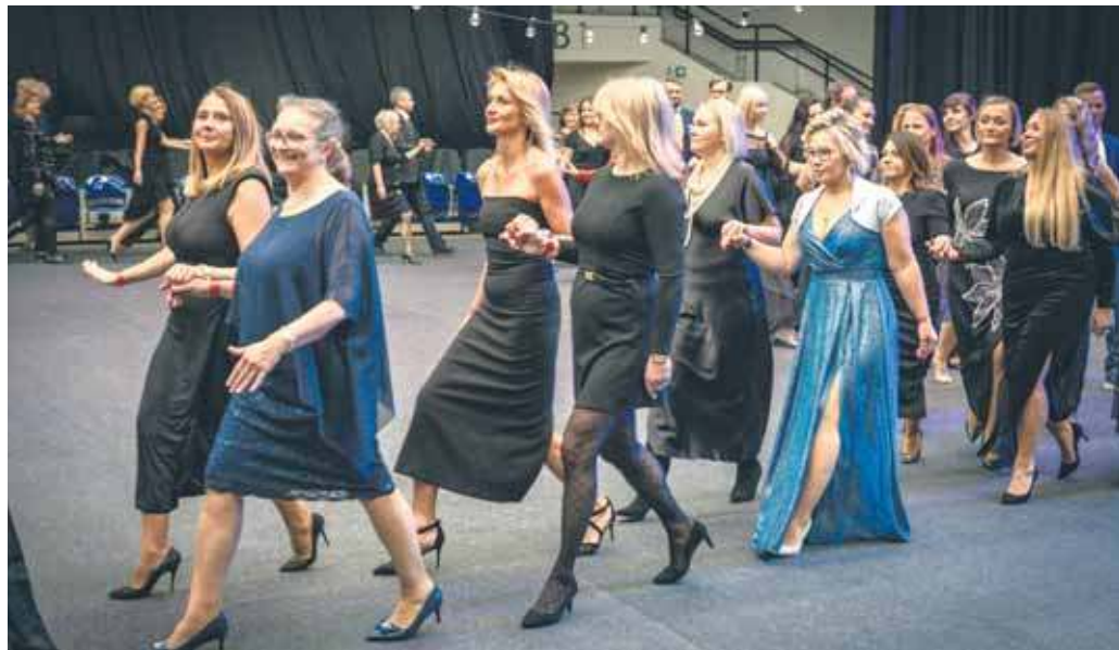
Bal Absolwentów z okazji 80-lecia I Liceum Ogólnokształcącego im. Tadeusza Kościuszki w Jaworznie

W yjatkowy Bal Absolwentów z okazji 80-lecia szkoły, I Liceum Ogólnokształcącego im. Tadeusza Kościuszki w Jaworznie. Absolwenci bawili się znakomicie – w atmosferze radości, wzruszeń i wspomnień sprzed lat. To już dziesiąty taki bal, który stał się piękną tradycją spotkań dawnych uczniów.