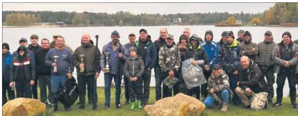
Zawody wędkarskie nad zalewem Sosina

Wędkarze nad Sosiną zakończyli sezon wędkarski 2025. Odbyły się zawody wędkarskie organizowane przez Koło PZW nr 57 Szczakowa Miasto – Jaworzno.