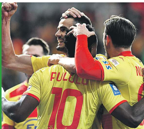
Czy Jagiellonia utrzyma mistrzowską dyspozycję?