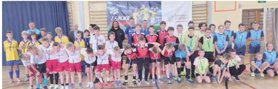
Z tych piłkarzy kiedyś będą piłkarze. Gromu, Dwernickiego Stoczek Łukowski, może Orląt, może Arse-nalu... Na razie rywalizowali w Turnieju z Orlika na Stadion w kategorii U-13

Rozegrano lokalne eliminacje największego polskiego młodzieżowego turnieju piłkarskiego. Przygoda zaczęta na boisku w Kąkolewnicy może dla małych piłkarzy zakończyć się w maju na Narodowym.