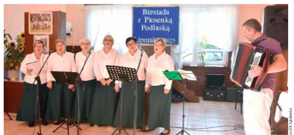
Gospodynie wydarzenia podczas występu