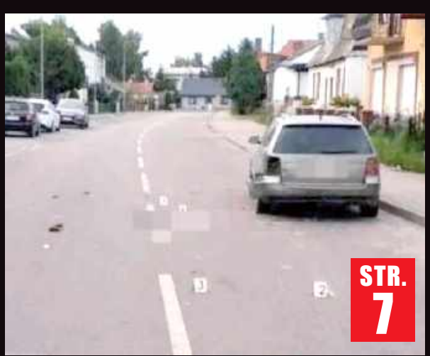
Dramat rozegrał się w czerwcu 2024 roku

Sąd umorzył sprawę w tym zakresie, uznając że nie można przypisać oskarżonemu spowodowania wypadku ze skutkiem śmiertelnym.