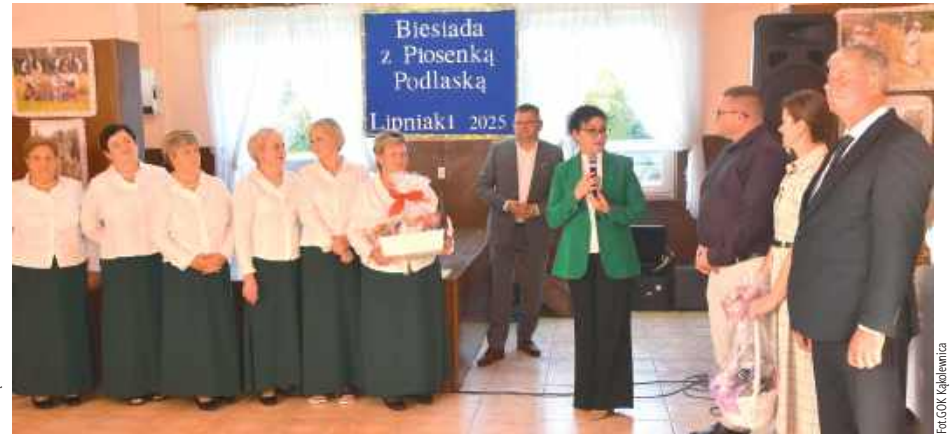
Wszystkie przybyłe zespoły otrzymały podziękowania