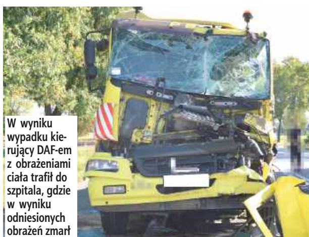
W wyniku wypadku kierujący DAF-em z obrażeniami ciała trafił do szpitala, gdzie w wyniku odniesionych obrażeń zmarł