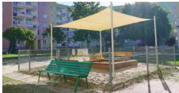
Nowa przestrzeń powstała przy blokach przy ul. Jagiellończyka 1 i Chmielowskiego 2

Na wiosnę 2026 roku planowane są kolejne prace – m.in.