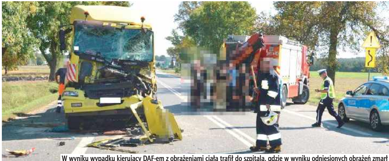
W wyniku wypadku kierujący DAF-em z obrażeniami ciała trafił do szpitala, gdzie w wyniku odniesionych obrażeń zmarł

Biała Podlaska: W wyniku wypadku, w szpitalu zmarł 39-latek. Ze wstępnych ustaleń wynika, że kierujący DAF-em wjechał w tył ciężarowego Volvo.