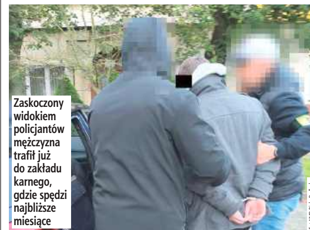
Zaskoczony widokiem policjantów mężczyzna trafił już do zakładu karnego, gdzie spędzi najbliższe miesiące

Biała Podlaska: Policjanci zatrzymali 34-latka poszukiwanego listem gończym. Funkcjonariusze weszli oknem do domu, w którym przebywał.