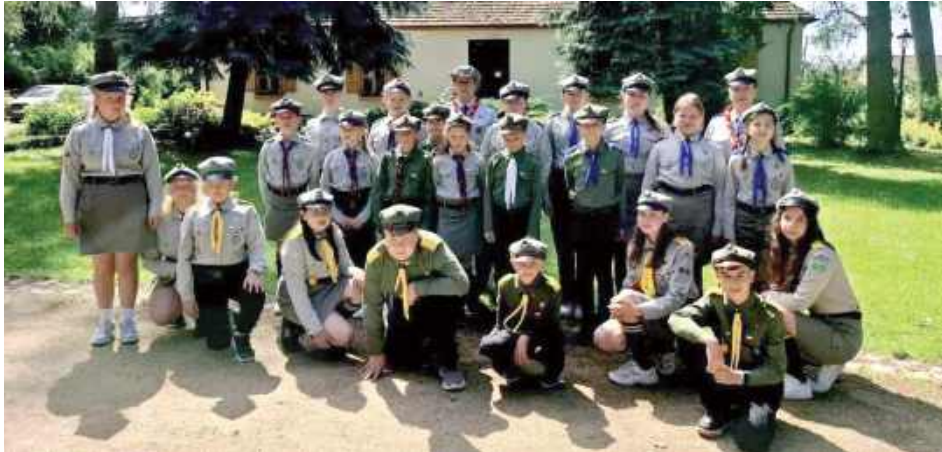
Przedsięwzięcie zostało dofinansowane w ramach umowy „Z miejsca na miejsce” na realizację zadań z zakresu turystyki i krajoznawstwa we współpracy z Miastem Radzyni Podlaski

Pierwszym etapem wakacyjnej przygody był złot druhów i druzhen Hufca ZHP Łuków im. Bohaterów Ziemi Łukowskiej w Muzeum Henryka Sienkiewicza. Od 28 czerwca do 1 lipca harcerze uczestniczyli w zajęciach pod hasłem „Światło Latarnika”, nawiązującym do słynnej noweli noblisty. Program nawiązywał do tematyki marynistycznej – były szanty, gra terenowa „Na tropie morskiej przygody”, turniej sportowy dla „wilków morskich i szczerów lądowych”, a także warsztaty literackie i plastyczne. Uczestnicy odwiedzili muzeum i pobliską Okrzeję, a zdobyte wiadomości sprawdzili w quizie