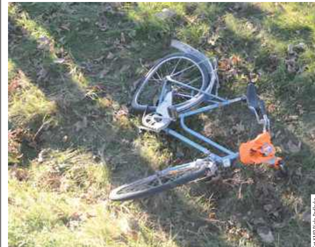
Rowerem kierował 51-latek, który z obrażeniami ciała trafił do szpitala

Biała Podlaska: Kierująca Citroenem 55-latką wjechała jadącego w tym samym kierunku rowerzystę. Wstępne ustalenia wskazują, że oślepiąca słońcem nie zauważyła cyklisty.