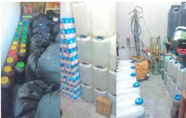
Policjanci łącznie zabezpieczyli niemal 1400 litrów gotowego alkoholu i ponad 800 litrów „zacieru”

Aparaturę do produkcji alkoholu oraz łącznie niemal 1400 litrów gotowego trunku, a także ponad 800 litrów „zacieru” zabezpieczyli radzyńscy kryminalni na terenie gospodarstwa w gminie Czemierniki. Policjanci zatrzymali na miejscu 42-latkę.