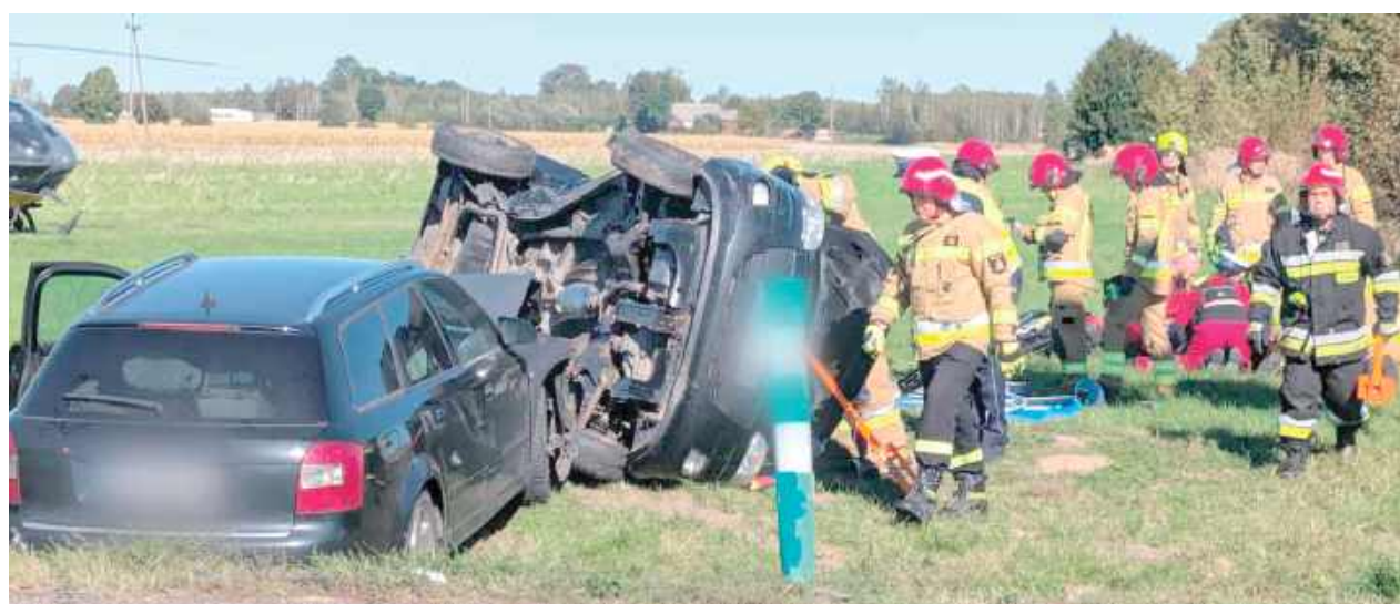
Jak przekazał komisarz Piotr Mucha, rzecznik radzyńskiej policji, 66-letnia kierująca Hyundaiem, mieszkanka Warszawy, nie zastosowała się do znaku „STOP” i nie ustąpiła pierwszeństwa przejazdu

POWIAT RADZYŃSKI: Na drodze krajowej nr 63, w Bezwoli na skrzyżowaniu kierującym z Wohynia do Międzyrzecza Podlaskiego, doszło do groźnego wypadku z udziałem dwóch samochodów osobowych – Hyundai i Audi A4. Do poszkodowanych wezwano śmigłowiec Lotniczego Pogotowia Ratunkowego.