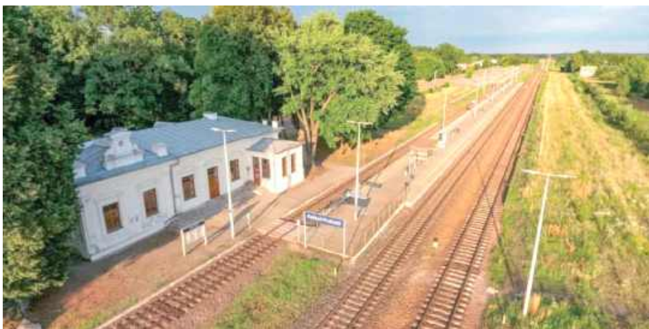
Dworzec w końcu doczeka się zastróżonej modernizacji. PKP obiecuje bezpieczeństwo i komfort podróżnych

Modernizacja poprawi komfort pasażerów oraz zwiększy atrakcyjność komunikacyjną regionu. PKP podejmuje to przedsięwzięcie jako jedno z największych inwestycji w ostatnich latach, mając na celu stworzenie nowo-