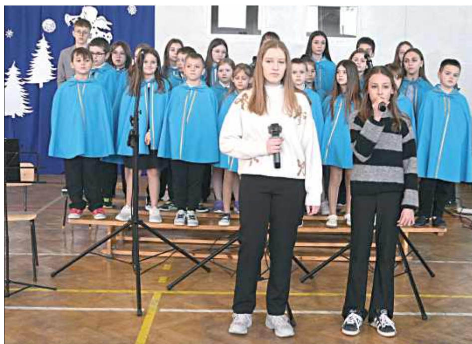
W Szkole Podstawowej im. Jana Pawła II w Księżpolu odbyło się wyjątkowe wydarzenie, które wprowadziło całą społeczność szkolną w magiczną atmosferę Świąt Bożego Narodzenia

Atmosferę świąteczną dopełnił występ szkolnego chóru Tęcza, który porwał wszystkich do wspólnego kołędowania. Piękne, świąteczne utwory w wykonaniu chóru wprowadziły wszystkich