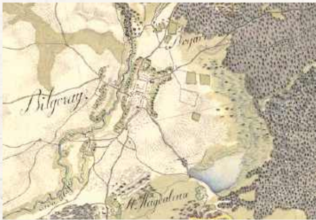
Biłgoraj w 1804 roku

Jak wiadomo, nie ma żadnych źródeł na to, że jakoby Jan Sariusz Zamoyski wybudował kościół bądź kaplicę, jak