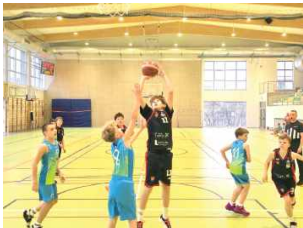
Młodzi koszykarze z Biłgoraja (niebieskie stroje) podejmowali zdecydowanego faworyta rozgrywek - Start Lublin

- Podjęliśmy rękawice i walczyliśmy do samego końca. Mimo porażki nie zabrakło wielu ciekawych akcji w ataku oraz udanych interwencji w obronie. Takie mecze tylko utwierdzają nas w przekonaniu, że idziemy w dobrym kierunku i z każdego spotkania