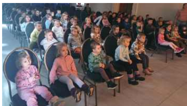
Dzięki takim inicjatywom Gminna Biblioteka Publiczna w Turobinie staje się miejscem, które łączy kulturę, edukację i zabawę, zachęcając młodsze pokolenie do aktywności kulturalnych

Na tym jednak nie kończą się plany biblioteki, która zapo-