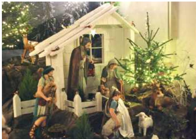
Szopka bożonarodzeniowa jest obowiązkowym elementem wystroju każdego kościoła. Ta w parafii Trójcy Świętej jest wyjątkowo piękna

Pasterka należy do najbardziej symbolicznych liturgii w ciągu roku. Nawiązuje do ewangelicznego wydarzenia, gdy pasterze jako pierwsi przy-