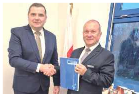
Gmina Biłgoraj zapewnia, że dzięki pozyskanym środkom Gminny Ośrodek Pomocy Społecznej zostanie przekształcony w nowoczesne Centrum Usług Społecznych

Prace nad przekształceniem rozpoczną się na początku 2026 roku, natomiast pierwsze działania