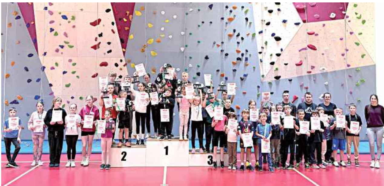
Atmosfera zawodów była wspaniała!

20 grudnia w Gminnym Centrum Sportu i Rekreacji w Potoku Górnym odbyły się pierwsze w historii Ziemi Biłgorajskiej zawody wspinaczkowe. W tej imprezie wzięło udział 40 zawodników, którzy rywalizowali w 6 kategoriach wiekowych, z podziałem na dziewczęta i chłopcy. Liczyły się najlepsze czasy wspinaczki na szczyt, była zdrowa rywalizacja oraz ogromne zaangażowanie. I co najważniejsze - było bezpiecznie. Nad bezpieczeństwem czuwali właśnie operatorzy ścianki wspinaczkowej. Świątecznym akcentem była wizyta św. Mikołaja.