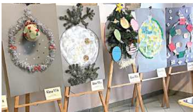
Konkurs cieszył się dużym zainteresowaniem i zakończył się wystawą prac oraz wręczeniem nagród

Gminna Biblioteka Publiczna w Aleksandrowie zorganizowała konkurs plastyczny dla uczniów szkoły podstawowej, w którym uczestnicy mieli za zadanie stworzyć bombki choinkowe inspirowane literaturą. Konkurs cieszył się dużym zainteresowaniem i zakończył się wystawą prac oraz wręczeniem nagród.