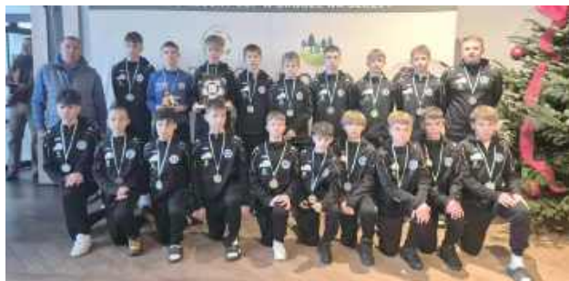
Akademia Piłkarska Łada 1945 Biłgoraj zakończyła turniej w Woli Chorzelskiej na drugim miejscu

- W ciągu trzech dni rozegraliśmy osiem meczów. Drużyna za-