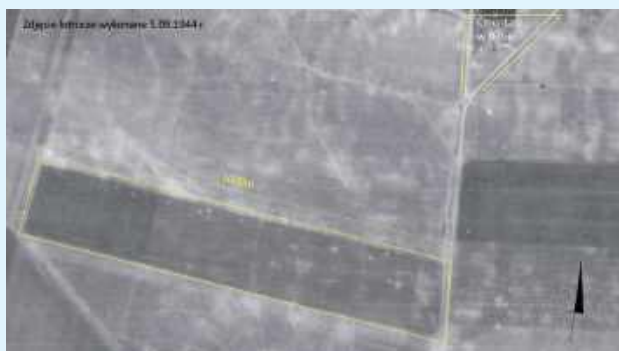
Zdjęcie lotnicze wykonane we wrześniu 1944 pokazuje tzw. wyrus pasy startowego w Dubie

sku w Dubie (pow. zamojski). Okazuje się, że nie do końca jest znana jego lokalizacja. Spotkaliśmy się z opisem, że było ono położone na południe od m. Dub, z czym nie do końca się zgodziliśmy. Waldemar Wojciech Bednarski pisze, że na przełomie lat 1940/41 rozpoczęły się niemieckie przygotowania do ataku na Związek Sowiecki. Łatwo to było zauważyć na terenie gminy kotlickiej, ponieważ oddziały Baudienstu (1) przystąpiły do budowy lotniska i baraków dla personelu na terenie kolonii Dub, w pobliżu cmentarza, na którym zorganizowano skład bomb lotniczych i amunicji. Na polecenie władz niemieckich żołnierze zorganizowali szarwarki. Codziennie dostarczano kilkadziesiąt furmanek i 150