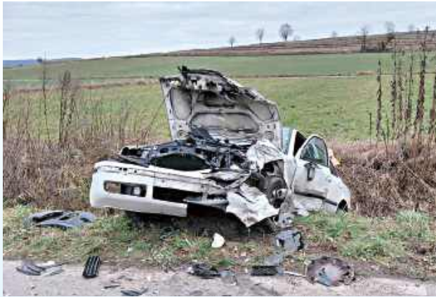
W miejscowości Zaporze kierujący Oplem na prostym odcinku drogi nagle stracił panowanie nad pojazdem

Koszmarny wypadek w powiecie zamojskim. W miejscowości Zaporze (gm. Radecznica), kierujący Oplem na prostym odcinku drogi nagle stracił panowanie nad pojazdem, zjechał na przeciwny pas ruchu i czołowo zderzył się z kierującym Skodą. Niestety życia kierującego oplem 63-latek nie udało się uratować.