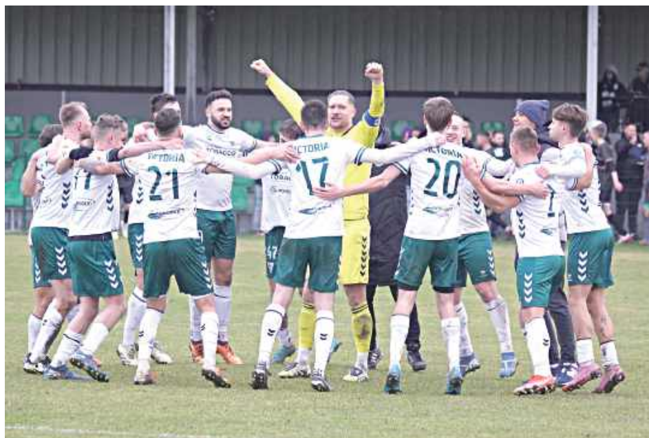
Trzynastą raz w rundzie jesiennej po meczach Victorii Łukowa była wielka radość. A co będzie się działo po ostatnim meczu sezonu?

- Nie ma co zakłamywać rzeczywistości i mówić ogólnikami. Walczyliśmy o awans do IV ligi i finalnie chcielibyśmy zakończyć ten sezon na pierwszym miejscu. Kto będzie najgroźniejszym rywalem? Przerwa zimowa ma to do siebie, że potrafi mocno zmienić oblicze niektórych zespołów. Głównie mam na myśli transfery i ruchy personalne w zespołach. Ta przerwa jest dosyć długa. Jedni się wzmacniają, żeby grać o awans, inni zrobią wszystko, żeby urywać punkty faworytom i się utrzymać. Na