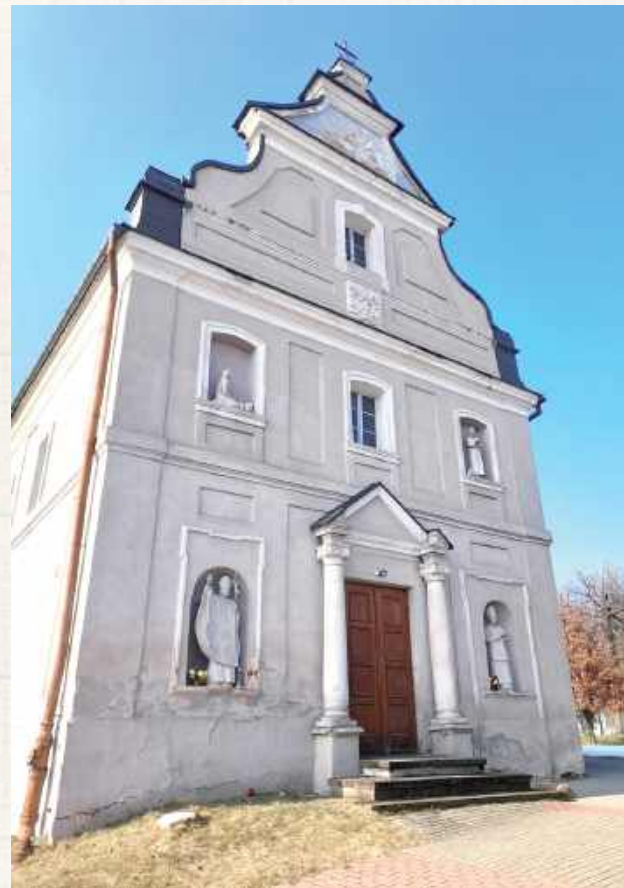
Parafia w Puszczy Solbskiej istnieje od 1721 roku

parafii w Biłgoraju w 1624 roku albo słynny, nieszczęsny już podział parafii na Biłgoraj i Puszcza Solbska, można włożyć między bajki. Tym bardziej, że nie ma żadnego dokumentu, żadnego źródła, który to potwierdzi. Jeśli chodzi o 1692 rok, to przypomnimy, iż przed