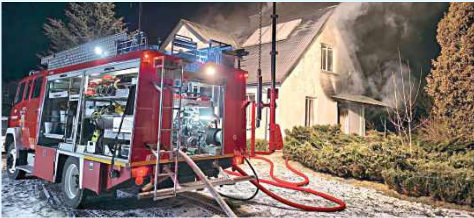
Po rozszczelnieniu przewodu kuchenki gazowej zasilanej z butli doszło do wybuchu i pożaru w murowanym budynku mieszkalnym

- Wieczorem w pierwszy dzień świąt doszło do wybuchu gazu i pożaru w miejscowości Zarzeczce - informują strażacy z OSP KSRG Kosobudy. Straty w budynku są poważne, choć dokładnie nie zostały jeszcze oszacowane. W środku było aż 11 osób.