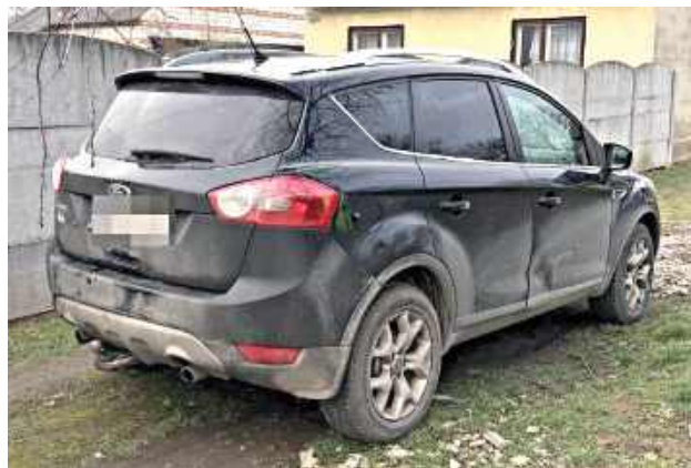
50-latek, cofając autem na podwórku, najechał na matkę. Kobieta stała z tyłu auta, nie zauważył jej

Dyżurny janowskiej komendy otrzymał zgłoszenie o zdarzeniu w miejscowości Krzemień Pierwszy, gm. Dzwola. Jak ustalili policjanci, na miejscu 50-latek, cofając au-