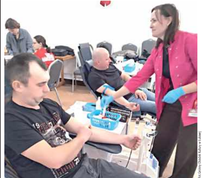
Wszyscy uczestnicy wykazali się ogromną odpowiedzialnością, oddając cenną krew, która ratuje życie wielu pacjentom w potrzebie

W Łukowej odbyła się 82. akcja poboru krwi, w której wzięło udział 60 osób. Dzięki ich zaangażowaniu, organizatorzy po raz kolejny podkreślili wagę tej cennej inicjatywy, która ratuje życie i wspiera chorych.