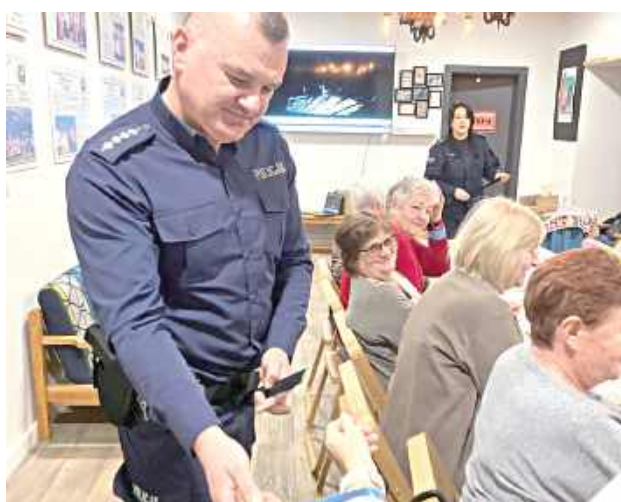
Spotkanie zostało zorganizowane przez Komendę Powiatową Policji w Biłgoraju we współpracy z Posterunkiem Policji w Tarnogrodzie i miało na celu zwrócenie uwagi na zagrożenia występujące na drogach oraz promowanie odpowiedzialnych zachowań uczestników ruchu

Debata miała miejsce w czwartek w Tarnogrodzkim Ośrodku Kultury. Podczas spotkania omówiono kwestie związane z wpływem codziennych decyzji podejmowanych na drodze na bezpieczeństwo wszystkich użytkowników. Policjantka prowadząca spotkanie podkreśliła, że bezpieczeń-