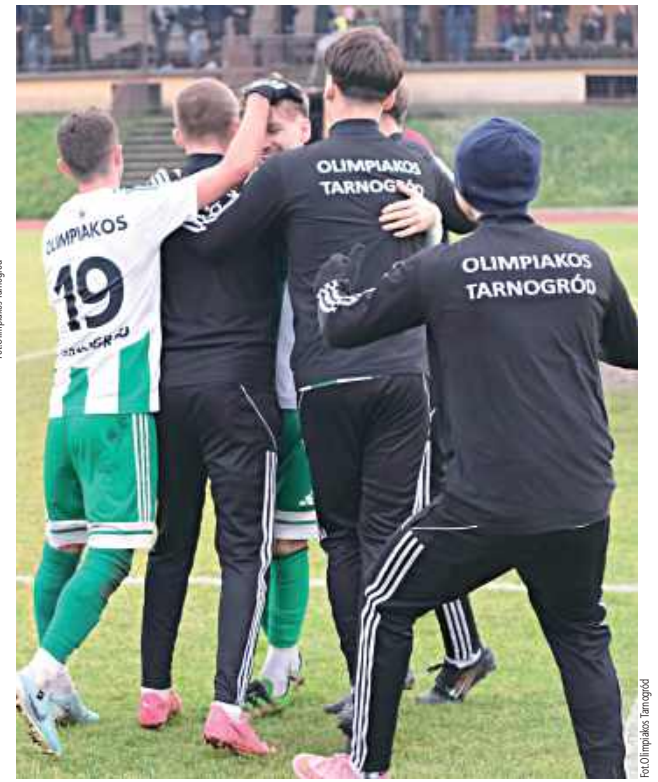
Oby wiosną jak najwięcej takich obrazków po meczach Olimpiakosu Tarnogród

31.01 - Sokół Sieniawa? 07.02 - BKS Biłgoraj 14.02 - Łada II Biłgoraj 21.02 - Błękitni Obsza 01.03 - WKS Majdan Sieniawski 07.03 - Piast Babice