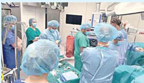
Nowy projekt w Papięskim Szpitalu w Zamościu ma zmodernizować kardiologię, wprowadzając najnowszy sprzęt i rozwiązania, które mogą ratować życie pacjentów

Dzięki nowym rozwiązaniom mieszkańcy regionu będą mogli korzystać z bardziej zaawansowanej diagnostyki, krótszych kolejek i nowoczesnych metod leczenia, które zwiększają szanse na szybszy powrót do zdrowia. Szpital podkreśla, że projekt nie tylko zmieni wygląd i funkcjonowanie