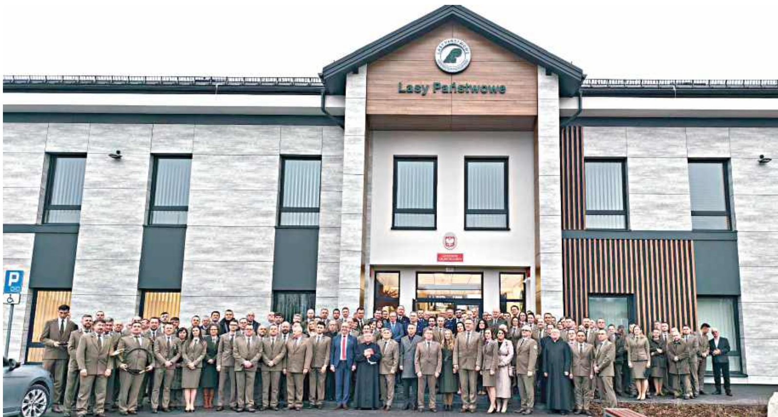
Leśnicy z Józefowa i zaproszeni goście na tle nowej siedziby Nadleśnictwa

Obiekt ma około 620 m 2 powierzchni użytkowej, jest przystosowany do potrzeb osób z różnymi wymaganiami i wyposażony w windę. Wyposażenie obejmuje też klimatyzację, monitoring i systemy alarmowe. Jako element zrównoważonego rozwoju zamontowano instalację fotowoltaiczną o mocy 50 kWp z własnym magazynem