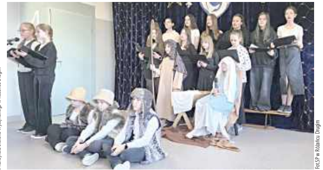
Wydarzenie spotkało się z dużym entuzjazmem i zostało ciepło przyjęte przez zaproszonych gości

Uczniowie, pod kierunkiem nauczyciela, zaprezentowali tradycyjną historię Bożego Narodzenia w nowoczesnym wydaniu, wzbogaconą o kolędy, piękne kostiumy oraz emocjonującą oprawę artystyczną