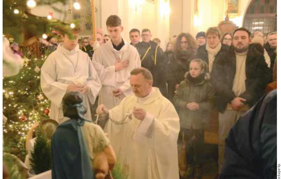
Pasterka sprawowana tradycyjnie o północy rozpoczęła świętowanie Bożego Narodzenia

Pasterka sprawowana o północy, barwne obrzędy w dniu św. Szczepana oraz kolędnicy odwiedzający domy – tak wyglądały tegoroczne Święta Bożego Narodzenia na Ziemi Biłgorajskiej.