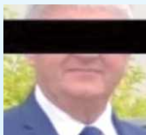
Były wójt Sułowa - Leon B., pomógł wygrać przetarg... firmie swojej żony

Prace budowlane ostatecznie zostały wykonane, ale wadli-