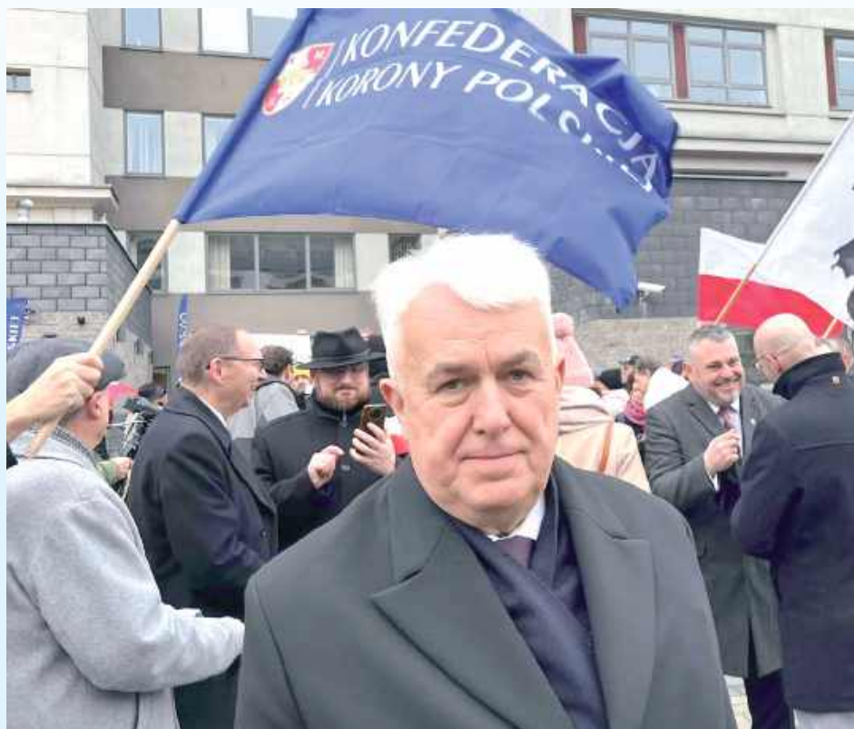
Poseł z Zamościa mówi o jak najszybszym wyjściu Polski z Unii Europejskiej

Przypomnijmy. Trybunał Sprawiedliwości Unii Europejskiej wydał przełomową decyzję. Chodzi o sprawę, w której Komisja Europejska pozwała Polskę za naruszenie kluczowych zasad unijnego porządku prawnego. Trybunał w pełni uwzględnił skargę Komisji i stwierdził uchybienia Polski. Po pierwsze wskazał, że TK nie respektując orzecznic-