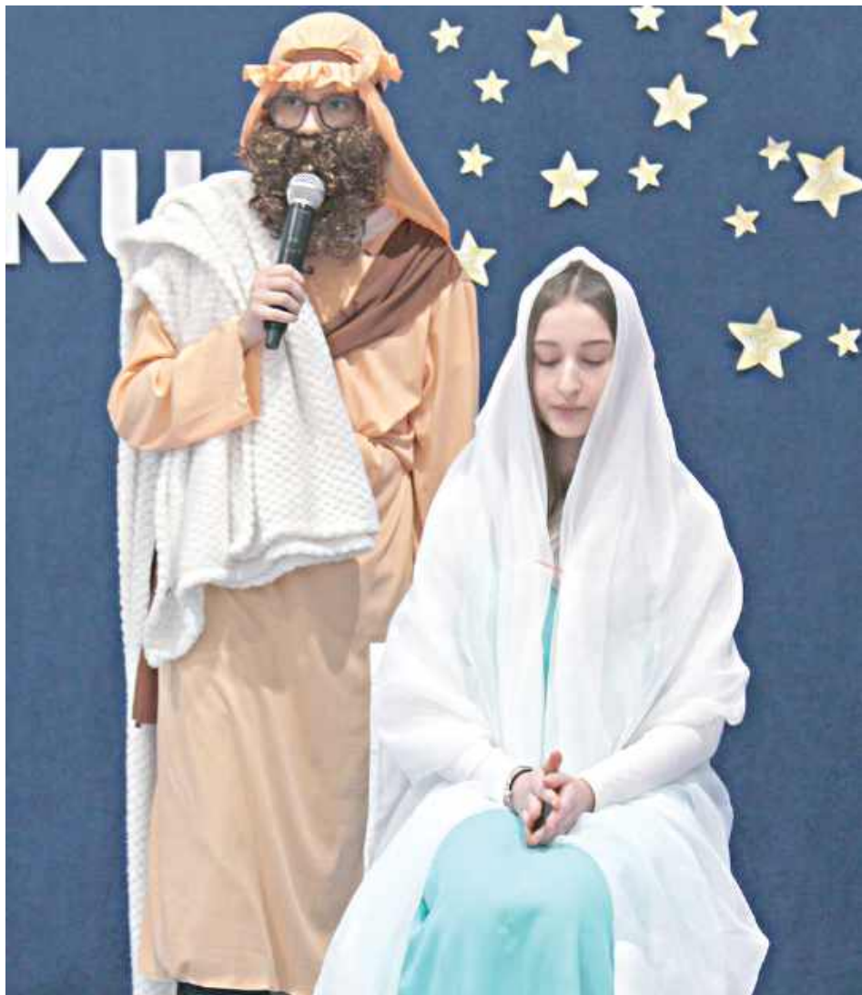
Jasełka stały się nie tylko artystycznym wydarzeniem, ale także okazją do refleksji nad istotą Świąt Bożego Narodzenia

Uczniowie z wielkim zaangażowaniem wcieli się w role pasterzy, aniołków oraz Trzech Króli, co dodało spektaklowi autentyczności i emocjonalnej