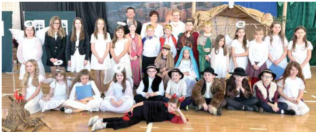
Przedstawienie, przygotowane przez uczniów klas trzecich, było pełne emocji i głębokich przesłań, które podkreśliły wartość tradycji i wspólnoty