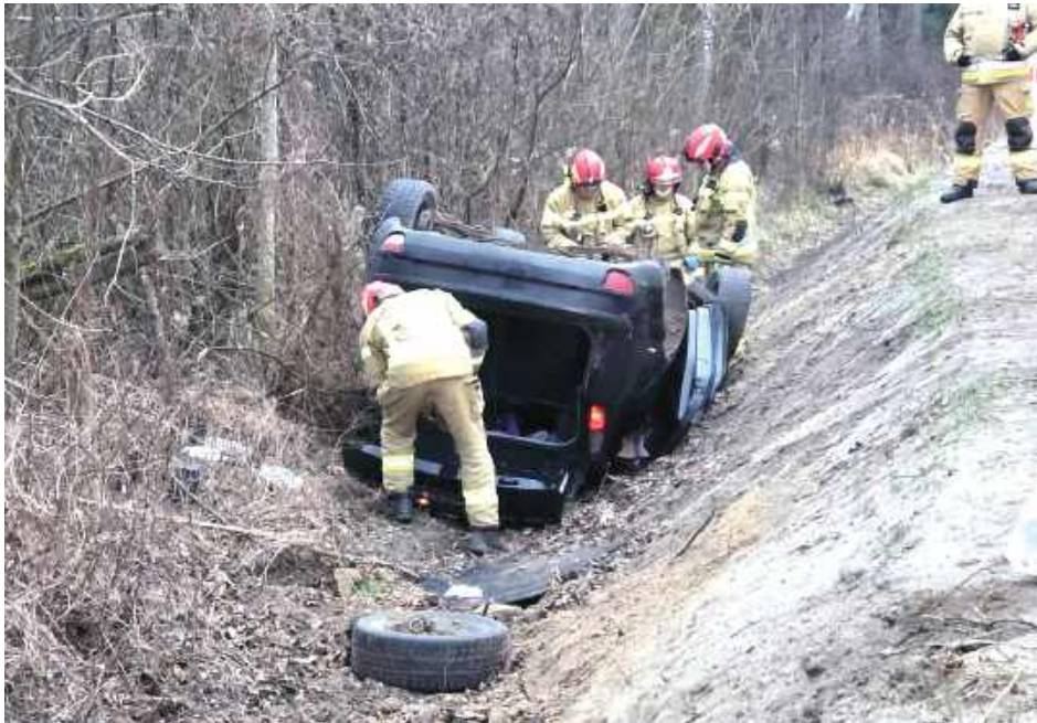
Do akcji zadysponowano patrol policji, zespół ratownictwa medycznego oraz cztery zastępy straży pożarnej – dwa z Jednostki Ratowniczo-Gaśniczej PSP w Biłgoraju oraz dwa z OSP Aleksandrów I i Aleksandrów II

Policja apeluje do wszystkich uczestników ruchu drogowego o zachowanie szcze-