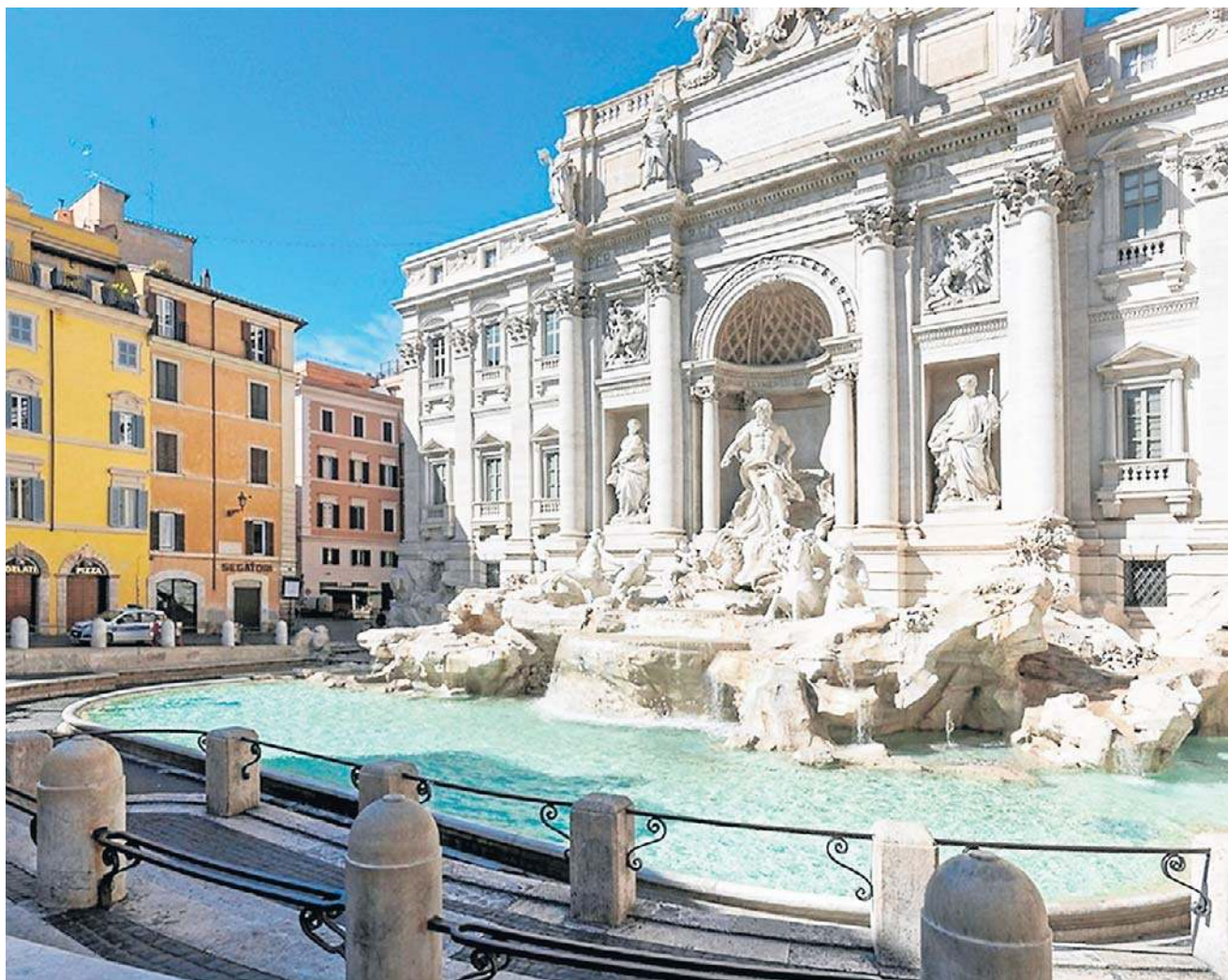
Za zejście schodkami do samej fontanny trzeba będzie zapłacić 2 euro. Ma to zmniejszyć tłok przy fontannie

na Uniwersytecie La Sapienza. „Wprowadzenie biletu spowoduje, jak zdają się już potwierdzać dane, bardziej regulowane i uporządkowane wizyty, a przede wszystkim pozwoli uniknąć nadmiernego tłoku”.