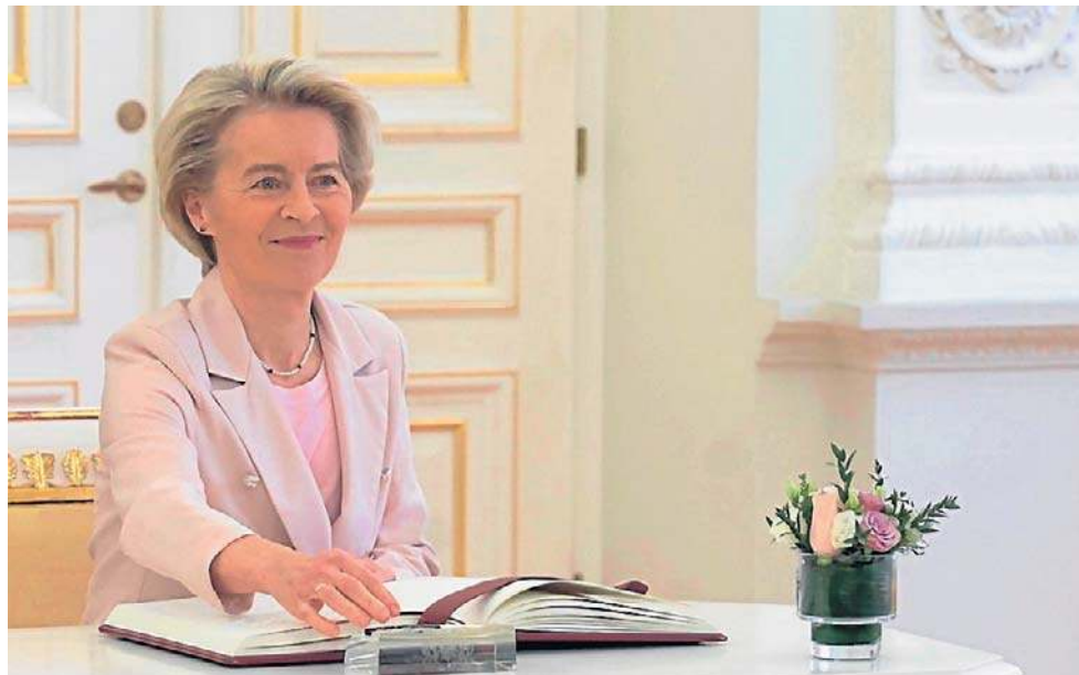
W liście do przywódców UE von der Leyen wskazała pięć kluczowych obszarów działań, przed którymi stanie Unia Europejska

Pierwszym z nich jest deregulacja i uproszczenie prawa unijnego. KE zapowiedziała dalsze pakiety „Omnibus” (uproszczenia w unijnym prawie), kompleksowy przegląd dobroku prawnego UE oraz ograniczanie biurokracji dla firm i obywateli. Celem jest obniżenie kosztów administracyjnych, przyspieszenie inwestycji i ułatwienie prowadzenia działalności gospodarczej w całej Unii.