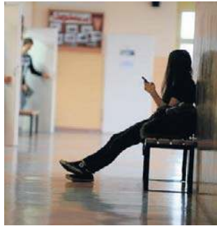
Czy wchodząc do szkoły dzieci powinny odkładać telefony?

- Dzieci nie mają jeszcze wykształconych mechanizmów, dlatego to my musimy zadbać