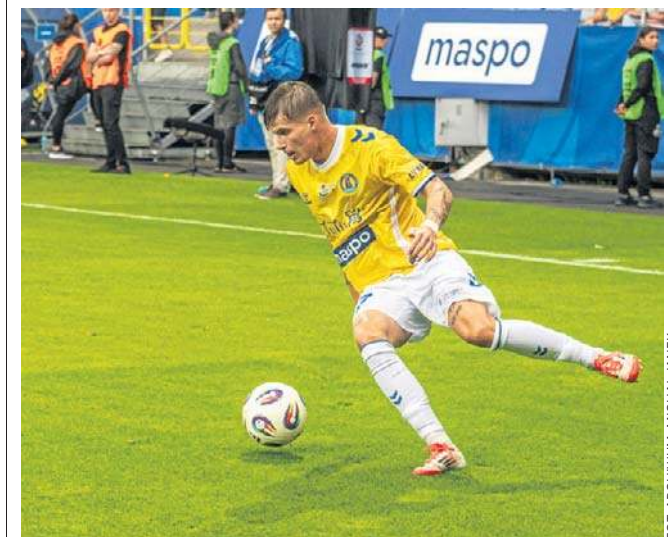
FOT. ARCHIWUM: MICHAŁ JANEK

- Renat został wystawiony na listę transferową, bo zasłużył po okresie rundy jesiennej, żeby tam po prostu być. Teraz Renat zasługuje na to, żeby go z tej listy się zabrać. I może tak zrobić (śmiech) - mówił po starciu z ekipą szczecińską. - „Dada” dostosował się do sytuacji, w której się znajduje i zaczął pracować. I jedyne o co mnie zapytał, to czy jeżeli będzie wyglądał dobrze, to ma jeszcze szansę czy już go skreśliłem. Ja powiedziałem, że do momentu, kiedy jest w klubie, ma szansę i nie mogę się doczekać jego zmiany - dodawał szkoleniowiec. ©