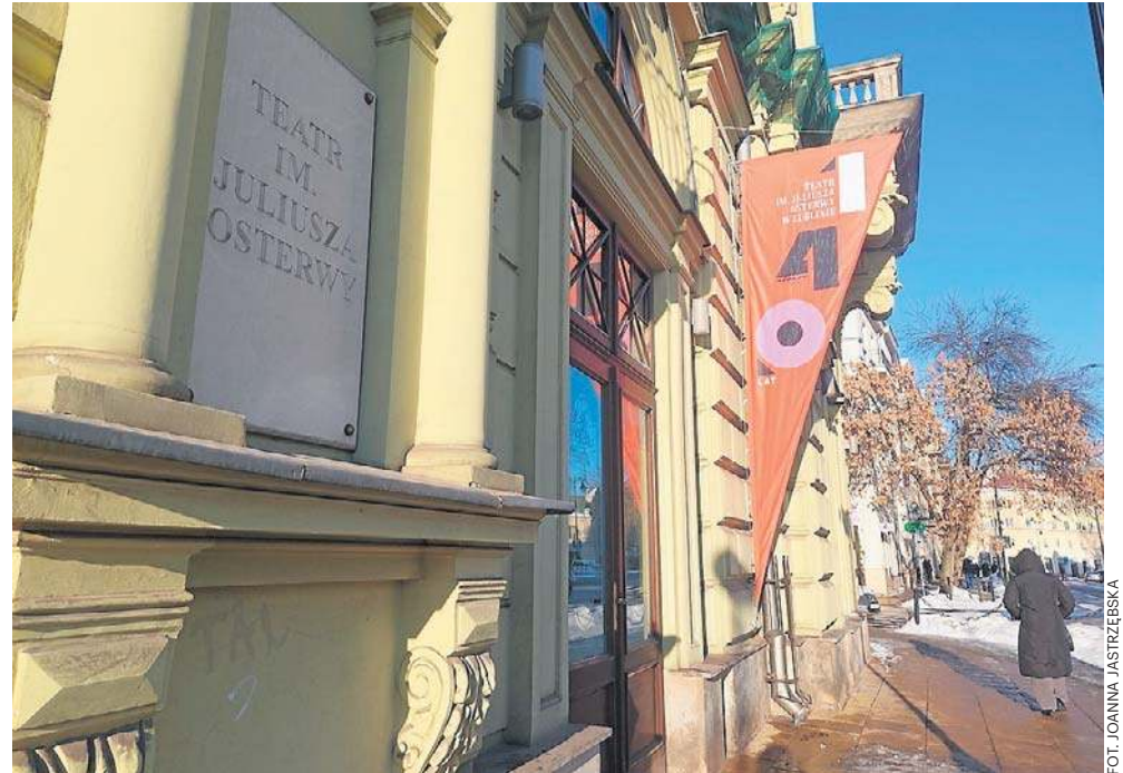
Według projektu firmy AMC Chołdzyński siedziba teatru zmieniłaby się nie do poznania: nowy budynek, nowe sale, dwa ogrody, w tym jeden na dachu z widokiem na Krakowskie Przedmieście

Kiedy dziś, w pierwszej połowie lutego, pytamy, dlaczego w takim razie wycofał wnioski o dofinansowanie z Unii Europejskiej, nie odpowiada. Dosta-