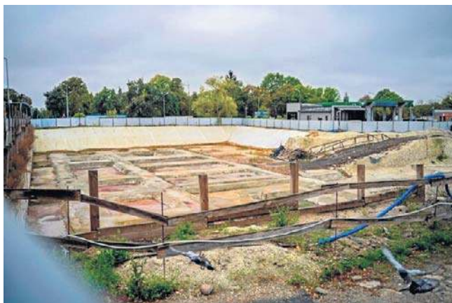
W centrum Chelma miał stanąć nowoczesny biurowiec i dworzec autobusowy

Agencja Rozwoju Przemysłu argumentuje wstrzymanie inwestycji jej niską rentownością, zwracając uwagę na zmiany gospodarcze po pandemii COVID-19. Jednak to stanowisko spotkało się z krytyką ze strony władz Chelma, które uważają je za trochę dziwne, gdyż budowa rozpoczęła się w IV kwartale 2023 r., po trzech