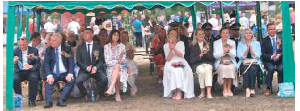
Oficjalne dożynki Gminne w Chodlu odbyły się niedzielę, 7 września

– Jako rolnicy uczestniczyliśmy i wsparliśmy Dni Chodla - Dożynki, niestety nasi koledzy zostali potraktowani niegodnie, wyróżnienia, do których ich wskazano i zaproszono, w ostatniej chwili zostały odwołane. Dzisiejsza wizja dożynek to święto partyjnych nominatów, samorządowców, strażaków i kół gospodyń wiejskich. Górnotłone słowa o znaczącej roli