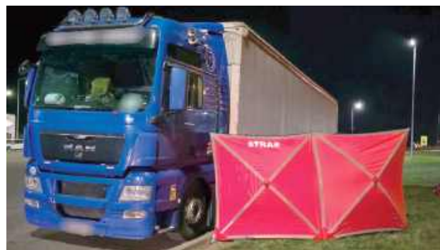
Na terenie MOP Markuszów mężczyzna został przygnieciony przez samochód ciężarowy podczas wymiany koła

Dramat rozegrał się w sobotę, 27 września około godziny 19. Strażacy zostali zadysponowani na trasę S17. Na terenie MOP Mar-