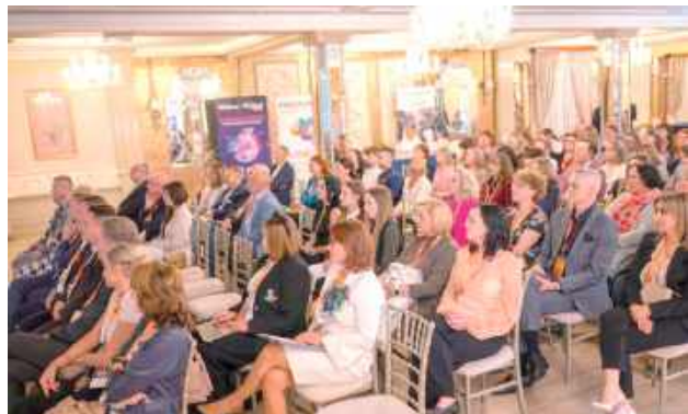
W konferencji wzięli udział specjaliści: geriatry, onkolodzy, farmakolodzy, psychiatry oraz przedstawiciele władz

W dniach 18–19 września w Urszulinie odbyła się konferencja „Zdrowe starzenie. Współczesna medycyna – szansą czy zagrożeniem” w ramach projektu „Zwiększenie efektywności, dostępności i jakości świadczeń opieki długoterminowej na poziomie powiatowym”.