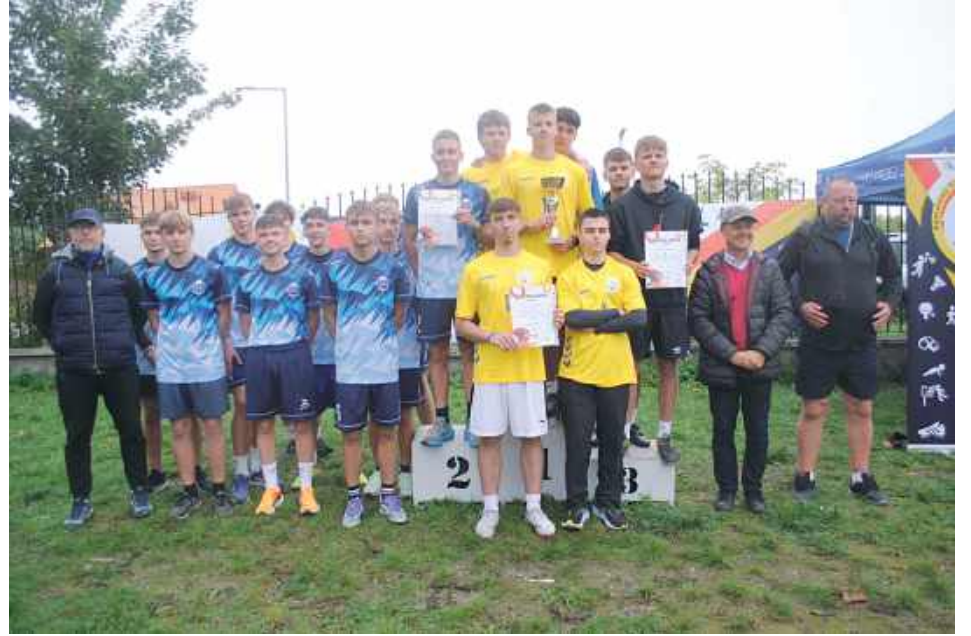
Uczestnicy biegu w kategorii Licealiada na podium