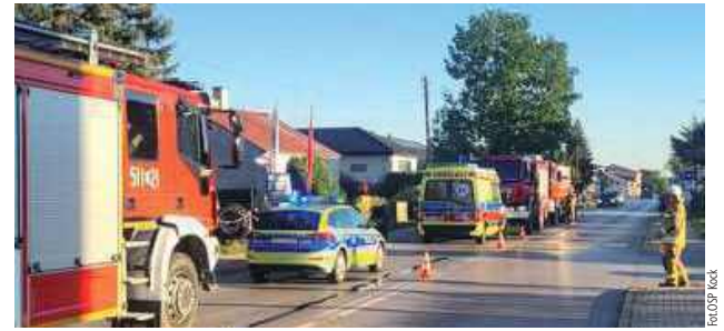
Do zdarzenia doszło w niedzielę, 21 września około godz. 16.51

Do zdarzenia doszło w niedzielę, 21 września około godz. 16.51. Jak informuje OSP KSRG Kock, doszło do zderzenia samochodu osobowego z motocyklem. Oficer prasowy KP PSP, mł. bryg. Sławomir Listosz, dodaje, że do zdarzenia doszło na ul. Piłsudskiego w Kocku. Motocyklista został zabrany do szpi-