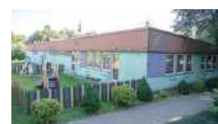
Przedszkole nr 1 w Łęcznej