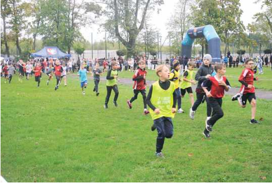
Biegło ponad 400 zawodników ze szkół z powiatu lubartowskiego