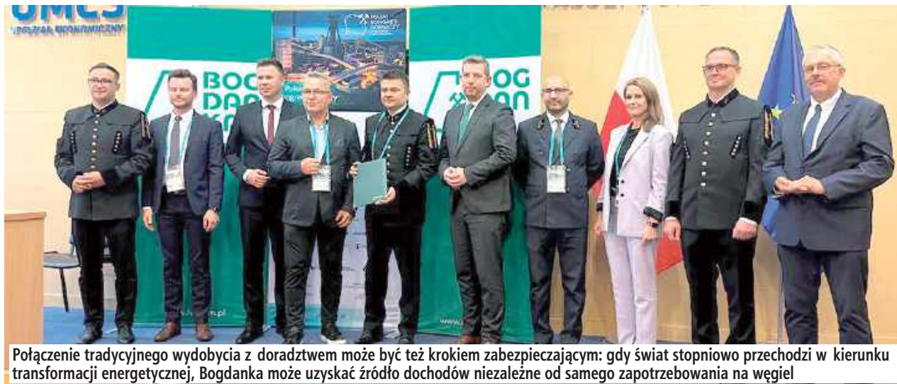
Połączenie tradycyjnego wydobycia z doradztwem może być też krokiem zabezpieczającym: gdy świat stopniowo przechodzi w kierunku transformacji energetycznej, Bogdanka może uzyskać źródło dochodów niezależne od samego zapotrzebowania na węgiel

W ostatnim czasie spółka podpisała porozumienie w sprawie utworzenia klastra kompetencyjnego „IndusComp”, który ma być platformą współpracy