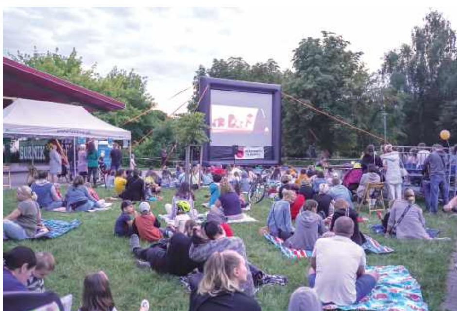
Ekran kinowy zakupiony przed laty z budżetu dla dzieci

Największe osiedla: Samsonowicza, Niepodległości i Bobrowniki otrzymają po 60 tys. zł. Stare Miasto będzie