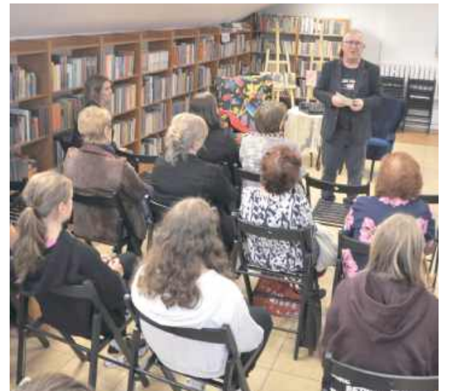
Zgromadzone przedmioty codziennego użytku, fotografie, narzędzia, dokumenty archiwalne i drobiazgi – elementy codziennego życia – zapraszają do refleksji nad historią Łęcznej i jej mieszkańców. Każdy eksponat staje się świadkiem przemian

23 września w Miejsko-Gminnej Bibliotece Publicznej im. Zbigniewa Herberta w Łęcznej otwarto wystawę „Łęczna. Trzy rynki – jeden dom. Historia zwyczajnych rzeczy”.