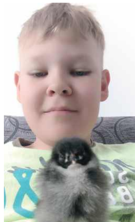
„Pipas”, Franciszek Tyralla, gmina Chodel