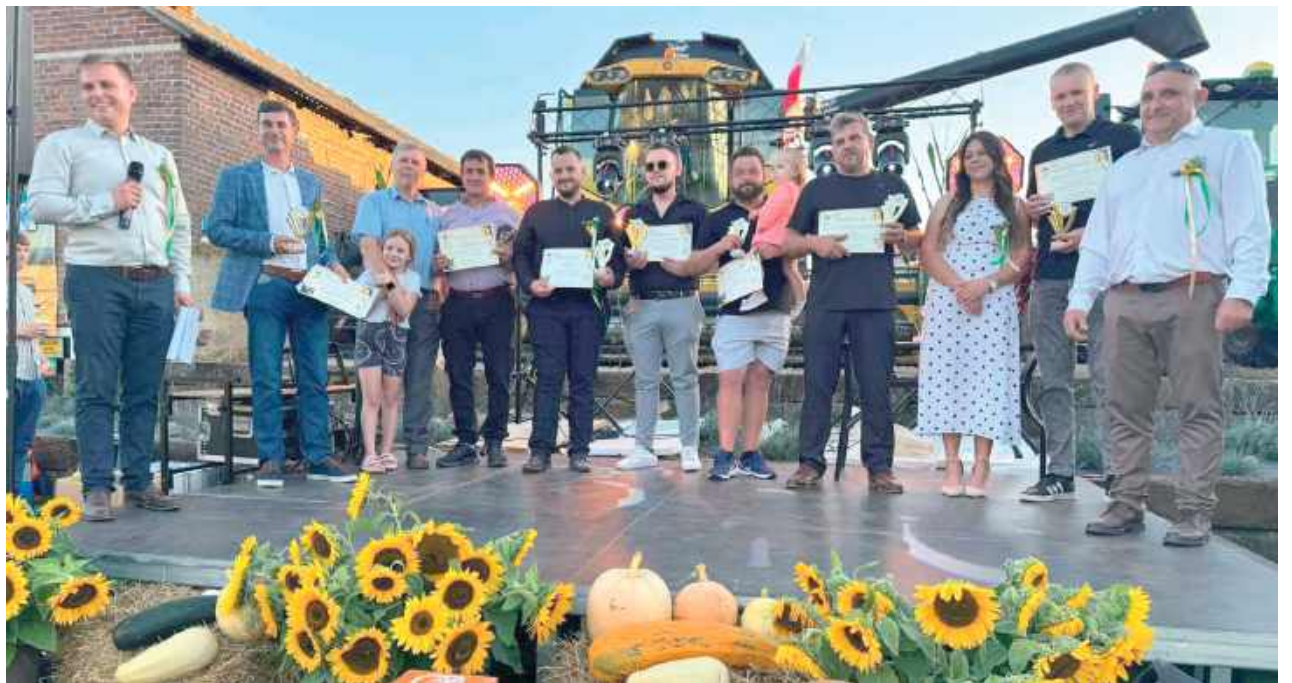
Podczas Dożynek Prawdziwych Rolników znalazł się czas na wręczenie odznaczeń i szczególnych wyróżnień „Oporowców Roku”