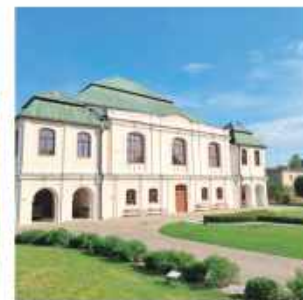
Muzeum Synagogałne we Włodawie

Głosowanie w plebiscyście trwa do 13 października i odbywa się na stronie: cudapolski.national-geographic.pl/2025/lubelskie Głosować można raz dziennie