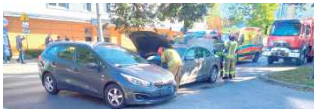
Do czwartkowej kolizji na ul. Centralnej doszło przez nieustąpienie pierwszeństwa przez kierującą Kią mieszkankę Lublina

Jednego dnia rowerzysta, chcąc skręcić w lewo, doprowadził do zderzenia z osobówką, nazajutrz do kolizji doszło przy zmianie pasa ruchu, wskutek czego zderzyły się dwa auta.