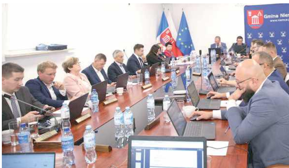
XVII Sesja Rady Gminy Niemce przebiegała spokojnie