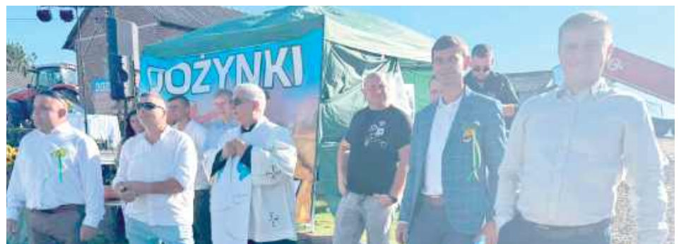
Dożynki bez błogosławieństwa to nie są prawdziwe dożynki

polskiej wsi to puste frazesy, tak naprawdę to festiwal elit i pogardy dla ludzi pracy. Naszym zamysłem było zorganizowanie święta rolników - prawdziwych rolników, gdzie będziemy mogli pochwalić się efektami naszej ciężkiej pracy i uhonorować tych z nas, którzy na to zasłużyli - podkreślają organizatorzy.