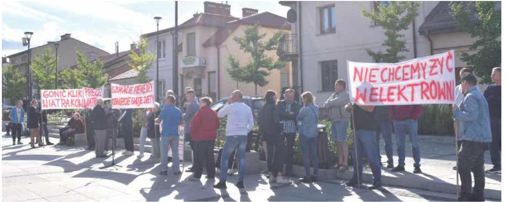
Protestujący mieszkańcy z transparentami czekali na radnych przed Ratuszem...

Rada Miasta Końskowola, odrzucając uchwałę o przystąpieniu do zmiany Miejsowego Planu Zagospodarowania Przestrzennego gminy, zablokowała zakusy prywatnych inwestorów, którzy chcieli budować tu elektrownie wiatrowe. W kilku miejscowościach miałyby stanąć ich aż 16.