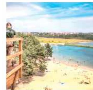
Zoom Natury w Janowie Lubelskim

Nasz region to prawdziwa perła przyrody i historii. Pojezierze obejmuje ponad 60 jezior, w tym największe – Uściwierz, o powierzchni 284 hektarów, oraz najgłębsze – Piaseczno, sięgające 39 metrów głębokości. Jeziora otoczone są torfowiskami, lasami i polami, które zachowały swój naturalny, niemal pierwotny charakter. Równina Łęczyńsko-Włodawska, leżąca w granicach Polesia Zachodniego, nie została objęta ostatnim