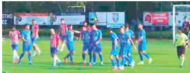
Piłkarze Lewartu wygrali bardzo pewnie. W sobotę zmierzą się z Bugiem Hanna