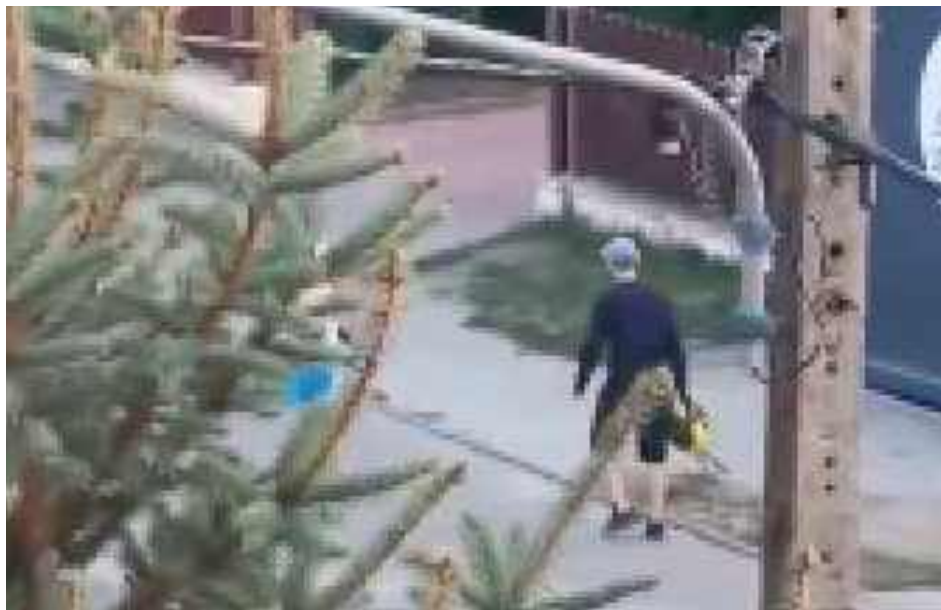
Świadek obserwował całe zajście z balkonu i nagrała je telefonem

- Przyspieszyłyśmy krok, chcąc się od niego oddalić, ale im szybciej szłyśmy, tym bardziej on krzyczał i nas obrażał. Kiedy jedna z nas wyjęła telefon, aby zadzwonić na numer alarmowy 112, napastnik wpadł w jeszcze większy szal – groził nam, wyzywał i uderzył jedną z nas z całej siły plecakiem. Wtedy uciekłyśmy w stronę wejścia do sklepu Topaz. On jednak nadal krążył w pobliżu i obserwował nas - opisuje zdarzenie kobieta. Twierdzi, że mężczyzna groził jej i jej koleżankom słownie, używał wulgaryzmów i kierował w ich stronę agresywne zachowania.