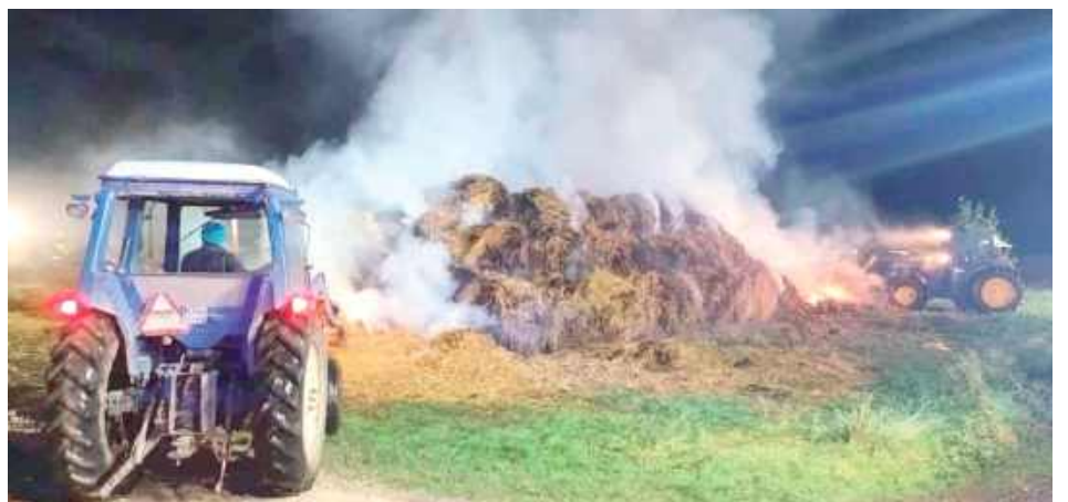
W Opatkowicach spłonęło 180 bel słomy

W czwartkowy wieczór, 24 września w Opatkowicach w ogniu stanęło 180 balotów słomy. Strażacy szacują straty na ok. 20 tys. zł.