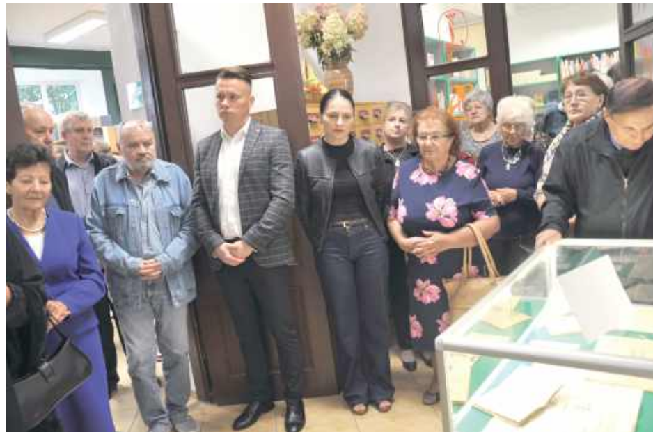
Wernisaż przygotowano we współpracy biblioteki i Towarzystwa Przyjaciół Ziemi Łęczyńskiej; zastosowano zbiory z Izby Regionalnej w Łęcznej jako rzeń wystawy