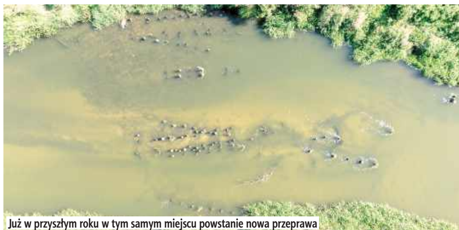
Już w przyszłym roku w tym samym miejscu powstanie nowa przeprawa

Tegoroczne lato i długotrwały brak opadów sprawiły, że poziom wody w rzece Wieprz w Łęcznej obniżył się do wyjątkowo niskiego stanu. Dzięki temu oczom mieszkańców ukazały się pozostałości dawnego traktu lubelskiego, drewnianych pali, które przed laty stanowiły konstrukcję mostu prowadzącego w kierunku Lublina.