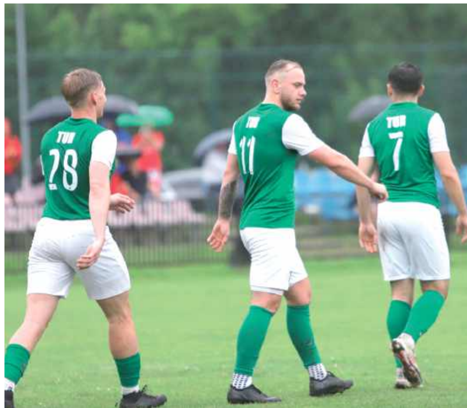
Tur wrócił na zwycięską ścieżkę. Po porażkach z Janowem Lubelskim i Radzyniem rozbili Orłęta Łuków 5:0