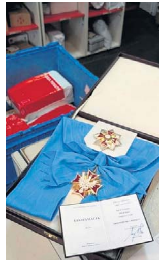
Order Orla Białego Zełenski odesłał Nawrockiemu pocztą, co też jest symbolem

Karol Nawrocki poinformował w piątek, że odbiera Wołodymyrowi Zełenskiemu Order Orla Białego. Prezydent zaznaczył, że odebranie odznaczenia „nie jest aktem wymierzonym przeciwko narodowi ukraińskiemu” i „nie oznacza zmiany strategicznego kierunku polskiej polityki bezpieczeństwa”. Dodał również, że „nie się nie zmie-