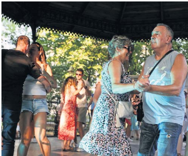
Altana na Plantach latem będzie miejscem na taneczne i koncertowe popołudnia

Kraków lubi to. Darmowe potańcówki i koncerty na Plantach przez całe lato