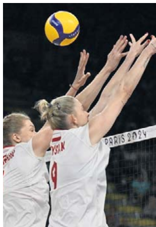
Polki w drugim turnieju LN przegrały tylko jeden mecz

W ostatnim spotkaniu drugiego turnieju Ligi Narodów, który odbył się na Filipinach nasza kadra przegrała po zaciętym boju z Kanadą 2:3 (23:25, 25:21, 16:25, 25:11, 13:15). Rozstrzygającą partię nieudany zagranie