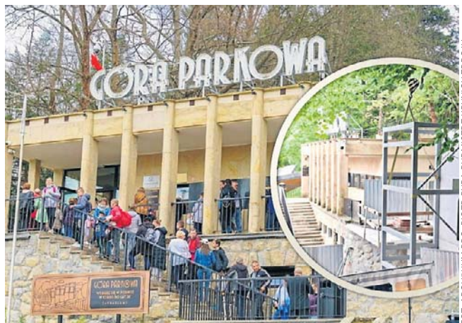
Ta inwestycja w Krynicy-Zdroju była wyczekiwana od lat. Do dolnej stacji kolejki wyjedzie winda

Nowa inwestycja sprawi, że korzystanie z kolei oraz atrakcji na Górze Parkowej będzie znacznie wygodniejsze i dostępne dla wszystkich. Warto podkreślić, że atrakcje na samej Górze Parkowej są już dostosowane do potrzeb osób z niepełnosprawnościami, a budowa windy będzie kolejnym krokiem w kierunku pełnej dostępności tego miejsca.