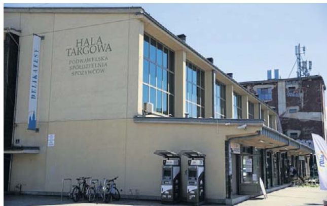
Najwyższa część zabytkowej Hali Targowej na Grzegórkach zmienia się w nocny klub

Mieszkańcy protestowali przeciwko inwestycji od wiosny 2024 roku, gdy tylko wyszły na jaw zamiary inwestora. Władze miasta wielokrotnie obiecywały, że nie dopuszczą do takiej działalności w tym miejscu. Zapowiadano m.in. konsultacje społeczne w sprawie zagospodarowania Hali Targowej na potrzeby lokalnej społeczności (ostatecznie z nich zrezygnowano, tłumacząc, że konsultacje naruszałyby prawa użytkownika wieczystego obiektu. Udało się natomiast - w 2024 r. - wpisać Halę Targową do wojewódzkiego rejestru zabytków, co