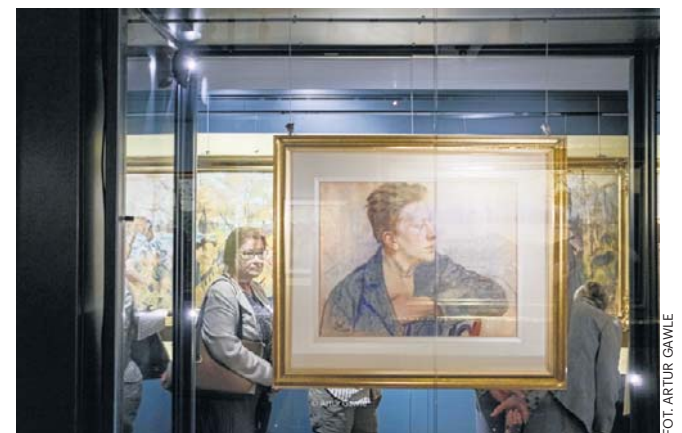
Poniedziałkowy wernisaż 3 spotkał się z bardzo dużym zainteresowaniem miłośników malarstwa

Zainaugurowana w poniedziałkowy (15 czerwca) wieczór wystawa: „Malarstwo polskie z XIX i początku XX wieku w zbiorach Muzeum Ziemi Tarnowskiej” ukazuje bogactwo i różnorodność polskiej sztuki przełomu epok - od realizmu