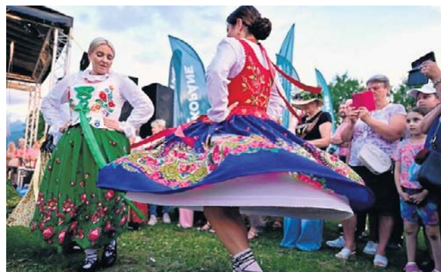
Noc Świętojańska w Zakopanem. Zorganizowana została po raz pierwszy. I spodobała się turystom

Jednym z najbardziej widowiskowych punktów programu był uroczysty przemarsz zbójni-