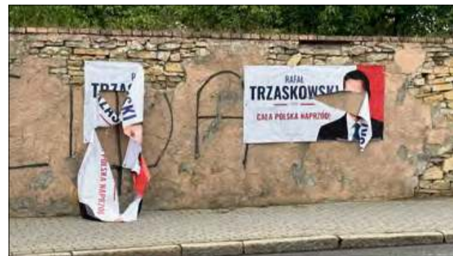
Zniszczeń dokonano na terenie naszego powiatu.

maja. Straty oszacowano na 2 000 zł. Na razie nie wiadomo, kto dopuścił się tego procederu. Czynności wyjaśniające wciąż trwają.