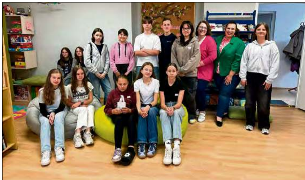
Warsztaty z autoprezentacji i pewności siebie dla młodzieży odbyły się w ramach Tygodnia Bibliotek.

- Gdy masz treść – to znaczy, że Ci zależy. Wykorzystaj tę energię! - motywowała.