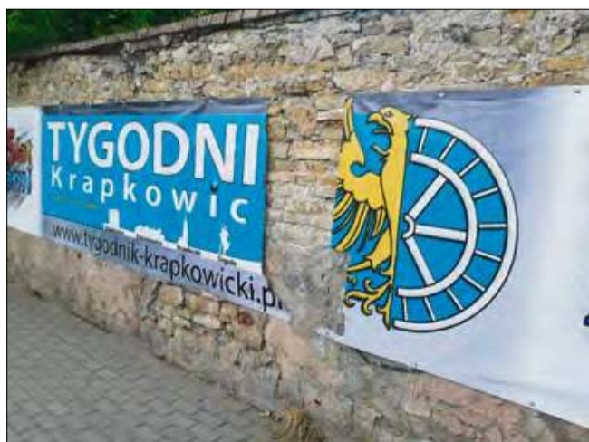
Straty szacuje się na kilkaset złotych.

Dodajmy, że to nie pierwszy przypadek, gdy nasz baner reklamowy został zniszczony lub skradziony. Podobne zdarzenie miało miejsce we wrześniu 2023 roku. Wtedy mieszkańiec powiatu krapkowickiego pościł reklamę wiszącą przy ulicy 3 Maja w Krapkowicach.