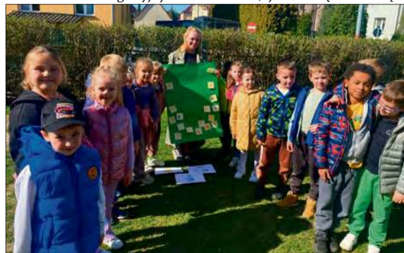
Dzieci uczestniczyły w zajęciach, podczas których poznawały tajniki dbania o środowisko.

(matt) fot. Przedszkole Publiczne nr 2 z Oddziałami Integracyjnymi w Krapkowicach