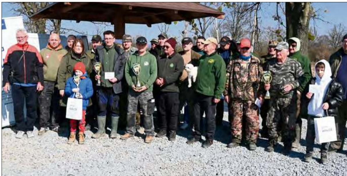
26 zawodników rywalizowało o złowienie najcięższej ryby.

Z okazji Światowego Dnia Wody w Straduni odbyły się III Zawody Wędkarskie o Puchar Wójta Gminy Walce, w których uczestniczyli zarówno wędkarze z Koła Wędkarskiego PZW Krapkowice-Miasto, jak i mieszkańcy gminy Walce zrzeszeni w PZW.