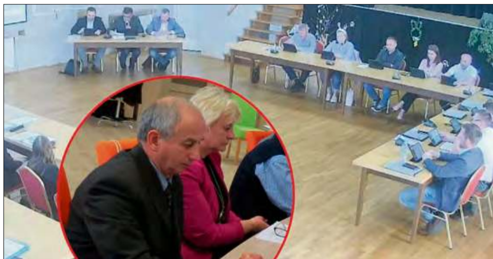
Władze gminy Strzeleczyki liczyły na to, że od radnego powiatowego dowiedzą się czegoś więcej.

Chwilę później radca wspominał, iż „wie o jakimś projekcie” remontu drogi w