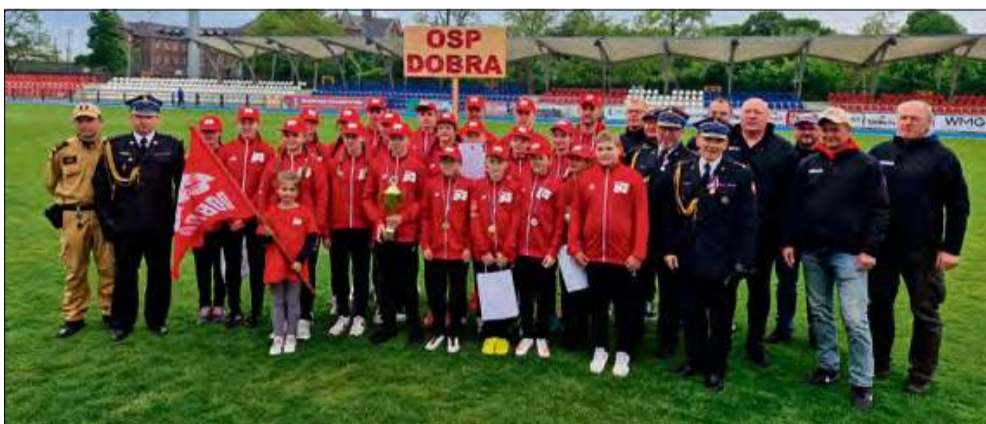
Zawody wojewódzkie odbyły się na stadionie w Nysie. Udział w nich wzięły drużyny z gminy Strzeleczyki.