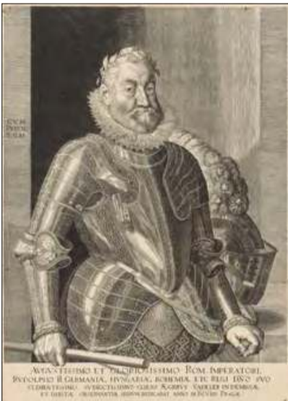
Cesarz Rudolf II na miedziorycie Egidiusa Sadelera z 1609 roku.

Jeżeli chodzi o same Krapkowice, to już cesarz Maksymilian solidnie przygotowywał się do ich sprzedaży. To jemu zawdzięczamy dokumenty, które informują nas o ówczesnej sytuacji miasta – rachunek wpływów i strat z 1572 roku oraz urbarz z 1574 roku. Jeszcze w 1581 roku Krapkowice zastawione były miejscowym mieszczanom. Nie było jednak żadnych widoków na to, że ci zbiorą pieniądze konieczne do całkowitego wykupu miasta. Zastaw na krótko wykupił więc sam władca. Już 29 września 1582 roku Krapkowice znalazły jednak nowego właściciela. W datowanym na ten dzień akcie sprzedaży możemy przeczytać: „Sprzedajemy nasze miasto Krapkowice ze wszystkimi poddanymi i mieszkającymi, z wszelkimi honorami, wszystkimi służbami, prawami i dobrami, a mianowicie: Krapkowice z zamkiem, przedmieściem, z wioskami Żywocice, Stradunia, Góraźdże wraz z kościelnym oparciem duchowym, z rzeką Odrą oraz dopływem Osobłogą, Stradunią wraz z potokami, które ciągną się tak daleko, jak sięga nasza ziemia z lasa-