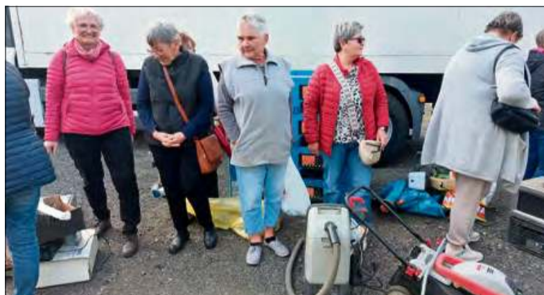
Inicjatywa powoli staje się lokalną tradycją.

P o raz kolejny Związek Międzygminny „Czysty Region” przeprowadził akcję w Gogolinie, w ramach której każdy chętny mógł wymienić elektrośmieci na sadzonki. Inicjatywa powoli staje się lokalną tradycją.