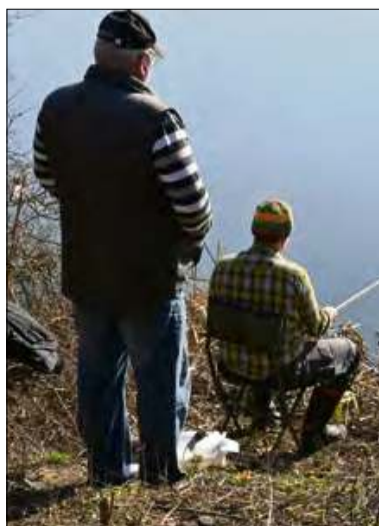
W zawodach wędkarskich ważna jest cierpliwość.

Od wczesnych godzin porannych, nad starorzeczem, wędkarze rozpoczęli swoje zmagania. Choć pogoda była sprzyjająca, wiatr stanowił wyzwanie, a ryby o tej porze niechętnie współpracowały z zawodnikami. Uczestnicy jednak wytrwale stawili czoła czterogodzinnym zmaganiom.