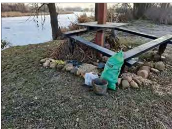
Organizatorzy akcji ucieszyli się z małej ilości śmieci, które znaleźli na Starorzeczu po zimie.

Miłośnicy Starorzecza, uzbrojeni w narzędzia i zapal do pracy, oczyścili teren z mułu i nadmiaru roślinności, które naniósł woda. Uczestnicy akcji z radością odnotowali, że nie było dużo śmieci, co pozwoliło skupić się na przywracaniu naturalnego wyglądu tego miejsca. Największym wyzwaniem okazało się oczyszczenie mostu, który był niemal całkowicie pokryty