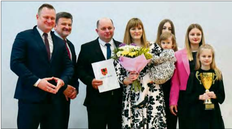
Gratulacje dla rolników z Nowego Młyna.