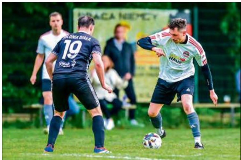
Dublet Borysa Wiskulskiego pozwolił Żywocicom zdobyć punkt.

Drugi raz z rzędu piłkarze żywocickiego LZS-u nie zdołali sięgnąć po komplet punktów. Przed tygodniem poprzeczkę naszym wysoko postawili futboliści z Białej, tym razem gospodarzom nie udało się pokonać ekipy ze Ścinawy Nyskiej.