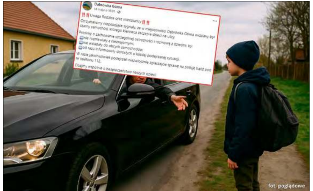
Niepokojące sygnały w Dąbrówce Górnej. Mieszkańcy ostrzegają przed podejrzanym samochodem i kierowcą zaczepiającym dzieci.

Lokalna społeczność pozostaje w gotowości. Niektórzy mieszkańcy deklarują, że będą zwracać szczególną uwagę na ruch w okolicy, a także monitorować miejsca,