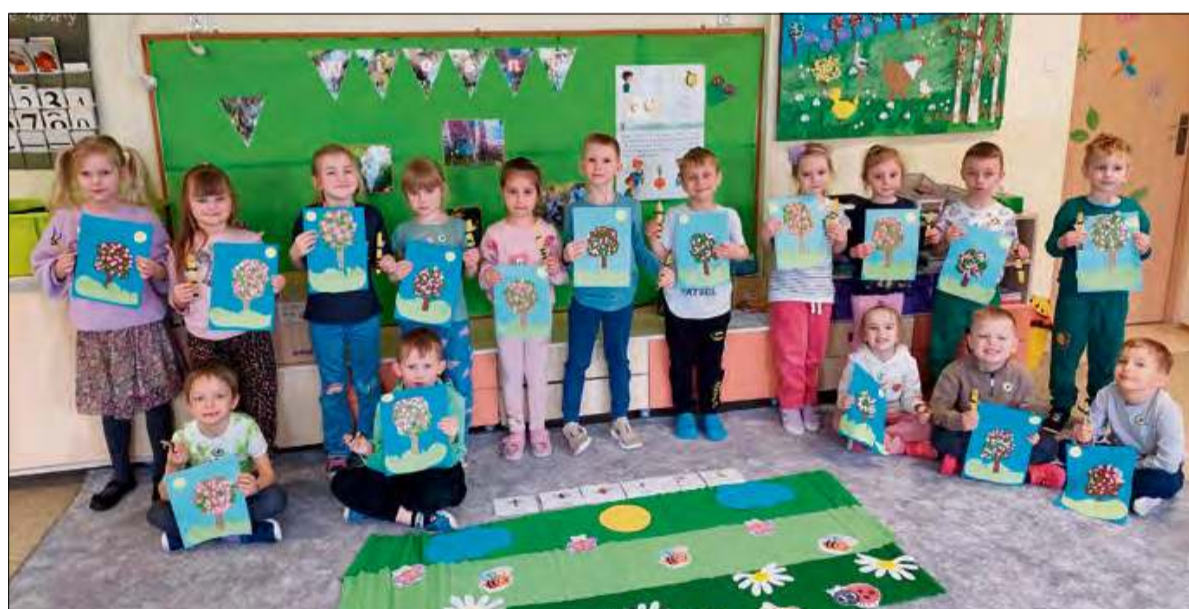
Krapkowickie przedszkole jest dumne z małych ekologów i cieszy się, że już od najmłodszych lat wiedzą jak troszczyć się o naszą planetę.

Podczas realizacji programu przedszkolaki dowiedziały się m.in.: czym różni się pogoda od klimatu, jak oszczędzać wodę i