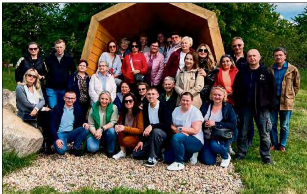
Delegacja z sołectwa Oleszka uczestniczyła w wyjeździe studyjnym liderów odnowy wsi z Opolszczyzny.

W dniach 8-11 maja delegacja z sołectwa Oleszka uczestniczyła w wyjeździe studyjnym liderów odnowy wsi z Opolszczyzny. Zwieńczeniem wyjazdu był udział w tzw. „Dniu Polskim” podczas Kongresu Odnowy Wsi i Rozwoju Obszarów Wiejskich.