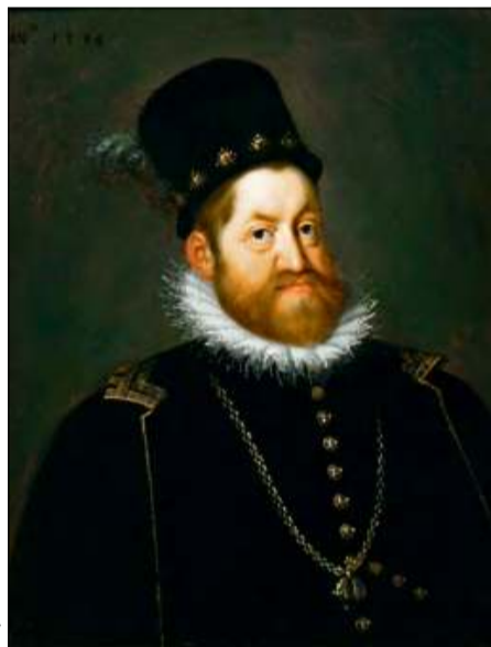
Portret Rudolfa II Habsburga pędzla Josepha Heintza z 1594 roku.

Do eskalacji doszło w 1608 roku. Szlachta węgierska, austriacka i morawska opowiedziały się bezpośrednio za Maciejem. Ten zebrał wojsko ruszył na Pragę, zamierzając siłą pozbawić brata władzy. Tutaj spotkała go jednak niespodzianka, gdyż cesarz wciąż miał wokół siebie