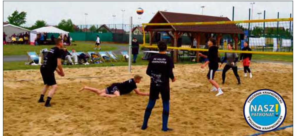
W trakcie imprezy uczestnicy rywalizowali w turniejach sportowych: m.in. w siatkówce.

Dla najmłodszych przygotowano dodatkowe atrakcje w postaci animacji, gier i