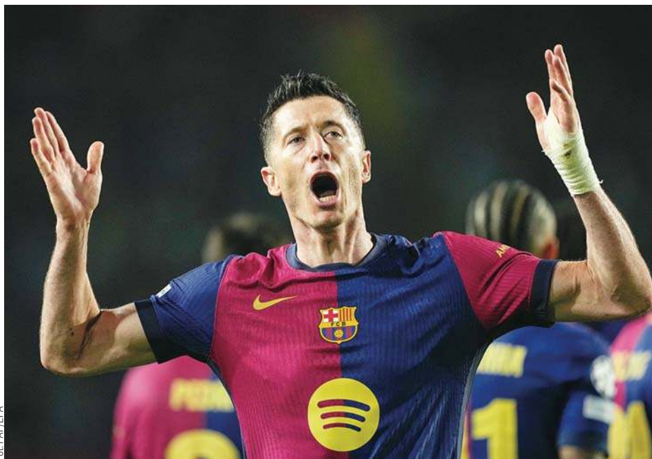
W Barcelonie Robert Lewandowski rozegrał 193 mecze, w których strzelił 120 bramek

PIŁKA NOŻNA \\ Robert Lewandowski podpisał kontrakt z Chicago Fire - poinformował klub występujący w Major League Soccer. 37-letni napastnik przez ostatnie cztery sezony grał w Barcelonie. Wcześniej występował w Bayernie, Borussia i Lechu.