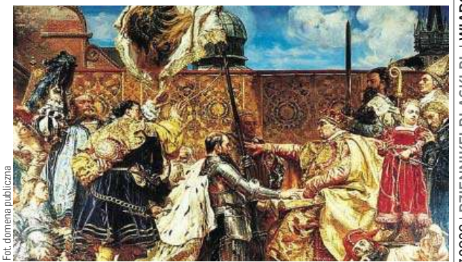
Fragment obrazu Jana Matejki „Hołd pruski”

Pruski 1525” ( https://muzeum-grunwald.pl/.../aplikacja-mobilna-hold.../ ). Wystawa będzie dostępna dla zwiedzających do 16 sierpnia 2026 r. Wstęp na wydarzenie jest bezpłatny. Projekt został dofinansowany ze środków Fundacji Totalizatora Sportowego w ramach programu „Otwarta kultura” oraz współfinansowany ze środków samorządu województwa warmińsko-mazurskiego.