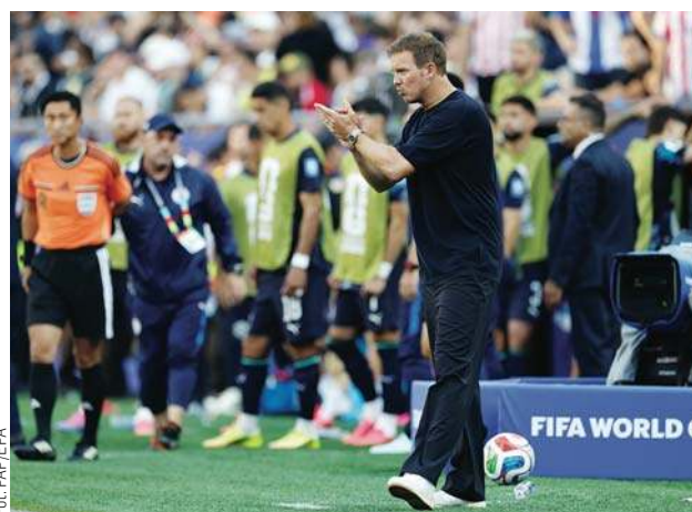
Niemiecka porażka na mistrzostwach świata ma twarz Juliana Nagelsmanna

Zdaniem Matthaeusa tematem w kadrze stały się przez to kwestie podróży i rezerwacji hoteli, co mogło rodzić napięcia między zawodnikami. - Jeden był wtedy zły na drugiego, bo u jednego mama mogła polecieć razem z nim, a u drugiego mogła polecieć żona i dzieci. Inni musieli wtedy lecieć rejsowym samolotem - wyjaśnił Matthaeus.