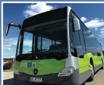
Nowa linia autobusowa do Olsztyna \2