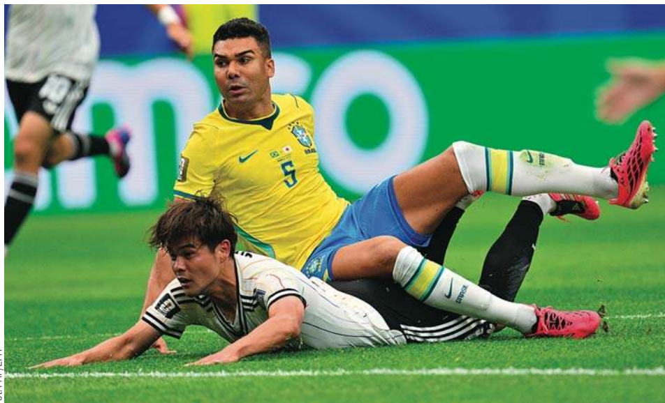
W 1/16 finału MŚ bogini zwycięstwa (Brazylia) ograła trzy paski (Japonia)

Podobno Pele dostał za to aż 120 tys. dolarów! Dzisiaj byłoby to niewiele ponad milion, czyli grosze w porównaniu z koszykarzem Michaeliem Jordanem, który dzięki kontraktowi z firmą Nike stał się pierwszym sportowcem-miliarderem.