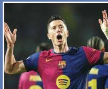
Lewandowski przenosi się do Chicago \13