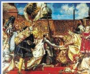
Technologia wkracza do muzeum \4