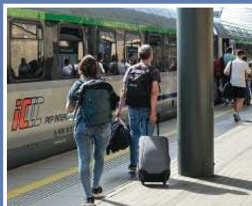
Z Czech nad Bałtyk przez Warmię? \3