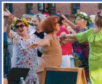
Wygodne buty i na parkiet \9