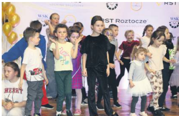
Przyszedł moment, że sceną zawładnęły dzieci.