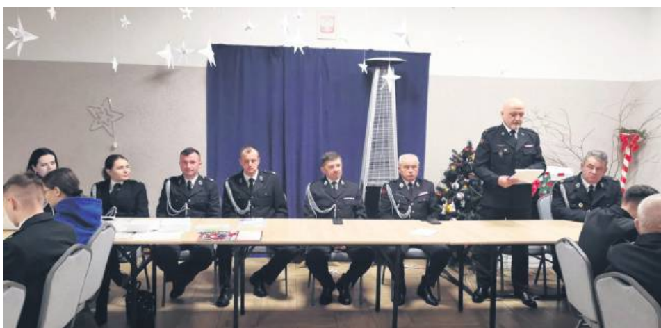
Na zebraniu sprawozdawczo-wyborczym OSP KSRG Łaszczów wybrano nowy zarząd jednostki.