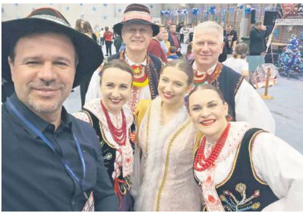
Prezydent Rafał Zwolek wspierał WOŚP nie tylko w samym mieście, ale i w gminie Zamość.

statuetki, przygotowane przez WTZ Grabowica, otrzymali także ci, którzy pomagali w organizacji 34. Finału. Nie zabrakło oczywiście licytacji.