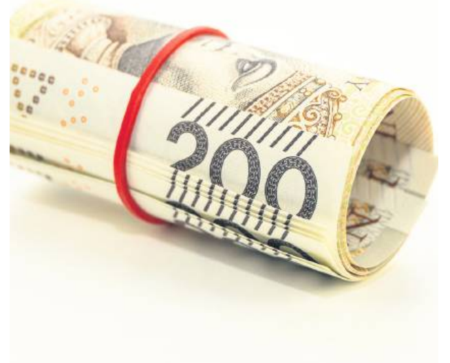
W ciągu ostatnich kilku dni na terenie Tomaszowa Lubelskiego doszło do kilku prób oszustw metodą na policjanta.

W ciągu ostatnich kilku dni na terenie Tomaszowa Lubelskiego doszło do kilku prób oszustw metodą na policjanta. Mężczyzna podający się za funkcjonariusza tomaszowskiej jednostki dzwonił do starszych kobiet, twierdząc, że ich oszczędności są zagrożone. Niestety jedna z kobiet przekazała oszustowi swoje oszczędności.