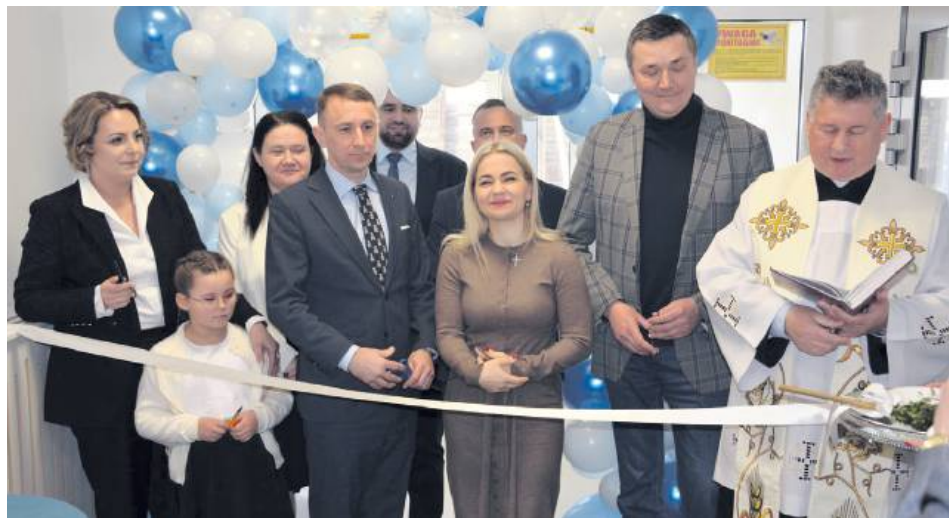
Oficjalne przecięcie wstęgi.

Historia przedszkola sięga lat 80., kiedy w gminie brakowało placówek dostosowanych do potrzeb dzieci. Z inicjatywy społecznej powołano wówczas komitet budowy przedszkola na