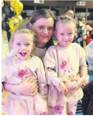
Uśmiechy nie schodziły z twarzy dzieciaków.