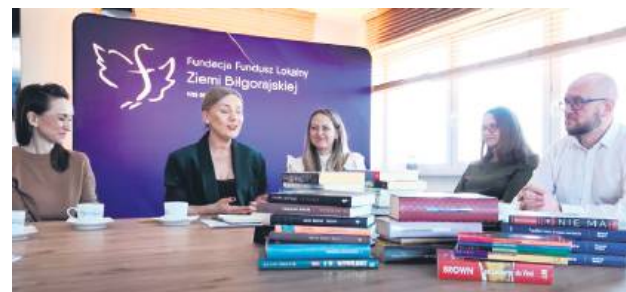
Zbiory będą służyły różnym grupom odbiorców.

– To dla nas ogromna radość i powód do wdzięczności, że tak