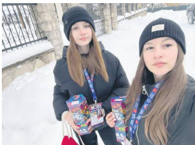
Pogoda nie rozpieszczała wolontariuszek, ale dały radę!

W niedzielę na miasto z puszkami wyszło 80 wolontariuszy. Kwestowali od rana do wieczora. W Tomaszowskim Domu Kultury trwały koncerty i licytacje. Na scenie piękne przedstawienie zaprezentowały przedszkolaki z trzech przedszkoli samorządowych. Było też dużo muzyki – grały zespoły Trójka, Eden, LIMITED oraz Szymon Długosz. W TDK swoje stoiska rozłożyli strażacy