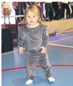
Hala sportowa zamieniła się w magiczne miejsce pełne animacji, prezentów i dziecięcej radości.