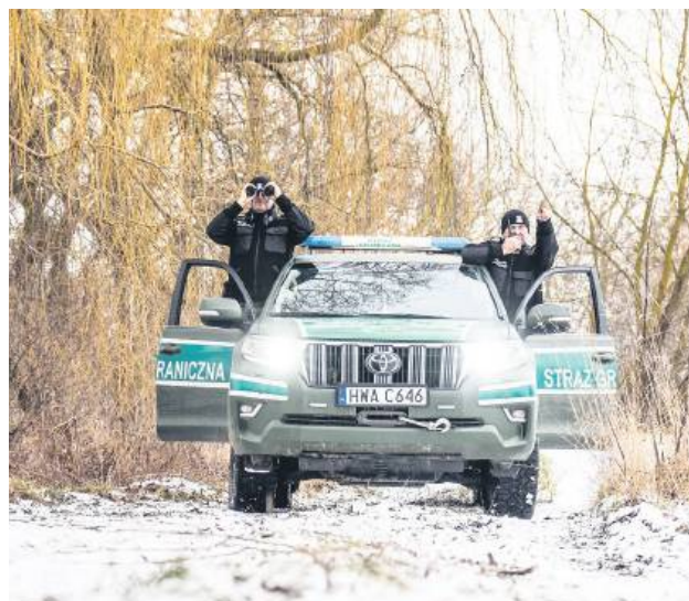
Pogranicznik wypatrzył dom starszego, samotnie mieszkającego mężczyzny – z komina nie ulatniał się dym. Przeczucie go nie zawiodło. Gdy pojechał sprawdzić, co się stało, mężczyzna był skrajnie wychłodzony. Konieczne było wezwanie karetki.

Zima wciąż jest bardzo mroźna, szczególnie w godzinach nocnych i wczesnoporannych, gdy temperatury powietrza spadają poniżej –20 stopni Celsjusza, co sta-