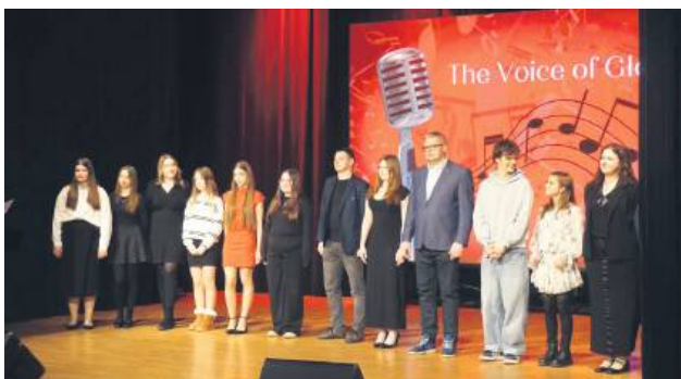
W każdej drużynie zostały po dwie osoby. Trzy kolejne dostały złote bilety. Wszyscy spotkają się w finale.

Po zwycięstwach pojedynkach do wielkiego finału awansowali: