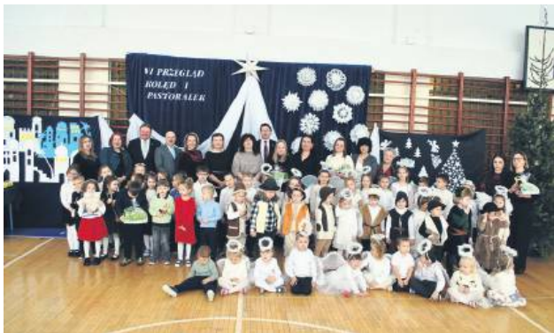
W tegorocznej edycji Gminnego Przeglądu Kolęd i Pastoralek wystąpiło ponad 200 artystów.

W Szkole Podstawowej w Telatynie odbył się szósty już Gminny Przegląd Kolęd i Pastoralek. Dzieci dały z siebie wszystko. Nauczyciele pękali z dumy, a goście z radością i wzruszeniem oglądali występy.