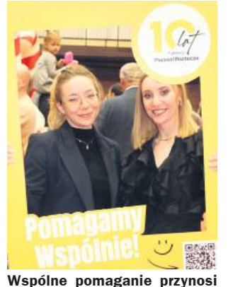
Wspólne pomaganie przynosi prawdziwą radość!