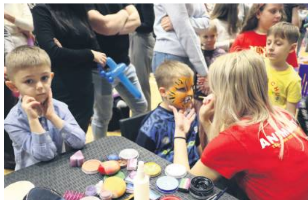
Na tak wyjątkowy tatuaż, trzeba było czekać w długiej kolejce.