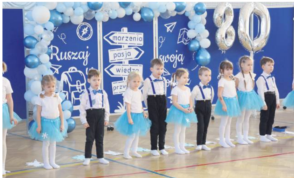
Podczas wydarzenia nie zabrakło występów najmłodszych.