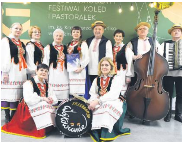
Zespół folklorystyczny Wójtowanie bierze udział w przeglądach, konkursach i festiwalach, podczas których zdobywa nagrody i wyróżnienia.