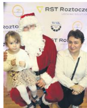
Każdy chciał mieć pamiątkowe zdjęcie z Mikołajem.