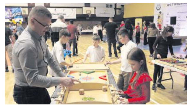
To była okazja do wspólnego spędzania czasu rodziców z dziećmi.