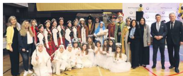
W wydarzeniu uczestniczyli także goście z Ukrainy – dzieci i opiekunowie polskiej szkoły z Nowego Rozdołu koło Lwowa. Dzieci zaprezentowały przedstawienie jasełkowe. – To nasz sposób, by powiedzieć „dziękujemy” za pomoc, za pamięć, za serce – mówią mali artyści.