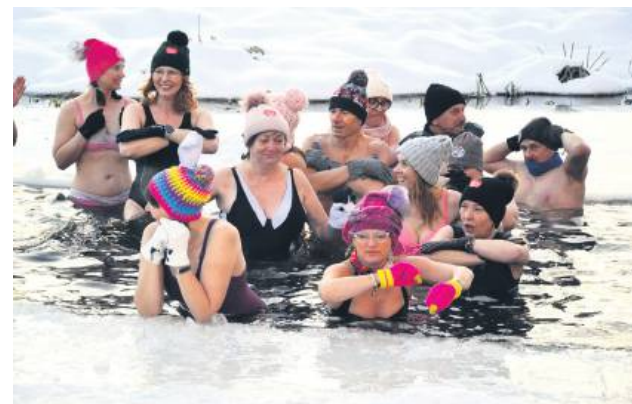
WOŚP wsparty też Morsy spod Młyna.