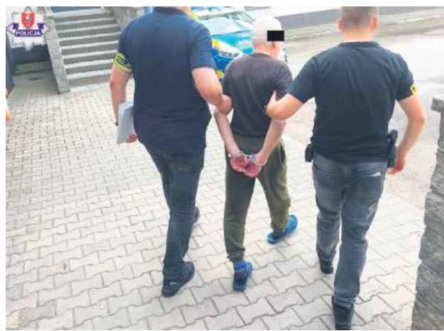
Sprawca został doprowadzony do prokuratury, gdzie przedstawiono mu zarzut usiłowania zabójstwa.

– Mężczyzna wymagał pomocy medycznej, załoga karetki pogotowia przewiozła go do szpitala. W mieszkaniu był również 83-latek. Jak się okazało, to właśnie on podczas kłótni z 66-let-