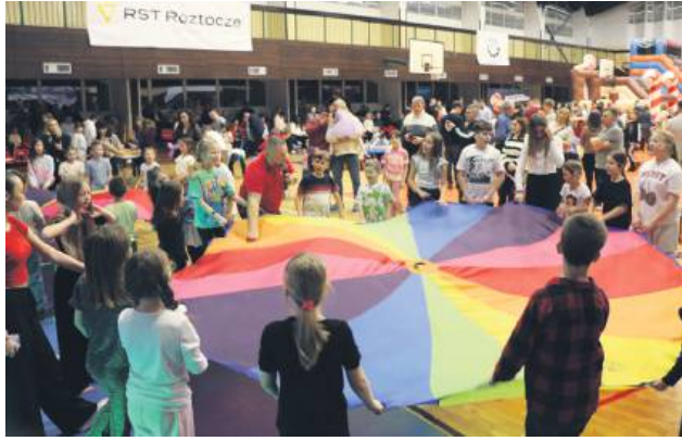
O doskonałe humory zadbali profesjonalni animatorzy.