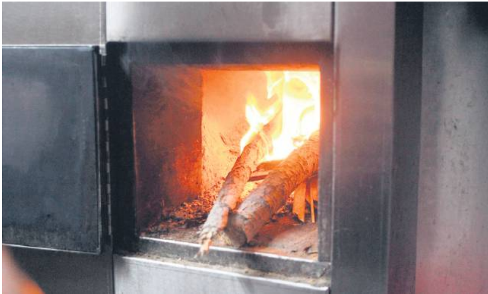
Z nastaniem mrozów łatwiej o kontrolę urzędników, którzy sprawdzają palenisko w piecu w domowej kotłowni oraz to, czym się tam paliło.

– Kontrolujemy, jeśli mamy zgłoszenie, a w poprzednich latach mieliśmy takie zgłosze-