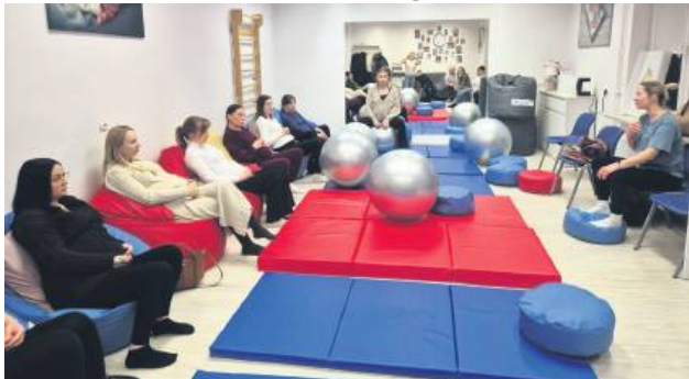
W szkole rodzenia ostatnio goszczono fizjoterapeutkę uroinekologiczną, która mówiła o wsparciu ciała kobiety przed i po porodzie.

W 2025 r. na świat przyszło 253 noworodków, niemal tyle samo co w poprzednim roku, ale ani trochę więcej. Wśród nich znalazła się jedna para bliźniaków oraz dziewięcioro wcześniaków urodzonych między 33. a 36.