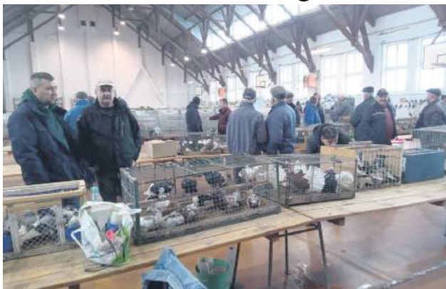
Wystawa cieszy się zawsze wielką popularnością.

Wystawa, którą organizuje Zamojskie Stowarzyszenie Hodowców Gołębi Rasowych i Drobiu Ozdobnego, zgromadzi hodowców z całej Polski. Towarzyszyć jej będą prezentacje prac malarskich, konkurs plastyczny dla dzieci i młodzieży z zamojskich szkół, prelekcje dotyczące hodowli gołębi rasowych i drobiu ozdobnego, opieki nad zwierzętami oraz ciekawostek hodowlanych.