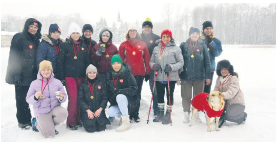
II Bieg z WOŚP i marsz nordic walking organizowany przez sztab w Lubyicy Królewskiej.