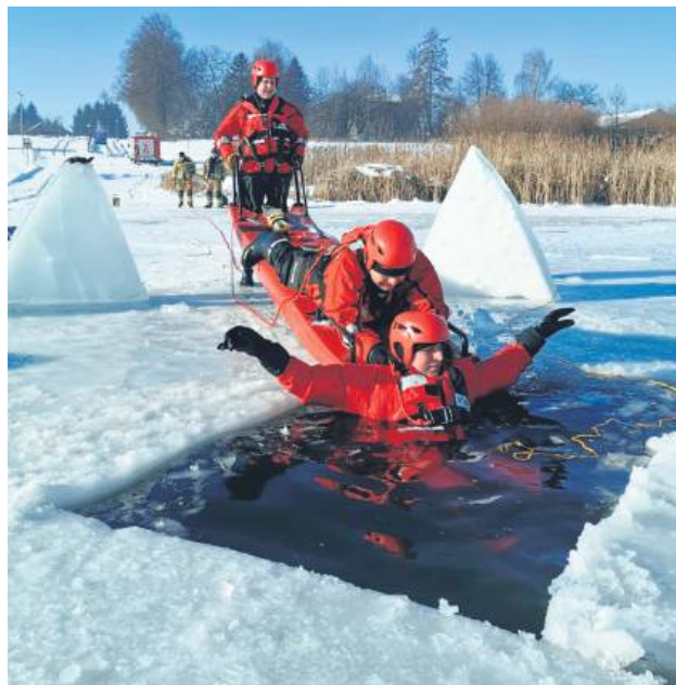
Strażacy przypominają, że wchodząc na lód zawsze ryzykujemy życiem.

C elem ćwiczeń z ratownictwa na lodzie jest doskonalenie technik ratowania tonących osób i zwierząt po załamaniu się tafli lodu oraz udzielanie wykwalifikowanej pomocy przedmedycznej. – Spacerując po zamrożonym zalewie lub stawie zawsze są niebezpieczne – przestrzega mł. bryg. Marcin Żulew-