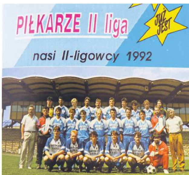
Po awansie do II ligi Hetman Zamość wydał okolicznościowy folder.