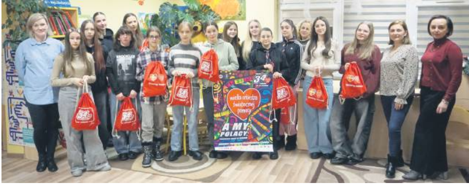
Sztab w Suścu zebrał aż 14 tys. 345 zł i 38 gr.

Natomiast w niedzielę, 25 stycznia, 17 wolontariuszek ruszyły z puszkami na ulice. Przed południem wystartowała także XIV edycja turnieju piłki siatkowej „Dla Owsiaka”.