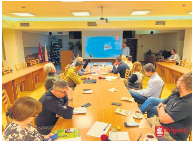
Celem Rady jest pełnienie funkcji doradczej i opiniotwórczej.

J ednym z tematów było omówienie bieżących spraw organizacyjnych związanych z przygotowaniem Forum Biznesowego w Biłgoraju. Forum ma pełnić rolę otwartej przestrzeni wymiany doświadczeń pomi-