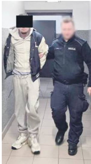
Mężczyznom grozi do 15 lat pozbawienia wolności.