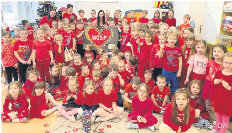
Finał WOŚP w Przedszkolu Miejskim nr 15 w Zamościu.

Dużym zainteresowaniem cieszyły się również aukcje Allegro, na których licytowanych było wiele przedmiotów i atrakcji, od spotkań i kolacji z wyjątkowymi