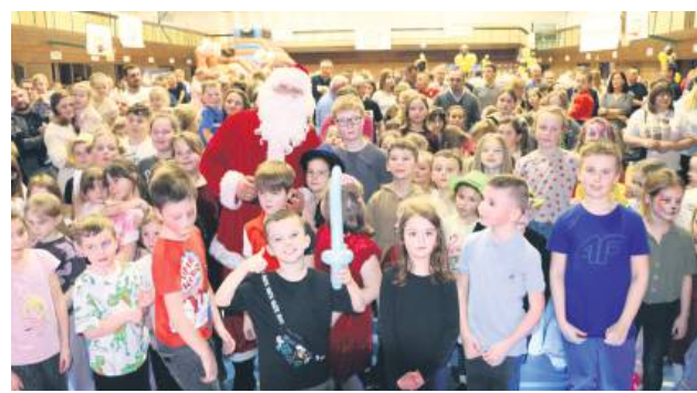
Na choinkowym spotkaniu nie mogło zabraknąć Świętego Mikołaja!

– W tej firmie pracują całe pokolenia. Dziadkowie, rodzice, dziś często także ich dzieci. Ta-