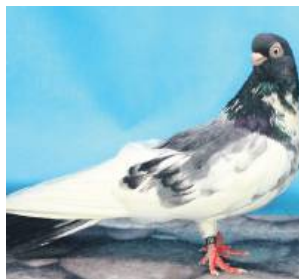
Zamojski to stara rasa gołębi wysokolotnych, która została uszlachetniona na ziemi zamojskiej. Pierwotnie gołębie te nazywano perskimi, co związane było z ich orientalnym pochodzeniem.

Zamojskie Stowarzyszenie zostało założone w 1998 r. i zrzesza prawie 200 osób prezentujących swój dorobek hodowlany na wystawach krajowych i zagranicznych, m.in. w Metz