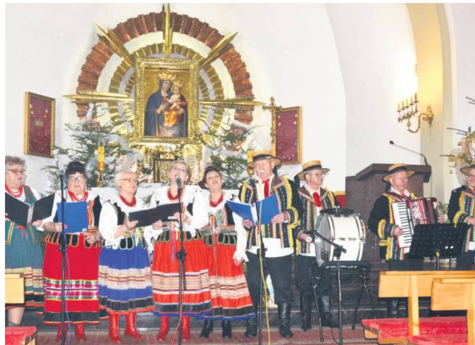
W Gminnym Przeglądzie Kolęd i Pastorałek w Lubyczy Królewskiej wzięło udział 11 wykonawców.