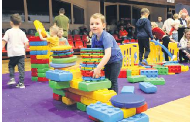
Plac zabaw był cały czas obleźony.