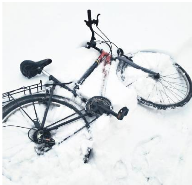
64-latek z gminy Hrubieszów zapłacił 2,5 tys. zł mandatu za podróż rowerem do sklepu po dodatkowy alkohol.

Warunki drogowe w całym regionie są od kilku dni skrajnie trudne. Zalegający śnieg i lód sprawiają, że nawet piesi mają problem z utrzymaniem równowagi. Mimo to w podhrubieszowskim Masłomęczu uwagę policjantów drogówki z Hrubieszowa przykuł rowerzysta, który poruszał