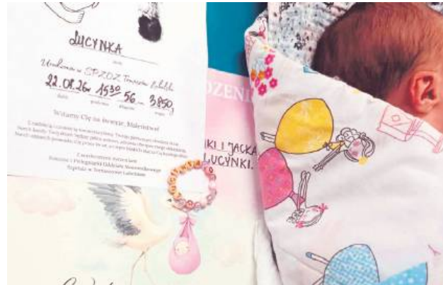
Położne z tomaszowskiego szpitala dzielą się dobrymi nowinami o powitaniu na świecie maleństwa w mediach społecznościowych. Każdy bobas dostaje od nich w prezencie bransoletkę ze swoim imieniem, a rodzice certyfikat. To miła pamiątka.