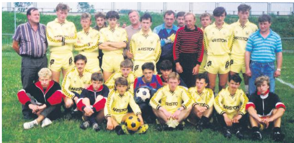
Sokół Zwierzyniec okazał się najlepszy w zamojskiej klasie okręgowej tylko raz – wygrał te rozgrywki w 1992 r.

Były też inne powody walkowerów. Mecz Ruchu Izbica z Victorią Łukowa nie został dokończony. Na kilka minut