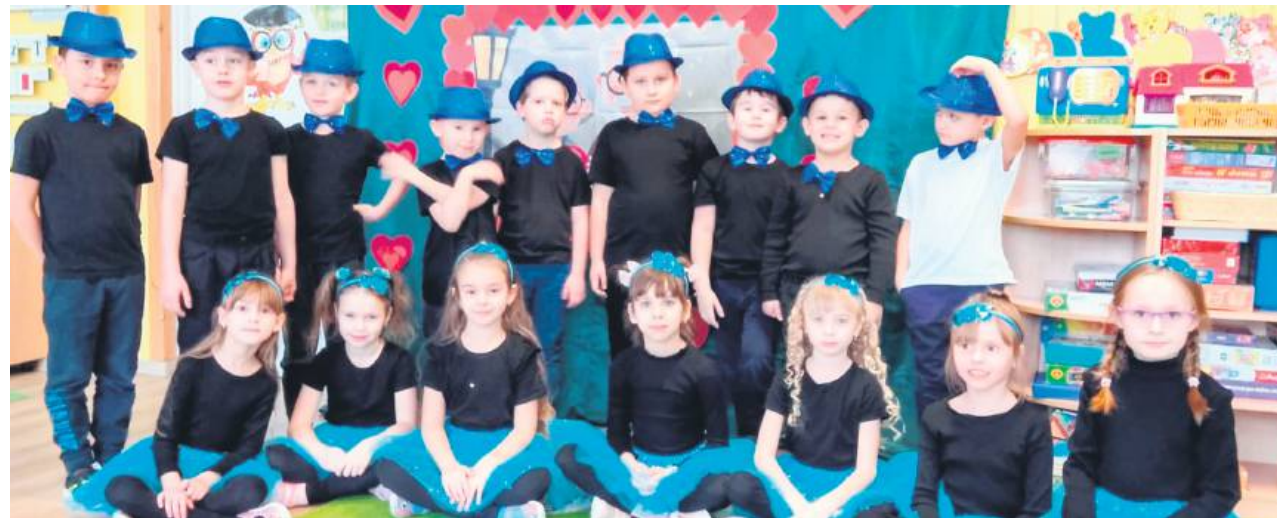
Były wiersze, piosenki, tańce i upominki wykonane przez wnuków i wnuczki, a także wiele radości i wzruszeń.