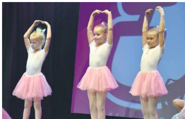
Grupa baletowa z BCK.