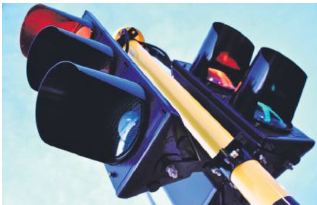
Już niebawem w Biłgoraju pojawią się sekundniki.

– Działam w imieniu mieszkańców Biłgoraja, którzy od