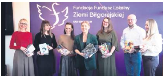
Do Biłgoraja trafiło blisko 2 tys. książek.