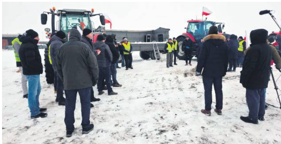
Pogoda nie sprzyjała protestującym przy przejściu granicznym w Dołhobyczowie. Pikieta została skrócona z ponad czterech godzin do jednej godziny.

Protestujący domagają się ścisłej kontroli granicy i ochrony rodzimego rynku przed skutkami liberalizacji handlu z Ukrainą.