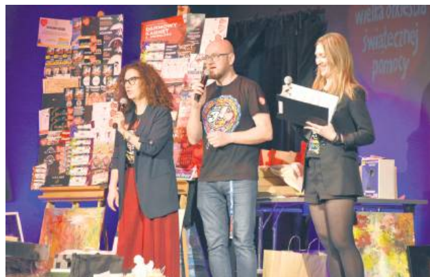
W biłgorajskim sztabie zebrana kwota osiągnęła blisko 100 tys. zł.

W sobotę, 24 stycznia, w hali sportowej Zespołu Placówek Oświatowych w Sułcu rozegrano V edycję turnieju piłki nożnej „Dla Owsia” w kategorii open.