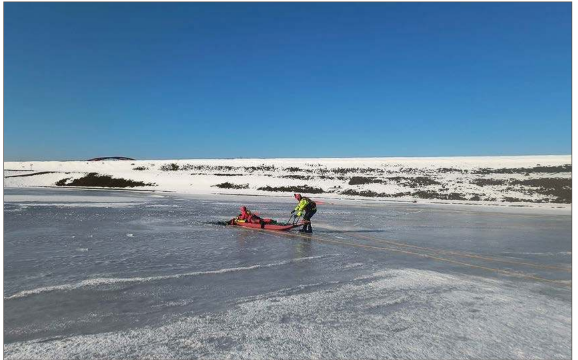
Ćwiczenia strażaków trwały trzy dni i wyglądały bardzo spektakularnie.

Właśnie z myślą o takich przypadkach strażacy podnoszą swoje umiejętności skutecznego działania w sytuacjach zagrożenia zdrowia i życia. Kilka dni temu ćwiczenia obejmujące zakres procedur w przypadku, kiedy pod człowiekiem załamał się lód prowadzone były na zbiorniku wodnym w Dębicy. Uczestniczyli w nich strażacy z Państwowej Straży Pożarnej, a także druhowie z jednostek Ochotniczej Straży Pożarnej należących do Krajowego Systemu Ratowniczo-Gaśniczego: z Pilźnia, Brzostku, Czarnej, Nawisia Brzo-