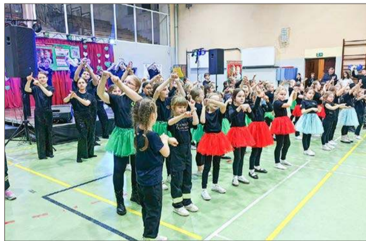
Nie zabrakło występów dzieci i młodzieży.