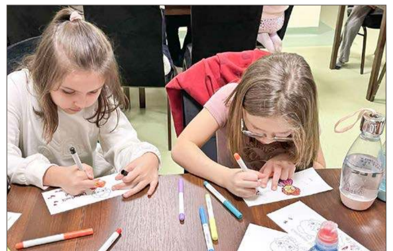
Samodzielnie wykonane rysunki trafiły na kubki dla babć i dziadków.