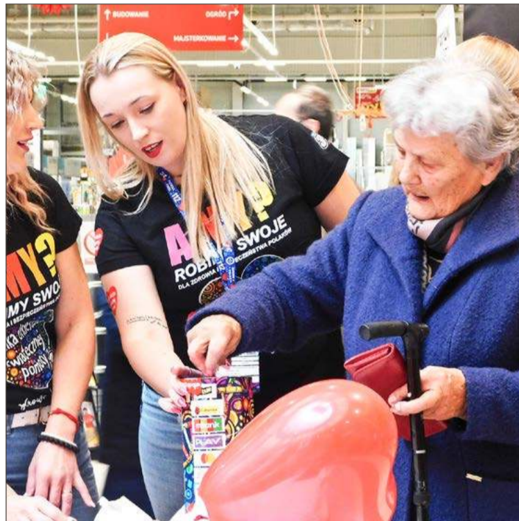
Akademia Małego Strażaka dzięki poduchom zebrała w Raju 11 000 zł.