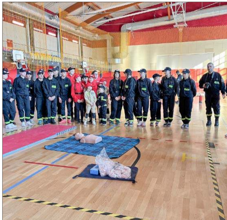
Młodzi strażacy musieli się wykazać m.in. znajomością udzielania pierwszej pomocy przedmedycznej.

Wśród dziewcząt zwyciężyła MDP OSP Niepla, przed MDP OSP