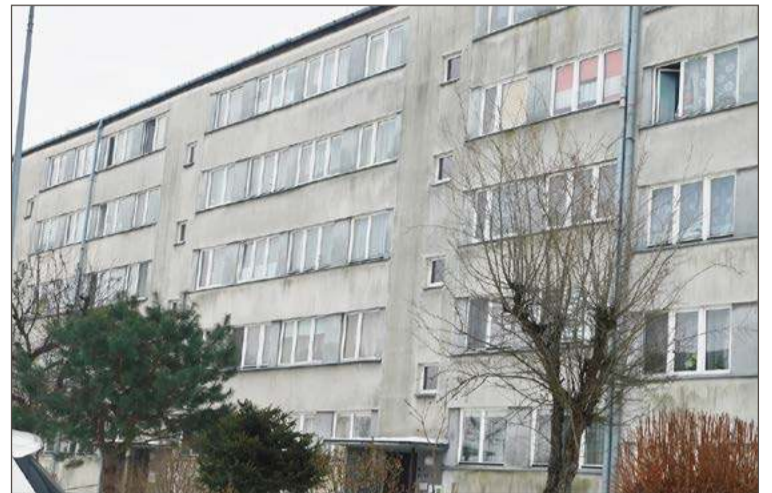
W tym bloku docieplenia wymagają ściany: frontowa i balkonowa.

- No przecież lepszych warunków to już nikt im nie da, a bez