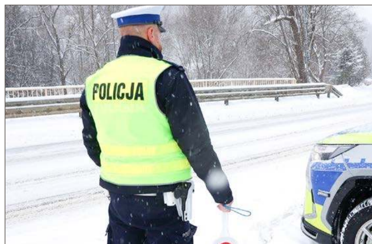
Policjanci regularnie kontrolują prędkość na drogach powiatu.