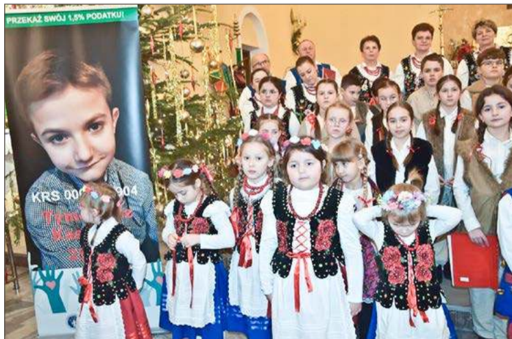
Młodzi śpiewacy kolędowali z Iskierczanami na ludowo.