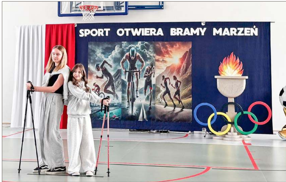
W sobotę uczniowie SP w Łękach Górnych występowali na hali. A od poniedziałku już ćwiczą.

Podczas uroczystego otwarcia, które poprzedziła msza święta, to właśnie uczniowie grali pierwsze skrzypce. To oni, występując przed zaproszonymi gośćmi, pokazali czemu służyć będzie to miejsce. Choć przewodnicząca RR twierdzi