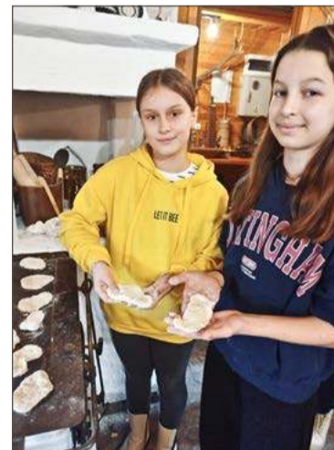
Samodzielnie zrobione proziaki smakują najlepiej.

Będzie więcej warsztatów o profilu artystycznym, a wśród nich zajęcia z tworzenia z masy solnej, wyrobu ekologicznych mydeł, robienia kwiatowych deseczek czy leśnych lampek z wykorzystaniem naturalnych materiałów. Jak dotąd największą popularnością cieszyły się warsztaty kulinarne, być może dlatego, że uczestnicy byli głodni po kilku godzinach zwiedzania.