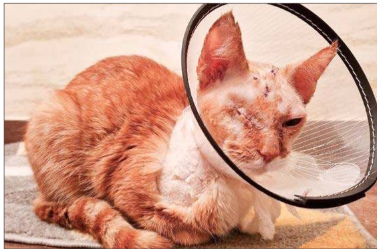
Elvis musiał przejść kilka poważnych zabiegów. Cudem przeżył.

miesiący ograniczenia wolności i pracy społecznej po 20 godzin miesięcznie. Sąd orzekł także zakaz posiadania zwierząt na 5 lat i nawiązkę na rzecz fundacji w kwocie 15 tys. zł. Pełnomocniczka Psiego Azylku złożyła sprzeciw, gdyż aktywiści prozwierzęcy uznali ten wyrok za nieadekwatny.