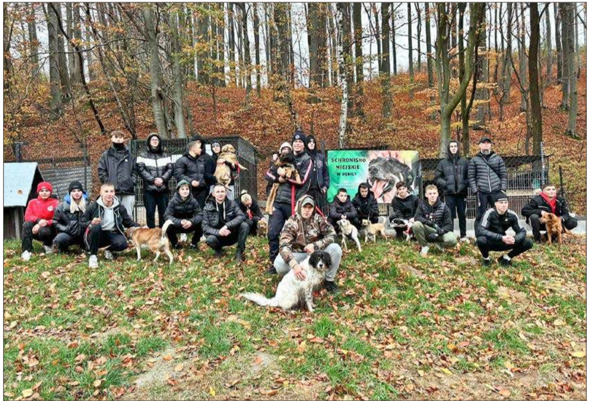
W schronisku w Dębicy organizowane są dni otwarte, można je odwiedzać.

- Co najważniejsze, nie mają bezpośredniego wpływu na dobrostan przebywających w nich zwierząt - zapewnia.