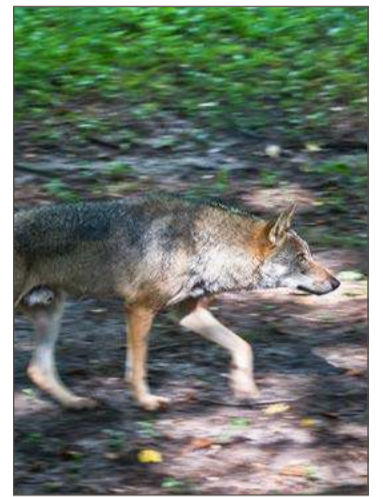
Wilki widywane są w lasach całego powiatu.

- Nie mieliśmy żadnych zgłoszeń dotyczących agresywnych zachowań wilków w stosunku do człowieka ani nawet zwierząt domowych - podkreśla Trzeciak.