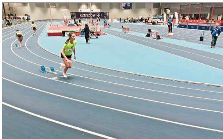
Dla zawodników MUKLA Dębica był to udany start.