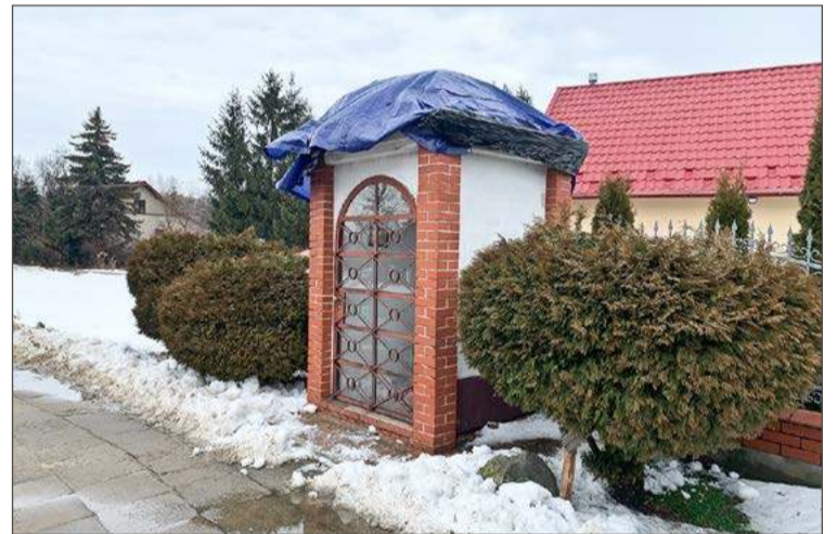
Złodzieje zdemontowali miedziany dach.