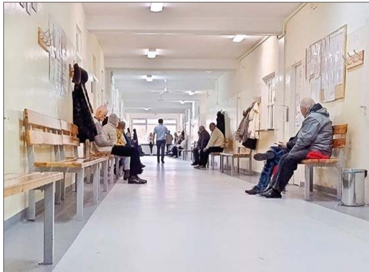
Czekając w kolejce do specjalisty warto uzbroić się w cierpliwość.

Z początkiem grudnia znajdziemy też wolny termin rehabilitacji w gabinecie przy ul. Prusa, a jeszcze wcześniej, bo pod koniec września w szpitalu. Jeżeli natomiast potrzebujemy wymienić staw kolanowy to w ZOZ będzie to można zrobić w połowie listopada. Do Poradni Gruźlicy i Chorób Płuc na pierwszą wizytę można się zgłosić 23 października. Trzeba jednak brać pod uwagę, że w kolejce czeka obecnie 469 osób.