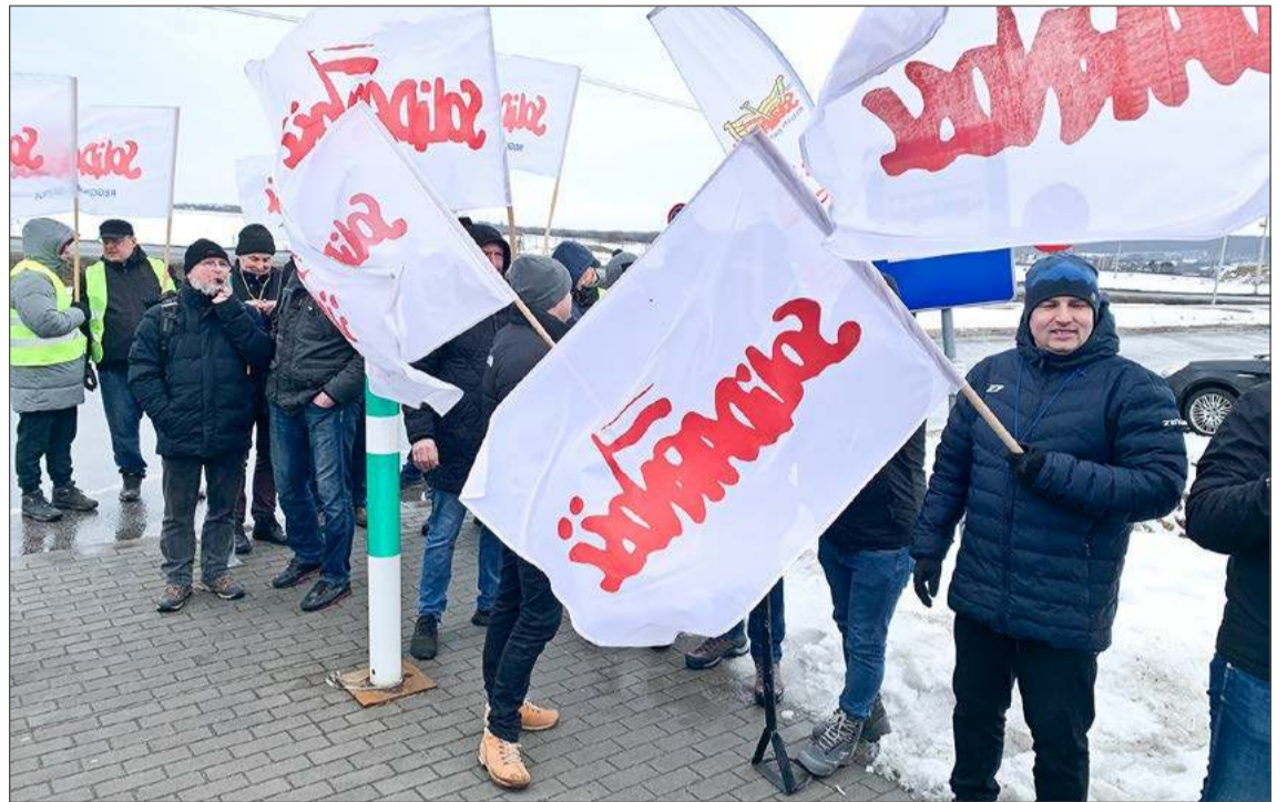
Pod bramą zakładu w Zawadzie zebrano się ok. 100 członków Solidarności, także z Łodzi, Żywca i Krakowa.

Podczas poniedziałkowej pikiety pracowników z Dębicy wspierali ich koleżanki i koledzy z zakładów