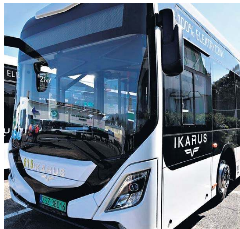
Autobusy elektryczne jako pierwszy w regionie wprowadził na trasy Szczecinek. Dziś stanowią one większość floty

Świat. Irańskie siły zbrojne ostrzegły marynarkę USA przed wpływaniem do Cieśniny Ormuz str. 7