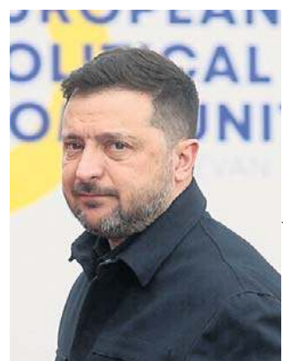
Wołodimir Zełenski na szczycie w Erywanu

- Rosja ogłosiła paradę (wojskową) 9 maja, ale nie będzie na niej sprzętu wojskowego.