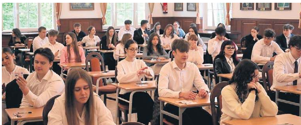
I LO im ks. Elżbiety w Szczecinku. Wczoraj język polski a dzisiaj egzamin z matematyki.

- Jak zobaczyłem tematy, to na początku miałem wrażenie, że są dość podchwytliwe. Nie było takiego jednego, oczywistego i „przyjemnego” tematu, jak np. o miłości czy walce dobra ze złem, gdzie łatwiej coś napisać. Tutaj oba wymagały zastanowienia. Jeden dotyczył wpływu pracy na człowieka i jego otoczenie, a drugi tego, kiedy dla człowieka ważna jest opinia in-