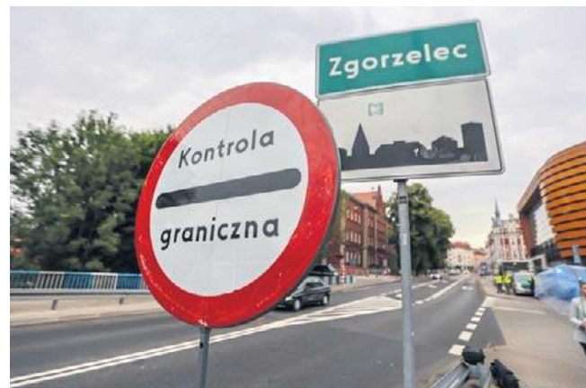
Obowiązujące od 16 września 2024 roku kontrole graniczne były już trzykrotnie przedłużane

Wobec podróżujących, w tym przekraczających granicę w celu dojazdu do pracy, utrzymane zostaną wyrównane kontrole. Może to powodować opóźnienia na przejściach granicznych ze wszystkimi dziesięcioma państwami sąsiadującymi z Niemcami, w tym z Polską. Każda osoba przekraczająca granicę musi mieć przy sobie dokument tożsamości. PAP