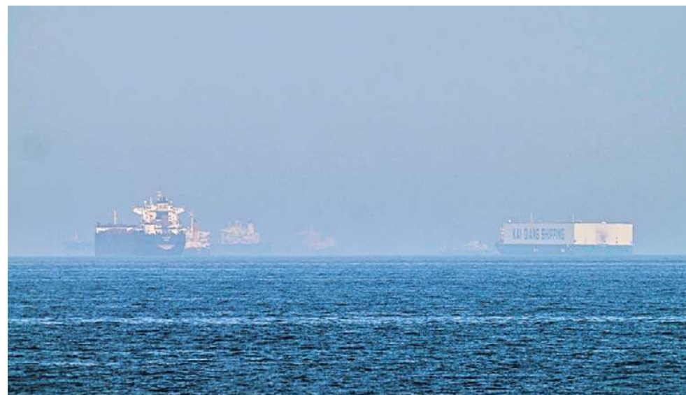
Tankowiec i statek do przewozu samochodów zakotwiczone na morzu w Zatoce Omańskiej w pobliżu cieśniny Ormuz, widziane z wybrzeża w pobliżu Khor Fakkan

Donald Trump zapowiedział, że siły USA zaczną pomagać statkom handlowym w bezpiecznym transzycie przez cieśninę Ormuz