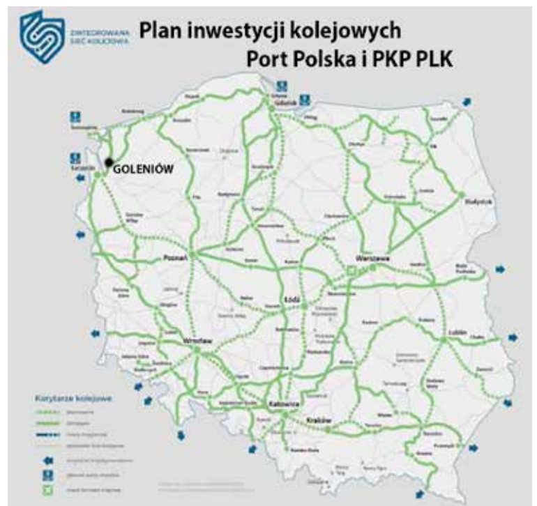
Wizualizacja koncepcji rozwoju magistrali kolejowych

Jak przedstawił Michał Pyzik w północnej części kraju kręgosłup komunikacyjny ma tworzyć Magistrala Bałtycka. Analogicznie do dróg ekspresowych mamy Magistralę Bałtycką, która połączy Gdańsk ze Szczecinem w około trzy godziny - powiedział Pyzik. Jak podkreślił, część inwestycji na tym ciągu jest już realizowana przez PKP Polskie Linie Kolejowe. Planowane są również nowe inwestycje i nowe odcinki na tej trasie - dodał. Jak pokazuje załączona mapa "Plan inwestycji kolejowych Port Polska i PKP PLK" trasa ze Szczecina do Gdańska przez Goleniów i Nowogard (nr 402) wygrywa konkurencję z dominującym dotychczas przebiegiem połączenia do Trójmiasta przez Stargard i Łobez (nr 202). Prawdopodobnie powodem takiej decyzji jest lokalizacja wzdłuż trasy 402 lotniska Szczecin Goleniów (nawet jest przystanek przy lotnisku) i także przebieg przez Kołobrzeg oraz równoległość do ekspresówki S-6 - tych atutów nie ma znacznie bardziej dotychczas doinwestowana (nawet zelektryfikowana) trasa przez Stargard (202).