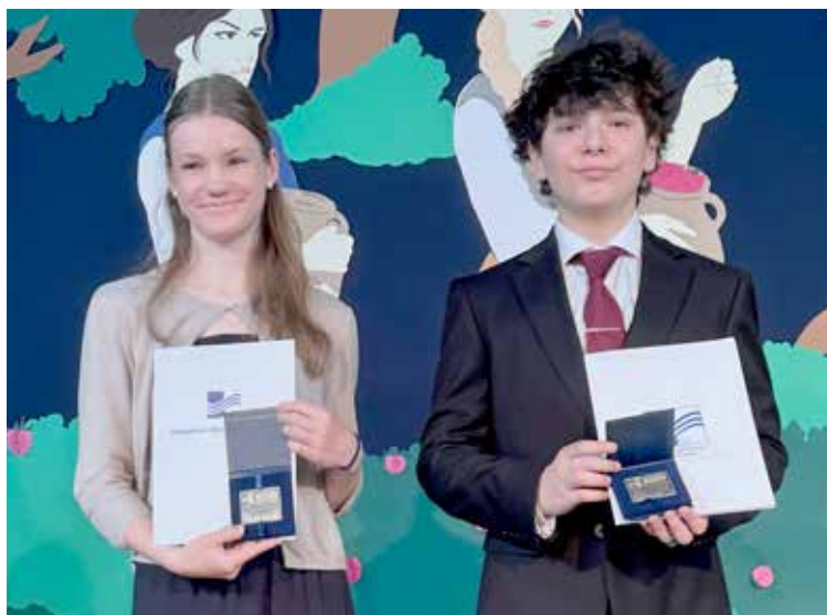
Laureaci ze Szkoły Cogito

- Jako osoba kierująca szkołą podstawową, jestem dumny z faktu, że dwójka tegorocznych absolwentów naszej szkoły znalazła się w tym wyjątkowym gronie. Tym bardziej, że należymy do grupy najmniejszych szkół w gminie. Ze względu na układ treści progra-