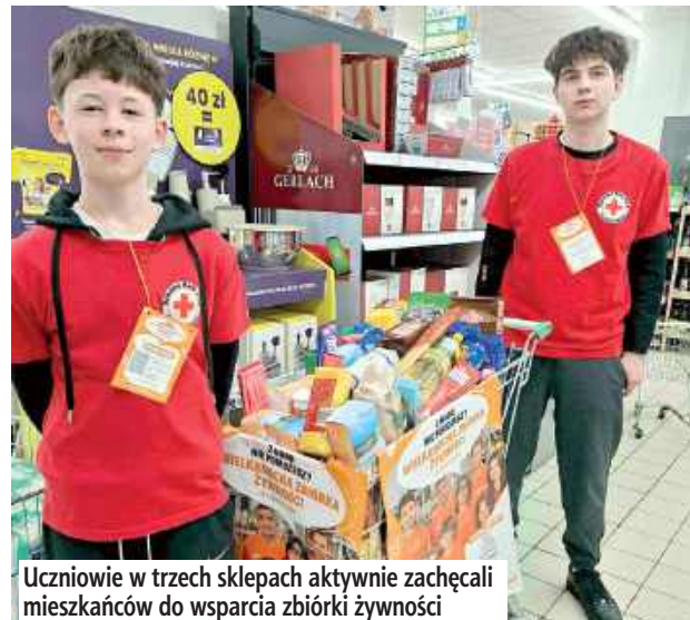
Uczniowie w trzech sklepach aktywnie zachęcali mieszkańców do wsparcia zbiórki żywności