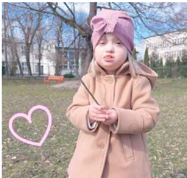
Możemy pomóc Neli, przekazując 1,5% swojego podatku lub darowiznę na Fundację Avalon z dopiskiem „KOLASIŃSKA, 12564”

Ty też możesz jej pomóc, przekazując 1,5% swojego podatku lub darowiznę na Fundację Avalon z dopiskiem „KOLASIŃSKA, 12564”. To prosty gest, a dla Neli ogromna szansa na lepsze jutro.