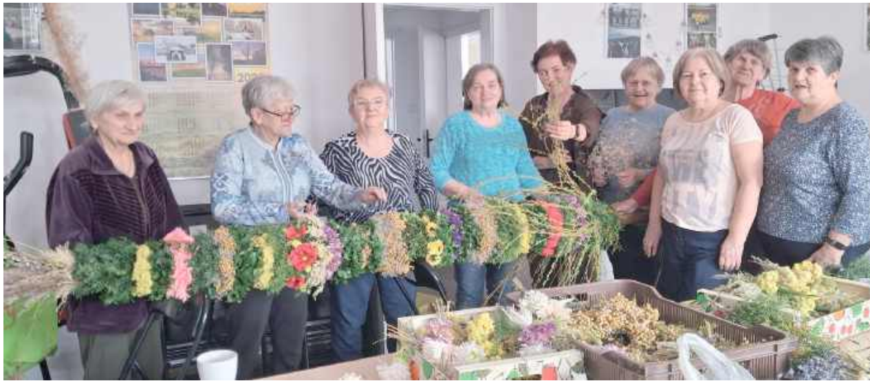
Seniorzy z baranowskiego koła nr 3 emerytów i rencistów nigdy się nie nudzą, bo podejmują różnorakie inicjatywy. Ostatnio uwili palmę o długości ponad 3 metrów

Baranowscy seniorzy zawsze są w pogotowiu. Pomagają m.in. ugościć pielgrzymów, którzy latem przechodzą przez teren gminy.