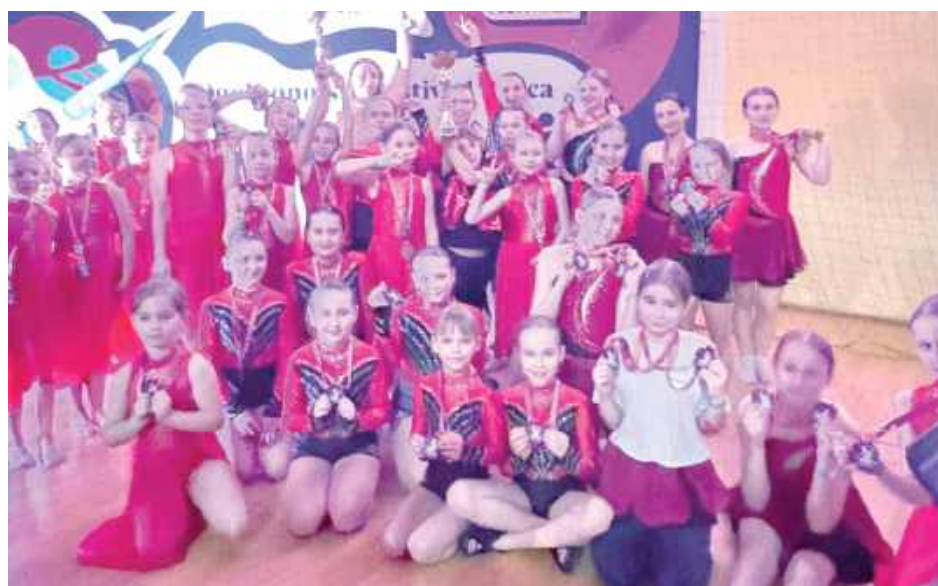
Opolskie akrobatki zaprezentowały się znakomicie, zdobywając liczne miejsca na podium

- Będziemy prezentować choreografię w kategorii acro