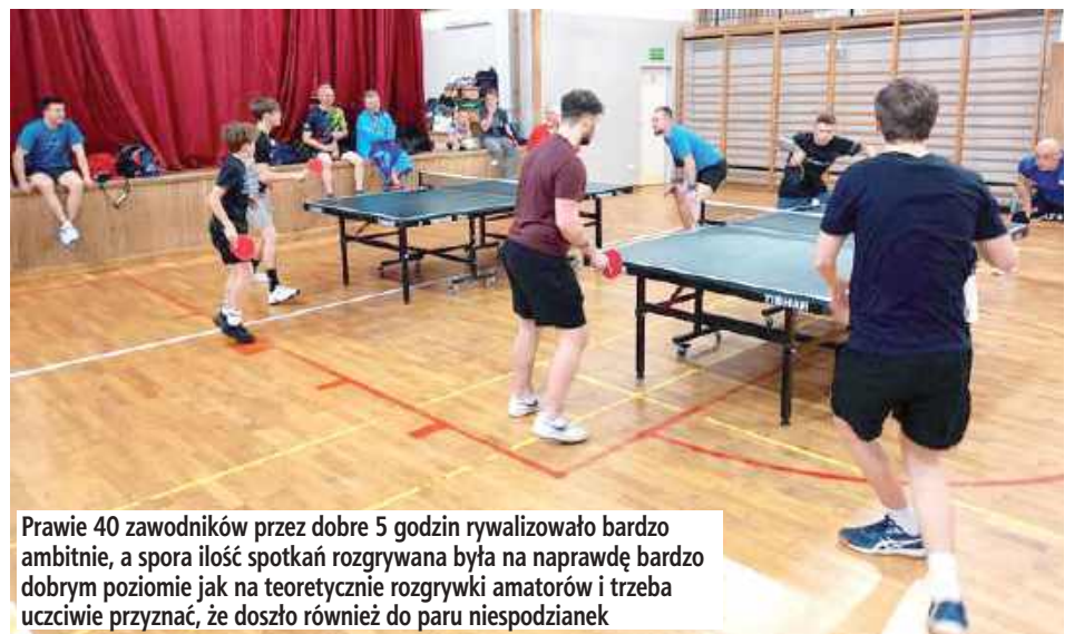
Prawie 40 zawodników przez dobre 5 godzin rywalizowało bardzo ambitnie, a spora ilość spotkań rozgrywana była na naprawdę bardzo dobrym poziomie jak na teoretycznie rozgrywki amatorów i trzeba uczciwie przyznać, że doszło również do paru niespodzianek

22 marca odbył się kolejny turniej w ramach tegorocznej edycji Grand Prix Puław w tenisie stołowym. Tego dnia walczone w „dorosłych” grupach wiekowych i deblowym turnieju open.