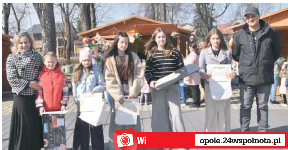
Jednym z ważnych punktów wydarzenia było uroczyste wręczenie nagród w Gminnym Konkursie Plastycznym „Koszyczek Wielkanocny”

Kolorowe stroiki, ręcznie wykonane ozdoby i zapach tradycyjnych wypieków - tak wyglądał Kiermasz Wielkanocny, który odbył się na Placu Jana Pawła II w Opolu Lubelskim w niedzielę, 22 marca.