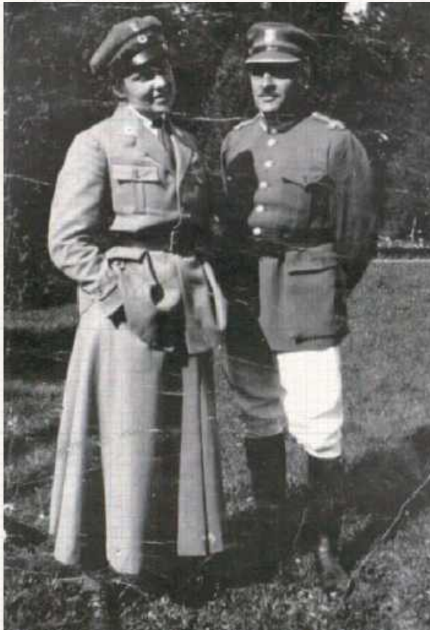
W 1920 roku szpital hrabiny został wcielony do wojska i towarzyszył oddziałowi Piłsudskiego walczącym na wschodzie. W sierpniu 1920 roku stanowił bezpośrednie medyczne zaplecze kontrofensywy znad Wieprza