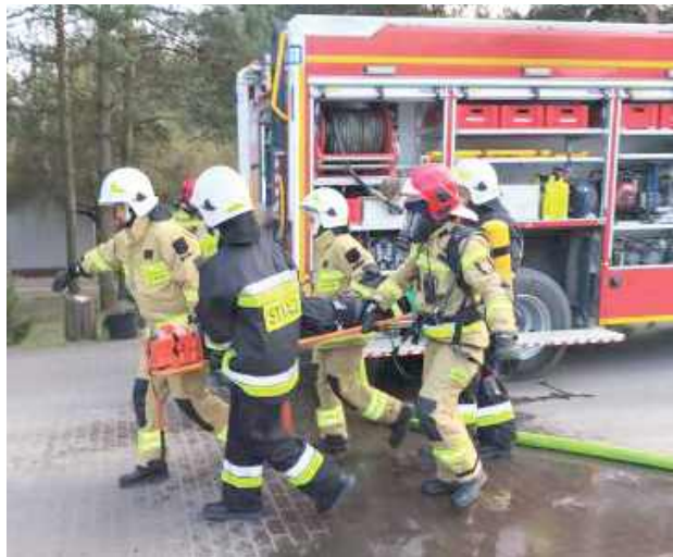
Cała akcja zakończyła się powodzeniem - odnaleziono osobę poszkodowaną, udzielono jej pierwszej pomocy, a zagrożeni pracownicy zostali bezpiecznie ewakuowani

W zadymionym wnętrzu mogła znajdować się osoba poszkodowana. Widoczność była ograniczona niemal do zera, a warunki pracy straża-