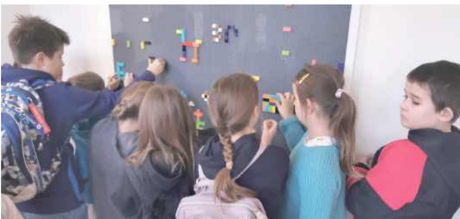
Dziś nowe miejsce tętni życiem. Uczniowie budują, eksperymentują, współpracują i rozwijają swoją kreatywność

W Szkole Podstawowej w Nałęczowie powstało wyjątkowe miejsce, które już teraz cieszy się ogromną popularnością wśród uczniów. Wszystko za sprawą inicjatywy Szkolnej Kasy Oszczędności działającej pod patronatem Banku Spółdzielczego w Nałęczowie.