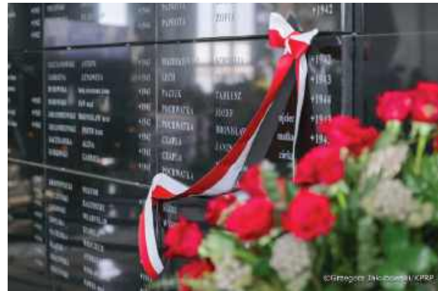
Podczas uroczystości w Toruniu odsłonięto także kolejne nazwiska Polaków zamordowanych za pomoc Żydom