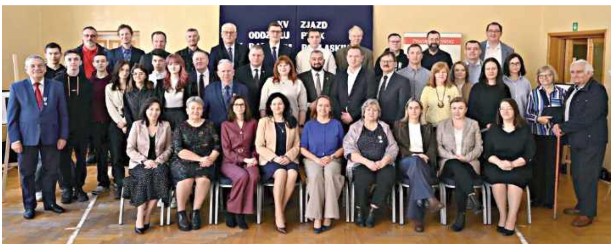
Wydarzenie miało również symboliczny wymiar. W 2027 roku radzyński oddział PTTK będzie obchodził 55-lecie swojej działalności, dlatego zjazd stał się także swoistym wstępem do przygotowań jubileuszowych

XV Zjazd Oddziału Polskiego Towarzystwa Turystyczno-Krajoznawczego w Radzynie zgromadził działaczy organizacji, sympatyków turystyki oraz licznych gości z regionu. Spotkanie było okazją do podsumowania działalności oddziału, wyboru nowych władz oraz wyróżnienia osób szczególnie zaangażowanych w rozwój turystyki i krajoznawstwa.