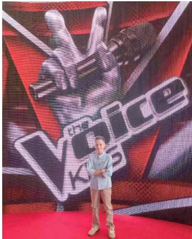
Uczeń Zespołu Szkół im. Jana Pawła II w Ulanie-Majoracie zaprezentował na scenie utwór „Nie ma, nie ma ciebie” Kayah. Jego interpretacja spotkała się z bardzo entuzjastyczną reakcją jurorów i publiczności, a trenerzy niemal natychmiast zdecydowali się walczyć o młodego wokalistę w swoich drużynach

Dla 13-latka z Ulanie-Majoratu udział w programie to nie tylko ogromne wyróżnienie, ale także szansa na dalszy rozwój muzyczny i kolejne sceniczne doświadczenia.