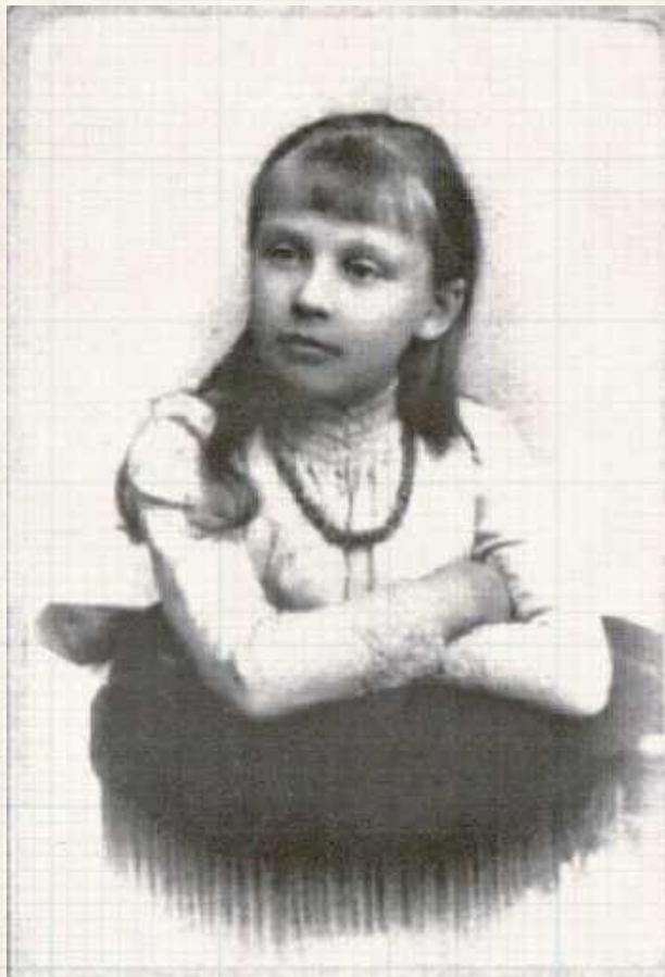
Z tej siedmioletniej dziewczynki z Milanowa wyrosnie dama, o której z szacunkiem będą pisać nawet hitlerowscy oficerowie