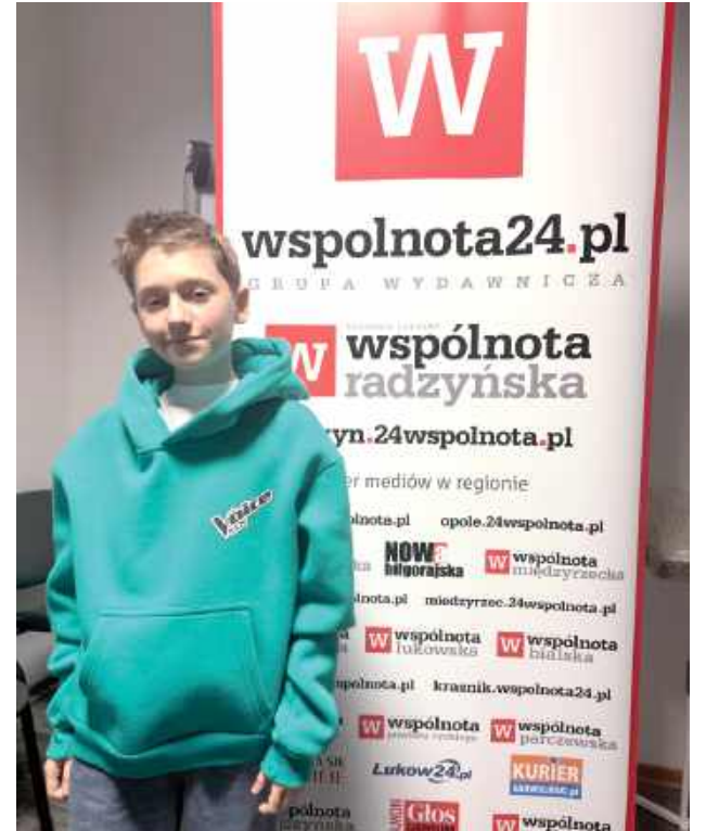
Program „The Voice Kids” to jeden z najpopularniejszych muzycznych talent show w Polsce. W etapie przesłuchań w ciemno trenerzy siedzą tyłem do sceny i oceniają wyłącznie głos uczestników. Odwrócenie fotele oznacza chęć przyjęcia uczestnika do swojej drużyny i dalszy udział w programie