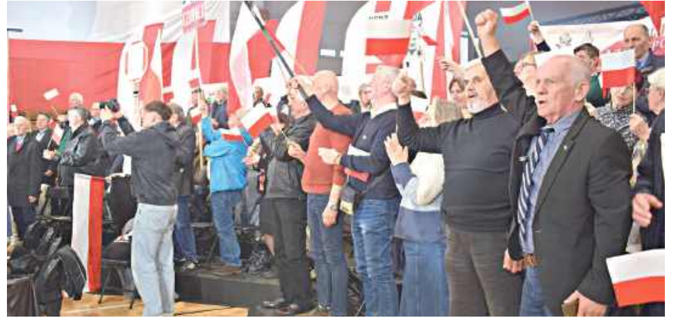
Powitanie Przemysława Czarnka

- Kto do ciebie dzwonił Tusku? Oni? Friedrich? Ursula? Do ciebie powinni dzwonić Polacy, zwykli, prości, którzy stanęli wczoraj pod Pałacem Prezydenckim i bronili