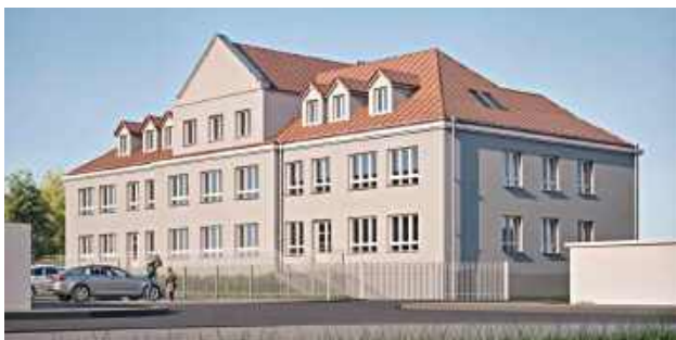
Projekt architektoniczny inwestycji przygotowała pracownia KWADRA Architekci. Ostateczna realizacja przedsięwzięcia będzie zależała od decyzji dotyczącej przyznania dofinansowania

Władze Radzyna ubiegają się o dofinansowanie projektu „Termomodernizacja obiektów użyteczności publicznej Miasta Radzyna Podlaski” w ramach programu Fundusze Europejskie dla Lubelskiego 2021–2027.