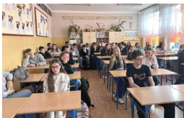
Podczas wizyty w radzyńskiej „Dwójce” laureat konkursu przeprowadził prelekcję dla uczniów klas 7d oraz 8f. Opowiadał o znaczeniu zdrowego odżywiania i aktywności fizycznej dla prawidłowego funkcjonowania organizmu – zarówno pod względem fizycznym, jak i psychicznym

Podczas wizyty w radzyńskiej „Dwójce” laureat konkursu przeprowadził prelekcję dla uczniów klas 7d oraz 8f. Opowiadał o znaczeniu zdrowego odżywiania i aktywności fizycznej dla prawidłowego funkcjonowania organizmu –