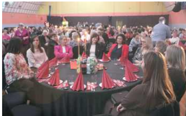
Sala gimnastyczna zamieniła się w bankietową z wykwintnym wystrojem stołów