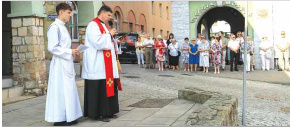
■ Uroczystość św. Wawrzyńca, nabożeństwo przy figurze na rynku

W niedzielne popołudnie Wodzisław Śląski przypomniał sobie o swoim patronie – świętym Wawrzyńcu. Uroczystości zaczęły się przy figurze diakona i męczennika, skąd mieszkańcy przeszli do kościoła pw. Wniebowzięcia Najświętszej Maryi Panny. Wnętrze świątyni wypełniło się za-