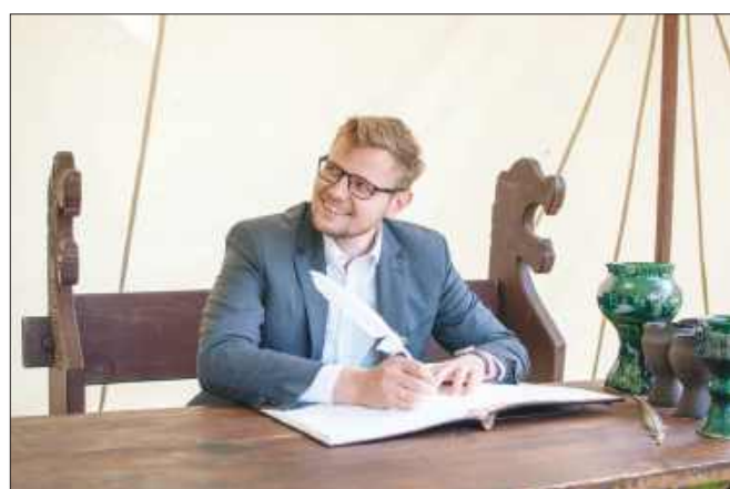
■ 569 interpelacji napisał poseł Michał Woś między 8 stycznia 2024 roku a 31 lipca 2025

Jak podkreśla Komenda Powiatowa Policji w Wodzisławiu Śląskim, nadmierna prędkość jest jedną z najczęstszych przyczyn tragicznych w skutkach wypadków drogowych. W komunikacie czytamy: „Przy dużej prędkości mały błąd kierowcy może mieć tragiczne skutki. Zwolnij. Ceń życie swoje i innych”. Policjanci apelują o rozsądek i przypominają, że ograniczenia prędkości obowiązują przez całą dobę – również w nocy. Informacje o zdarzeniu przekazała Komenda Powiatowa Policji w Wodzisławiu Śląskim.