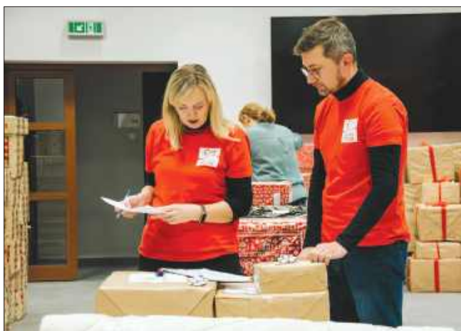
■ Rekrutacja do wolontariatu w Szlachetnej Paczce trwa. W województwie śląskim poszukiwanych jest ponad 1000 wolontariuszy

wolontariuszy. Pomoc otrzymało 1960 rodzin. Wartość wsparcia przekroczyła 8,47 mln zł. – Wolontariusz Szlachetnej Paczki odwiedza i poznaje rodzi-