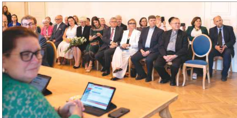
■ W nadzwyczajnej sesji rady miejskiej uczestniczyli przedstawiciele instytucji miejskich, powiatu i parafii