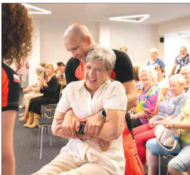
AgaKa ■ Seniorzy chętnie brali udział w pokazach pierwszej pomocy

Koperta Życia była rozdawana bezpłatnie podczas wydarzenia, a obecnie można ją również odebrać w Wodzisławskim Klubie Seniora, Centrum Aktywności Społecznej oraz Miejskim Ośrodku Pomocy Społecznej.