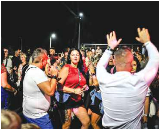
■ Karaiby na niby w Rydułtowach – 9.08.2025