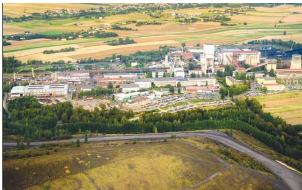
■ 40 mln ton węgla czeka na wydobycie