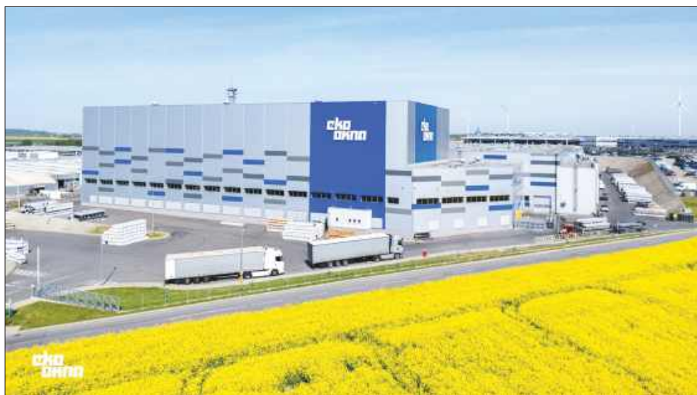
■ Główna siedziba Eko-Okien w Kornicach, zdjęcie ilustracyjne