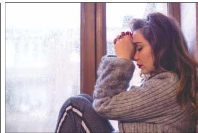
■ Zasiłek macierzyński za okres 8 tygodni po porodzie przysługuje również wtedy, gdy dziecko urodzi się martwe, a kobieta przedstawi zaświadczenie o martwym urodzeniu. ZDJĘCIE ILUSTRACYJNE, FOT. FREEPIK