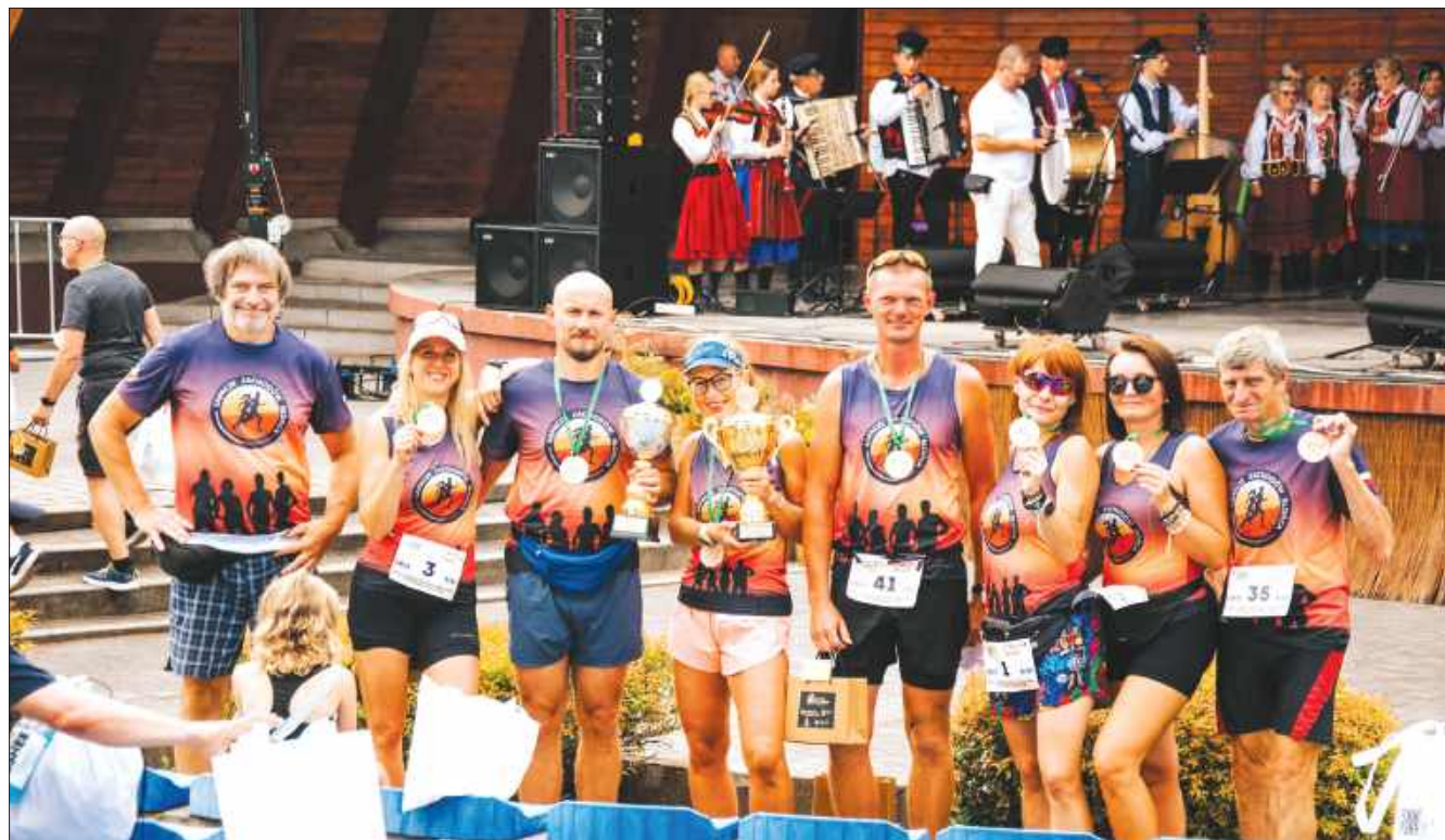
■ Laureaci biegu o Puchar Japycza

GODÓW 9 sierpnia na kompleksie rekreacyjnym w Godowie odbyła się impreza upamiętniająca postać wybitnego aktora urodzonego w Godowie, Franciszka Pieczki.