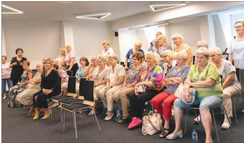
■ Wydarzenie dla mieszkańców Wodzisławia cieszyło się dużym zainteresowaniem seniorów

Jednym z kluczowych punktów programu była prelekcja dyrektora Wojewódzkiego Pogotowia