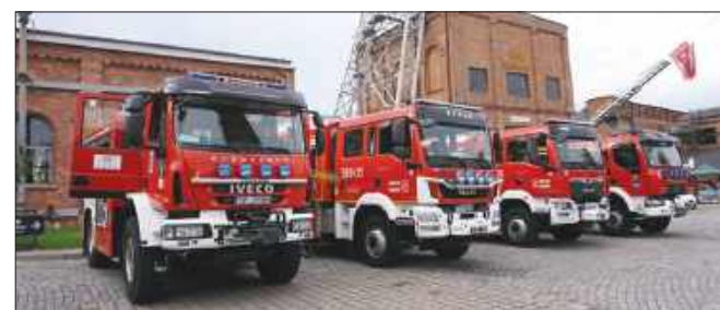
■ Podczas wydarzenia można było oglądać wozy strażackie m.in. z Rybnika i Radlina