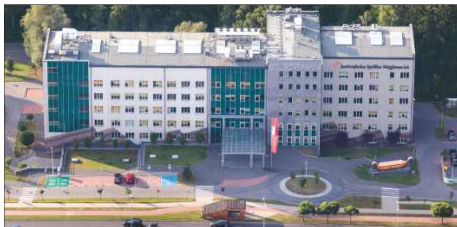
■ Biuro Zarządu JSW, zdjęcie ilustracyjne

REGION Jastrzębska Spółka Węglowa poinformowała o umorzeniu certyfikatów inwestycyjnych w swoim funduszu finansowym. Do kasy spółki trafi około 210 milionów złotych, które mają wesprzeć bieżącą działalność i inwestycje.