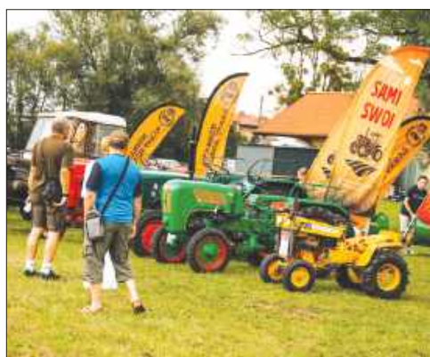
■ Przygotowano również wystawę sprzętu rolniczego