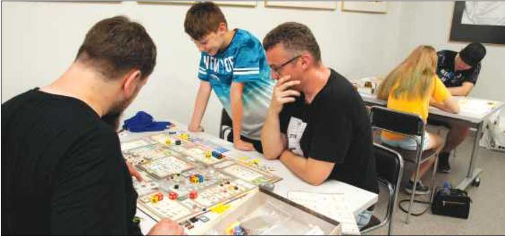
■ Grydcon będzie świętem gier planszowych. ZDJĘCIE ILUSTRACYJNE, ARCH. NOWINY.PL