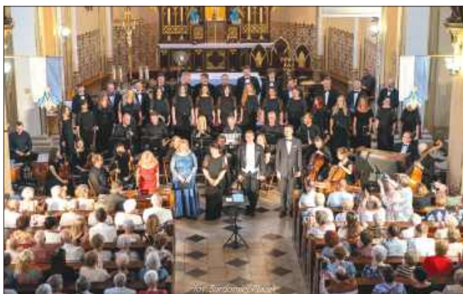
■ Muzycy podczas uroczystego koncertu