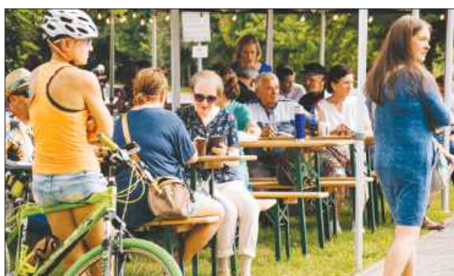
■ Wydarzenie miało formę pikniku rodzinnego w filmowej atmosferze