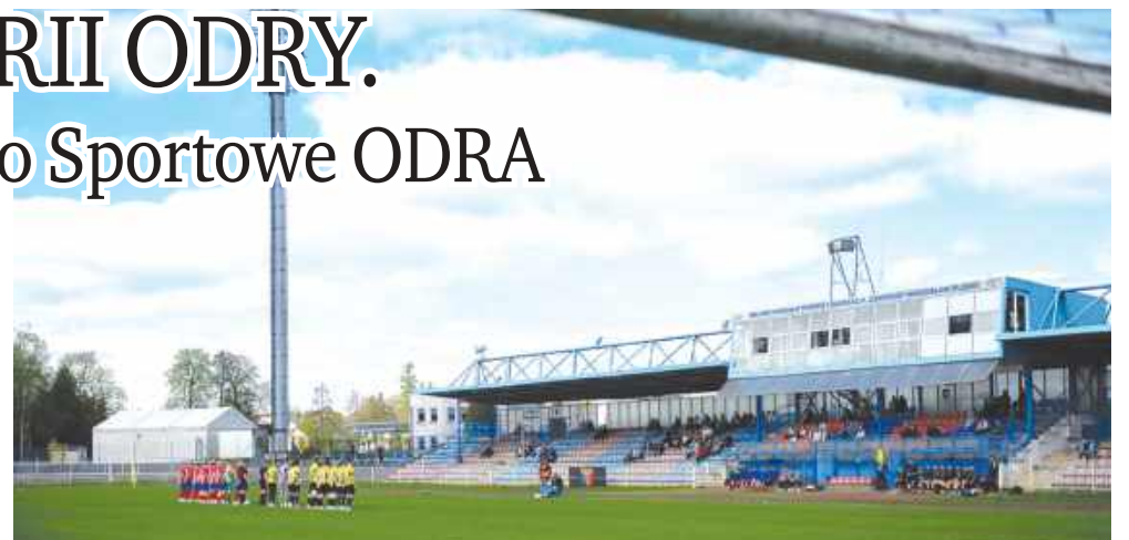
■ Nowy klub nosi nazwę WTS Odra i zadebiutuje w B-klasie. Zdjęcie ilustracyjne