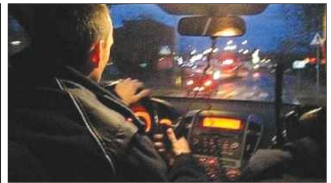
■ Funkcjonariusze zatrzymali 23-latkowi prawo jazdy na 3 miesiące. Zdjęcie ilustracyjne