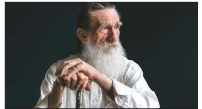
■ Województwo śląskie jest drugim, zaraz po mazowieckim (ponad 620 osób), gdzie liczba stulatków w statystykach ZUS jest najwyższa

Co ważne, dodatkową gratyfikację otrzymać mogą i otrzymują nie tylko klienci ZUS, ale również stulatkowie,