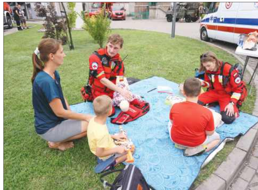
■ Wydarzenie było także okazją do udziału w warsztatach pierwszej pomocy