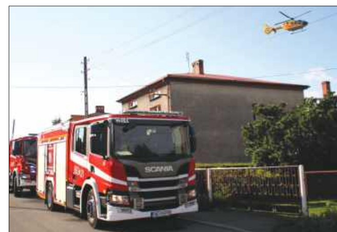
■ Na miejscu zdarzenia pracowało 8 zastępów straży pożarnej

łącznie 31 strażaków. Na miejscu pracowali także policjanci i zespół ratownictwa medycznego, który przygotował poszkodowanego mieszkańca do transportu lotniczego. Śmigłowiec wylądował z tyłu posesji, na zabezpieczonym przez strażaków lądowisku. Po podjęciu 70-latka ratownicy udali się do Siemianowic, gdzie mieszkaniec Krzyżkowic trafił do Centrum Leczenia Oparzeń.