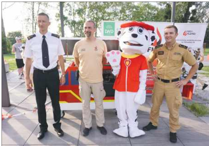
■ Dzieci bawiące się w pianie, wozy strażackie i uśmiechy podczas spotkania z maskotką psem Marshall – tak wyglądał strażacki piknik „Fojermany na Hoymie” w Rybniku.

RYBNIK Nie tylko widowiskowe pokazy, ale przede wszystkim lekcja bezpieczeństwa i okazja do spotkania z tymi, którzy na co dzień ratują życie – tak wyglądała tegoroczna edycja pikniku „Fojermany na Hoymie” w rybnickiej dzielnicy Niewiadom. Wydarzenie odbyło się na terenie Zabytkowej Kopalni Ignacy i jak co roku przyciągnęło tłumy mieszkańców.