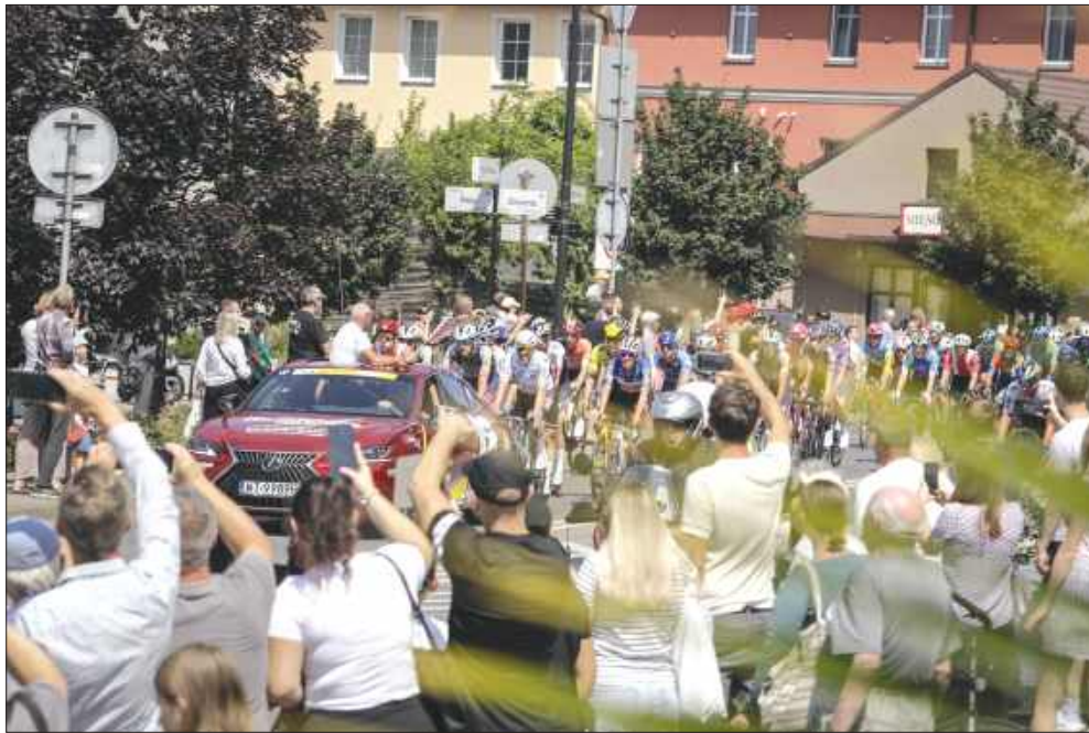
■ Tour de Pologne 2025 w Rybniku, 7.08.2025 r.

Wśród zgromadzonych nie zabrakło lokalnych grup rowerowych, takich jak Roweryści – znani z aktywnej promocji jazdy na rowerze