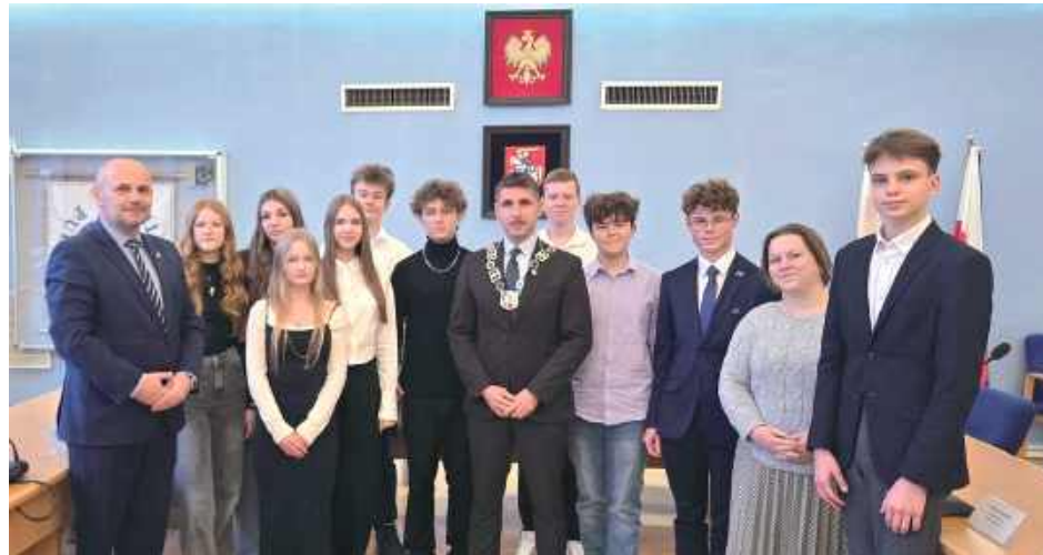
To już IX kadencja Młodzieżowej rady Miasta. Zainaugurowała ją pierwsza sesja nowo wybranego składu, która odbyła się 14 listopada