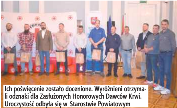
Ich poświęcenie zostało docenione. Wyróżnieni otrzymali odznaki dla Zasłużonych Honorowych Dawców Krwi. Uroczystość odbyła się w Starostwie Powiatowym

Od lat bezinteresownie niosą pomoc potrzebującym. I nie robią tego dla odznaczeń, czy poklasku, a z potrzeby serca. W Sali Pompejańskiej Starostwa Powiatowego w Puławach zorganizowano Galę Honorowych Dawców Krwi.