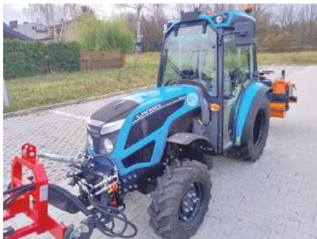
Z nowego sprzętu będą korzystać pracownicy Grupy Utrzymania i Eksploatacji Wodociągów i Kanalizacji w Górze Puławskiej

Włodarze Gminy Puławy zdecydowali się na zakup traktorka komunalnego marki Landini. Jest wyposażony w zestaw specjalistycznych narzędzi jak m.in. zmiatarka czy urządzenie do usuwania chwastów. Sprzęt będzie wykorzystywany przez pracowni-