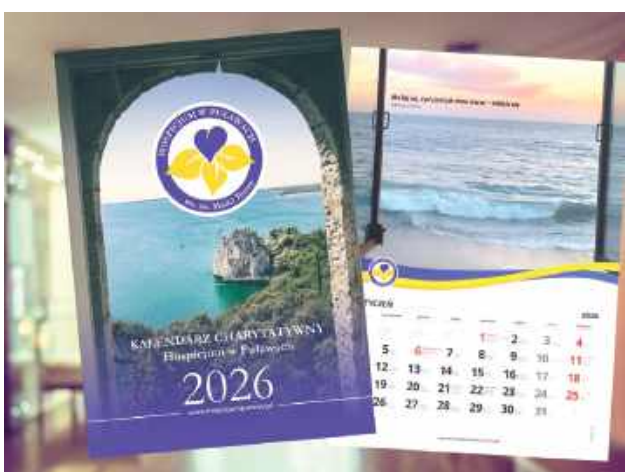
Hospicyjny kalendarz nabędziemy za symboliczny datok, nie mniejszy jednak, niż 20 zł

Nowy rok zbliża się wielkimi krokami. Coraz częściej myślimy o świątecznych prezentach dla bliskich. Świątecznym pomysłem może być chociażby taki kalendarz - potrzebują go wszyscy, a ten jest szczególnie. Oprócz