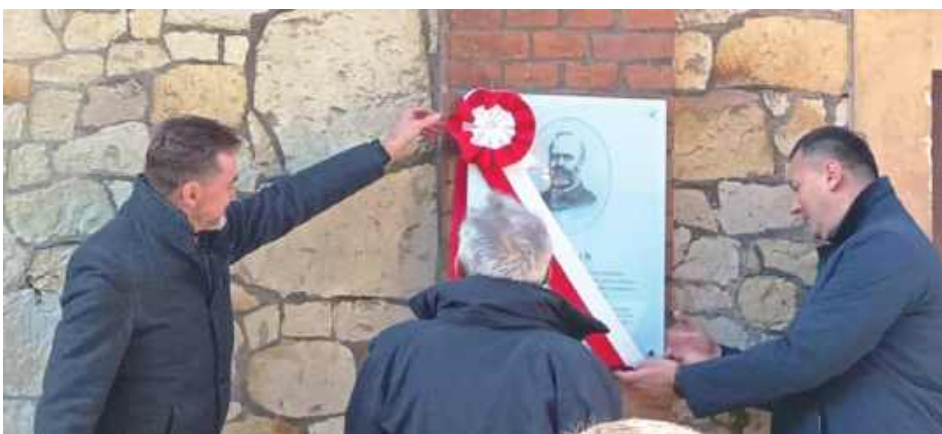
Pierwszą tablicę odsłonięto na budynku dawnej szkoły przy ul. Spółdzielczej

W czwartek, 13 listopada w Nałęczowie odbyły się uroczystości upamiętniające 120. rocznicę powstania Szkoły Instruktorów Zabawkarstwa im. Jana Blocha - pierwszej tego typu placówki w Polsce i jednej z najważniejszych inicjatyw edukacyjnych przełomu XIX i XX wieku. Podczas wydarzenia uroczystie odsłonięto dwie tablice pamiątkowe poświęcone Janowi Blochowi, wybitnemu przemysłowcowi, finansistce i filantropowi, którego wizja