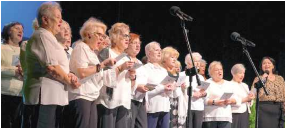
Jubileusz 35-lecia MOPS w Puławach swoim występem uświetnili m.in. seniorzy z Dziennego Domu Pomocy Społecznej

Z okazji jubileuszu Miejskiego Ośrodka Pomocy Społecznej w Puławach zorganizowano uroczystą galę. Były wspomnienia, podziękowania i życzenia oraz debata na temat roli pomocy społecznej i wyzwań, jakie stoją przed tą instytucją.