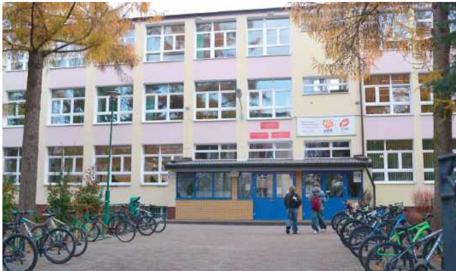
Jak informuje Urząd Miasta w Puławach, aktualnie z ZSO nr 2, którego częścią jest SP 5 funkcjonuje 9 oddziałów szkoły podstawowej i 20 oddziałów liceum. Po zmianach proponowanych przez władze miasta ogólniaki miałyby dalej działać

O tym, że sieć gminnych szkół i przedszkoli w Puławach potrzebuje reorganizacji mówili już od dawna. Przemawiają za tym nie tylko koszty - ponad połowa miejskiego budżetu to wydatki na oświatę - ale i demografia - w mieście rodzi się coraz mniej dzieci. Potwierdzeniem tej tendencji jest chociażby fakt, że w tym roku szkolnym w miejskich przedszkolach utworzono 6 oddziałów przedszkolnych mniej, niż pierwotnie planowano. Reforma miejskiej oświaty to niełatwe zadanie, dlatego władze miasta sięgnęły po opinię specjalistów - zamówiły zewnętrzny audyt, którego autorzy wskazali możliwe rozwiązania. W ich ocenie wyjściem z sytuacji, które obniżyłoby koszty funkcjonowania oświaty i byłoby adekwatną odpowiedzią na spadającą liczbę urodzeń, a co za tym idzie zmniejszającą się liczbę dzieci w placówkach edukacyjnych jest m. in. likwidacja Szkoły Podstawowej nr 3 i Szkoły Podstawowej nr 5 oraz przypisanie ich obwodów do SP 10 i SP 6. Zasugerowali także przekazanie liceów do prowadzenia powiatowi - miasto obecnie jest organem prowadzącym liceum w ZSO nr 1 im. KEN i w ZSO nr 2 im. F.D. Książka. Auditorzy zaproponowali również połączenie Szkoły Podstawowej nr 4 i Miejskiego Przedszkola nr 2 w Zespół Szkolno-Przedszkolny, likwidację Miejskiego Przedszkola nr 8 i Miejskiego Przedszkola nr 13, a także Szkoły