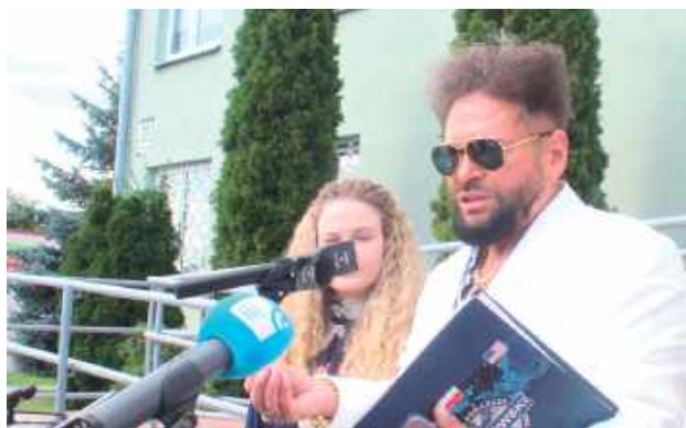
Detektyw Krzysztof Rutkowski wyjaśniał, ile pieniędzy klientów poszło na leczenie współwłaściciela firmy

Sprawa stała się głośna najpierw w lipcu 2024 r., gdy biuro słynnego detektywa Krzysztofa Rutkowskiego i Telewizja.Patriot24.net zorganizowały pod białską Komendą Miejską Policji briefing prasowy, dotyczący - jak określili - „licznych wyłudzeń dokonanych przez spółkę