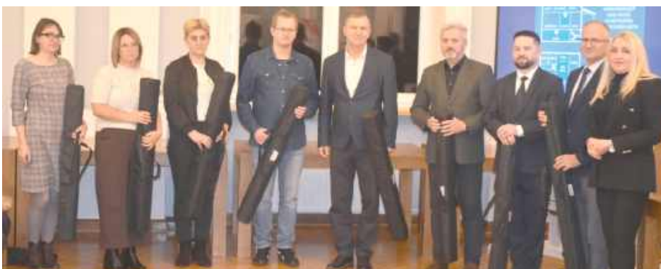
Władze gminy czy sołtysi poszczególnych wsi podczas spotkania otrzymali roll-upy informacyjne, a także czujki czadu i plakaty informujące mieszkańców o zagrożeniu, jakie niesie ten bezwonny gaz

Bezpieczeństwu w sezonie grzewczym oraz profilaktyce zatruc tlenkiem węgla poświęcone było spotkanie informacyjno-prewencyjne pt. „Czad – cichy zabójca”, zorganizowane przez władze powiatu i Komendę Powiatową Państwowej Straży Pożarnej wraz z partnerami w puławskim starostwie. Do uczestników wydarzenia trafiły czujki czadu.