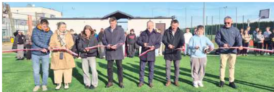
Modernizacja „Orlika” przy Szkole Podstawowej im. Adama Mickiewicza w Żyrzynie trwała kilka tygodni. Obiekt jest już ponownie dostępny od 13 listopada

Po wielu tygodniach prace nad obiektem przy Szkole Podstawowej im. Adama Mickiewicza w Żyrzynie zostały ukończone. Oficjalnego otwarcia dokonano w połowie listopada w obecności władz gminy, radnych, dyrekcji placówki oraz uczniów.