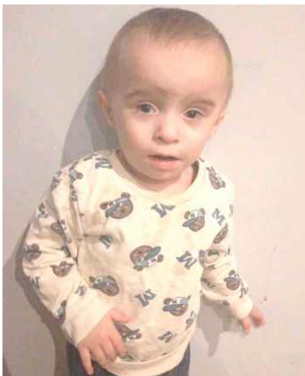
Każda złotówka to realne wsparcie dla chłopca, który od pierwszego oddechu walczy o życie

W tym właśnie czasie społeczność Poniatowej pokazała, jak wiele potrafi zrobić dla jednego ze swoich najmłodszych mieszkańców. W miniony poniedziałek w obu budynkach Szkoły Podstawowej odbył się wyjątkowy kier-