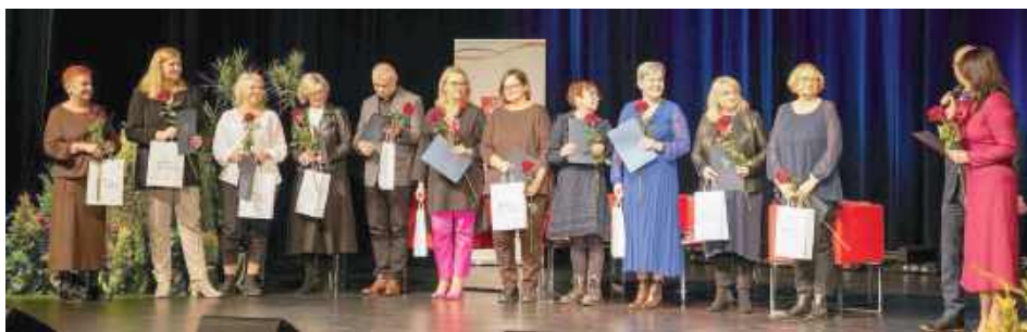
Gala jubileuszowa zorganizowana w POK „Dom Chemika” była okazją do wyróżnienia wieloletnich pracowników

Wkrótce, zgodnie z ustawowymi wymogami, kadra zaczęła się powiększać – już w 1991 r. MOPS zatrudnił