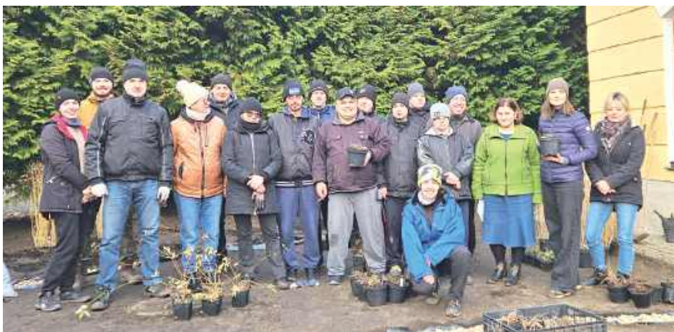
Chętnych do udziału w ekologicznym przedsięwzięciu nie brakowało!

W Parku Zdrojowym powstał pierwszy w okolicy Miejski Ogród Deszczowy - projekt zrealizowany przez Nestlé Waters & Premium Beverages, Fundację Hydroni oraz Gminę Nałęczów. To zarówno zielona przestrzeń do wypoczynku, ale i ważna inwestycja w lokalne zasoby wodne.