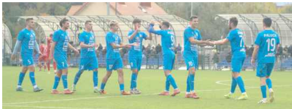
Lubartowianie są wiceliderem IV ligi. Wiosną chcą przegonić zamojski Hetman