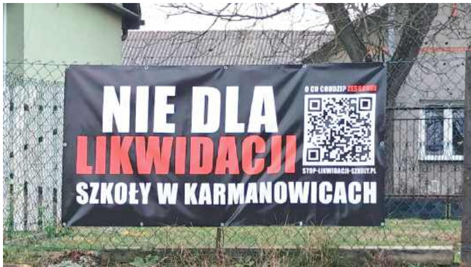
W tym roku szkolnym w SP w Karmanowicach uczy się 62 uczniów w klasach 1-8 oraz 20 dzieci w oddziale zerowym.

Rodzice uczniów Szkoły Podstawowej w Karmanowicach, mieszkańcy miejscowości i sympatycy placówki zawiązali komitet obrony szkoły. Założyli nawet internetową zbiórkę na pokrycie kosztów pomocy prawnej. Wszystko to, by przekonać władze gminy do zmiany decyzji w sprawie przekształcenia placówki z ośmioklasowej na trzyklasową. To zdaniem rodziców prosta droga do likwidacji.