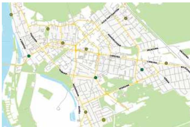
Na osiedlu Włostowice znajdują się dwa czujniki jakości powietrza - przy ul. Kilińskiego oraz przy ul. Zabłockiego