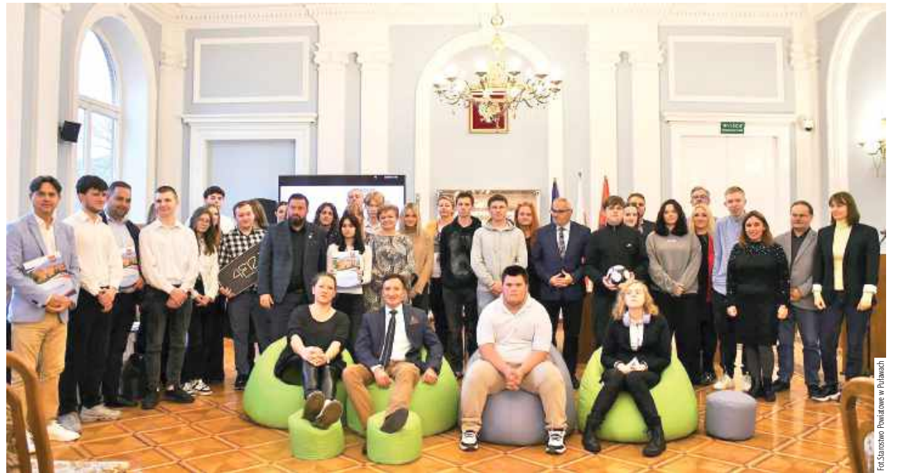
W tegorocznej edycji Szkolnych Budżetów Obywatelskich wzięło udział 13 placówek, dla których organem prowadzącym jest Powiat Puławski

13 placówek, dla których organem prowadzącym jest Powiat Puławski, wzięło udział w tegorocznej edycji Szkolnych Budżetów Obywatelskich. Przyznane środki uczniowie przeznaczili m.in. na wyposażenie pracowni, strefy relaksu czy odświeżenie szatni.