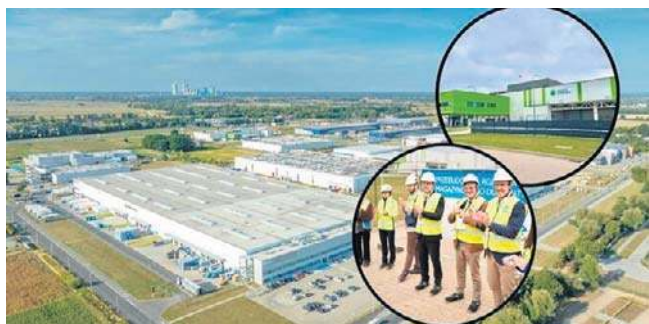
To kolejna inwestycja w strefie ekonomicznej w Opolu.

Nowa inwestycja prowadzona jest w hali po chińskiej firmie Hongbo Clean Energy, która od wiosny 2017 roku produkowała tam oświetlenie LED, a w czasie pandemii Covid-19 również maseczki. Trzy lata później zaczęły się jednak problemy,