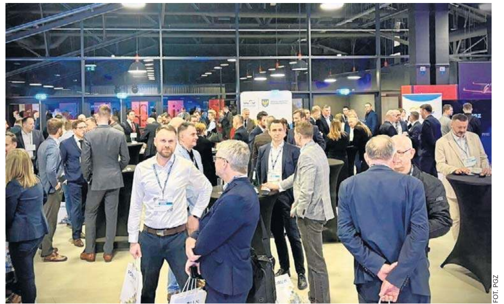
Już teraz w regionalnym programie operacyjnym jest około 100 mln zł na rozwój technologii tzw. podwójnego zastosowania (cywilnego i wojskowego).

- Nie chodzi tylko o sam klastę, ale także o spotkanie z przedsiębiorcami z województwa opolskiego. Chcemy rozmawiać o współpracy biznesowej i o wspólnym udziale w budowaniu polskiego bezpieczeństwa poprzez przemysł zbrojeniowy -