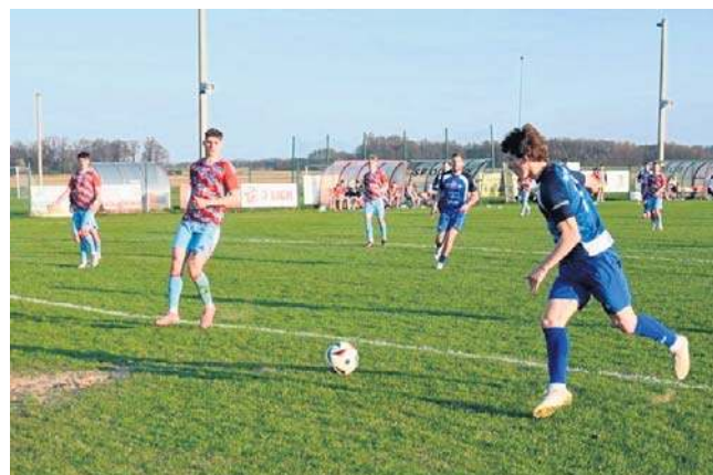
MKS Kluczbork odniósł wysokie zwycięstwo w derbowej konfrontacji z LZS-em Starowice Dolne