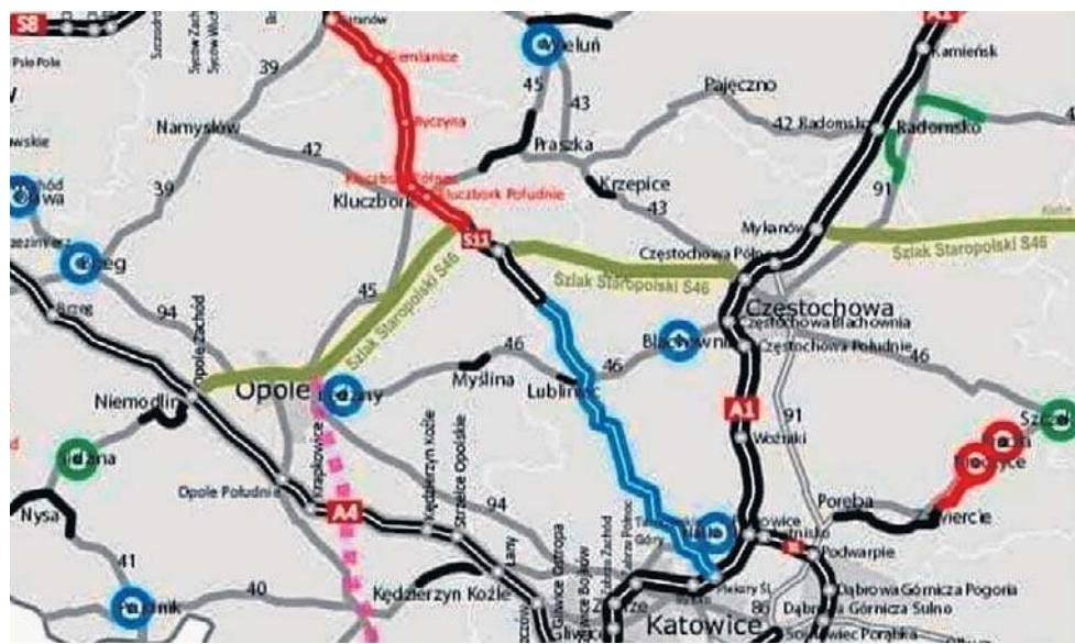
Tak ma wyglądać opolski odcinek Szlaku Staropolskiego, czyli drogi ekspresowej S46.

Dodatkowy węzeł nowej trasy ekspresowej S46 miałby