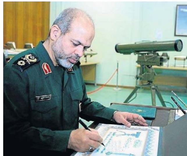
Generał Vahidi, dowódca Korpusu Strażników Rewolucji Islamskiej, rządzi dziś de facto Iranem

Media powiązane z IRGC ogłosiły również w sobotę, że Iran nie zgodził się na udział w kolejnej rundzie negocjacji ze Stanami Zjednoczonymi z powodu „nadmiernych” żądań USA.