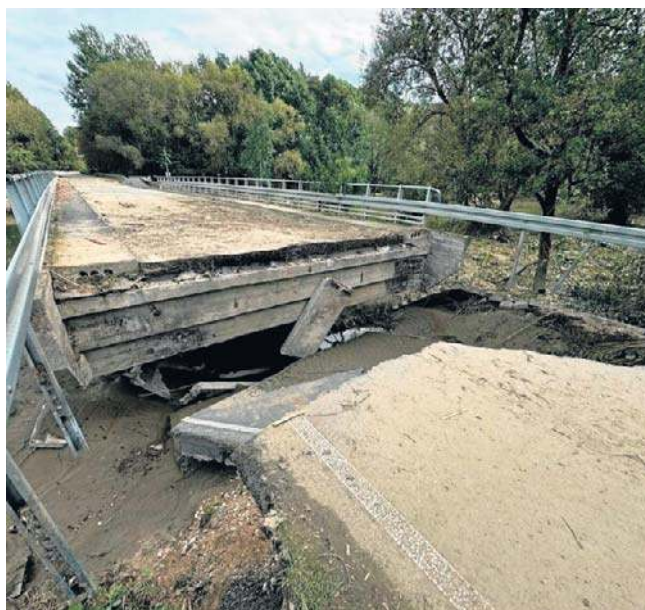
Radny Sławomir Siwy pyta wprost, czy powiat byłby gotów partycypować w kosztach budowy kładki.

- Idzie jak po grudzie i uciekają kolejne miesiące, więc stawiamy ostateczne pytanie do starosty w sprawie kładki tymczasowej na rzece Biała Głuchołaska w okolicach zburzonego mostu