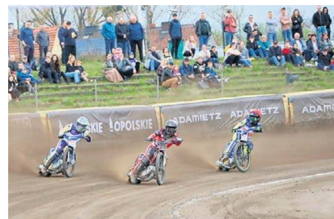
Żużlowcy Kolejarza Opole rozczarowali i nieudanie przywitani się z własną publicznością w sezonie 2026