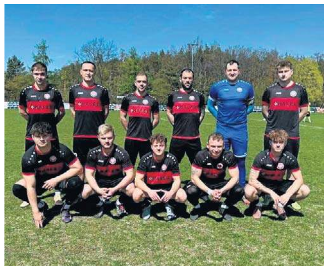
KS Krasiejów odniósł efektowne zwycięstwo w Jemielnicy. Zaaplikował swojemu przeciwnikowi aż pięć bramek

Piłka nożna Podsumowanie 19. kolejki BS Leśnica 4 Ligi Opolskiej