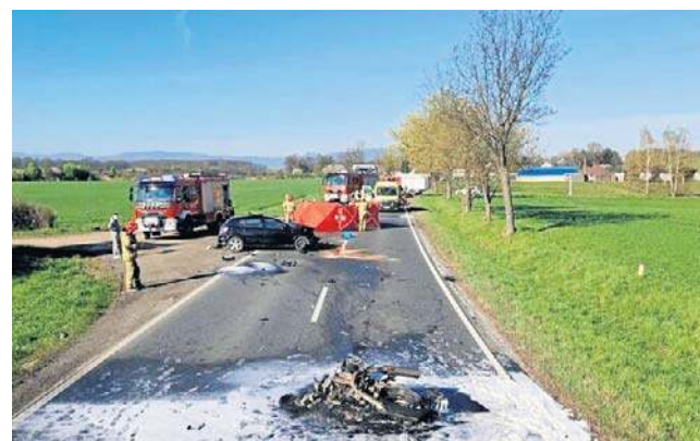
Dokładne przyczyny oraz przebieg wypadku są ustalane przez policjantów pod nadzorem prokuratora.

Zgłoszenie o tym zdarzeniu wpłynęło do służb ratunkowych o godzinie 8:20. Jak wynikało z pierwszych informacji, doszło do zderzenia samochodu osobowego i motocykla. Drugi z pojazdów w wyniku