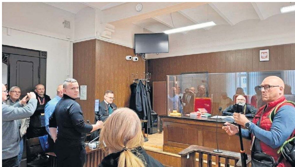
- Takie wypowiedzi są niedopuszczalne - komentuje dziekan warszawskich adwokatów.

Świat: Strzały w cieśninie Ormuz. Rozmowy irańsko-amerykańskie zamrożone str. 8