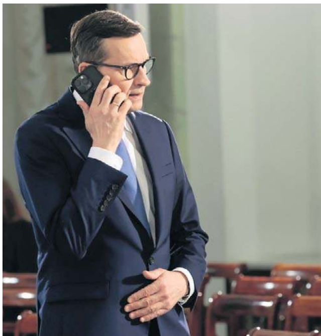
Telefon Mateusza Morawieckiego przed startem jego ruchu rozgrzewał się do czerwoności