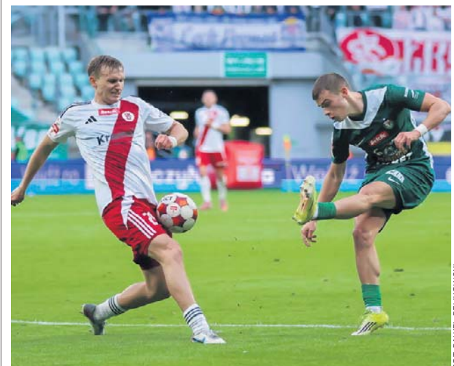
Piłkarze Wieczystej Kraków, Polonii Warszawa, Chrobrego Głogów i ŁKS-u Łódź zawalczą w barażach

Wieczysta Kraków - Polonia Warszawa 28 maja (czwartek), godz. 20.30. ©©