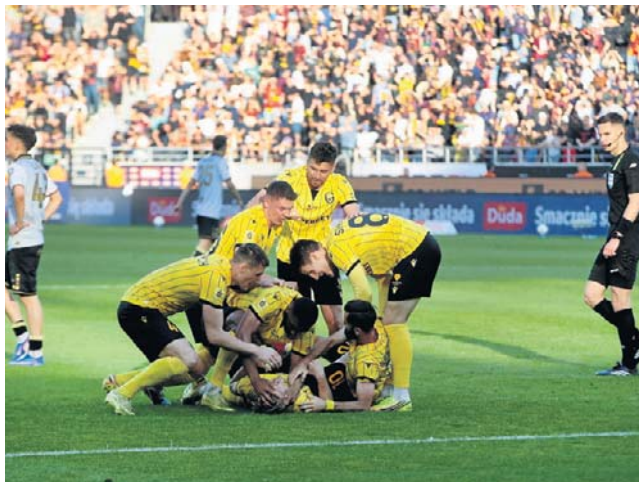
Radość piłkarzy GKS Katowice w Szczecinie była w pełni uzasadniona. Po 25 latach klub wraca do Europy