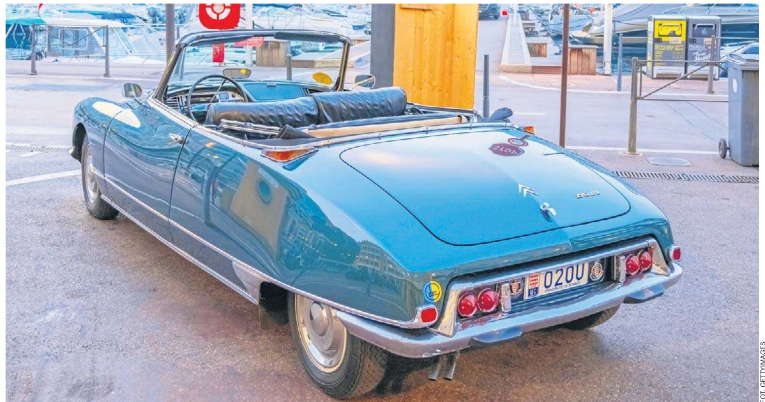
Zaparkowany w porcie w Monako Citroën DS Decapotable, ekskluzywna wersja kabrio produkowana przez firmę Henri Chapron. Powstało jedynie 1400 egzemplarzy, co czyni go jednym z najrzadszych i najbardziej pożądanych Citroënów

Na użytek sportu fabryka stworzyła własne, dwudrzwiowe coupé. Z kolei Michelin zbudował w 1972 r. 10-kołowe monstrum PLR, będące ruchomym laboratorium do testowania opon do ciężarówek przy dużych prędkościach. Napędzane było dwoma amerykańskimi silnikami V8 z Chevroleta i przy wadze 10 t osiągało 180 km/h.