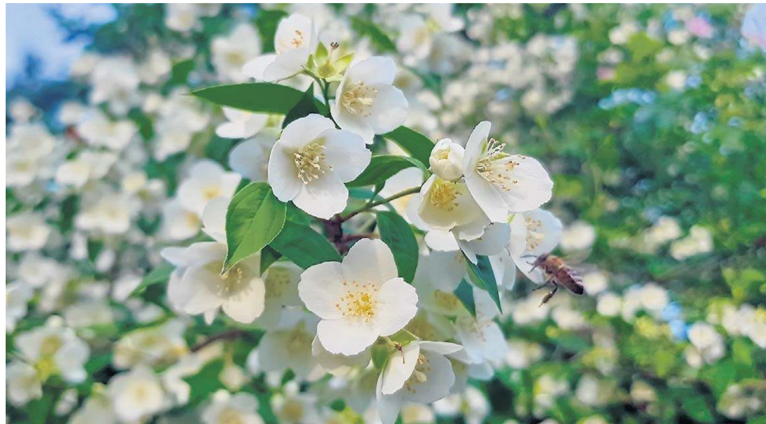
Jaśminowiec to klasyczny krzew ozdobny, który od pokoleń zachwyca ogrodników intensywnie pachnącymi kwiatami, odpornością oraz niewielkimi wymaganiami

Aromatem jaśminowca można cieszyć się dłużej niż tylko w okresie kwitnienia krzewów. Warto je zbierać i suszyć, bo mają pewne właściwości lecznicze. Można z nich przygotować m.in. pachnący napar, który pomoże w wielu dolegliwościach. Dobrym pomysłem jest też ich wykorzystanie do mieszanek zapachowych, zwanych potpourri.