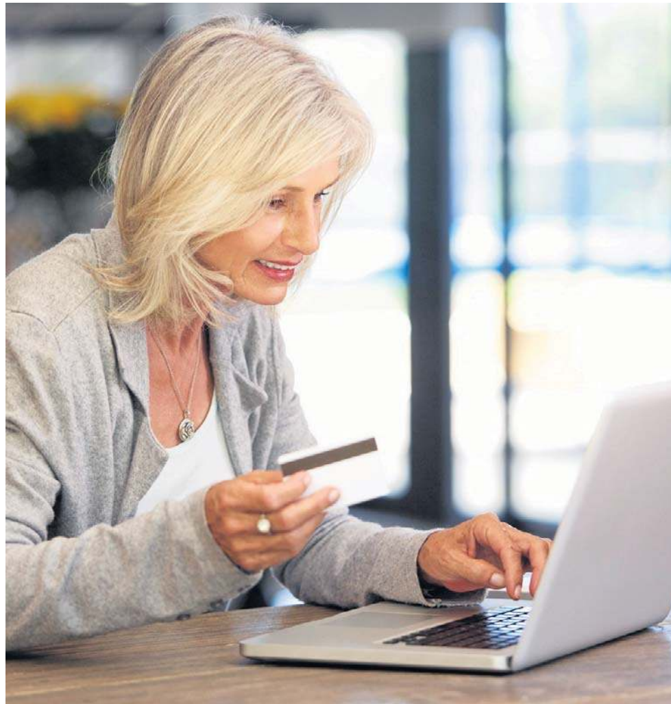
Czterech na pięciu (79 proc.) silwersów robi zakupy online samodzielnie. To najwyższy wynik spośród wszystkich badanych grup wiekowych

Prawie co trzeci (29 proc.) przedstawiciel gen Z przyznaje, że dokonał kiedyś zakupu w internecie, który okazał się oszustwem,