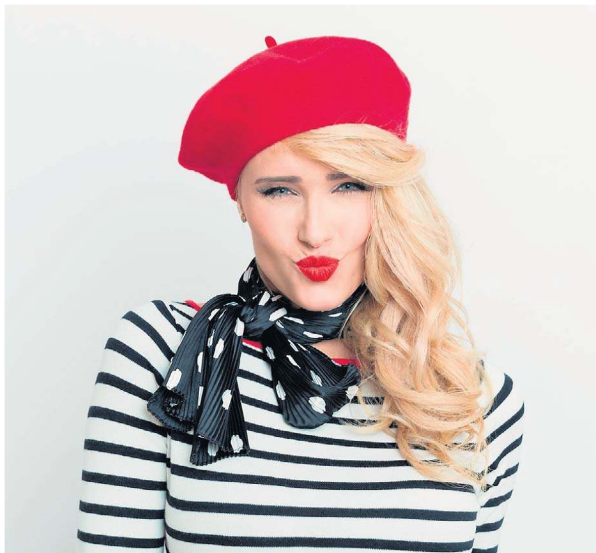
Francuski styl to nie tylko moda, to filozofia życia. Minimalizm, dbałość o jakość i subtelne detale to klucz do osiągnięcia paryskiego szyku na co dzień