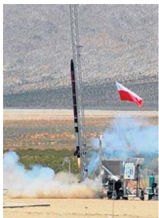
Start wrocławskiej rakietki na pustyni w Kalifornii

Wyjątkowy jest także wygląd rakietki. Projekt jej okleiny powstał we współpracy z dziećmi objętymi programem Akademia Przyszłości. Ich pomysły i rysunki zostały wykorzystane przy tworzeniu szaty graficznej konstrukcji.