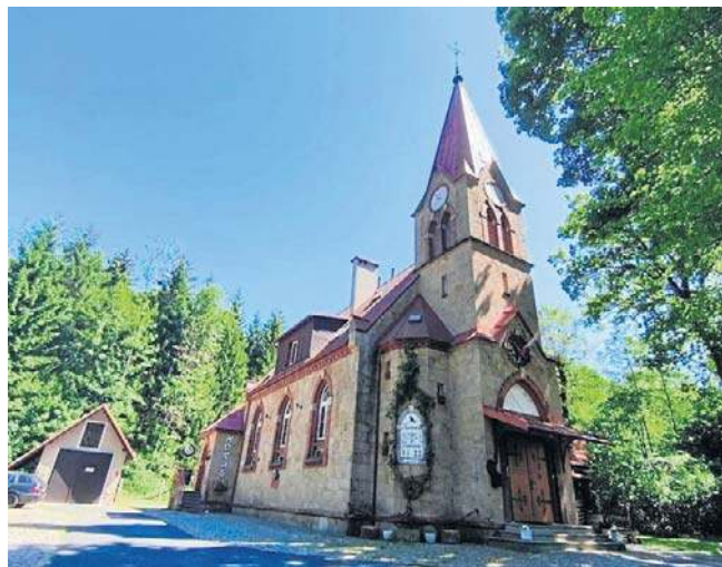
Kawiarnia Horus mieści się w dawnym XIX-wiecznym kościele ewangelickim

Dojeżdża tu kilka pociągów z Rawicza oraz Wrocławia Głównego jako że Długopole-Zdrój leży na trasie kolejowej do Międzylesia/Lichlova. Zatem z Wrocławia można tu przyjechać pociągiem bez przesiadki w mniej niż 2 h. Bardzo problematyczny jest tu dojazd kolejowy z Legnicy, Jeleniej Góry i Wałbrzycha - z przesiadką na stacji Kłodzko Miasto.