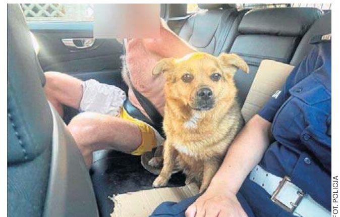
Pijany mężczyzna został zabrany do klimatyzowanego radiowozu wraz ze swoim psem

Mężczyzna odpowie za prowadzenie samochodu bez uprawnień oraz jazdę pod wpływem alkoholu.