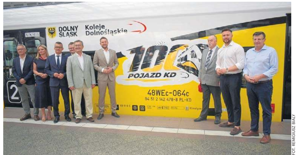
FOT. REMIGIUSZ BIAŁY

W zależności od typu składy firmy PESA mogą osiągnąć nawet 106 metrów długości. Remigiusz Biały