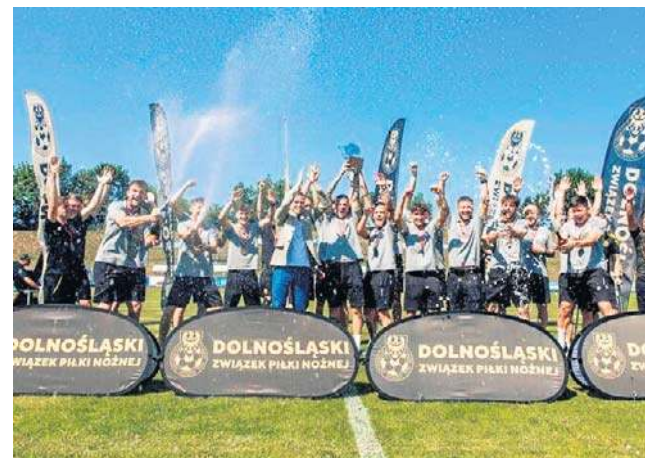
Dolny Śląsk znów został mistrzem Polski Regions Cup. W październiku uda się na turniej eliminacyjny do Turcji

W tym roku mieliśmy do czynienia z najbardziej zaciętą rywalizacją o tytuł mistrzowski w historii. W turnieju, który miał wyłonić mistrza Polski Regions Cup - organizowanych przez DZPN - wszystkie cztery zespoły zgromadziły po 4 pkt w trzech meczach i miały równy (zerowy) bilans bramkowy! Zdecydowała