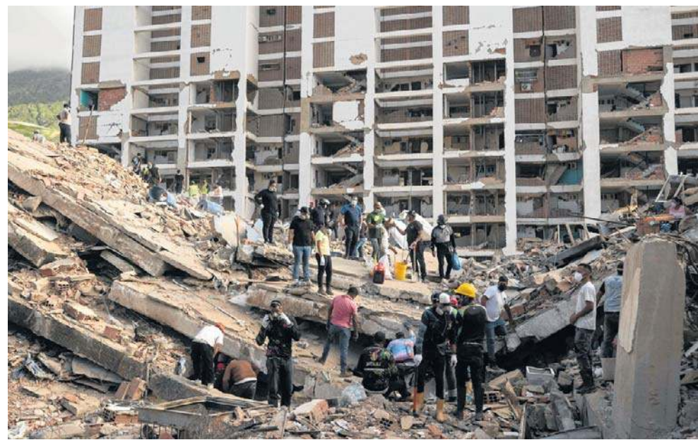
Krajowe i międzynarodowe zespoły ratownicze kontynuują swoje działania wśród ruin budynków w nadmorskim stanie La Guaira, na północ od Caracas

Prezydent Salwadoru Nayib Bukele ogłosił w nocy z poniedziałku na wtorek, że ratownicy z jego kraju zlokalizowali uwięzionego w zawalonym budynku 44-latkę, nawiązali z nim kontakt i podali mu wodę. Dodał, że ratownicy starają się wy dostać go na powierzchnię.