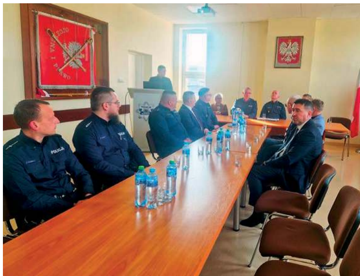
Odprawa roczna objęła szereg zagadnień, między innymi współpracę makowskiej KPP z instytucjami samorządowymi