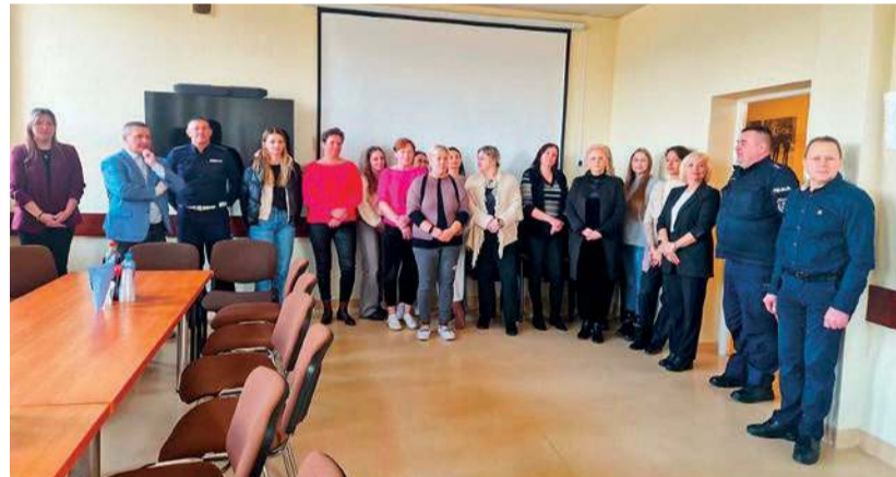
Pracownicy cywilni uhonorowani zostali prezentem w postaci przerwy urlopowej

makowskiej komendy. Jubilaci otrzymali słodki poczęstunek, zostali również wyróżnieni nagrodami urlopowymi.