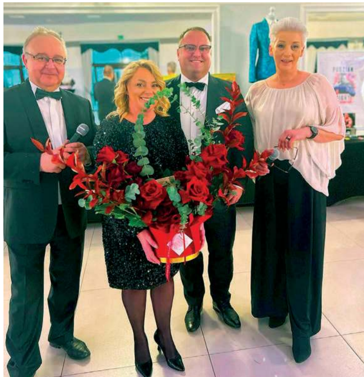
Wśród najwyższej wycytowanych przedmiotów był m.in. obraz Aleksandry Guzowskiej