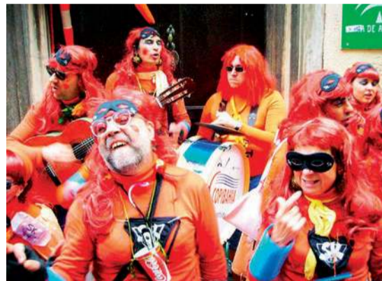
Chirigota podczas karnawału w Kadyksie

otwiera festiwal i zostaje ceremonialnie zgładzony w noc przed Środą Popielcową, by rok później znów odrodzić się z popiołów. Touloulou, królowa karnawału, to tajemnicza dama spowita