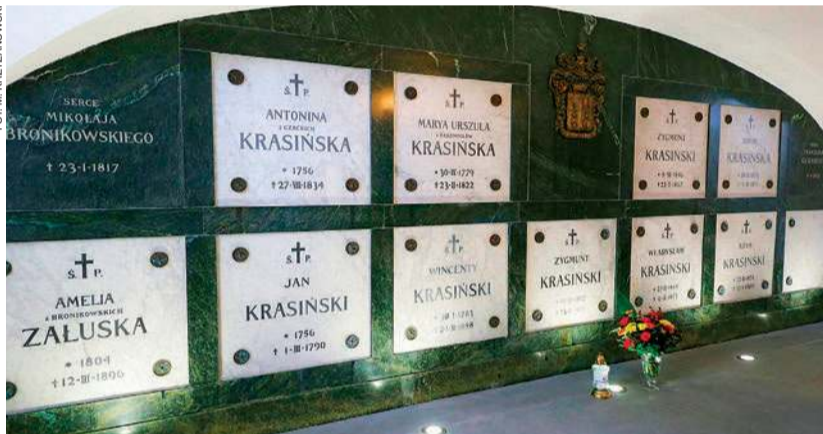
Podziemia w kryptach Krasińskich – stan obecny

w bok — i stajemy wkrótce wobec muru otaczającego park opinogórski. Roztacza się jeden z tych krajobrazów, od których odwraca się oczy z dziwnym żalem, dlatego że go opisać nie podobna. Ze wzgórze, na którym leży zamek, park w kształcie olbrzymich chmur zieloności zbiega ku stawom. Srebrne brzozy, wierzyby rzucają w wodę gałęzie, a od nich idą w różne strony aleje zapuszczone, straszne, przepiękne. Rozumiem, dlaczego Zygmunt z takim smutkiem i żalem wspominał Opinogórę w liście do Gaszyńskiego. Tu jego geniusz dziecięcy pierwszy raz spotkał się z wielką księgą piękności. Tu chodził prowadzony przez Korzeniowskiego, a bawił się na kobiercach łęk, nad brzegami stawów z Gaszyńskim. Park ten zrobił na mnie takie wrażenie jak Łazienkowski, gdy po upalnym dniu