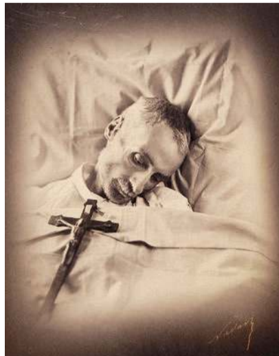
Portret pośmiertny Zygmunta Krasińskiego, 1859

„22 VIII Byłem dziś w Opinogórze. Od dawna, odkąd tu jestem, wdychałem do tej wycieczki, jak muzułmanin do zwiedzenia grobu Mahometa. [...] Zaledwie minęłyśmy Kotermań — zarysowała się wyraźniej wieżca zamczku, do którego zdążyliśmy. Na prawo leżało Przedwojewe, na lewo — Dzbonie. Wyjeżdżamy na szosę prowadzącą do Przasnysza, za Dzboniem skręcamy