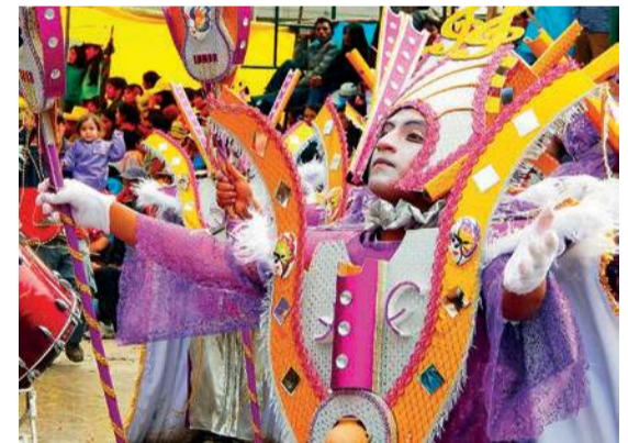
Parada karnawałowa w Peru

ulicznych i fajerwerki, wszystko jednak odbywa się w unikalnej dla Kadyksu atmosferze sarkastycznego komentarza społecznego. Kostiumy nawiązują