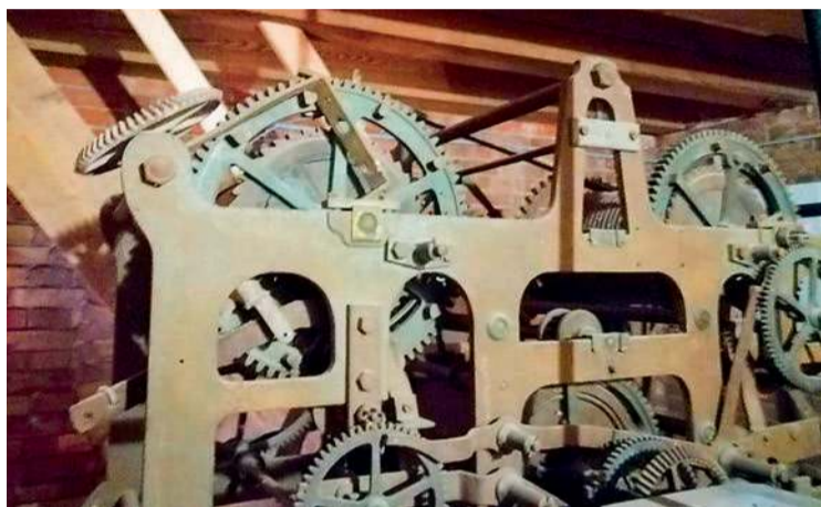
Dzwonnica została poddana gruntownej modernizacji - części mechaniczne również zostały wymienione

21 lutego br. w kościele pw. Bożego Ciała w Makowie Mazowieckim odbyła się uroczystość otwarcia świeżo wyremontowanej kościelnej dzwonnicy.