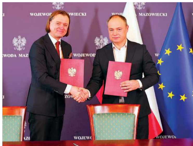
Mazowiecki Urząd Wojewódzki w Warszawie

Fundusz Rozwoju Przewozów Autobusowych to państwowy fundusz celowy, który umożliwia przywracanie lokalnych połączeń autobusowych.