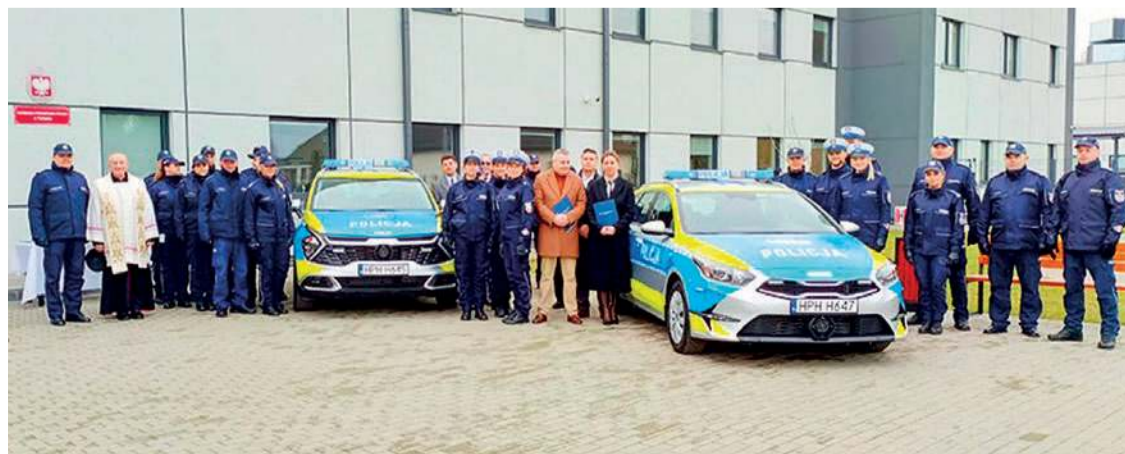
Komenda Powiatowa Policji w Pułtusku