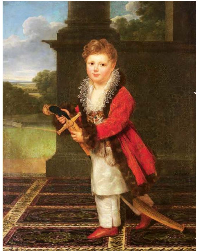
Portret Zygmunta Krasińskiego jako dziecko, Beata z Potockich Czacka, źródło: Muzeum Narodowe w Warszawie