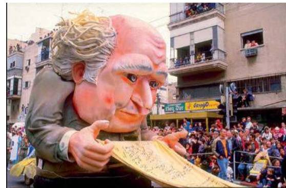
Kukła Dawida Ben-Guriona podczas święta Adlojada

w nim również olbrzymie kukły – przykładowo w 1998 roku na uroczystości gościł Dawid Ben-Gurion. Adlojada została zawieszona podczas powstania arabskiego w Palestynie i przywrócona w 1955 roku. Początkowo jednak radosna atmosfera i rozluźnienie obyczajów podczas tego specyficznego karnawału nie były w smak ultraortodoksyjnym