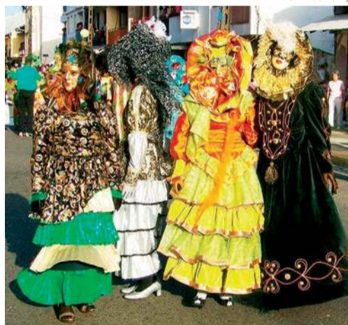
Kobiety w strojach touloulou podczas parady w Gujanie Francuskiej

Karnawał w Gujanie Francuskiej słynie przede wszystkim z charakterystycznych, archetypicznych kostiumów. Król Vaval, słomiany władca karnawału,