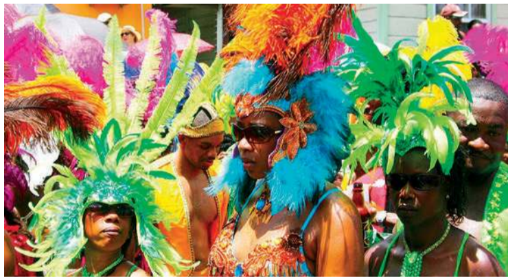
Crop Over na Barbadosie

z którego prezentuje repertuar, często będący swoistym komentarzem politycznym albo satyrą na lokalne bolączki. Uczestnicy rywalizują o szereg zaszczyt-