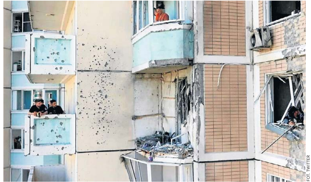
Mieszkańcy Moskwy w strachu, Ukraińcy zaatakowali stolicę Rosji dronami

„Takie operacje specjalne SBU mają kluczowe znaczenie dla osłabienia potencjału wojennego Rosji. Trafienia w przedsiębiorstwa kompleksu