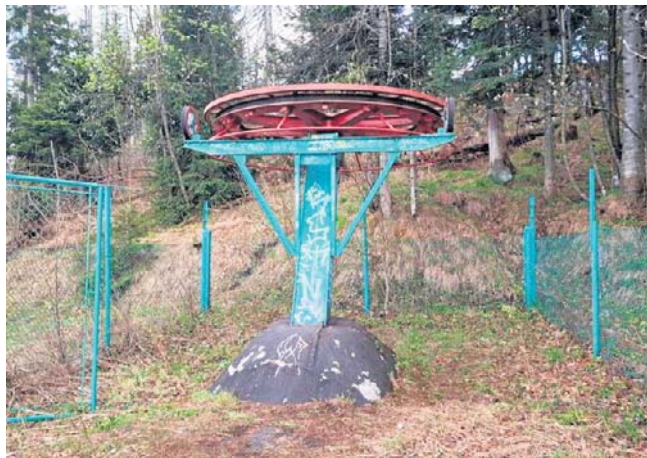
Stary wyciąg na Nosalu nadaje się na złom. Jednak nadal stoi i niszczy. Nikt nie ma odwagi podjąć decyzji

Investycja miała służyć głównie szkoleniu kadr narodowych i klubów, a amatorom udostępnić stok w przerwach między treningami. Niestety, „zielone światło” od burmistrza Zakopanego (w postaci decyzji środowiskowej) szybko zgąszczył paragrafów.