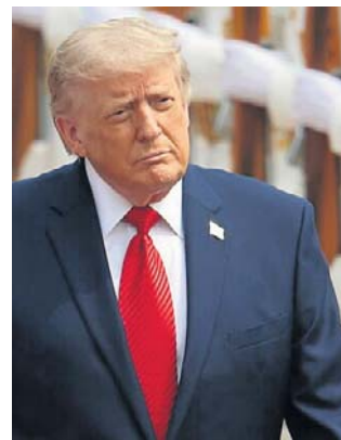
Donald Trump ma dzisiaj odbyć spotkanie na temat możliwego wznowienia ataków na Iran

Prezydent USA Donald Trump w niedzielę wezwał Iran, by szybko zawarł układ pokojowy, bo w przeciwnym razie „nic z niego nie zostanie”. „Czas ucieka Iranowi i niech lepiej się ruszą, SZYBKO, albo nic z nich nie zostanie. CZAS UCIEKA!” - napisał Donald Trump na Truth