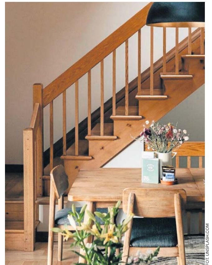
Schody coraz częściej są pełnoprawnym elementem wnętrza, a ich wygląd i typ wpływa na całość aranżacji.