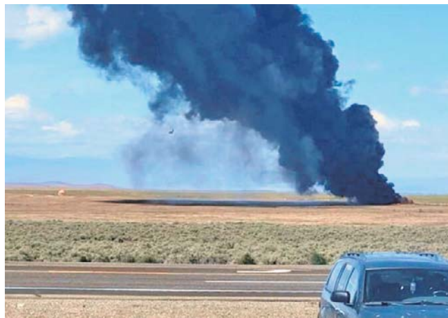
Organizatorzy lotniczego pokazu mówią o cudzie, bo nikt nie zginął po zderzeniu się dwóch samolotów

Organizatorzy podali, że pokaz lotniczy i skoki ze spadochronem poświęcono historii lotnictwa i współczesnym możliwościom wojskowym.