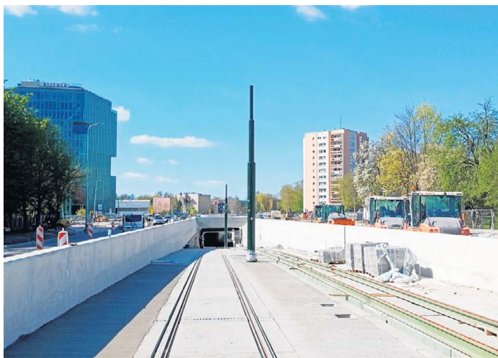
O torach pamiętali, zapomnieli tylko o prądzie. To się nadrobi. Potrzeba tylko czasu

Przypomnijmy, że budowę linii tramwajowej z ul. Meissnera do Mistrzejowic rozpoczęto w połowie 2023 roku. Zgodnie z harmonogramem