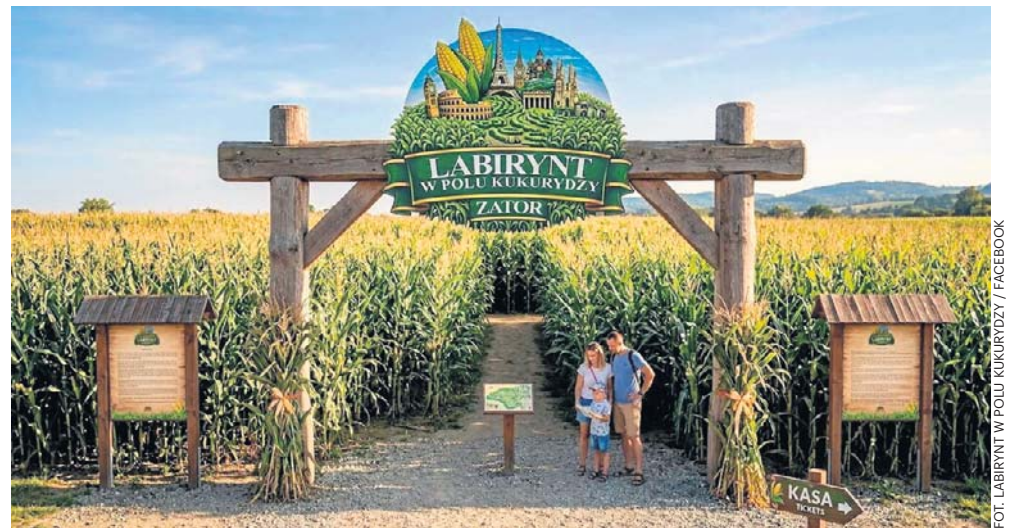
FOT. LABIRYNT W POLU KUKURYDZY / FACEBOOK

Kolejna atrakcja w małopolskim zagłębiu parków rozrywki. Pod Zatorem powstaje niezwykle pole kukurydzy. Będzie to zielony labirynt o powierzchni 3,5 hektara z mapą Europy (na zdj. wizualizacja). Otwarcie planowane jest na przełomie czerwca i lipca. Kukurydza już wzrasta i widać ścieżki. - Nasz labirynt to coś więcej niż sezonowa atrakcja. To przestrzeń z zadaniami, ciekawostkami, które angażują zarówno dzieci, jak i dorosłych - zaznacza Marcel Warmuz, menedżer przedsiębiorstwa. BOK