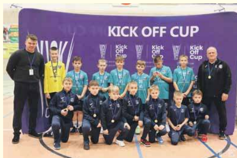
Akademia Piłki Ręcznej Świt Szaflary wystawiła w turnieju dwa zespoły.