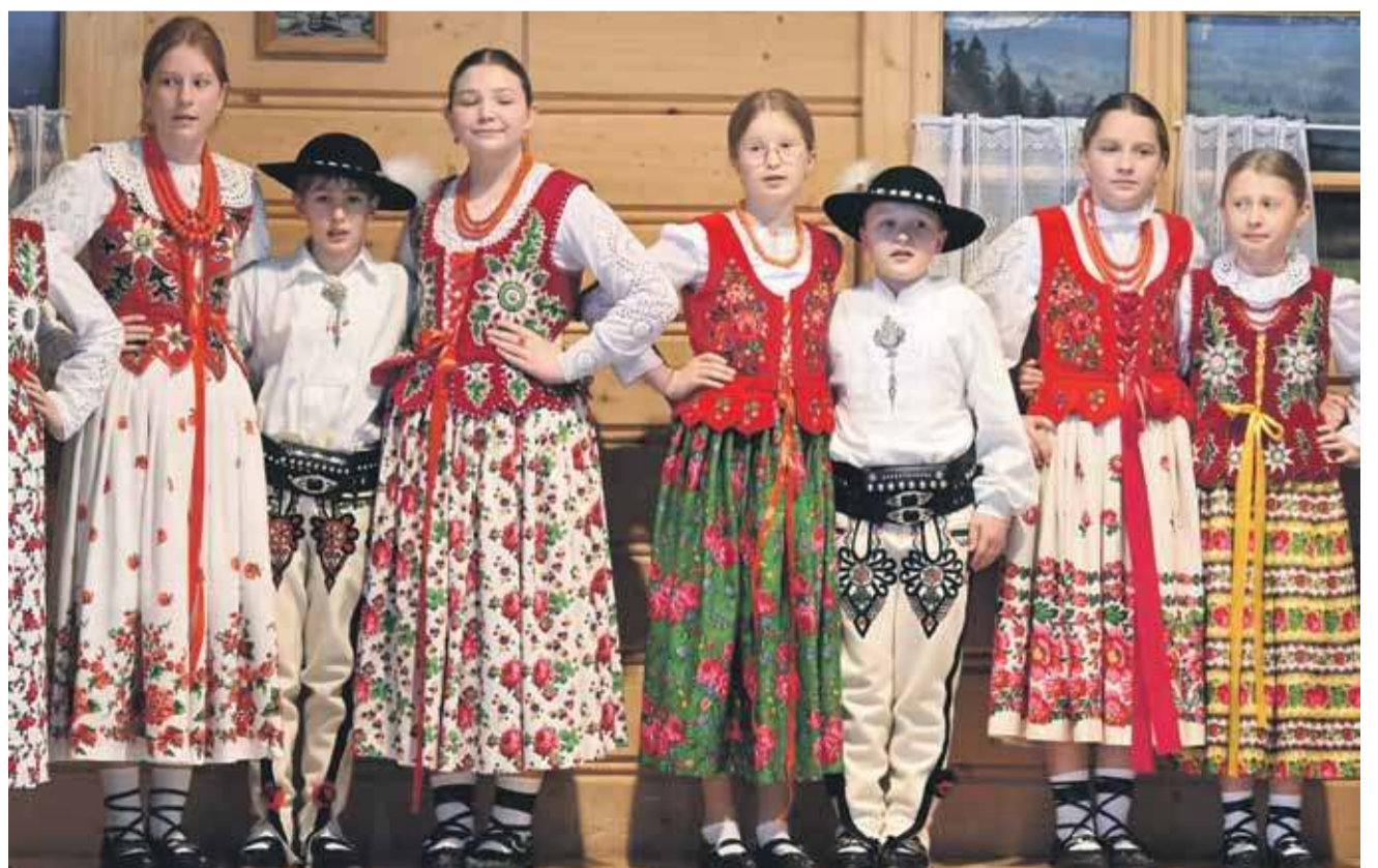
Wśród zespołów byli „Mali Miętusianie”.

Na sali widowiskowej Centrum Kultury i Promocji w Czarnym Dunajcu (głównego organizatora Przeglądu) wystąpiły zespoły: „Żeleznica” z Pie-