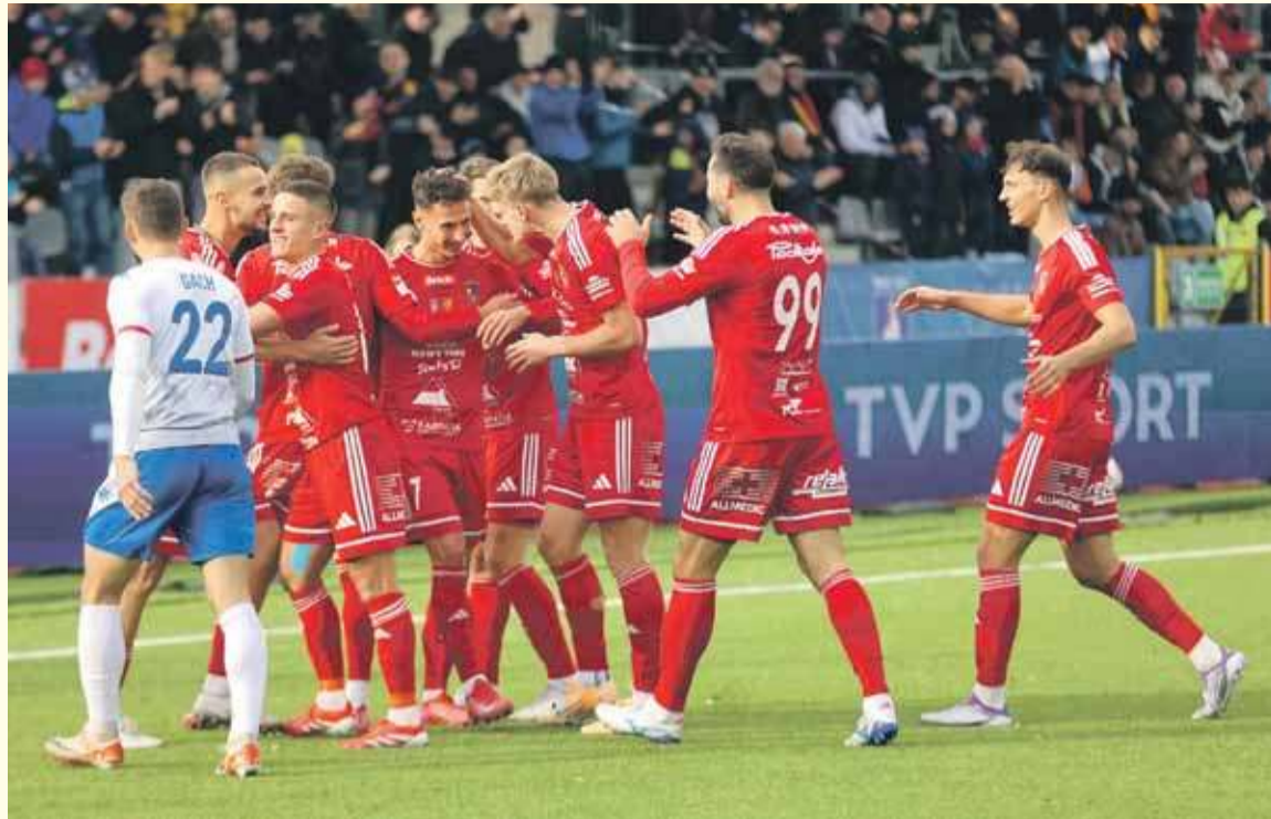
Piłkarze Podhala Nowy Targ pewnie pokonali na wyjeździe GKS Jastrzębie.