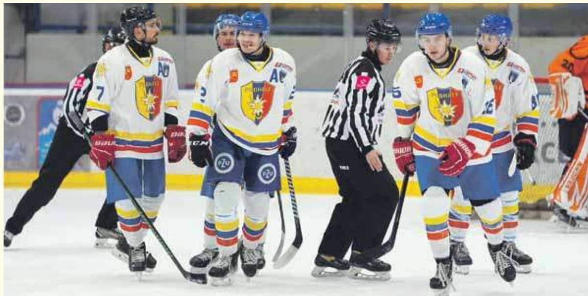
Hokeiści Podhala raz wygrali, a raz przegrali z drużyną z Opolą.