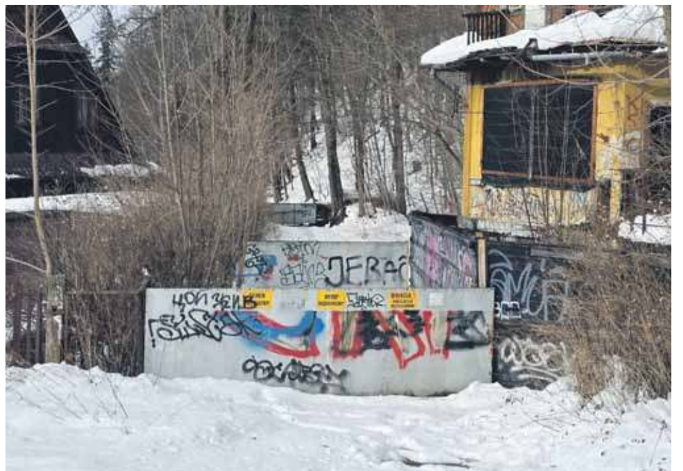
Przejście przez Bulwary Słowackiego zostało zamknięte w maju.