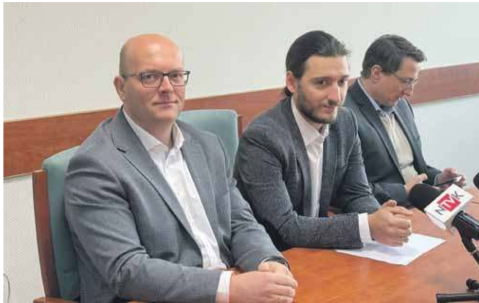
Konferencja prasowa z udziałem liderów koalicji rządzącej Nowym Targiem.

Burmistrz stanowczo odpowiedział na te zarzuty, tłumacząc, że tynk został położony zgodnie z historycznym pierwotnym wzorem, który również nie był idealny. Zapowiedział jednak, że iluminacja Ratusza zostanie poprawiona tak, aby nierówności