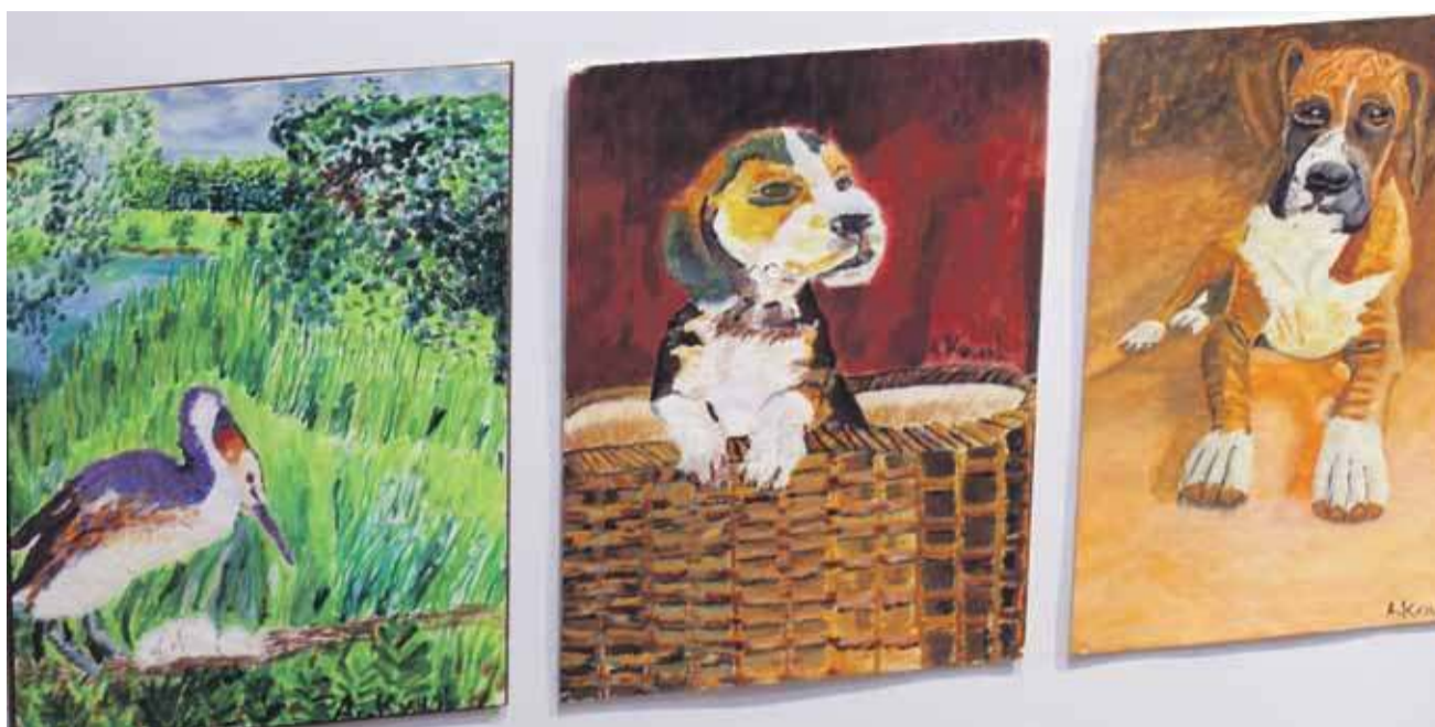
Pejzaże, architektura, piękne kwiaty, a przede wszystkim zwierzęta malowane i rysowane przez artystkę robią wrażenie.