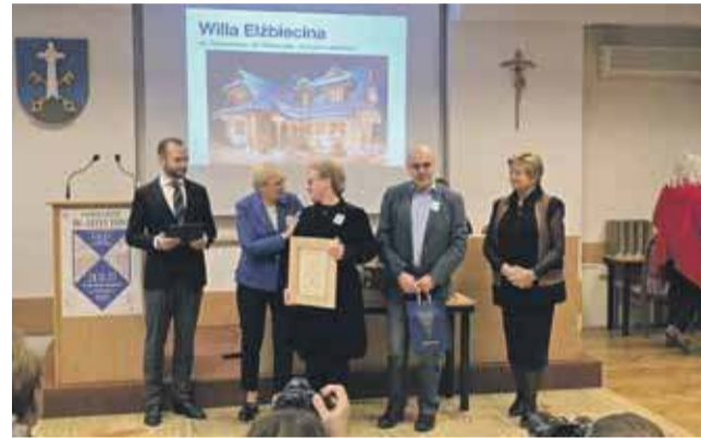
Uroczystość 40-lecia Podhalańskiego Oddziału Towarzystwa Opieki nad Zabytkami odbyła się w zakopiańskim urzędzie miasta.