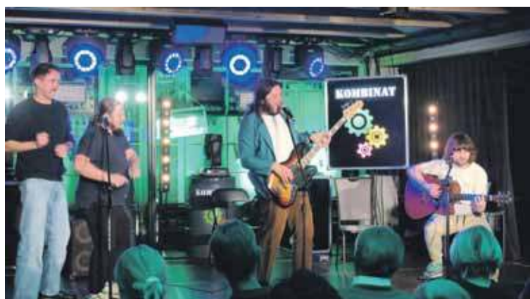
Ballada o lekkim zabarwieniu erotycznym zakończyła brawurowy występ kabaretu Śleboda w Kombinacie