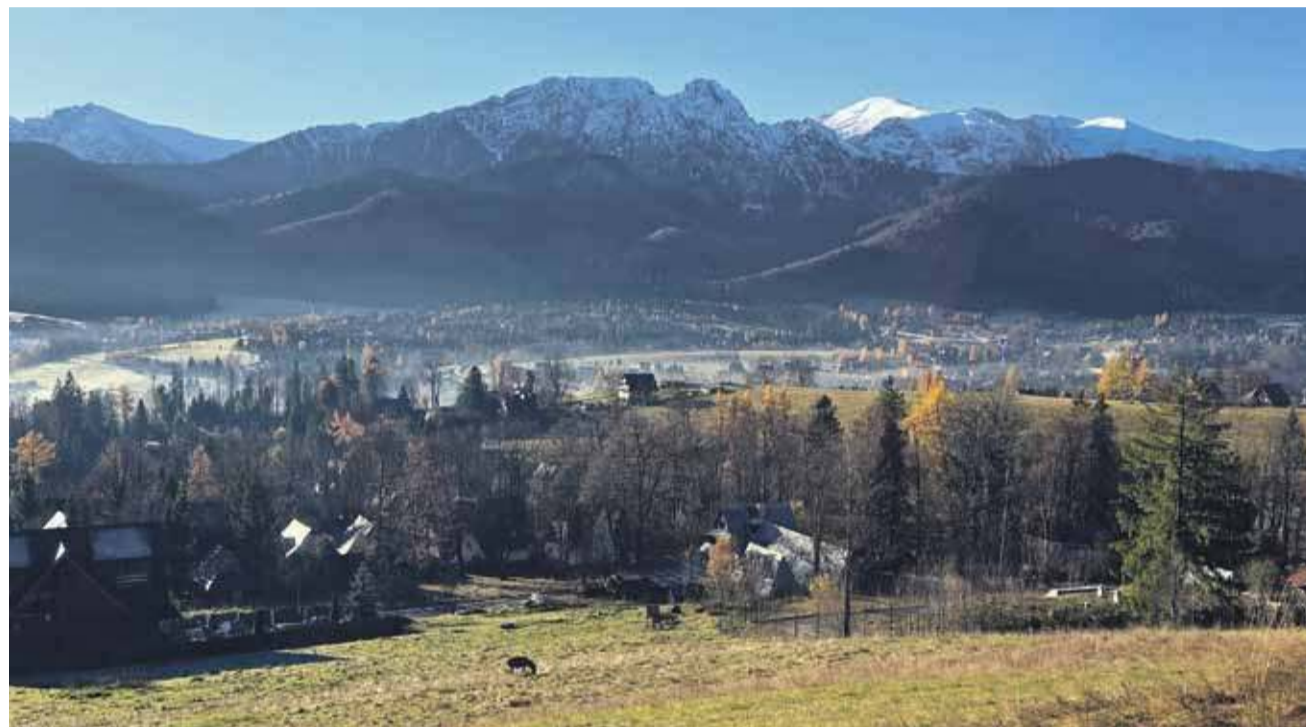
W Zakopanem coraz mniej działek do zabudowy, a mieszkańcy coraz bardziej skutecznie walczą z deweloperami.