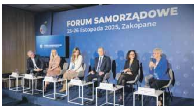
Jeden z pierwszych paneli poświęcony był zabytkom - czy warto w nie inwestować, czy też stanowią zbyt duże obciążenie dla samorządów

Tematyka konferencji poruszała najważniejsze z aktualnych wyzwań stojących przed władzami wszystkich naszych samorządów. Rozmawiano o potrzebie zapewnienia stabilności finansowej w obliczu zwiększonych nakładów na obronność. Mówiono o bezpieczeństwie mieszkańców oraz transfor-