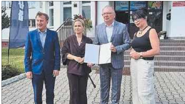
Podczas konferencji prasowej przed Szkołą Podstawową nr 9 wiceminister rolnictwa Małgorzata Gromadzka przekazała decyzję o przyznaniu ponad 500 tys. zł na remont szkolnych szatni. Środki z programu „Szatnia na Medal” trafią do trzech białskich podstawówek

– Bardzo serdecznie dziękuję prezydentowi Michałowi Litwiniukowi za aktywność na rzecz upowszechniania sportu oraz modernizacji zaplecza szatniowego. Wraz z posłem Krzysztofem Grabczukiem przyjechalśmy prosto z Ministerstwa Sportu i Turystyki, aby przekazać decyzję o przyznaniu dofinansowania. Na ten cel przeznaczono ponad 500 tys. zł, dzięki czemu młodzież i wszyscy użytkownicy zaplecza szatniowego będą mogli korzystać z lepszych warunków. Decyzję ministra sportu i tu-