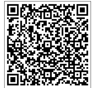
Krajobraz po burzy. Zdjęcia i nagrania po nawałnicy, która przeszła przez region

W samym Hruszniewie wiatr zerwał dach z budynku tamtejszej remizy Ochotniczej Straży Pożarnej. Krajobraz po przejściu żywiołu odnotowano także w miejscowości Mierzwnica-Kolonia oraz w popularnym lotnisku Frotów, gdzie burza, wichura i ulewa dokonały widocznych