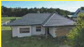
Dom do wykończenia w Woroncu, gm. Biała Podlaska, powierzchnia domu: 161,9 m 2 , powierzchnia działki 1500 m 2 , 885 851 172

Więcej ofert na: www.polnoc.pl/oddzialy/biala-podlaska/ oraz www.slowopodlasia.pl/ogloszenia