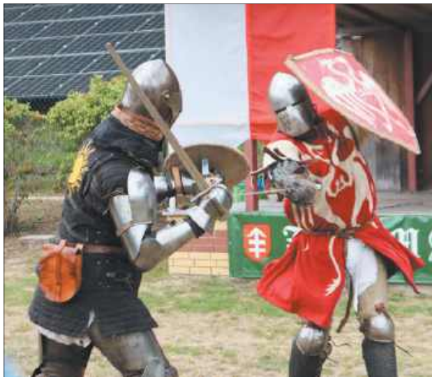
Widowiskowy pokaz walk rycerskich na kodeńskich błoniach, podczas którego rekonstruktorzy w pełnym rynsztunku przenieśli widzów w czasy świetności rodu Sapiehów

stoiska rozstawili wystawcy z całego regionu, a zapachy tradycyjnego jedzenia przyciągały tłumy. Olbrzymim zainteresowaniem cieszyło się stoisko Kofa Gospodyń Wiejskich „Zielony Zakątek” z Kątów oraz gospodyń z Kodnia, które przygotowały bogatą ofertę swojskich przysmaków. Na jarmarku można było kupić pachnący domowy chleb w różnych wariantach – od tradycyjnego żytnio-orkiszowego, przez wersje ziarniste, aż po bochenki z bakaliami. Miłośnicy tradycyjnych wyrobów chętnie zaopatrywali się też w regionalne wędliny, szynki i kiełbasy.