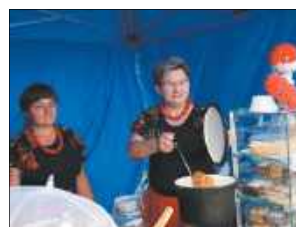
Swojskie jedzenie przygotowane przez kofa gospodyń wiejskich. Na jarmarkowych stoiskach kulinarnych królowały tradycyjne potrawy, domowe przetwory i regionalne smaki

Równie bogato prezentowała się strefa rzemiosła. Odwiedzający chętnie oglądali i kupowali ludowe