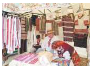
Bogactwo tradycji pogranicza na wyciągnięcie ręki. Regionalne stroje i ludowe ubrania prezentowane na jednym ze stoisk rzemieślniczych