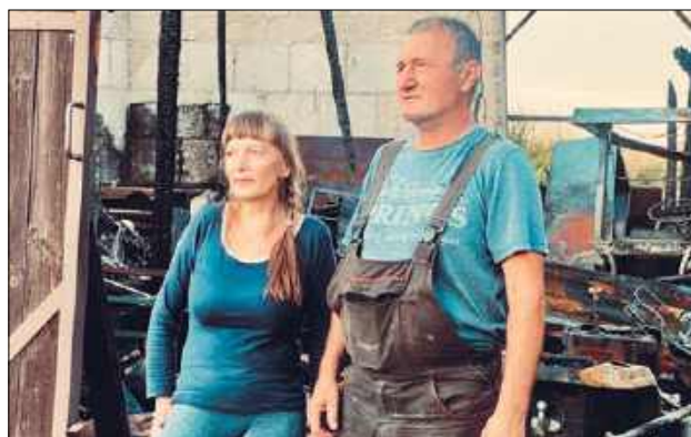
Właściciele pizzerii za pośrednictwem mediów społecznościowych wyrazili ogromne wzruszenie falą solidarności, jaka ich spotkała. Podziękowali za każde dobre słowo, telefony i wiadomości, które dają im siłę do dalszego działania w tych trudnych chwilach.

Na miejsce katastrofy natychmiast skierowano liczne zastępy Państwowej Straży