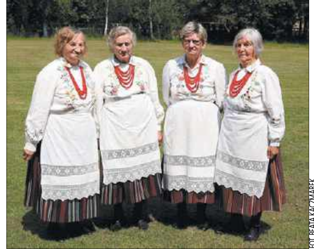
Zespół „Lewkowianie” prezentuje pieśni w języku polskim i gwarze podlaskiej