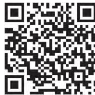
Reportaż TVP 3 Lublin „Wesele Podlaskie – Renesans”