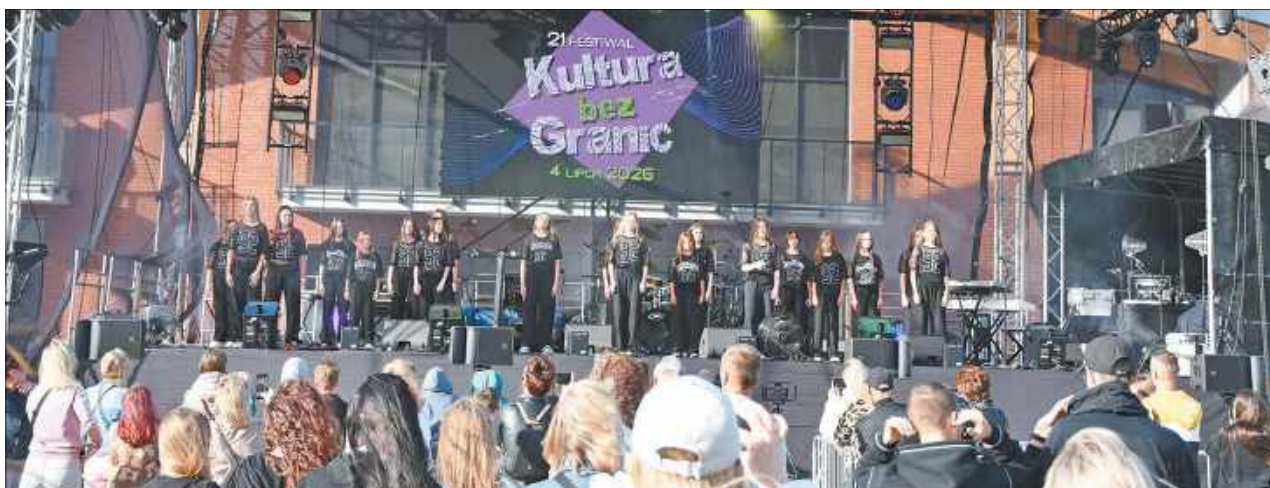
Festiwal Kultura bez Granic co roku przyciąga miłośników rozrywki na najwyższym poziomie

– Nowy obiekt Gminnego Centrum Kultury w Kobylanach spełnił, a nawet przerósł najsmielsze oczeki-