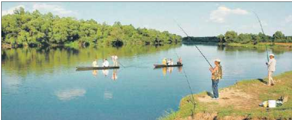
Niewykluczone, że z „Lubelskiego czeku turystycznego” będzie można skorzystać jeszcze w lipcu

Za ciosem poszedł wówczas radny województwa lubelskiego, Wojciech Sosnowski. W maju 2025 roku radny sejmiku lubelskiego wystosował interpelację do marszałka Lubelszczyzny w sprawie pilnego wdrożenia regionalnego bonu turystycznego. Podkreślał,