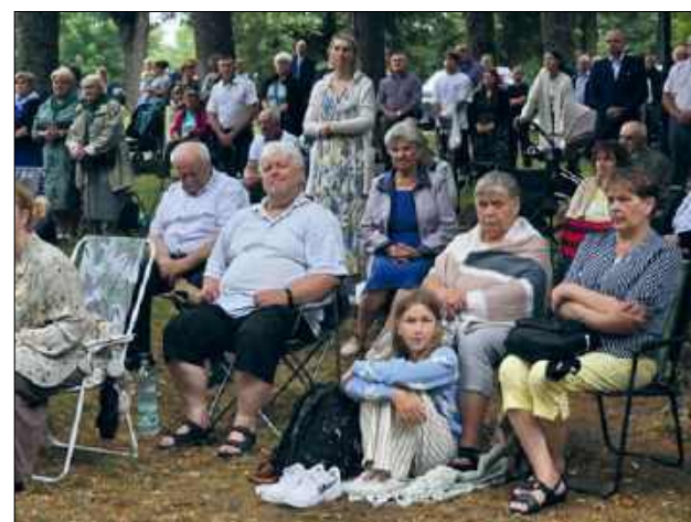
Pielgrzymi przyjechali po to, aby modlić się o umocnienie

Dla wielu przyjazd przed oblicze Matki Bożej Kodeńskiej to wieloletnia tradycja