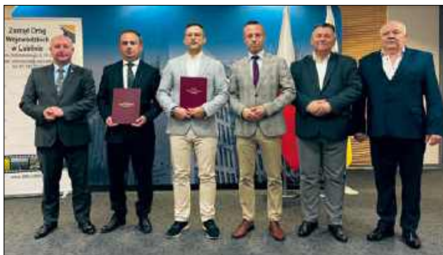
Podczas spotkania podpisano umowy na prace na odcinkach DW: 698 (pow. bialski), 816 (pow. włodawski) i 853 (pow. biłgorajski).

– Kontynuujemy ofensywę drogową na Lubelszczyźnie. Dziś kierujemy do realizacji trzy ważne zadania obejmujące łącznie prawie 11 kilometrów tras.