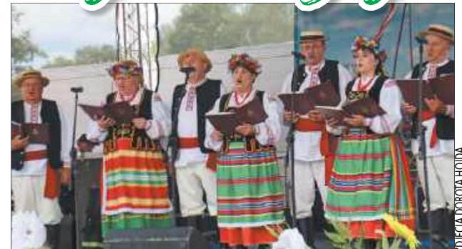
Scenę otworzyły prezentacje rodzimego folkloru w wykonaniu zespołów ludowych „Jarzębina” z Zabłocia oraz „Kalina” z Kostomłot

ubrania, tradycyjne stroje regionalne oraz kunsztowne rzeźby w drewnie. Na stoiskach artystycznych królowała autorska biżuteria, ręcznie tkane chusty, obrazy oraz inne wyroby mocno inspirowane lokalnym dziedzictwem pogranicza. Wszystko to w ramach Gminnego Konkursu Rękodzielniczego, którego laureatów nagrodzono oficjalnie ze sceny.