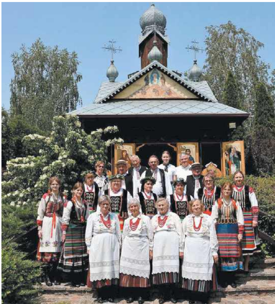
Zdjęcie z nagrania reportażu o Weselu Podlaskim w Kostomłotach