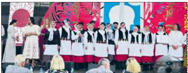
Wśród laureatów, którzy wywalczyli miejsca na podium w tej niezwykle wyrównanej rywalizacji, znalazł się zespół śpiewaczy „Wrzos” z Kąkolewnicy (powiat radzyński), który wyjechał z Kazimierza z I nagrodą w kategorii „zespoły śpiewacze”

KĄKOLEWNICA Za nami jubileuszowa, 60. edycja Ogólnopolskiego Festiwalu Kapel i Śpiewaków Ludowych w Kazimierzu Dolnym nad Wisłą, jedno z najważniejszych wydarzeń dedykowanych tradycyjnej kulturze ludowej w Polsce. Miasto stało się stolicą polskiego folkloru. Wśród blisko 600 artystów z 14 województw, którzy zaprezentowali swoją twórczość na festiwalowych scenach, znaleźli się reprezentanci naszych powiatów: bialskiego i radzyńskiego. Zespoły „Wrzos” i „Drelowskie Kukaweczki” wróciły z prestiżowymi nagrodami.