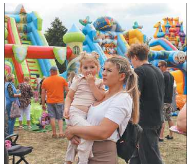
Kolorowe dmuchańce zapewniły dzieciom mnóstwo aktywnej zabawy na świeżym powietrzu

Prawdziwą muzyczną podróż w nowoczesne, pop-folkowe klimaty zaszerwował znany i ceniony zespół Guzowianki. Wieczorny blok rozrywkowy należał już do brzmień tanecznych. Publiczność do czerwoności rozgrzała formacja Maxx Dance, a gwiazdą tegorocznego wieczoru był Norbi, który przypomniał swoje największe ogólnopolskie hity. Wspólne świętowanie zakończyła tradycyjna zabawa pod chmurką, którą do późnych godzin nocnych poprowadził DJ Sawa.