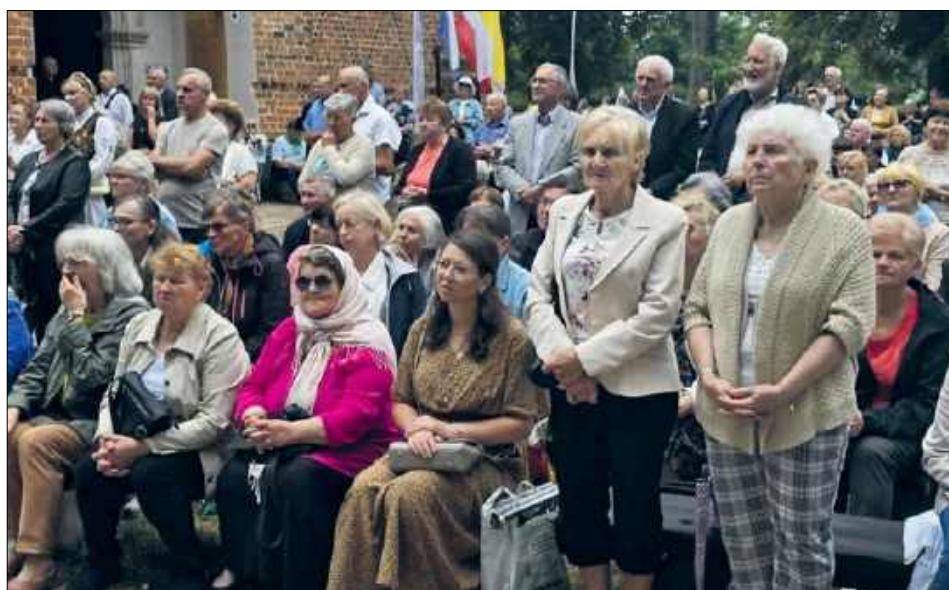
2 lipca do Kodnia zjechały setki pielgrzymów

Dla przybywających tu wiernych Kodeń to miejsce szczególne – to tutaj bije duchowe serce Podlasia. Niezwykła moc tego sanktuarium nierozdzielnie wiąże się z historią Cudownego Obrazu Matki Bożej Kodeńskiej (znanej też jako Matka Boża Gregoriańska lub z Guadalupe). Według historycznych przekazów, w XVII wieku obraz został zuchwale wykradzony z papieskiej kaplicy w Rzymie przez Mikołaja Sapiechę, zwanego Pobożnym. Magnat, hipnotyzujący urzeczony obliczem Maryi, doznał przed nim cudow-