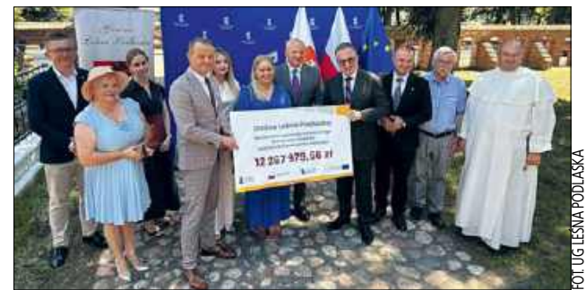
To historyczne wsparcie dla Leśnej Podlaskiej. Dzięki niemu leśniańskie sanktuarium zyska nowe otoczenie

Dodaje, że nad jego przygotowaniem pracował bardzo duży zespół osób. W realizację przedsięwzięcia zaangażowani byli zarówno pracownicy urzędu, jak i osoby pełniące wysokie funkcje, dzięki którym udało się sprawnie przeprowadzić wszystkie procedury i uzyskać niezbędne decyzje. –