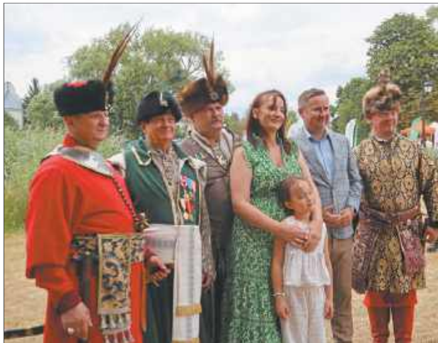
O przywołanie unikalnego, dawnego klimatu zadbał profesjonalni rekonstruktorzy historyczni