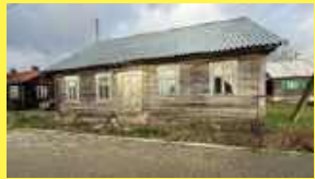
Stary dom + 2 działki = 20 arów – 130 000 zł, Rokitno, 885 851 160