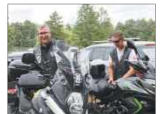
Ryk silników i pasja do dwóch kółek. Spotkanie miłośników jednośladow podczas Pikniku Motocyklowego, który był jedną z dodatkowych atrakcji tegorocznego Jarmarku Sapieżyńskiego