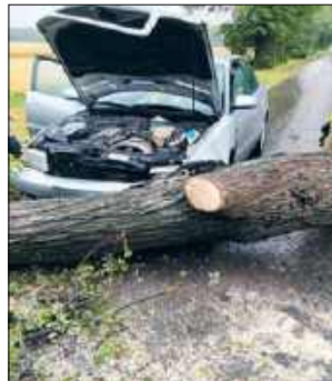
Wichura nie oszczędziła także pasa między Parczewem a Radzyniem Podlaskim, gdzie porwane przez wiatr blachy z dachów i powalone drzewa stwarzały zagrożenie na drogach

Strażacy musieli interweniować po uruchomieniu się alarmu z monitoringu w tartaku w miejscowości Lisy (gmina Biała Podlaska). Tam również uderzył piorun. W okolicach Białej Podlaskiej doszło także do dwóch pożarów wywołanych iskrzeniem uszkodzonych napo-