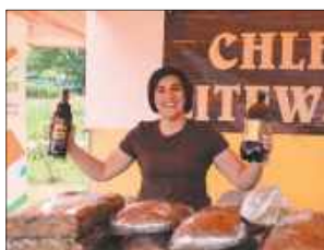
Na jarmarku można było kupić pachnący domowy chleb w różnych wariantach – od tradycyjnego żytnio-orkiszowego, przez wersje ziarniste, aż po bochenki z bakaliami.

Atrakcją okazały się oryginalne potrawy tatarskie. Uczestnicy jarmarku ustawiali się w kolejkach po chrupiące czebureki z mięsem, soczewicą, tradycyjne