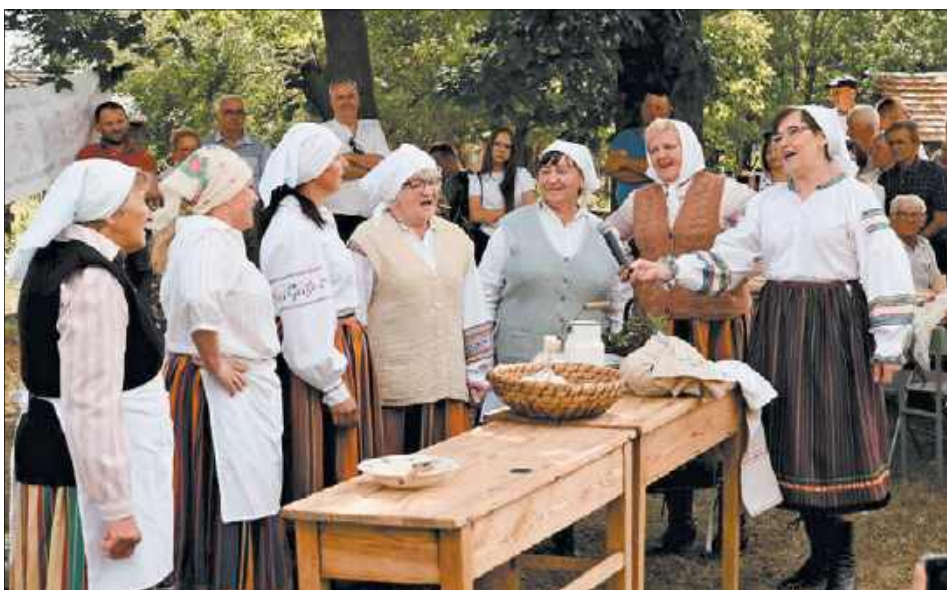
Zespół „Pawłowianki” w inscenizacji obrzędu korowajowego w Koszółkach

Czym tak właściwie jest ten obrzęd korowajowy? Najczęściej kojarzy się z tradycyjnym, wysokim, drożdżowym wypiekiem weselnym w kształcie koła, z ułożonymi na wierzchu symbolicznymi, ręcznie wyrabianymi z ciasta dekoracjami, często wzbogacany naturalnymi elementami roślinnymi