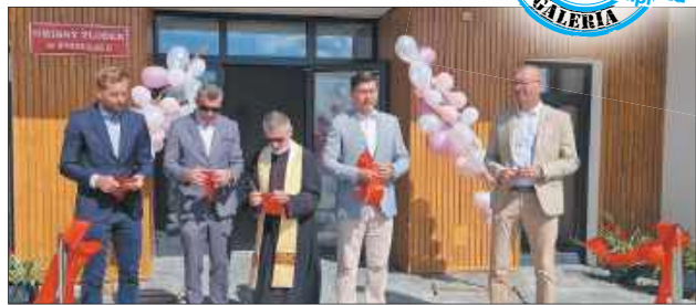
Kulminacyjnym momentem uroczystości było przecięcie wstęgi

Za realizację prac budowlanych odpowiadała firma Tres-Bud z Białej Podlaskiej, która wywizała się z powierzonych zadań, tworząc bezpieczną i kolorową przestrzeń dostosowaną do potrzeb dzieci do lat 3. Przestrzeń jest nie tylko