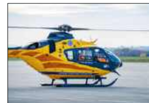
Śmigłowiec LPR przetransportował ranną nastolatkę do specjalistycznej placówki medycznej

Do dramatycznego zdarzenia doszło 28 czerwca około godziny 20:30 pomiędzy blokami 7C i 7D. Ze wstępnych ustaleń pracujących na miejscu służb wynika, że dwie dziewczynki w wieku około 13–14 lat poruszały się na hulajnogach. W pewnym momencie na-