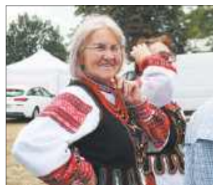
Kodeńskie błonia w niedzielę zamieniły się w wielki, tętniący życiem bazar kulturalny i kulinarny

Kodeńskie błonia w niedzielę zamieniły się w wielki, tętniący życiem bazar kulturalny i kulinarny. Swoje