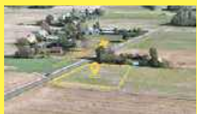
Działka 2000 m 2 z WZ w Brzostówcu k. Radzyna Podl., 885 851 158