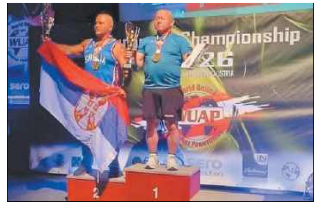
W kategorii open masters nasz siłacz nie miał sobie równych

– Startowałem w nie swojej kategorii wagowej. Byłem bliski 235 kg. Niestety błąd techniczny zdecydował o nieudanej próbie i drugim miejscu. W kategorii open masters wygrałem i od-