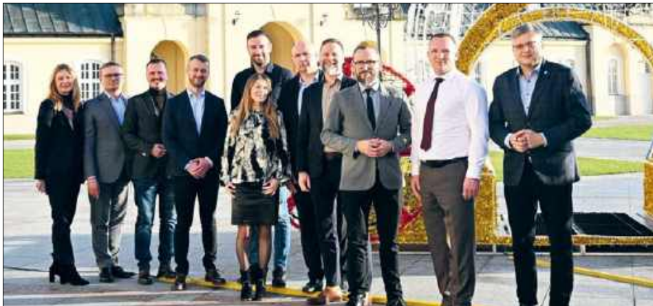
W grudniu ubiegłego roku powołano Lokalną Organizację Turystyczną „Radzyńska Kraina Serdeczności”, w której skład weszli przedstawiciele samorządów i lokalni przedsiębiorcy

Projekt „Radzyńska Kraina Serdeczności” funkcjonuje na terenie powiatu radzyńskiego od lat. W 2010 roku powiat wraz z miastem rozpoczął współpracę w ramach wspomnianego wyżej programu. Wówczas w kwietniu powiat podpisał z urzędem marszałkowskim umowę na współfinansowanie przedsięwzięcia ze środków Europejskiego Funduszu Rozwoju Regionalnego w ramach Regionalnego Programu Operacyjnego Województwa Lubelskiego na lata 2007-2013. Powiat radzyński był liderem projektu, a miasto partnerem. Miał on dopomóc w wytypowaniu markowych produktów turystycznych, wykorzystujących potencjał miasta i powiatu oraz w stworzeniu kompleksowego systemu informacji