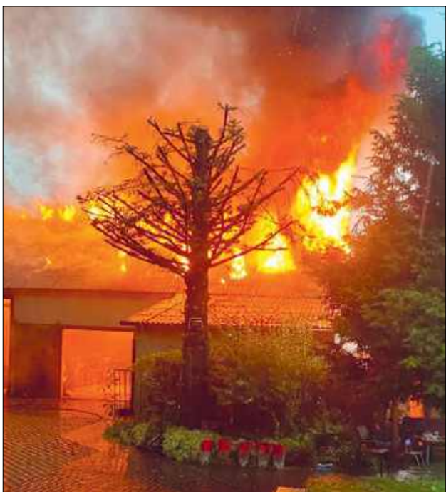
1 lipca przed godziną 18:00 w Rakowiskach rozległ się potężny huk – piorun uderzył bezpośrednio w budynek gospodarczy i wywołał pożar

Ogień błyskawicznie objął cały dach konstrukcji, a silne porywy wiatru tylko podsycaly płomienie. Deszcz, mimo że lat strumie-