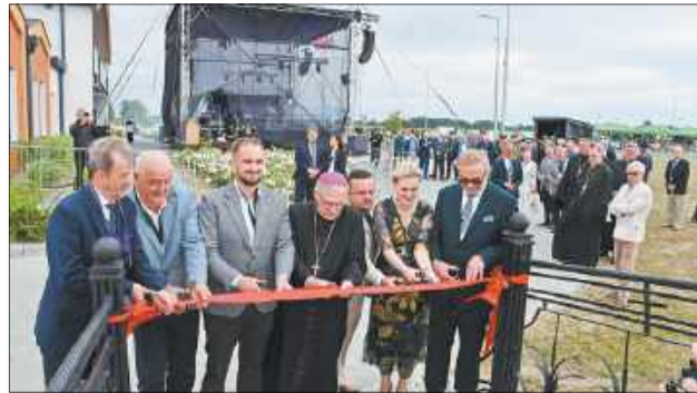
W dniu festiwalu dokonano oficjalnego otwarcia nowej siedziby Gminnego Centrum Kultury w Kobylanach