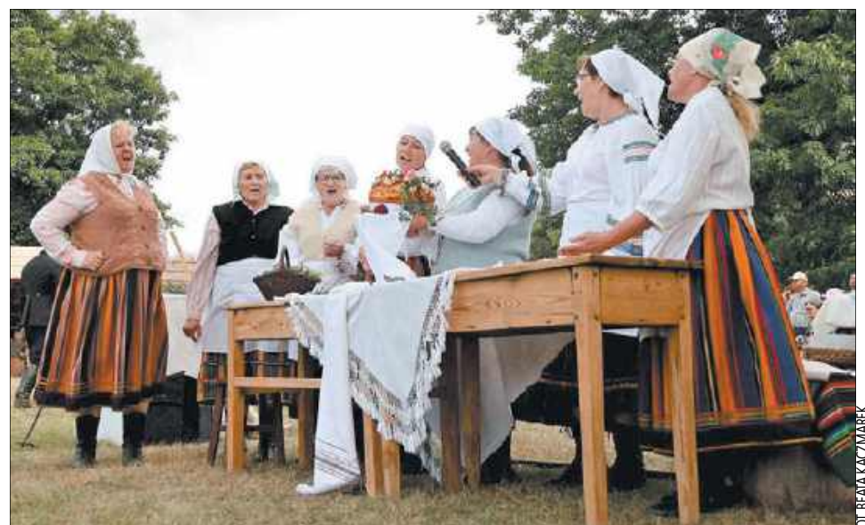
Ważnym elementem obrzędu były pieśni