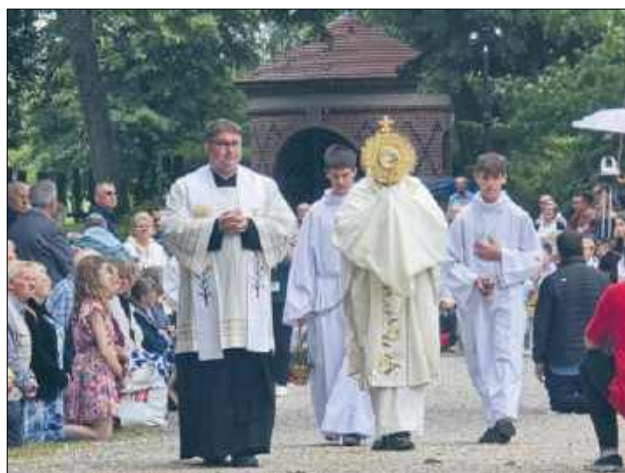
Poruszającym momentem było przyjęcie błogosławieństwa lourdzkiego