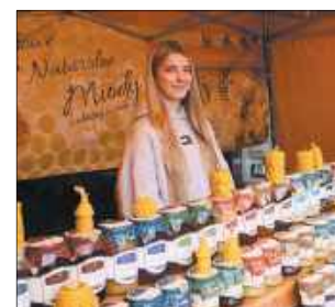
Słodkie skarby z lokalnych pasiek. Stoisko z bogatym wyborem miodów regionalnych, które cieszyło się ogromnym zainteresowaniem