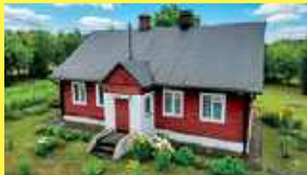
Na sprzedaż dom o powierzchni 103 m 2 położony w Białej Podlaskiej, na działkach o powierzchni 828 m 2 i 2567 m 2 , 885 851 172