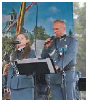
Muzyczny powrót do przeszłości. Orkiestra Reprezentacyjna Związku Piłsudczyków RP Okręgu Lubelskiego w pełnym, galowym składzie skradła serca publiczności

Idea organizacji imprezy głęboko wyrasta z dziejów Kodnia. Jarmark Sapieżyński bezpośrednio odwołuje się do roku 1511, kiedy to król Zygmunt I Stary nadał Janowi Sapieże – pierwszemu właścicielowi kodeńszczyzny