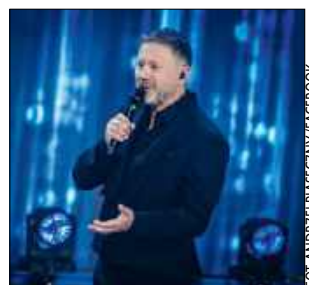
Gwiazdą Dni Międzyrzecza będzie Andrzej Piaseczny

Niedzielne wydarzenia zaplanowano nad Międzyrzeckimi Jeziorkami. O godz. 16.00 rozpocznie się Festyn Rodzinny ze strefą gastronomiczną i dmuchańcami.