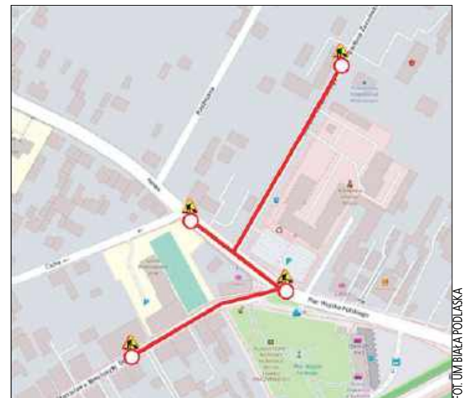
Ulice Żeromskiego, Moniuszki i Nowa od 7 lipca będą całkowicie zamknięte

Przebudowa oznacza także istotne zmiany dla osób podróżujących autobusami dalekobieżnymi. Dotychczasowy przystanek autobusów dalekobieżnych zlokalizowany przy ulicy Stefana Żeromskiego zostanie przeniesiony. Nowym miejscem odjazdów będzie przystanek tymczasowy przy ulicy Plac Wojska Polskiego. Urzednicy oraz wykonawcy prac apelują do wszystkich uczestników ruchu drogowego o wyrozumiałość, ścisłe stosowanie się do tymczasowego oznakowania