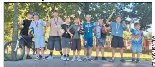
Oni najlepiej ścigali się na rowerach i hulajnogach