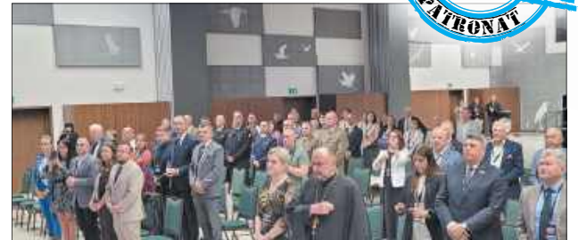
Nowa siedziba Gminnego Centrum Kultury w Kobylanach została oficjalnie otwarta podczas Festiwalu „Kultura bez Granic”. Wydarzenie połączyło uroczystość z koncertami znanych artystów i prezentacją miejsca, które ma stać się kulturalnym sercem gminy Terespol

GMINA TERESPOL Festiwal „Kultura bez Granic” był nie tylko muzycznym świętem, ale także okazją do oficjalnego otwarcia nowej siedziby Gminnego Centrum Kultury w Kobylanach. Na scenie wystąpili m.in. Andrzej Rybiński, Elektryczne Gitary i Smolasty, a mieszkańcy mogli po raz pierwszy świętować w nowoczesnym obiekcie.