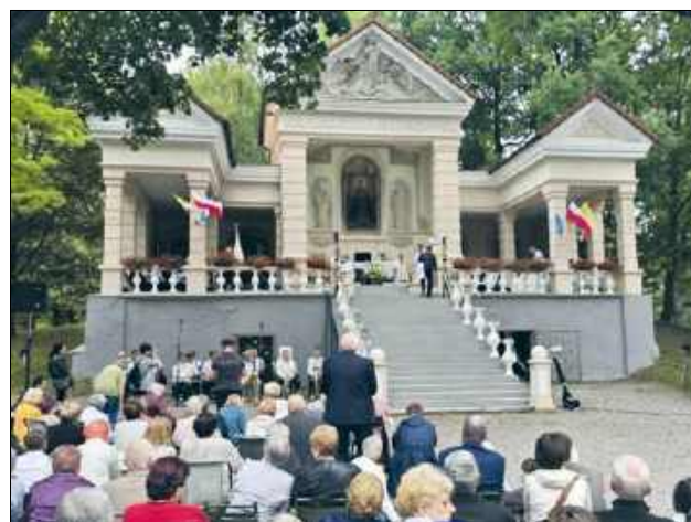
Na kodeńskiej Kalwarii zgromadziły się tłumy

Po zakończeniu mszy świętej wierni zgromadzili się na adoracji Najświęt-