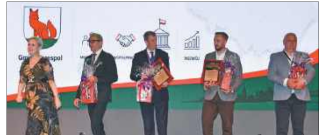
W czasie wydarzenia doceniono osoby zaangażowane w utworzenie nowej siedziby GCK, w tym wykonawców inwestycji

Podczas Festiwalu Kultury Bez Granic wydarzenia zostały przeniesione właśnie pod Gminne Centrum Kultury. Budynek wyposażono w nowoczesne rozwiązania technologiczne, takie jak gruntowe pompy ciepła, ogrzewanie podłogowe, instalację fotowoltaiczną oraz