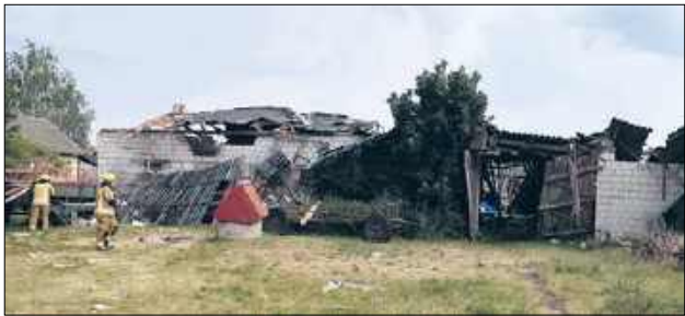
Uszkodzony budynek we wsi Główne w powiecie radzyńskim