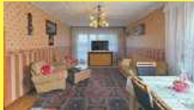
Dom położony w Białej Podlaskiej, blisko ulicy Podleśnej, powierzchnia działki 822 m 2 , powierzchnia domu 180m 2 , na działce znajduje się drugi budynek do zamieszkania lub pod działalność gospodarczą, Tel. 885 851 172.