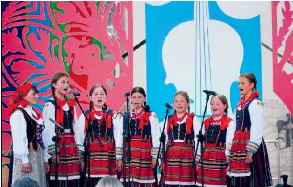
Zaledwie półtora roku działalności wystarczyło, by Drelowskie Kukaweczki stanęły na podium najważniejszego festiwalu muzyki ludowej w Polsce. Podczas konkursu w Kazimierzu Dolnym młody zespół zajął II miejsce w kategorii „mistrz i uczeń”.

– W zespole Drelowskie Kukaweczki śpiewam od około półtora roku. Najbardziej lubię występy na scenie, ponieważ możemy pokazać swoje umiejętności i śpiewać. Przed występem na festiwalu prawie się nie stresowałam. Większa trema towarzyszyła nam podczas pierwszego etapu,