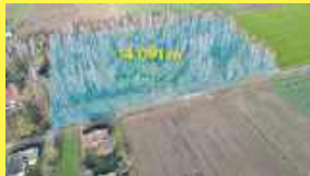
14 091 m 2 w Pokiniance, WZ na 8 domów, 885 851 160