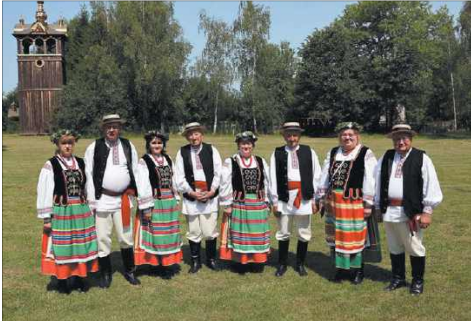
Zespół „Zielona Kalina” podczas nagrania reportażu o Weselu Podlaskim