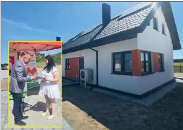
Prezes SIM Południowe Podlasie wręczył klucze do mieszkań pierwszym najemcom

CHOTYŁÓW Mieszkańcy gminy Piszczac doczekali się finału wyczekiwanej inwestycji mieszkaniowej. Przy ulicy Łąkowej w Chotyłowie oficjalnie zainaugurowano działalność nowego osiedla, wybudowanego pod szyldem SIM Południowe Podlasie. Do rąk lokatorów trafiły klucze do nowoczesnych, proekologicznych lokali, które dla wielu rodzin stanowią jedyną szansę na zdobycie własnego dachu nad głową bez konieczności wiązania się wieloletnim kredytem hipotecznym.