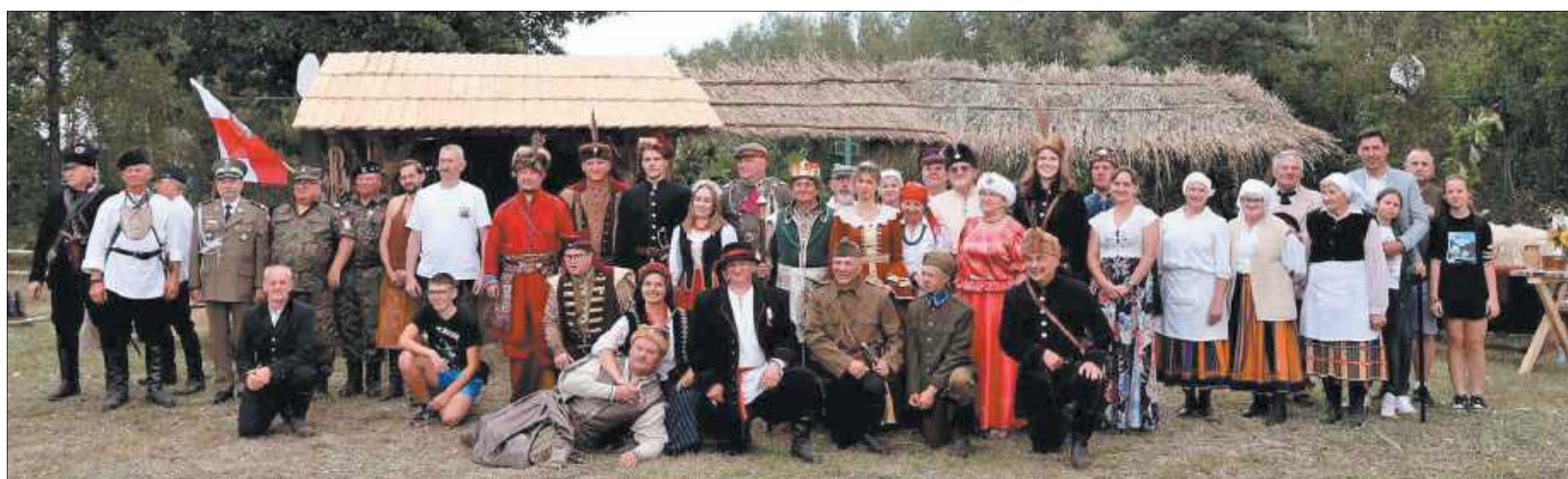
Koszółki, plenerowe widowisko „Wesele Podlaskie z obrzędem korowajowym i żywą lekcją historii”, 17.08.2025 r.