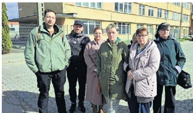
Jesteśmy zagubieni, zmanipulowani zawitym prawniczym językiem - mówili nam w piątek pracownicy Biaglassu

- Przejście części zakładu na nowego pracodawcę jest uzasadnione konsolidacją w celu sprostania konkurencji panującej na rynku - czytamy w informacji,