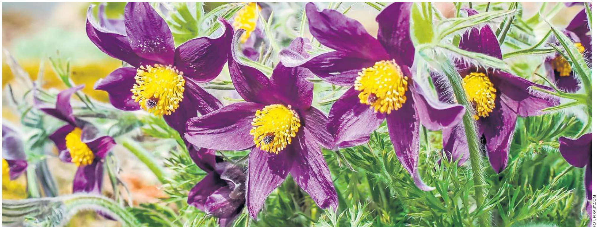
Sasanki to wyjątkowo wdzięczne wiosenne kwiaty. Mają różne kolory, najczęściej w odcieniach fioletu, różu, czerwieni. Są też białe