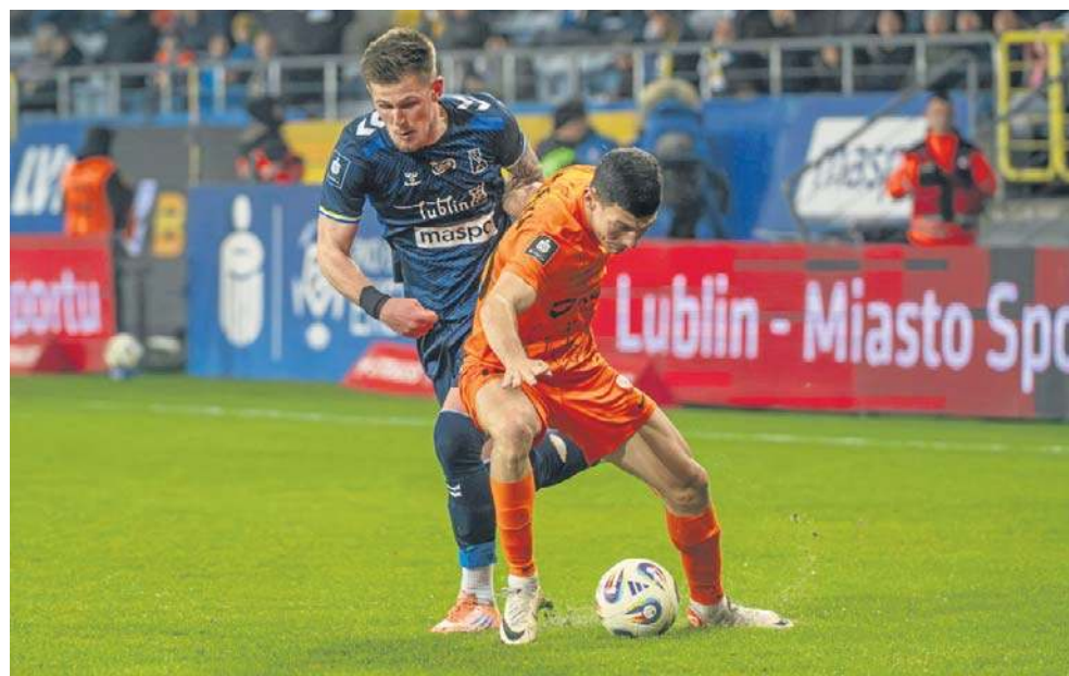
Kibice oklaskiwali zespół Motoru po wygranej nad liderującym dotąd Zagłębiem Lubin

W Motorze Lublin niezmienne wierzają za to w trenerski talent Mateusza Stolarskiego, który nie został zwolniony jesienią mimo kryzysu. W przerwie zimowej nie dostał w zasadzie żadnych