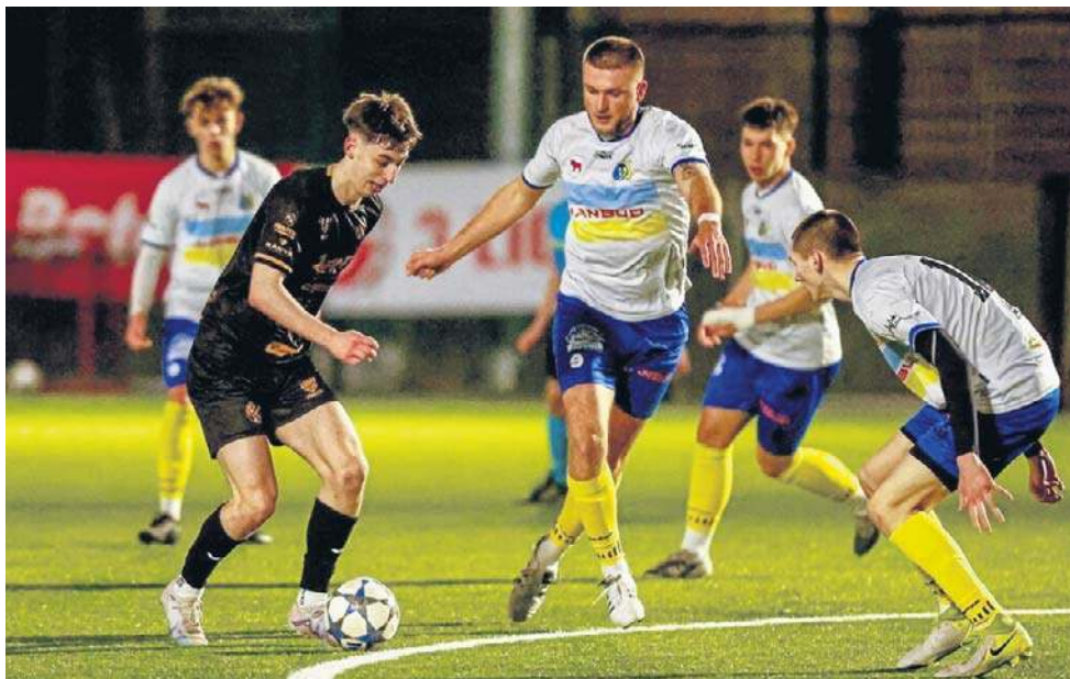
Turośnianka (ciemniejsze stroje) zremisowała 1:1 z Turem Bielsk Podlaski