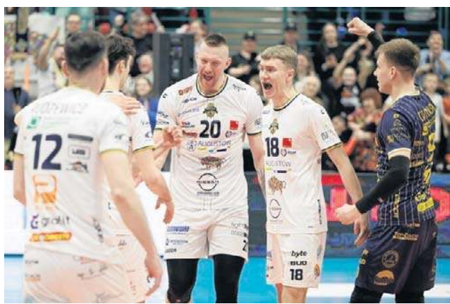
Sytuacja Necka wciąż jest bardzo trudna, ale siatkarze z Netty nie rezygnują z walki o pozostanie w I lidze