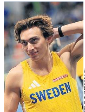
Armand Duplantis - jego rekord świata to dziś 6.31

HMS lekkoatletyce - 4x400 sztafeta mieszana: 1. Belgia 3:15.60; 2. Hiszpania 3:16.96; 3. Polska (Duszyński, Gryc, Karolewski, Święty-Ersetic) 3:17.44; 4. Holandia 3:20.14; 5. USA 3:21.35. ©️