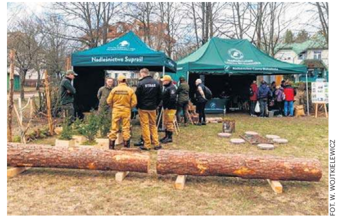
Z okazji Dnia Lasów na terenie Nadleśnictwa Dojlidy w Białymstoku odbył się m.in. piknik ekologiczny