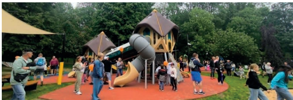
Na otwarcie placu zabaw w Parku Miejskim w Chrzanowie dzieci czekały kilka miesięcy