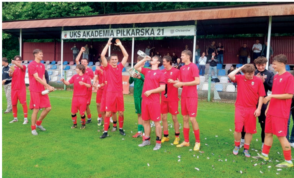
Po meczu z Byczyną polał się szampan. Więcej zdjęć i wideo można obejrzeć na przelom.pl