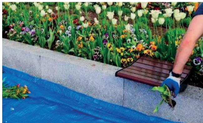
Zmiana nasadzenia kwiatów na chrzanowskim rynku. Zdjęcie przesłane przez Czytelniczkę.