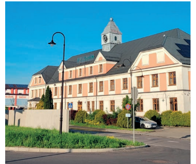
Rezydencja pod Zegarem trzebińskim ratuszem nie będzie