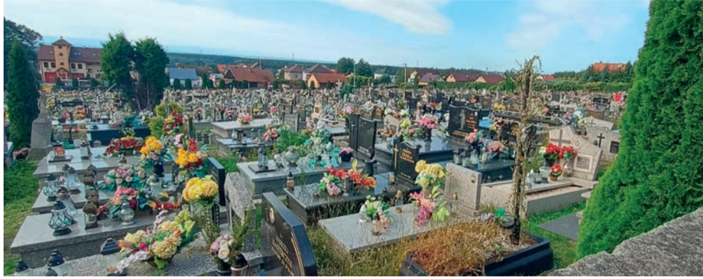
Cmentarz w Babicach

Cmentarz się zapełnia, więc potrzebą jest jego poszerzenie. Wykupiliśmy już na ten cel większość działek. Tylko jeden właściciel nie wyraził na to zgody. Przewidujemy tam choćby możliwość budowy pierwszego w naszej gminie kolumbarium, bo coraz więcej osób decydu-