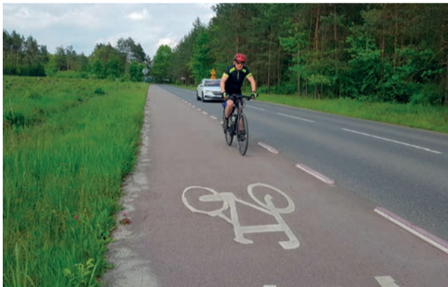
Droga rowerowa przy ul. Powstańców Styczniowych w Chrzanowie

Lokalnych dróg rowerowych przybywa, ale miłośnicy dwóch kółek liczą na znacznie więcej. Choć w ostatnich latach w powiecie chrzanowskim zrealizowano kilka ważnych inwestycji, nadal brakuje spójnej sieci połączeń między gminami.