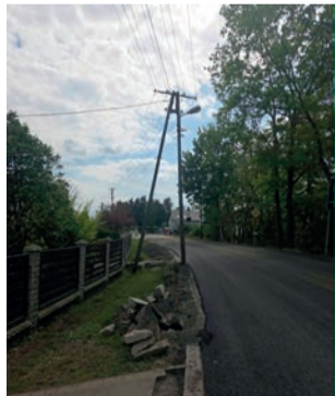
Mieszkańcy ul. Broniewskiego w Gromcu walczą o chodnik przy tej drodze na odcinku uczęszczanym przez dzieci szkolne

Mieszkańcy ul. Broniewskiego w Gromcu apelują o budowę chodnika na blisko 300-metrowym odcinku drogi powiatowej. Ich zdaniem jest on niezbędny dla bezpieczeństwa dzieci uczęszczających do szkoły, osób starszych i wszystkich pieszych korzystających z ruchliwej trasy.