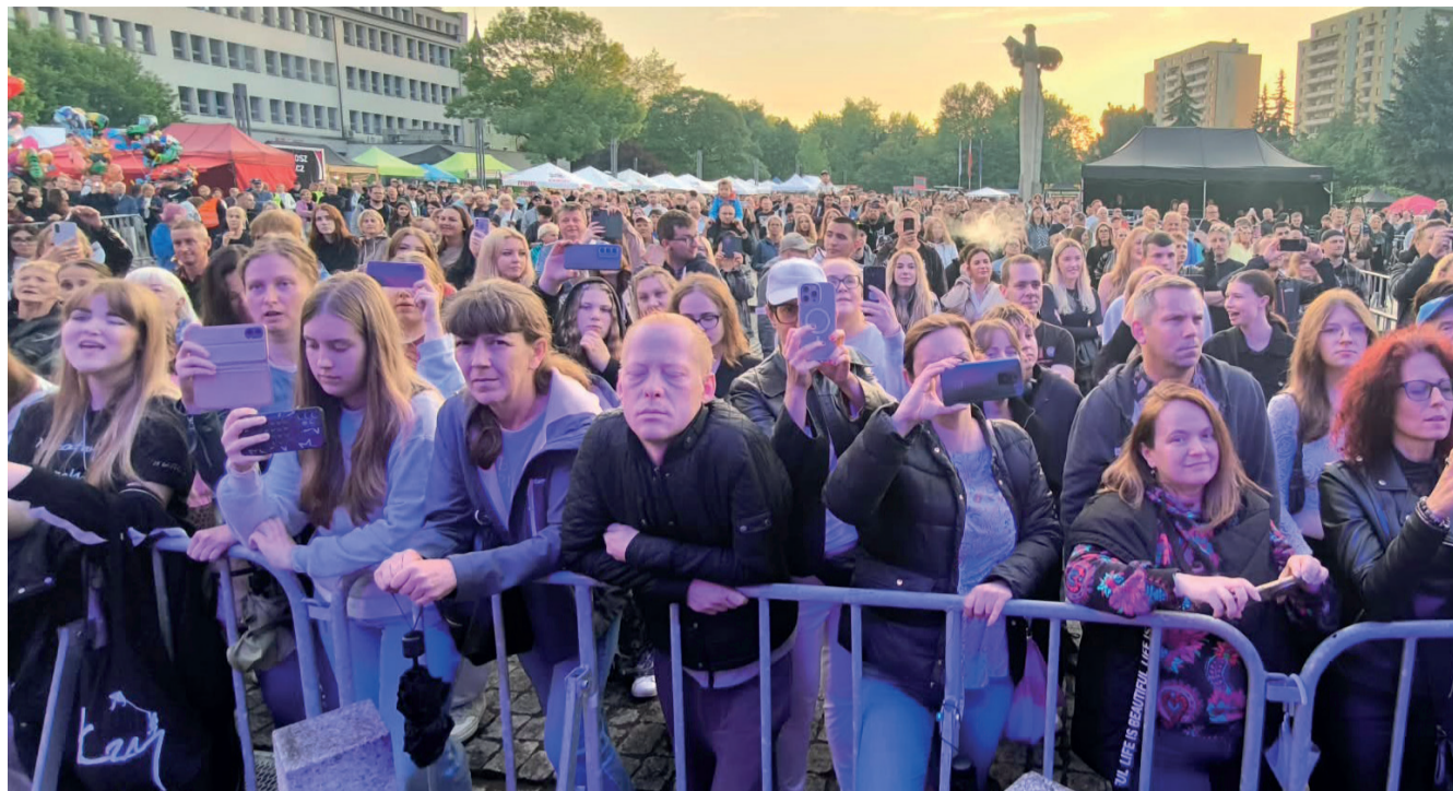
Mieszkańcy podczas koncertu zespołu Łzy. Grupa wystąpiła przed chrzanowską publicznością w sobotę 30 maja.

uwagę dostępność artystów, budżet i kwestie organizacyjne. Bywa, że chcemy zaprosić konkretną gwiazdę, a okazuje się, że ma roczną przerwę od koncertów, bo nagrywa płytę. Z trzydziestu propozycji zostaje piętnaście, potem dziesięć i dopiero wtedy dochodzimy do ostatecznych decyzji – dodaje.