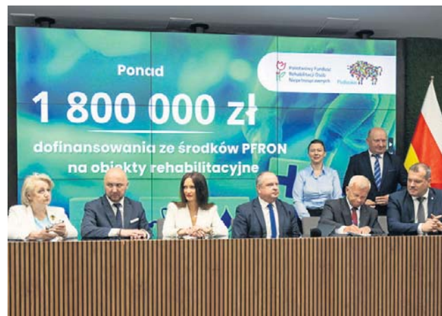
Umowy na dofinansowanie z podlaskimi samorządami zostały podpisane we wtorek w UMWP

- To środki, które realnie zmieniają codzienność mieszkańców naszego regionu. Dzięki nim publiczne szkoły, przedszkola i placówki opiekuńcze stają się bardziej dostępne, nowoczesne i przyjazne osobom z niepełnosprawnościami. Co ważne - wszystkie samorządy, które złożyły