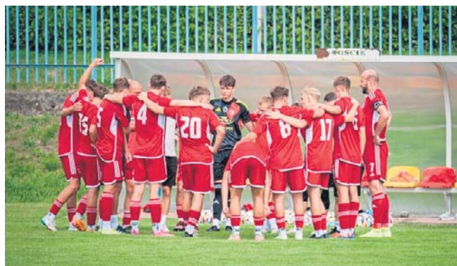
Piłkarze ŁKS II Łomża już za chwilę będą mogli radować się z awansu do IV ligi

Na dole tabeli ostatnia czwórka nie zdobyła punktów. Przegrał wspomniany już Dąb, Żubr, MKS Mielnik i Bocian.