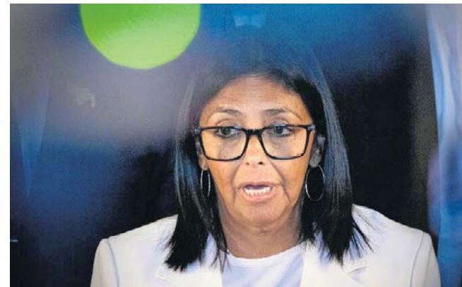
– Wenezuela nie jest kolonią, lecz wolnym krajem – powiedziała p.o. prezydenta Delcy Rodriguez

Rodriguez przemawiała w Międzynarodowym Trybunale Sprawiedliwości (MTS) w Hadze, gdzie toczy się postępowanie w sprawie sporu granicznego pomiędzy Wenezuelą a Gujaną o region Esequibo. U wybrzeży tego regionu, kontrolowanego przez Gujanę, odkryto w ostatnich latach bogate złoża ropy naftowej, a Wenezuela rości sobie do niego pretensje. PAP